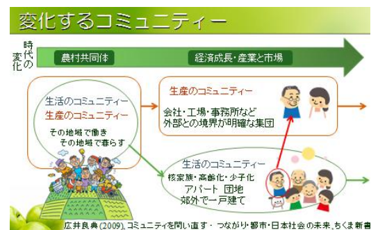
図3 変化するコミュニティ

内閣府「国民生活選好度調査(2005)」によると、60歳代からの高齢者は「見知らぬ子どもでも注意するなど道徳の指導」ならやっても構わないという方が40%~半数近くいます。また自分の子育てが落ち着いた40歳代~女性の25~30%近くは、「地域における子育て支援活動に参加」ができると答えています。地域にあるこのような資本を上手に活かす手段を、みんなで楽しみながら練り出し、いくつも地域に仕掛けていくことを通して、これからのコミュニティの発展に期待したいと思います。