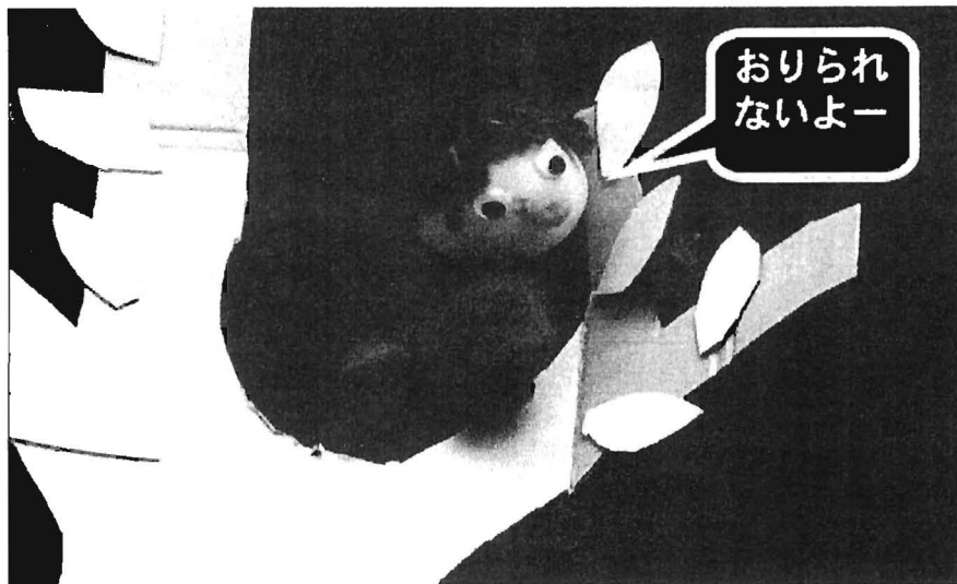
図 1：人形劇の一場面