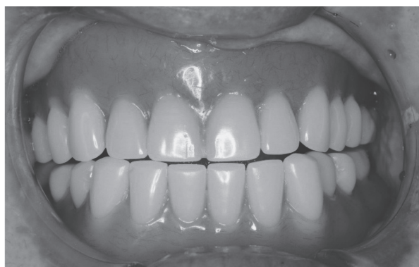
図1：義歯装着時の咬合状態(初診時)

なかった(図1)。口狭部に軽度の泡沫状唾液を認め、口腔乾燥所見を認めた。ガムテストでは4.5ml/10分(正常値10ml以上)であった。舌背全体に薄い白色の舌苔を認めたが(図2)、義歯床下粘膜やその他の粘膜に発赤腫脹などの炎症所見は認めなかった。