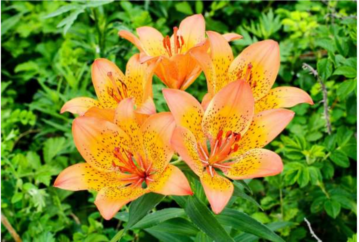
“Ezo-sukashi-yuri” Family: Liliaceae / ユリ科 ユリ属

北海道からシベリアまで広く分布する高さ1mにもなる大型の百合で、花の径は10～13cmもある。北海道低地帯の原生花園を代表する花であることや、スカシという名前が花の基部にある隙間に由来するのはよく知られている。本州に分布する別種スカシユリ (B:p.195) よりは大型で、よりあでやかな花をつけ、花柄と花被片外面に白色の毛が多いのが特徴である。カナディアンロッキーでこれとよく似た Lilium philadelphicum という種を多く見たが、花被片の先が尖っているので見分けは容易だった。それにしても、その北米種の種名がフィラデルフィアというのは理解できるが、北米には分布しないエゾスカシユリの種名がフィラデルフィアを州都とするペンシルバニア州由来というのは腑に落ちない。どうやら、原記載した研究者の勘違いらしい。◇2011.07.01 北見市、ワッカ原生花園