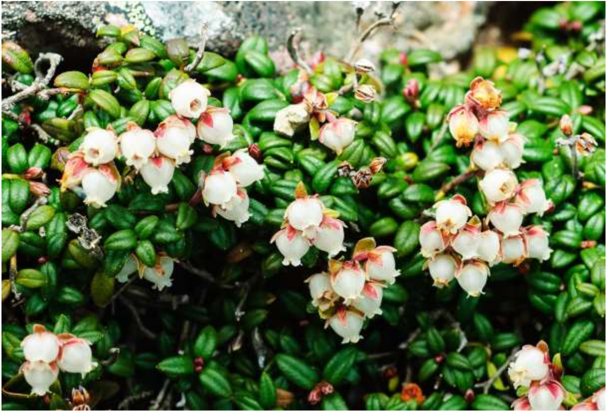
“Komeba-tsuga-zakura” Family: Ericaceae / ツツジ科 コメバツガザクラ属

ロシアの極東地方と北海道、中部以北の本州に分布する高さ5～15cmの常緑小低木で、亜高山～高山のれき地や岩場に生える1属1種の植物。楕円形の葉は小さく革質で3枚が輪生し、主脈が目立って少し裏側に巻き込む。花は長さ4～5mmの壺形で先端部が浅く5裂するが、枝先につく花の数が葉と同じように3個というのが面白い。花冠は白色主体で一部にピンク色を帯びるが、鮮やかな紫赤色の萼が良いアクセントとなっている。しかし、本州産の萼には赤味が少なく、淡緑色のものが多いようだ。コメバツガザクラは大雪山系の稜線で見ることが多いが、樽前山では駐車場から歩いてすぐの所にも沢山咲いている。しかし、花期は6月上旬と大変早く、夏山シーズンには上向きに並んだ実を見るばかりということになる。◇2006.07.02 大雪山系赤岳