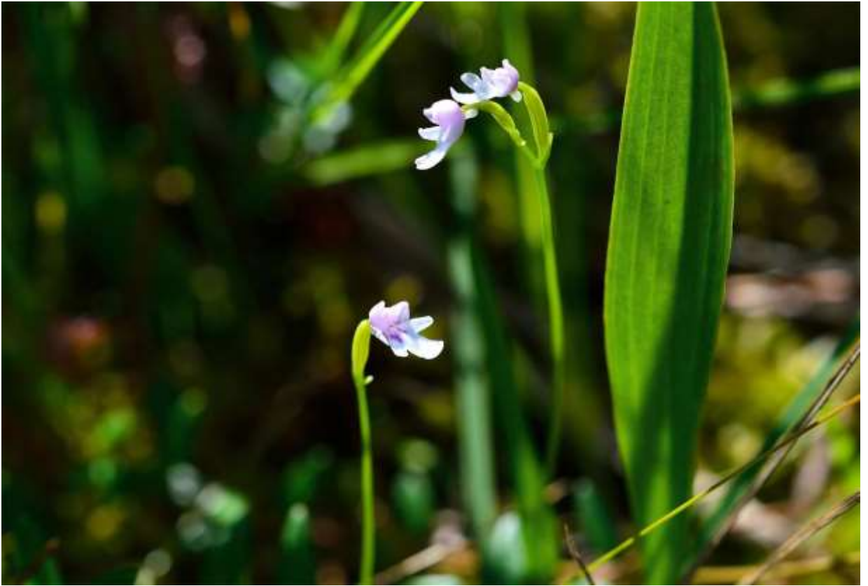
“Koani-chidori” Family: Orchidaceae / ラン科 ヒナラン属

南千島から北陸地方にかけての多雪地帯に分布する草丈10~20cmの小型のランで、高層湿原や湿った岩壁に生え、淡紅色の小さな花を2~5個咲かせる。広線形で先の尖った葉が茎の下半部に1~2枚つき、長さは4~8cm。大きな唇弁が目立つ花は長さ1cmほどで、背萼片は長さ4mmほどの楕円形、側萼片は同長で変形した卵形である。側花弁は萼片より少し短い。唇弁は長さ1cm未満で深く3裂し、基部付近に2条の紅紫色の斑紋が並走する。中央裂片の先が浅く凹むものもあるが、写真の個体にはへこみがない。コアニという名前は、最初に発見された秋田県内の地名にちなむ。同じような環境に生えて似た色の花をつけるトキシウ (B:p.207) は、数も多いし遠くからでも目立つが、小さいコアニチドリは数も少なくて見つけにくい。◇2013.07.20 豊富町、サロベツ原生花園