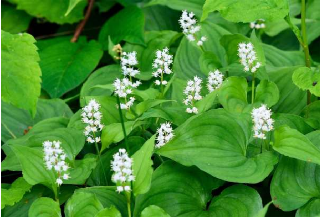
“Maizuru-sou” Family: Asparagaceae / クサスギカズラ科 マイヅルソウ属

日本各地と東北アジアから北米大陸西部まで広く分布する草丈10～25cmの多年草で、道内では低地～亜高山の林内で大きな群落を作ることが多い。茎葉は卵心形で茎の途中に2枚つき、長さは3～10cmで上の葉の方が小さく、和名の由来になった「鶴が羽を広げたよう」な葉脈が目立つ。葉の基部は深く落ち込んで全体が適度に湾曲しており、花が無くても独特の雰囲気を出し出す。初夏には小さい白花が茎の先に20個ほどつき、ブラシ状の花序となる。花の径は5～6mmと小さく4枚の花被片が反り返るため、白い雄しべばかりが目立って美しい花とはいえないが、薄暗い林下の群落で、白い花穂が一斉に立ち上がる様子は見事なものだ。マイヅルソウは本州では深山の植物だが、札幌近郊では、住宅地に近い防風林内でも大きな純群落が見られるのは喜ばしい。◇2010.06.12 千歳市