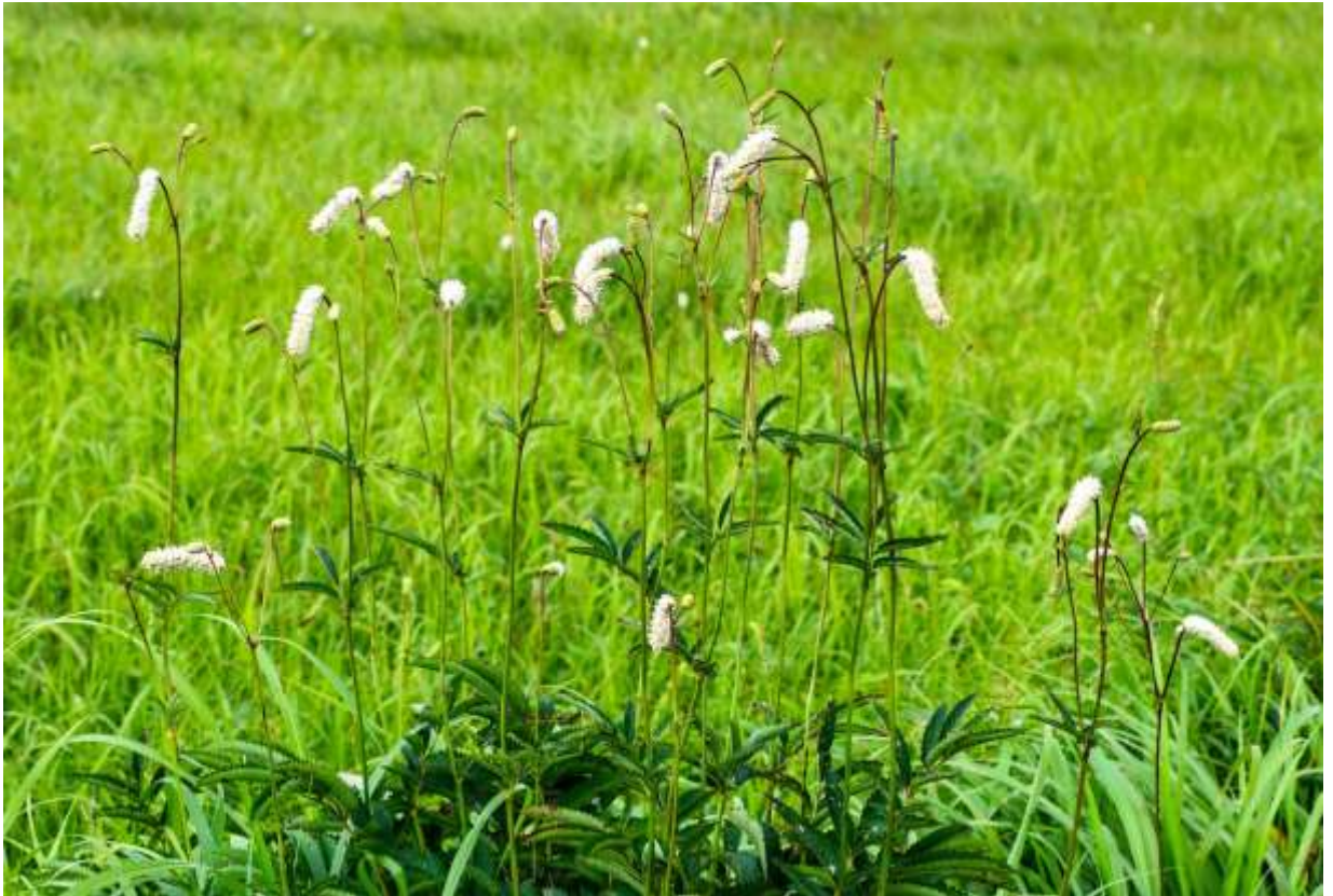
“Nagabo-no-waremokou” Family: Rosaceae / バラ科 ワレモコウ属

北海道から九州まで分布する草丈80～140cmの多年草で、低地帯～山地帯の湿った草地や湿原に生える。国外での分布域は広く、東ヨーロッパから中国や朝鮮半島にまで渡る。従来は赤花と白花を品種レベルで分けることもあったが、APG分類体系では赤花と白花は単なる変異だとして、従来のナガボノシロワレモコウとナガボノアカワレモコウはナガボノワレモコウという和名で統一された。根生葉は長い柄のある奇数羽状複葉で、長さ7～8cmの広線形の小葉が2～7対ある。道内では道端でも目にするありふれた花で、長さ2～10cmの白い円柱形花序を作る花には花弁がないこともあって、美しいと感じることはあまりない。しかし、高層湿原では草丈もほどほどで、長い花穂が風に揺れる様子を目にすると、結構風情があるなど見直すことも多い。◇2011.08.02 雨竜町、雨竜沼湿原