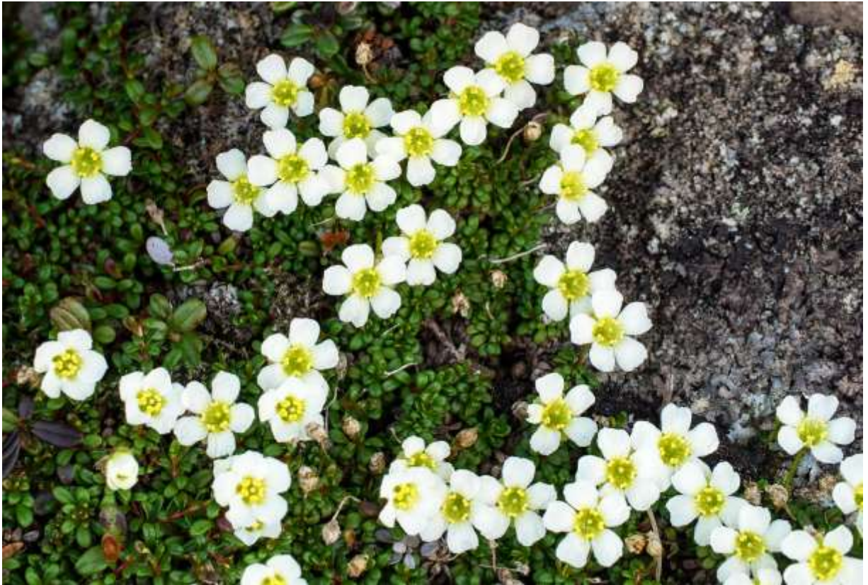
“Iwa-ume” Family: Diapensiaceae / イワウメ科 イワウメ属

日本の中部地方からアラスカまでの、亜高山～高山帯に広く分布する常緑の小低木。小さな葉がマット状にびっしりと地表を覆う様子からは、これが木本とはにわかに信じられない。稜線ではウラシマツツジ (B:p.157) に次いで早く開花し、他の高山植物が花をつける頃には花期が終わっているのが普通である。植物全体の大きさと比べて大きな1.5cmほどの純白の花を上向きに咲かせ、花の盛りにはよく目立つ。赤い花柄と環状に並んだ5つの黄色い葯も、ダンディな印象を与える。本州の山では名前の通り岩場に張り付いていることが多いが、大雪山の稜線では砂礫地を覆って一面に白いカーペットを敷き詰めたようになり、さすがに北海道の山だなと感心させられる。ベニバナイワウメと呼ばれる淡紅色の花もあり、大雪山では赤岳で局所的に観察できる。◇2017.07.07 大雪山系黒岳