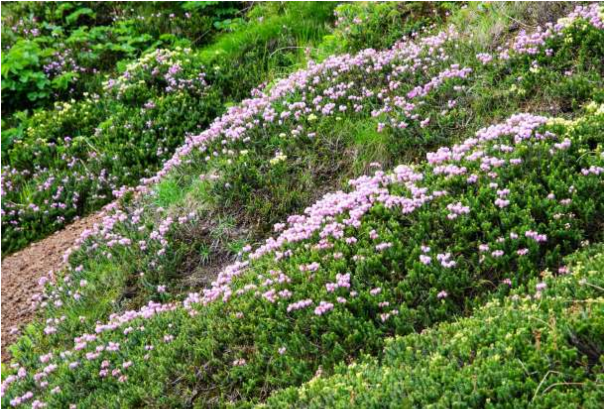
“Ko-ezo-tsuga-zakura” Family: Ericaceae / ツツジ科 ツガザクラ属

高さ10-30cmの常緑性小低木で、道内の高山で大きな群落を作る。これは、自然状態で生まれたエゾノツガザクラとアオノツガザクラ（前頁）の雑種で、花冠が丸くて鮮やかなピンク色を呈するものの総称である。道内の高山には花冠の形と色調の異なる多様な雑種株が自生しており、いろんな名前と呼ばれているが、コエゾツガザクラとされるものが圧倒的に多い。その特長としては、膨らんだ花冠と花柄に生える繊毛がエゾノツガザクラより少ないことだという。また、花色も濃紅紫色のエゾノツガザクラよりは淡い色合いを示す。大雪山で見かけるのは殆どがこの雑種であり、純粹のエゾノツガザクラと思えるものは極めて数が少ない。この花がカーペットを敷き詰めたように展開する様子は実に見事で、大雪山の夏山を代表する原風景である。◇2008.07.20 大雪山系黒岳