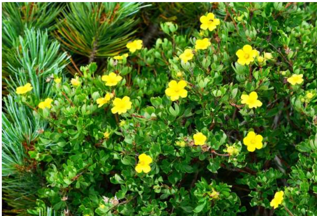
“Kinro-bai” Family: Rosaceae / バラ科 キンロバイ属

ヒマラヤを含む東北アジアの高山～亜高山帯の岩礫地に生える高さ1mほどの落葉小低木で、よく枝分かれして整った樹形となる。国内では北海道、東北地方、南アルプス、四国などの限られた高山に生えるが、地質としては蛇紋岩地帯や石灰岩地に多いようだ。葉は長さ1～2cmの細長い小葉3～5枚からなる少し厚みのある複葉で、沢山の葉が密生して格好の良い樹形を魅力的に飾る。花は径2～2.5cmの黄色い5弁花だが、アポイ岳に生えるものには4弁の花も多い。花弁の先は丸く、花の中心部では花弁の隙間が開いて美しい模様を作り出す。蕾の数は多いのだが花は時間差をつけて少しずつ開花し、茂み全体が花一面と言うことにはならない。おかげさまで、いつ見てもきれいな花がほどよい具合に咲いているという感じである。◇2011.08.04 様似町、アポイ岳