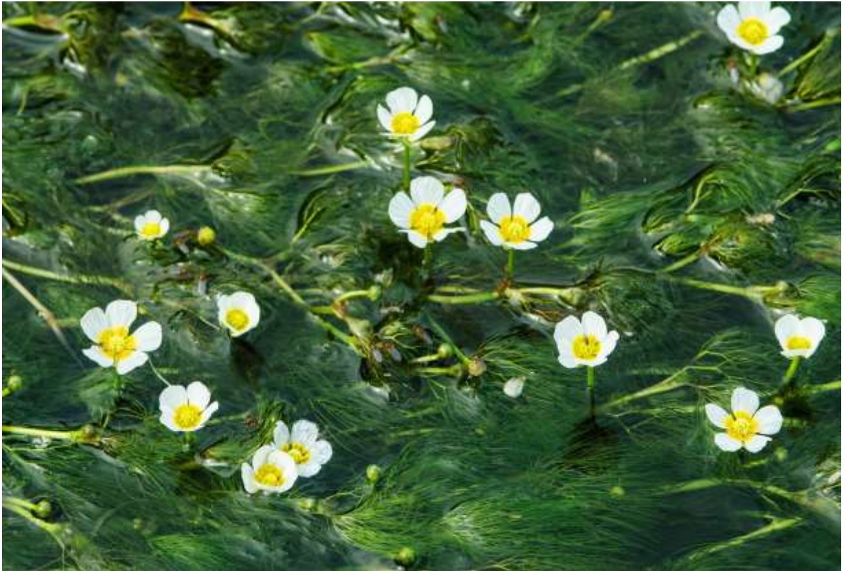
“Baika-mo” Family: Ranunculaceae / キンポウゲ科 キンポウゲ

中部地方以北の本州と北海道の流水中や湖沼に生える日本固有の多年草で、茎の長さは2m以上になる。浮葉を持つイチョウバイカモの変種で、浮葉はない。沈水葉は互生し、長さ2～6cmの葉身は細かく裂けて糸状になる。花は葉脇から伸びた花柄の先につき、白色の5弁花で径は5～15mmほど、花弁の基部を含めて花の中心部は蜜標となる鮮やかな黄色を呈する。普通は水上で開花するが、水没したまま咲いているものも多い。このため水中花とも呼ばれ、バイカモという和名よりもこの呼び名の方が広く知れ渡っている。水中花のままでも結実するらしいが、水上で開花する花には昆虫が集まる。道内には小型の花（径5～7mm）を咲かせる別種チトセバイカモがあるが、バイカモと同じような場所に生えており、河岸からの観察で両者を見分けるのは難しい。◇2012.08.04 恵庭市、茂漁川