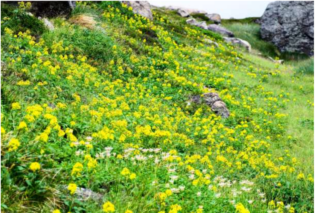
“Miyama-aki-no-kirin-sou” Family: Asteraceae /キク科 アキノキリンソウ属

東北アジアの寒冷地に生える多年草で、国内では北海道から九州までの亜高山帯～高山帯に生え、コガネギクとも呼ばれる。これは、里山に多いアキノキリンソウの高山型だが、しっかりとした造りで頭花がかたまって付くのが特徴である。高山植物としては特に美しい花ではないが、夏の花が終わりかかった時期に、黄色い頭花が纏まって咲くためよく目立つ。多様な環境に生えているため生育環境によって変異が大きく、草丈は10～60cmとばらつくし、散房状に集まる頭花の径も1.2～1.5cmとばらつく。秋の野山には黄色い花をつける地味なキク科植物が多いが、高山に咲くものは少ないので、ミヤマアキノキリンソウはもてはやされる花の一つである。和名のキリンソウは、この花が春に咲くベンケイソウ科キリンソウに似ていることに由来する。◇2012.08.30 大雪山裾合平