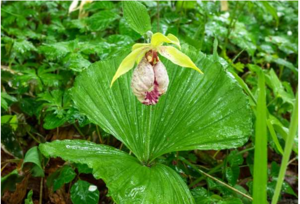
“Kumagai-sou” Family: Orchidaceae / ラン科 アツモリソウ属

北海道西部以南の日本列島と中国東部や朝鮮半島に分布する草丈30～40cmの多年草。茎先に少数の花をつけるランは華麗であるが、アツモリソウ属の花は特に色と形が良く、国内に自生する6種は山野草愛好家に狙われて自然状態のものを見つけるのが難しい。しかし、このクマガイソウだけは自生地がわずかに残っており、一般市民でもなんとか観察できるというのが現状だ。保護されている自生地では大きな群落となる所もある。円形の大きな葉が2枚対生する上に、径8～10cmの大きな花が咲く姿はとても品がある。しかし、正面が凹んだ袋状で赤みのある模様が入る花の風貌は、美しいというよりは雰囲気があるという方が正しいだろう。北米にはピンクの唇弁が縦に切れ込んだ別種 ( C. acaule ) があるが、独特の風貌はクマガイソウと共通する。◇2019.05.29 新冠町