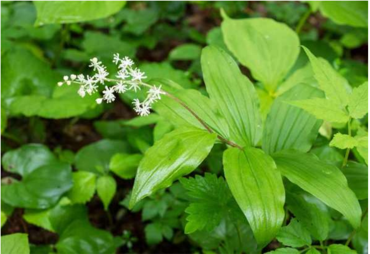
“Yuki-zasa” Family: Asparagaceae / クサスギカズラ科 マイズルソウ属

日本全土と朝鮮半島から極東ロシアまで分布する草丈20～70cmの多年草で、山地の林内や溪流沿いに生える。笹に似るとされる葉は茎の上半部に互生し、長さは6～15cmで裏面に細毛が生える。縁が波打って線状葉脈が目立つ葉は、ホトトギスの仲間のようで美しいが、それよりは薄くて柔らかい。茎の先に円錐花序を出して白くて小さい花を多数つけ、茎と花序には細毛がある。個別の花は地味な造りだが、水平に展開する葉と円錐花序の様子はなかなか趣がある。ユキザサは道内ではアズキナと呼ばれる有名な山菜で、毎春若芽が摘み取られて、札幌や千歳周辺の山林には小さい株しかなくなってしまった。採取が禁じられている北大植物園の自生株を見ると、ユキザサ本来の大きさと茎の太さに驚かされる。◇2017.06.05 新冠町