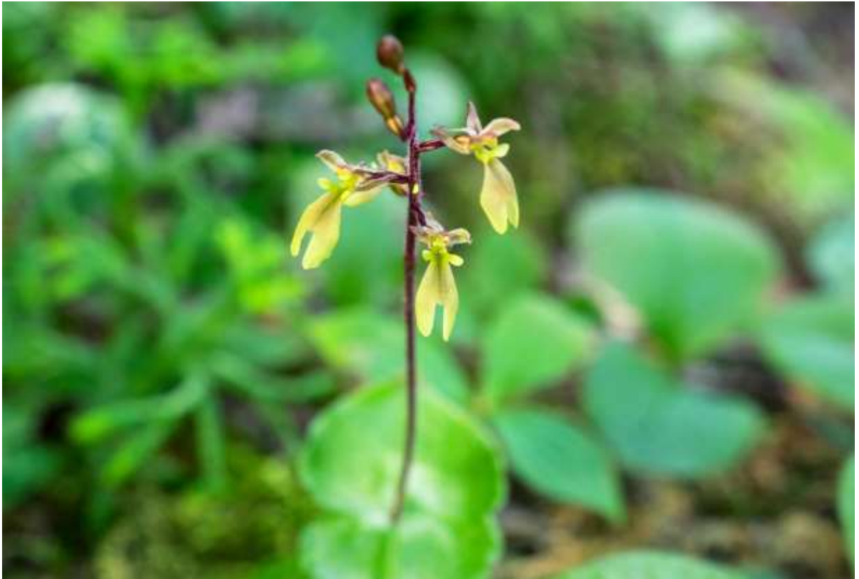
“Miyama-futaba-ran” Family: Orchidaceae / ラン科 サカネラン属

日本全土と朝鮮半島から極東ロシアにかけての北東アジアに分布する草丈10~25cmの多年草で、亜高山帯の針葉樹林下に生える。茎は直立し、下部に濃緑色の葉が2枚対生する。葉は先の尖った広心形で光沢があり、幅と長さは共に10~25mm。茎の上部に緑褐色の花を3~10個まばらにつける。萼片は長さ3~4mmの披針形で後ろに強く反り返る。側花弁は長楕円形で萼片と同じ長さ。唇弁は長さ6mmほどで、基部に耳状の小さな突起があって先は2中裂する。裂片は楕円形で先は丸く、萼片や側花弁よりも明るい色調だ。日本にはフタバランの仲間が5種あり、葉がユニークなので下草の少ない林下では目立つ。しかし、撮影地は登山道脇の明るい所だったので草が多く、事前情報がなかったら、何本も生えていたこの花には気づかなかったかもしれない。◇2018.07.26 鹿追町、東ヌプカシヌプリ