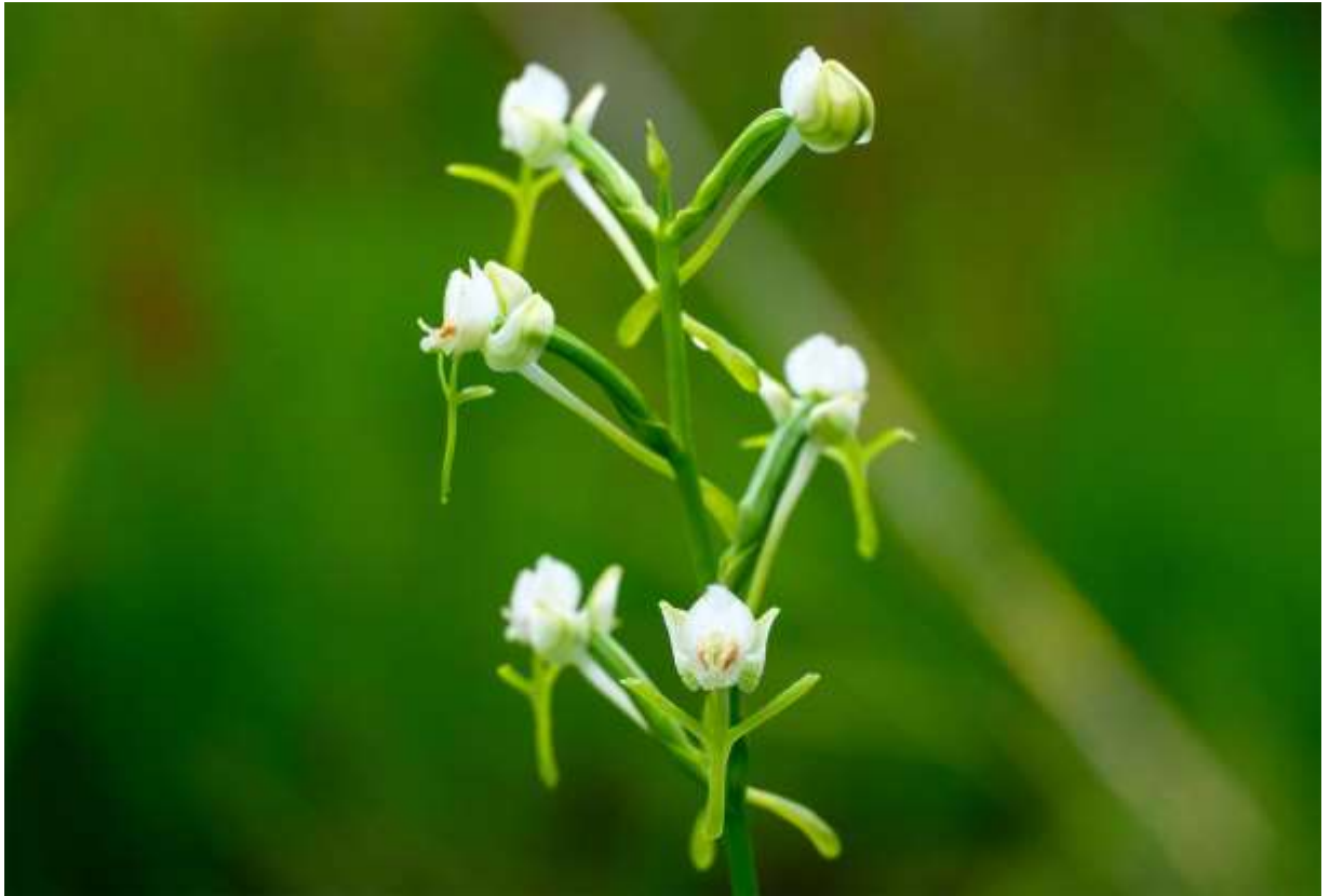
“Mizu-tonbo” Family: Orchidaceae / ラン科 ミズトンボ属

日本全国と中国大陸に分布する草丈40～70cmの多年草で、湿地に生える。葉は茎下部に数枚つき、長さ5～20cmの線形で先が尖る。茎の上部に径8～10mmの花を10～20個ほど総状につける。背萼片と側花弁は白く、集まって兜状となる。側萼片は白色～淡緑色の半切腎形で横に張り出すとされるが、写真の花では上方に尖った耳のように見える。唇弁は淡黄緑色で長さ2cmほど、十字形に裂けて左右の裂片は斜上する。距は長さ2.5cmで淡黄緑色、後方に突き出して先は急に膨らむ。花を正面から見ると、2つの淡褐色の細長い葯室が目立つ。萼片と側花弁が小さくまとまり、唇弁が緑がかった線形なので遠目には目立たない花である。しかし近寄って見れば、十字架状の唇弁に耳形の側萼片、さらには淡褐色の葯室と、悪魔を連想させる何とも変わった面白い花だと分かる。◇2017.08.11 苫小牧市