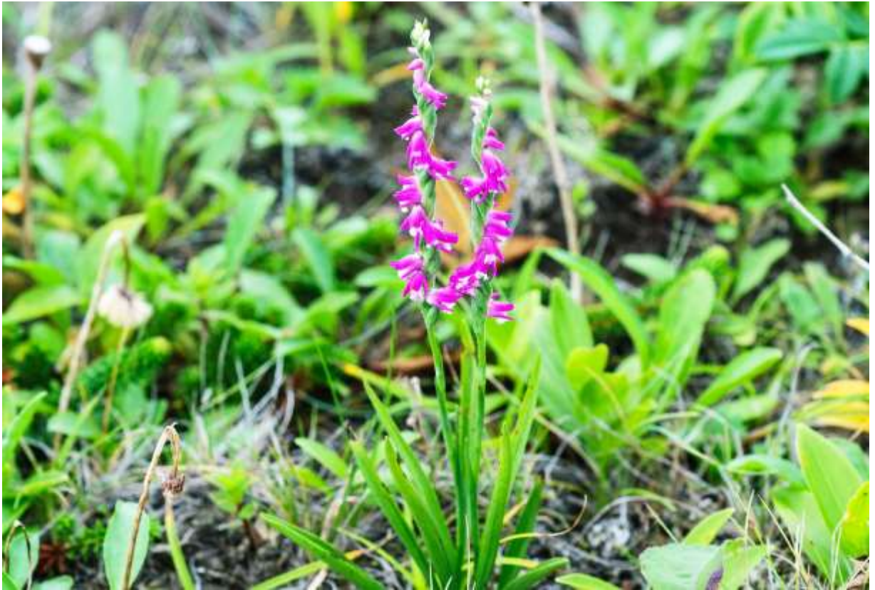
“Neji-bana” Family: Orchidaceae / ラン科 ネジバナ属

日本全土を含む東アジアの亜寒帯～温帯に分布する多年草で、日当たりのよい草地に生えて草丈は10～40cmほど。広線形の根生葉は厚みがあって柔らかく、長さは5～20cmで斜めに立ち上がる。茎の上部に径4～5mmの小さい花が沢山つき、長さ5～15cmの螺旋状にねじれた総状花序となる。螺旋の向きは右まきと左まきがほぼ同率だというが、写真の株では左側の花穂が右巻きで、右側の花穂が左巻きだ。また、花がねじれずにまっすぐ一列に並ぶものも時々見うける。花は唇弁が白色でがく片と側花弁は淡紅色だが、色の薄いものも多いし、全体が白色のものも時々見られる。この花は日本のランの仲間でも最小の部類だが、鮮やかな色なので目につくし、住宅地の芝生の中などにも生えているので、最も目にする機会の多い野生ランであろう。◇2008.08.10 えりも町、襟裳岬