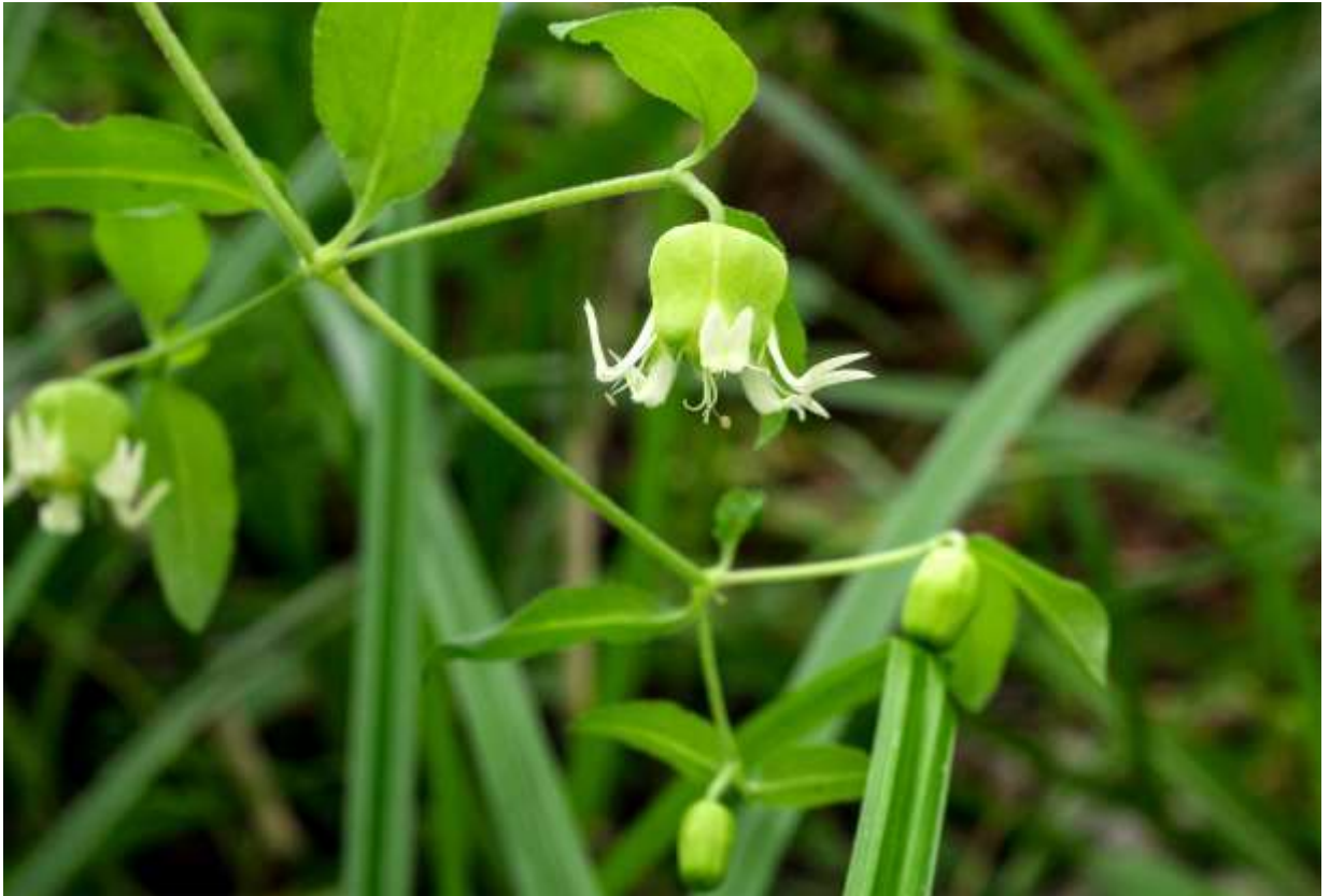
“Nanban-hakobe” Family: Caryophyllaceae / ナデシコ科 マンテマ属

日本全土を含む東北アジアに広く分布し、低地と山地帯の草むらや林縁に生えるつる性の多年草。茎は他の植物に寄りかかって長さ1.5m以上にまで伸び、所々で分岐する。葉は対生し、長さ2～5cmの広披針形で短い柄があり、全縁で先は尖る。花は枝先に1個つきやや下向きに咲く。萼は緑色で半球形に膨らみ、長さは10～12mm。先は5中裂して、裂片の先は尖る。花弁は白色で5枚あり、長さは1.5cmほど。先は2裂して、くさび形の裂片は外側に反り返る。これは余り目立たない花だが、よく見ると他に類を見ないほど面白い格好をしている。マンテマ属には膨れた萼を持つ種は珍しくないが、基部が平たい壺のような萼は異色だし、内側に折れ込んだ萼裂片の間から伸びる花弁の裂片が、急角度で折れ曲がる様子も独特である。◇2019.07.15 札幌市、平岡水源地