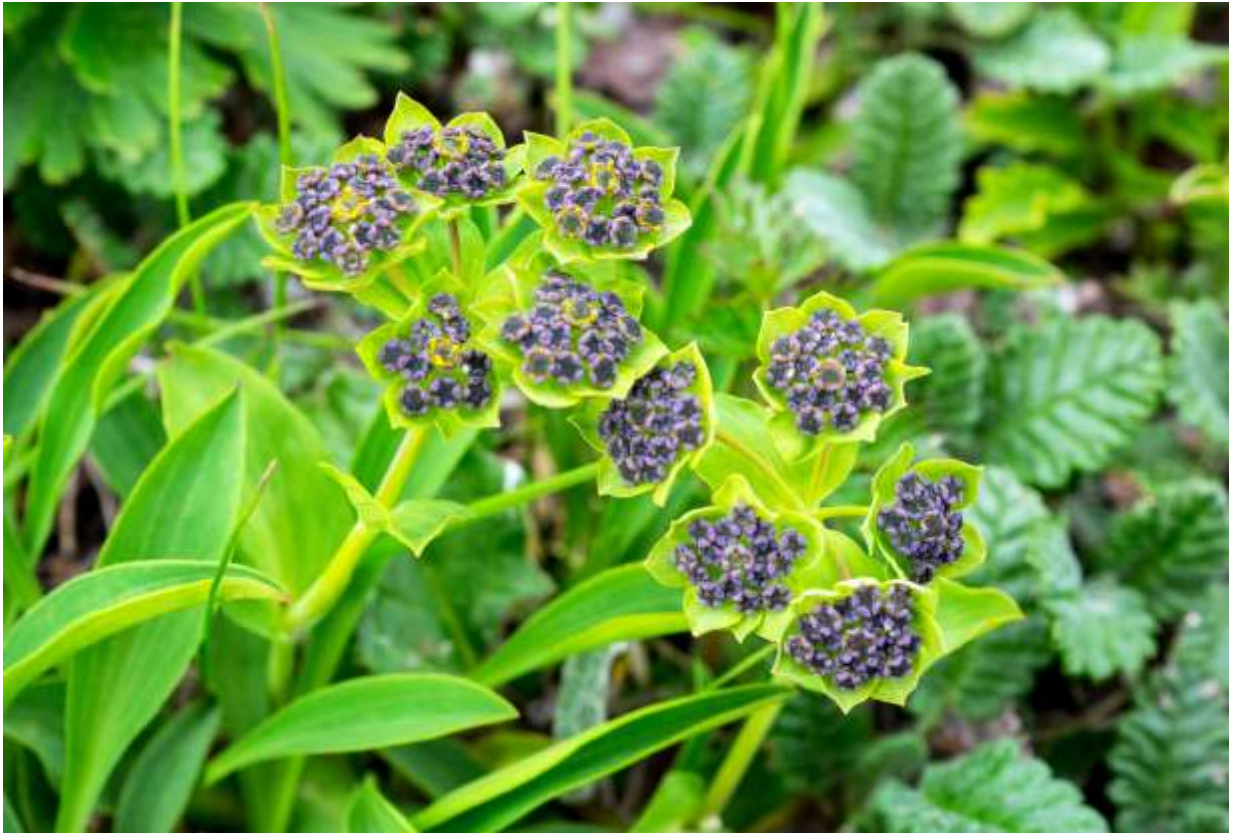
“Rebun-saiko” Family: Apiacea / セリ科 ホタルサイコ属

北海道の亜高山～高山帯の限られた所に分布する多年草で、礫地や草地に生えて草丈は5～15cm。絶滅危惧IB類に区分されており、国外では極東ロシアに広く分布する。根生葉はへら形で基部は細まる。茎葉は広披針形で長さは1～10cmと変化する。茎は3～5本に分岐し、その先端に複散形花序を作る。花序の基部にある総苞片は1～3個で卵形～楕円形。長い花柄の先につく散形花序は1～5個あり、10数個の小さな花が5個の小総苞に囲まれて独特の形態である。大雪山では小群落を作っているが、黄色の花をつけた株と黒紫色の花をつけた株があり、その中間的なものもあって、どういう関係なのか混乱する。黄色い花の方は後に茶褐色に変わるらしい。しかし、花の美しさという点から見れば、写真に示す黒紫色の花の方がダントツに優れている。◇2018.07.25 大雪山小泉岳