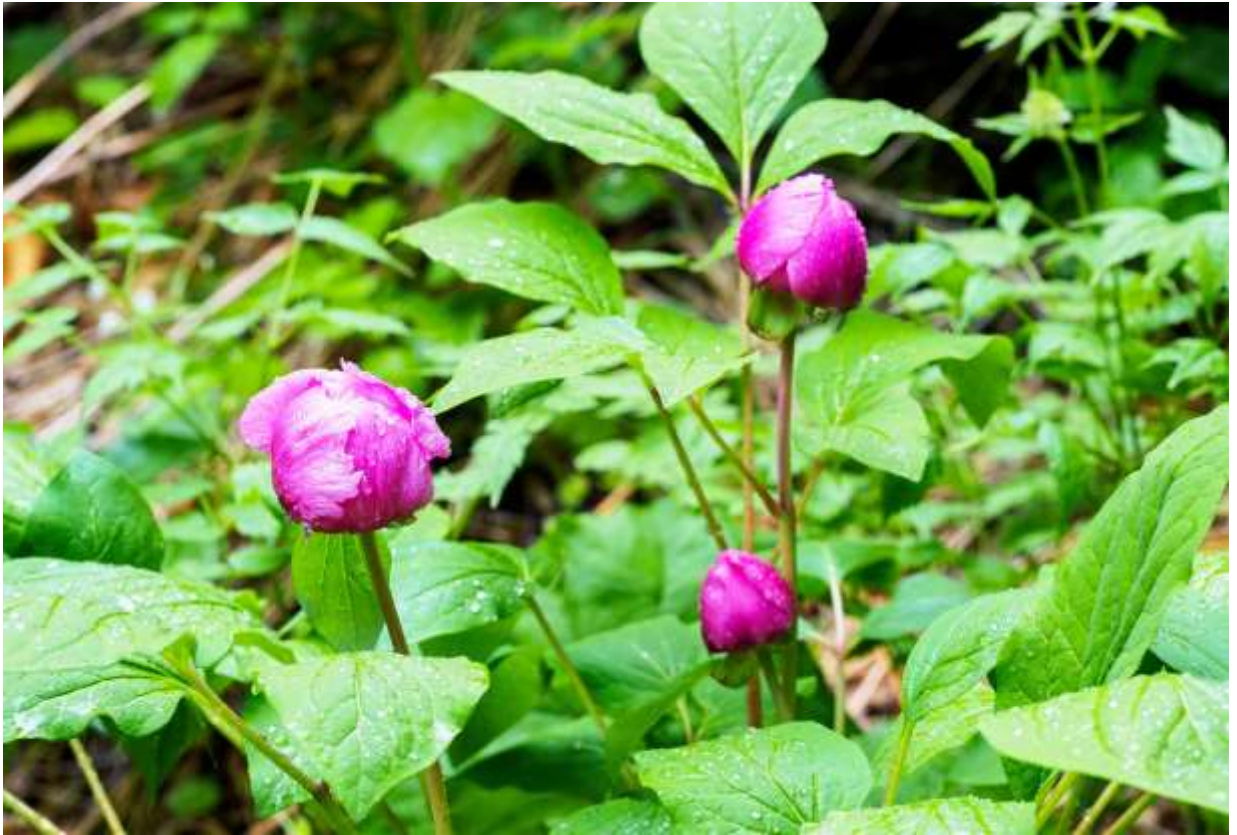
“Benibana-yama-shakuyaku” Family: Paeoniaceae / ボタン科 ボタン属

日本全国を含む東北アジアに広く分布する草丈30～60cmの多年草で、低地帯～亜高山帯の林内に生える。互生する葉は全縁の3出複葉で大きく、小葉だけでも長さ10cm以上になる。花は茎頂に1個つき、紅色～淡紅色で径は4～5cmと大きい。花弁は5枚で、内部が見える程度までには開くが、全開することなく散る。柱頭はえんじ色で渦巻いているのが本種の特徴だ。本種は北海道には比較的多いが、全国的には日本固有種の子ヤマシャクヤク(B:p.72)よりは数が少ない。野草とは思えないほどの花の美しさ故に、今では盗掘されて数が減ってしまった。私が山形在住の頃は、自宅の裏山に相当規模の自生地があったが、今は消えてしまった。本種は毒草で、宮城県の離島である金華山では、シカに他の植物が食われた結果として、奇形の花を咲かせる群落が見られるという。◇2017.05.31 置戸町