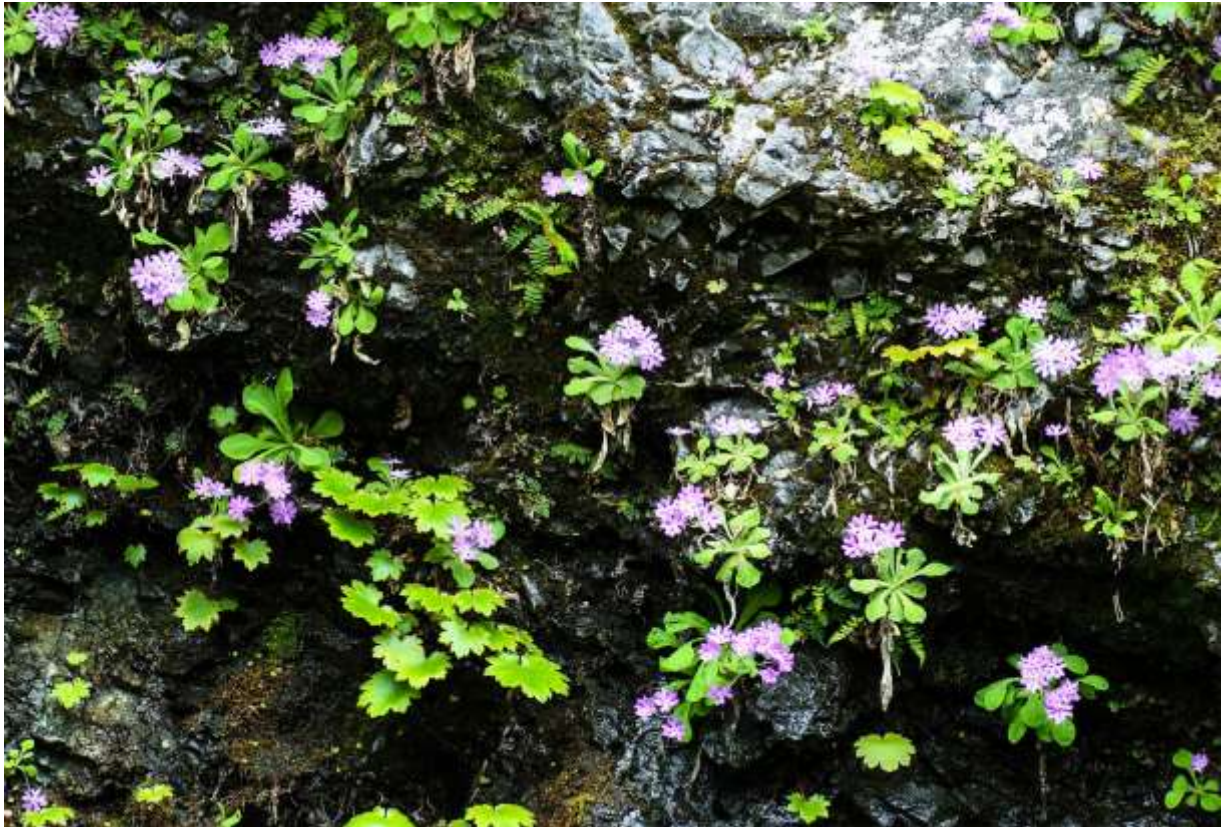
“Sorachi-ko-zakura” Family: Primulaceae / サクラソウ科 サクラソウ属

北海道に固有の美しいサクラソウで、湿り気のある岩場に群れて咲き、草丈は3～10cmと小さい。空知川で最初に見つかったのがこの名が付いたというが、実際には空知地方には少なく、日高地方の山地の沢沿いの崖に多く生える。コザクラと呼ばれる種類はどれも似通った花を付けるが、ソラチコザクラの花は径1.5cmほどで、花冠は5深裂し、裂片の先端の切れ込みが広角度で格好良い。しかし、葉の方はやや興ざめだ。長さ1～3cmの狭卵形の葉は光沢がなくてざらつくし、枯れた昨年の葉が根元にへばりついているのもうれしくない。とは言ってみたものの、他の花が全く見られない深山の濡れた岩場で、この花があたりを独占して咲き誇っているのを見ると、これはもう北海道でも最高クラスの花景色であろう。◇2011.05.17 浦河町、元浦川上流