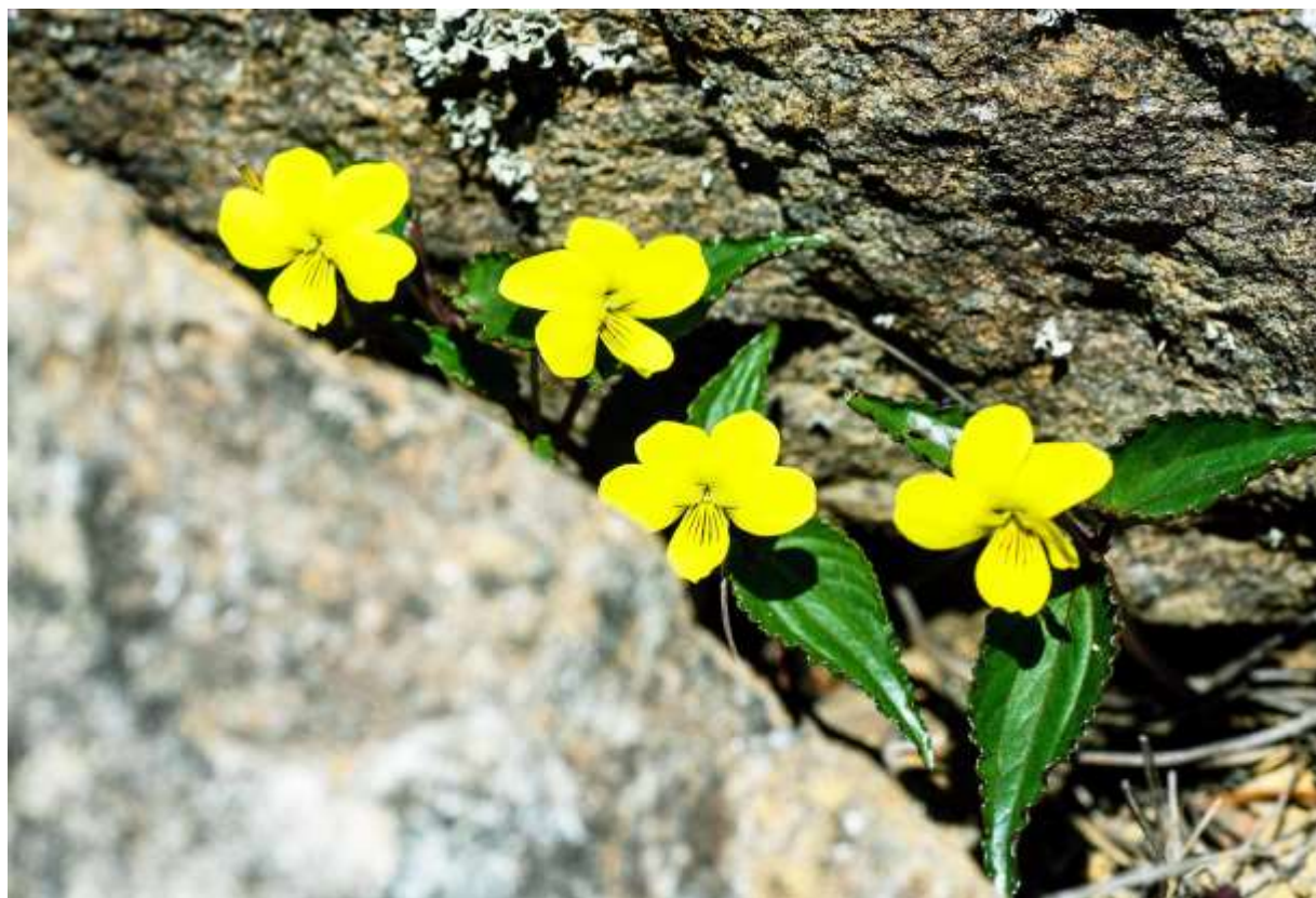
“Ezo-ki-sumire” Family: Violaceae / スミレ科 スミレ属

アポイ岳と天塩山地の超塩基性岩地帯に特産する草丈5~15cmの多年草で、道内の日本海側と本州中・北部に多いオオバキスマイレの亜種とされる。基準亜種では花が1~3個つくのに対して、この亜種は径1.5~2cmの花を1個だけつける。超塩基性岩地帯に分布する植物に共通する特徴として、このスマイレも葉は厚くて強い光沢があり、茎と葉脈は赤みを帯びる。葉は長さ2~5cmの長卵形で先が鋭く尖り、3枚が輪生状につく。フランスの友人によると「ヨーロッパでは黄色いスマイレは珍しい」とのことだが、確かにアルプスにはキバナノコマノツメ (B:p.155) と、色変わりの大きいもう一種の黄花タイプくらいしかないようだ。しかし、日本では黄色いスマイレは結構多く、変種まで入れれば道内だけでも11種類が分布するという「黄スマイレ王国」である。◇2006.05.21 様似町、アポイ岳