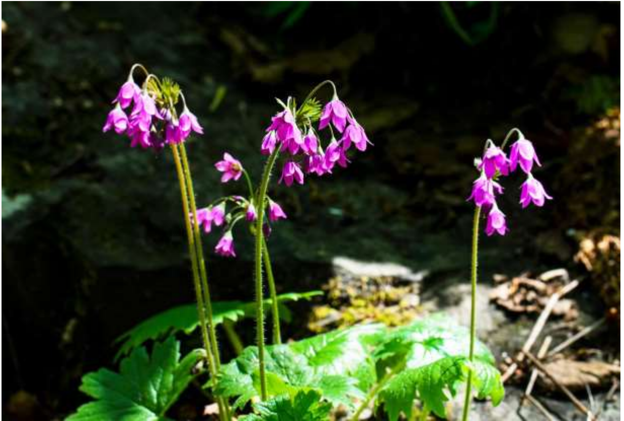
“Sakura-sou-modoki” Family: Primulaceae / サクラソウ科 サクラソウモドキ属

国内では北海道にのみ自生する草丈15～30cmの多年草で、山地～亜高山帯の林下や溪流沿いに生える。北海道でも礼文島以外では自生地と個体数は少なく、絶滅危惧IB類に指定されている。国外ではサハリンに分布するようだ。サクラソウモドキ（桜草擬き）とはいうものの、サクラソウ（p.45）と共通する所は少なく、全体と葉の形はエゾオオサクラソウ（p.43）によく似ている。しかし、それとは別属の植物だけあって、花の形と質感はエゾオオサクラソウとは異なる。根生葉は径2～7cmの腎円形で長い柄があり、掌状に9～13中裂する。葉柄と花茎には毛が多く、葉裂片の縁にも毛が生える。長く伸びた花茎の先に、濃いピンク色の花を3～8個下垂する。花冠は径1.5cmほどの鐘形で内面は黄白色、先が5深裂して少し開くが、平開しない。◇2012.06.04 礼文島、ホロナイ川上流