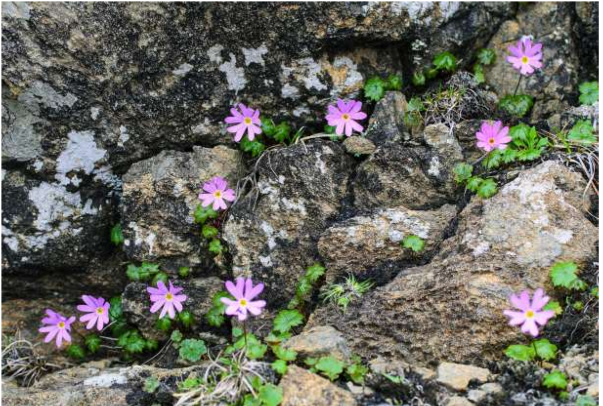
“Hidaka-iwa-zakura” Family: Primulaceae / サクラソウ科 サクラソウ属

北海道特産の美しいサクラソウの仲間、分布の中心は日高地方南部の超塩基性岩地帯だ。春にアポイ岳登山をする人にとっては、見たいと思う花の筆頭格であろう。艶のある葉は2~5cmの円形~腎円形で浅く7裂し、縁には不規則な鋸歯がある。この形の良い小型の葉と、径2.5cmにもなる大型の花とのバランスが良い。花冠は鮮やかな紅紫色で5深裂し、平開する。鮮やかな花が岩の割れ目に沿って並んでいる様はまことにフォトジェニックで、格好の撮影対象として好まれる。この花は稜線だけではなく奥深い溪谷にも咲くが、溪谷に咲く花は稜線のものに比べて淡い色調で、葉も大きめで縁が巻き込まない。春先の北海道はいろんなサクラソウ属の種が咲き競うが、花も葉も格別美しい本種の群落に行き当たれば、だれでも感激すること請け合いである。◇2013.06.02 様似町、アポイ岳