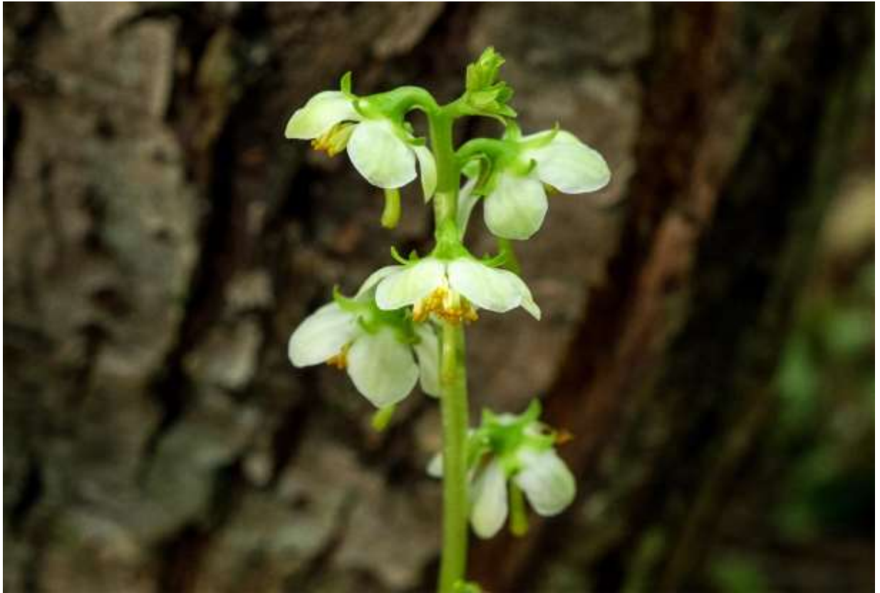
“Ichiyaku-sou” Family: Ericaceae / ツツジ科 イチヤクソウ属

低地～山地帯の樹林下に生える常緑の多年草で、開花時の草丈は15～25cm。種名と和名が示すように、これは国内に7種あるイチヤクソウ属を代表する種といえよう。日本全土に自生するほか。朝鮮半島から中国にかけても分布する。草姿はベニバナイチヤクソウ(p.58)とよく似ており、根元に数枚集まって付く葉は長さ3～7cmの楕円形で、鈍い鋸歯があり白色の葉脈が目立つ。まっすぐに伸びた花茎の上部に、数個から10個の白色の花が総状にうつむき加減につく。丸みを帯びた花冠は径12～13mmで5深裂し、広鐘状に開いて上方に曲った花柱が突き出す。5個の萼片は先の尖った披針形で鮮やかな緑色。放射状に配置された萼片と白い花冠とのコントラストが鮮やかである。イチヤクソウという和名は、古来薬草として利用されたことからついた。◇2019.07.18 札幌市、手稲山