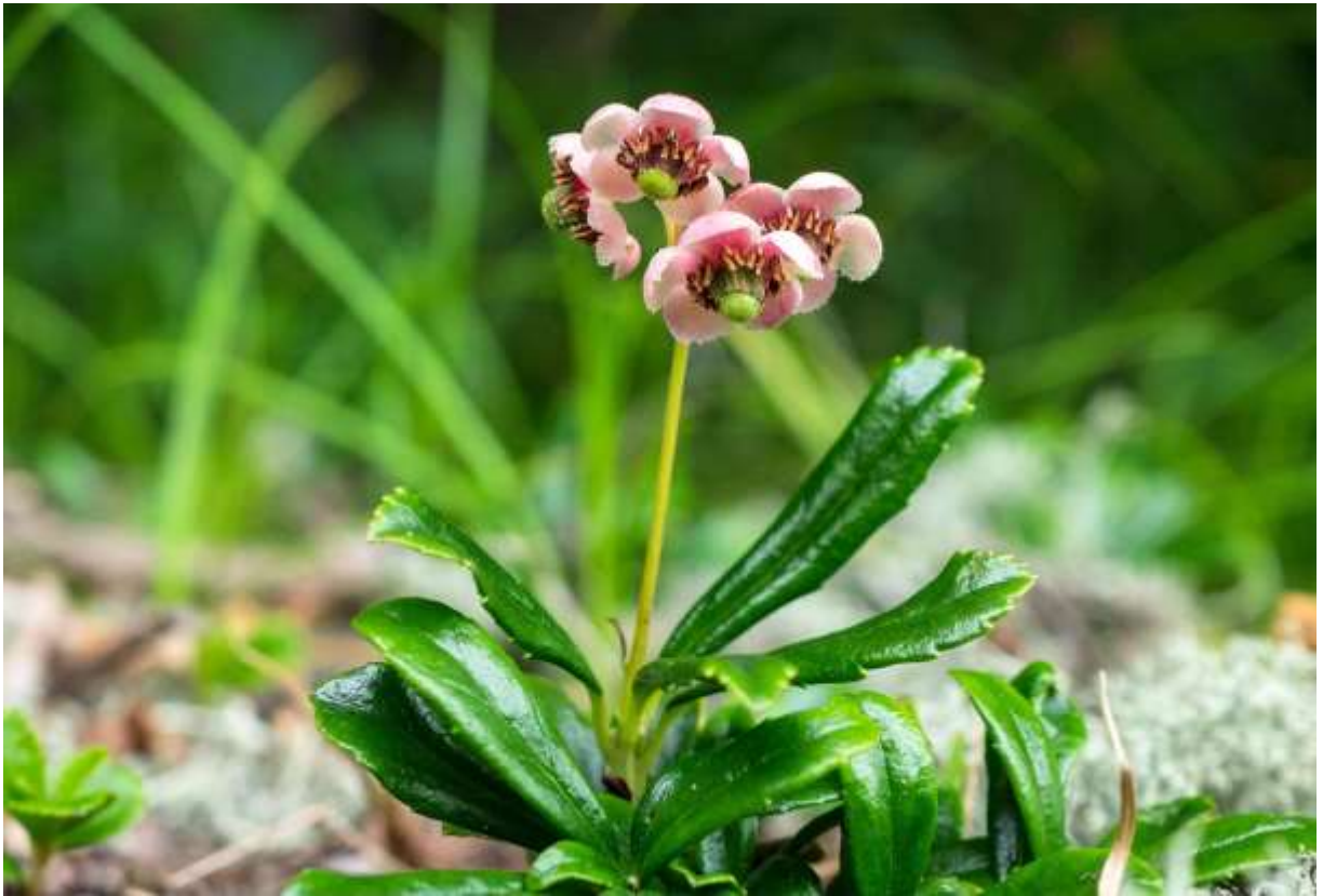
“Oo-umegasa-sou” Family: Ericaceae / ツツジ科 ウメガサソウ属

茨城県以北の本州と北海道に分布する高さ10～15cmの常緑性小低木で、太平洋側の海岸近くの乾いた林内に生えることが多いが、山地に生えることもある。地下茎が長くはい、そこから分岐した地上茎が立ち上がるので、群生することが多い。国外では北半球の周極地方に広く分布する。葉は長さ3～5cmの倒披針形で、厚みと光沢があり、10数個が2～3段に輪生する。初夏の頃、茎先に花序が伸び、3～9個の花がやや下向きに咲く。花冠は白色～淡紅色で5裂し、径8～10mmの広鐘形に開く。淡紅色の花の中央に大きな緑色の花柱があり、その周りを複雑な形態の赤紫色の雄しべ10個が取り囲むので、目立って面白い形の花である。本種のエキスは前立腺肥大症に対する薬効があるとのことなので、中高年男性には興味を引く植物かも知れない。◇2019.07.11 苫小牧市