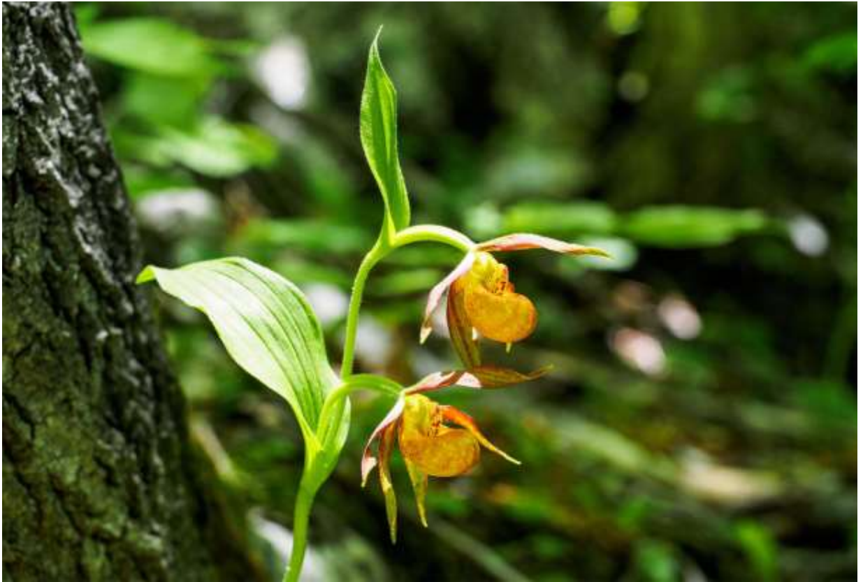
“Doutou-atsumori-sou” Family: Orchidaceae / ラン科 アツモリソウ属

北海道東部から中国を経て極東ロシアまで分布する多年草で、山地帯の広葉樹林下に生え、草丈は30～50cm。葉は3～4枚あり、長さ10～15cmの長楕円形で、縦筋が目立って先は尖る。花は茎頂に1～2個つき、全体が淡茶褐色～黄褐色だが、唇弁は少し淡色となることがある。背萼片は狭長楕円形で先が尖り、長さは3～5cm。側花片もほぼ同形で同長である。唇弁は袋状で、ホテиаツモリソウ(p.142)よりは小さく、長さ1.6～2.5cmほど。この種はかつてカラフトアツモリソウと同一視されていたが、北大の高橋英樹教授が2009年に C. shanxiense に同定し、ドウトウアツモリソウの和名を提唱して分類が決定した。アツモリソウ属としては地味な花だが、花の形態は典型的な“アツモリソウ”で、逆光に浮かび上がる姿はなかなか美しい。◇2017.06.06 道東