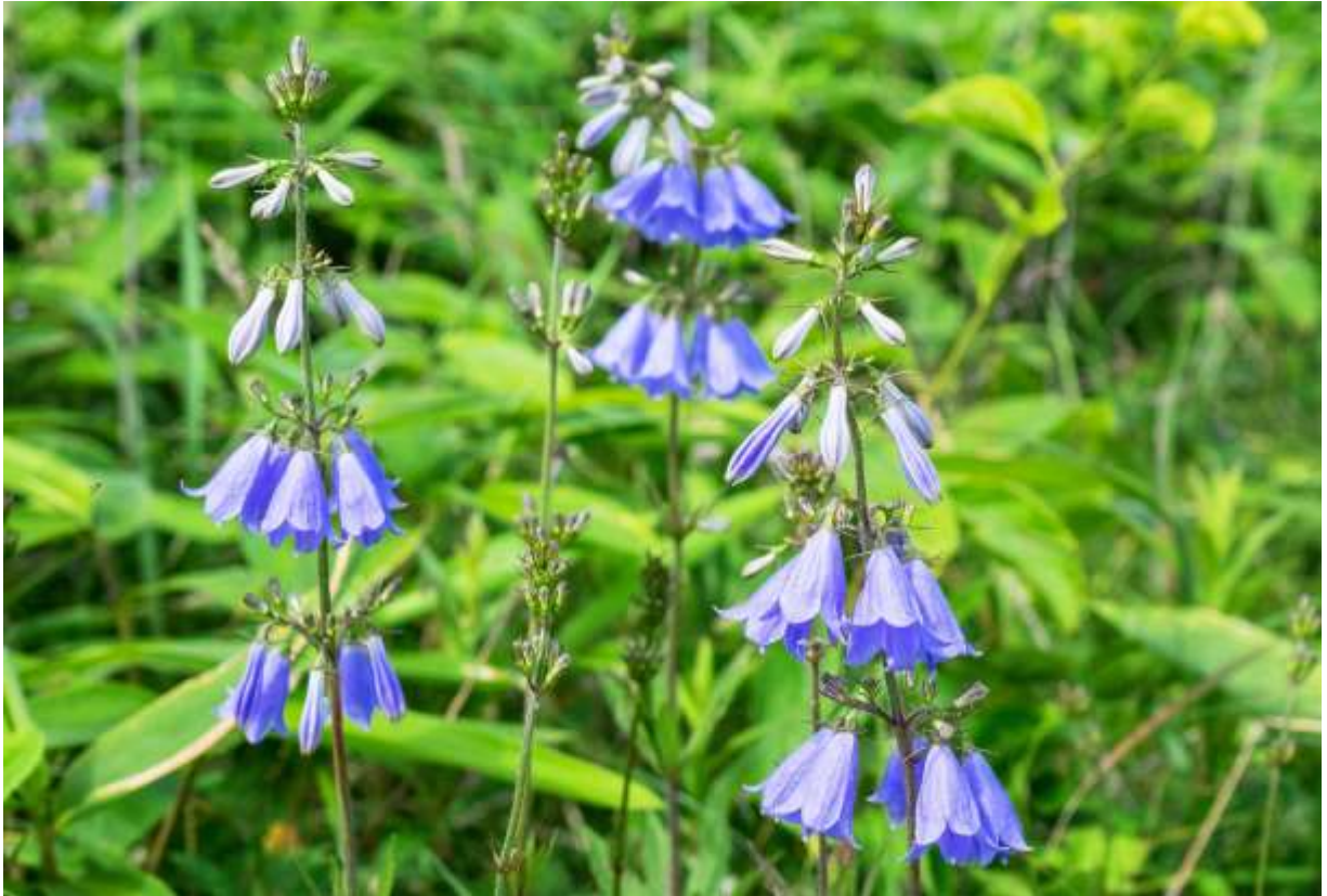
“Tsurigane-ninjin” Family: Campanulaceae / キキョウ科 ツリガネニンジン属

日本全国と千島列島から東シベリアにかけての海岸～高山帯に生える草丈20～100cmの多年草で、全体に変異が大きく、花色も青紫から白色まで変化する。花は釣り鐘形で、太い根が朝鮮人参に似るということからの命名らしい。茎を切ると臭いのする白い汁が出るのはこの仲間の特徴だが、ツリガネニンジンとは古くからトトキと呼ばれ、若芽は味の良い山菜として知られる。葉は直立する茎に3～5枚ずつ輪生するが、対生や互生するものもある。数段下向きに輪生する花は長さ2cmまでになる鐘形で、先は5裂して裂片はやや反り返り、萼裂片は線形だ。花柱は花冠より少し突き出て、柱頭は3裂する。従来、高山に生えて全体に寸詰まりのものを、変種ハクサンシャジンとして区別してきたが、平凡社図鑑では、これを独立した変種とはしない見解をとる。◇2018.07.22 豊頃町