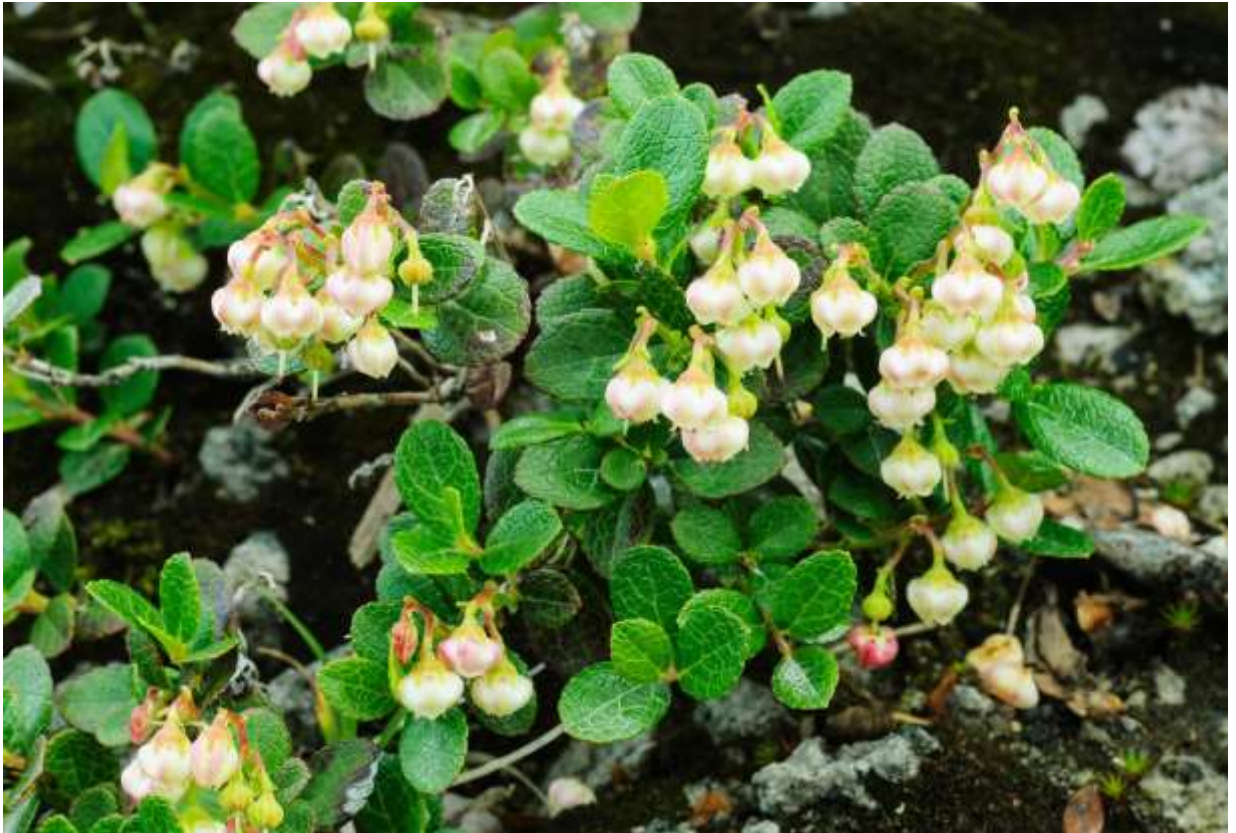
“Shiratama-no-ki” Family: Ericaceae / ツツジ科 シラタマノキ属

日本からサハリンやアリューシャン列島まで分布する高さ10～30cmの小低木で、国内では中部地方以北の本州と北海道の亜高山帯～高山帯で、日当たりの良いれき地に生える。楕円形の葉は厚くて光沢があり、葉脈が目立って面白い。花は壺形で枝先に2～6個付き、花冠の長さは6mmほどで先が5裂するが、白い花冠に淡紫紅色のぼかし模様があつて美しい。同じツツジ科のアカモノ(B:p.158)が赤い実を付けるのに対して、シラタマノキは白い実を付けるので別名をシロモノともいう。大きさが1cmほどになる実を食べると、サロメチールの味がするのはよく知られている。本種は、道内では比較的楽に観察できる高山植物で、大雪山ではロープウエー終点の姿見池付近にあるし、ニセコ山系では高所を走る道路脇で普通に見られる。◇2008.07.12 千歳市、樽前山