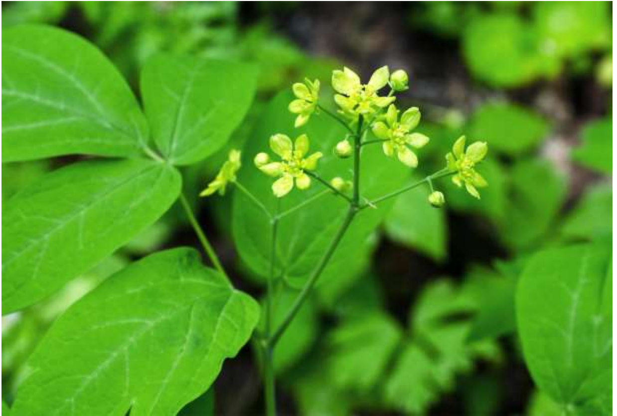
“Ruiyou-botan” Family: Berberidaceae / メギ科 ルイヨウボタン属

日本全土を含む東アジアに広く分布する草丈40～70cmの多年草で、道内では低地帯～山地帯のやや薄暗い林内で普通に見られる。その名が示すようにボタンの葉に似た2～3回3出複葉の大きな葉をつけ、小葉は長さ5～8cmの長楕円形で、2～3裂するものもある。茎先と上部の葉腋から花序をだし、径1～1.5cmの黄緑色の花を10個ほどつける。花は6枚の萼片が花弁状に展開し、黄緑色で極めて小型のしゃもじ状花弁が雄しべを取り囲む。ルイヨウボタンは決して派手な花ではないが、形の良い大きな葉と、小さいながら品の良い黄緑色の花の組み合わせは、雰囲気良くて私のお気に入りだ。芽出し直後の展開する前の葉と、丸い蕾が集まっている様子も大変おもしろいし、秋に青黒く熟する実の様子も結構な、いいとこばかりの風流な植物である。◇2017.05.29 札幌市、砥石山