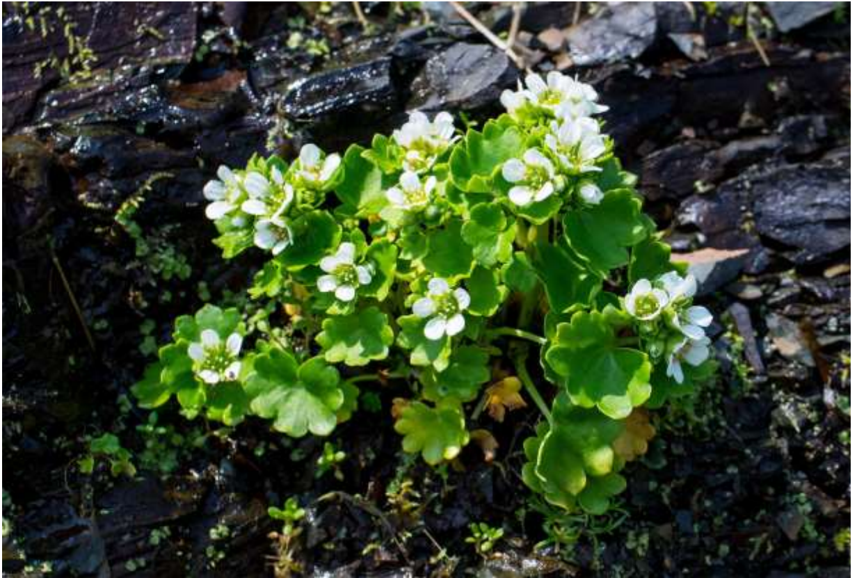
“Kiyoshi-sou” Family: Saxifragaceae / ユキノシタ科 ユキノシタ属

北太平洋沿岸域に広く分布する草丈5～20cmの多年草で、国内では根室半島と知床半島の一部で、海岸の湿った崖に生える。情報不足から、かつては絶滅危惧IAとされていたが、現在はII類に改められた。根生葉は幅2cmほどの厚みのある腎円形で長い葉柄があり、縁は浅く5～7裂する。根生葉は花が咲き始めると直ぐに枯れ、好ましい草姿を台無しにするが、それとほぼ同形でもっと大きい茎葉が出そろうと、本種の持つ「格好良さ」が復活する。花は花茎上部に1～数个集散状つき、白い花弁5枚がカップ状に開くが、花序の周りを茎葉と同形の苞が取り囲んでユニークさを高めている。この種は生息地が限られ、個体数も少ないと聞いていたが、案内された撮影地では群生状態で、フレッシュな花がユキワリコザクラの花と混生して夢のようであった。 ◇2018.06.03 根室半島