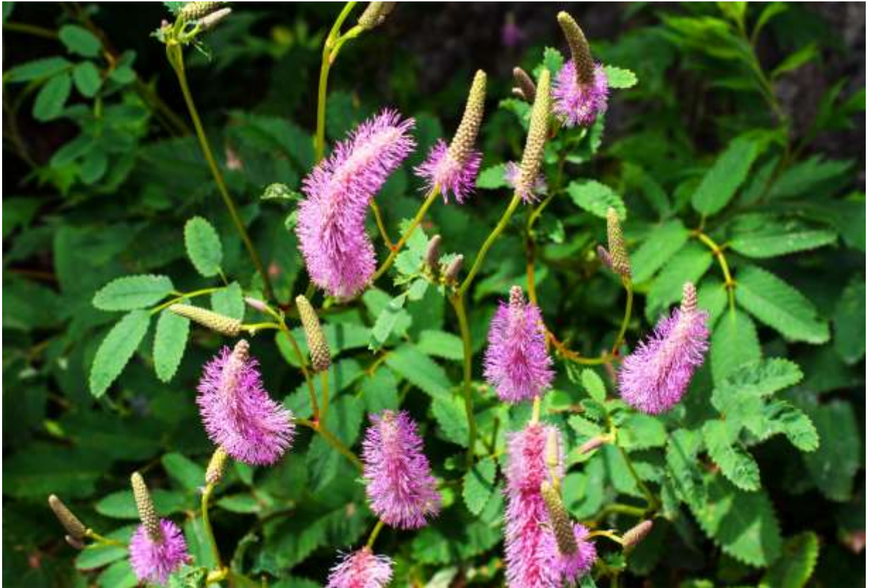
“Ezo-touchi-sou” Family: Rosaceae / バラ科 ワレモコウ属

日高山脈の特産種で、亜高山～高山帯の溪流沿いに生える草丈50～120cmの多年草。絶滅危惧種IB類に指定されている。根生葉は7～17枚の小葉からなる奇数羽状複葉で長く伸び、茎は上部で分岐する。茎上部にあるブラシ状の花穂は7～25cmと長く、濃いピンク色の花が密について、下から上に向かって順に咲き上がる。ワレモコウ属に共通する特長として花弁は無く、4個の萼片の中央から長さ7-10mmの紅紫色の雄しべが6～12本突き出る。花期は長い、満開時には垂れ下がった花穂の先端部が持ち上がることで多く、形の整った大きな株を撮影するには満開に先立っての訪問が望ましい。本州中部の山岳地帯で稜線に生えるカライトソウ (B:p.180) とよく似ているが、それよりは大型で生息環境も異なっている。また、花穂を形成する花の咲く順序も逆である。◇2013.08.29 浦河町、元浦川