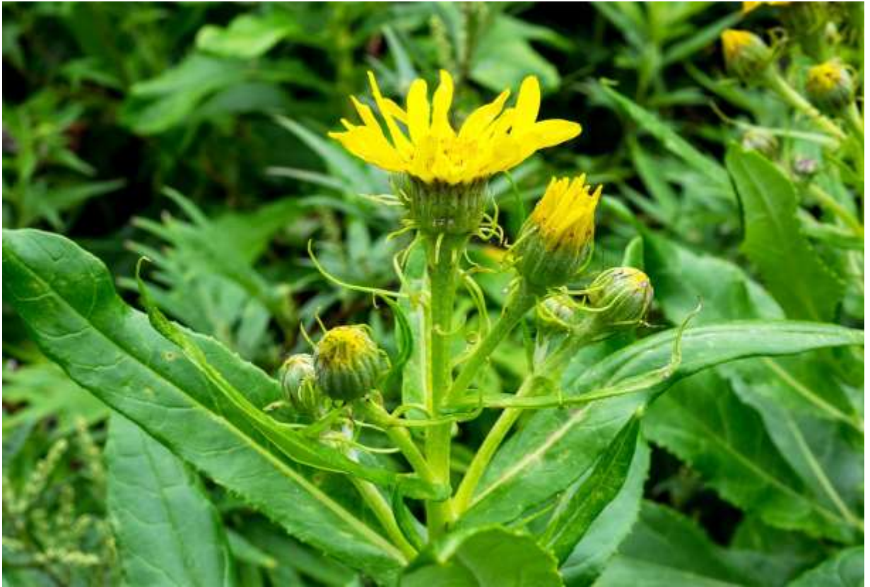
“Ezo-oguruma” Family: Asteraceae / キク科 ノボロギク属

北海道と青森県の海岸に生える草丈30～50cmの肉厚の多年草で、道東や道北の砂浜海岸や海岸台地では群れて咲いている。国外では北西太平洋沿岸と北西大西洋沿岸に分布する。とにかく葉の多い植物だが、中部の葉が最大で長さ15cmになり、艶のある葉が密生する存在感は圧倒的だ。頭花は径4cm前後で数多く付くのでよく目立つが、近寄ってみるとひげ状の苞葉に囲まれた蕾が格別面白い。その外見が示すように強靱な植物で、アラスカでは海岸の植生保全に使われているという。若葉は食用にもなるし、葉をすりつぶして傷薬にもなるという、とても有用な植物だ。道内の海岸では他の背の高い植物と混生していることが多く、あまり目立たないが、千島やアラスカの写真を見るとエゾオグルマだけが列を作って咲き誇っており、見事な風景を呈している。◇2019.08.07 えりも町、襟裳岬