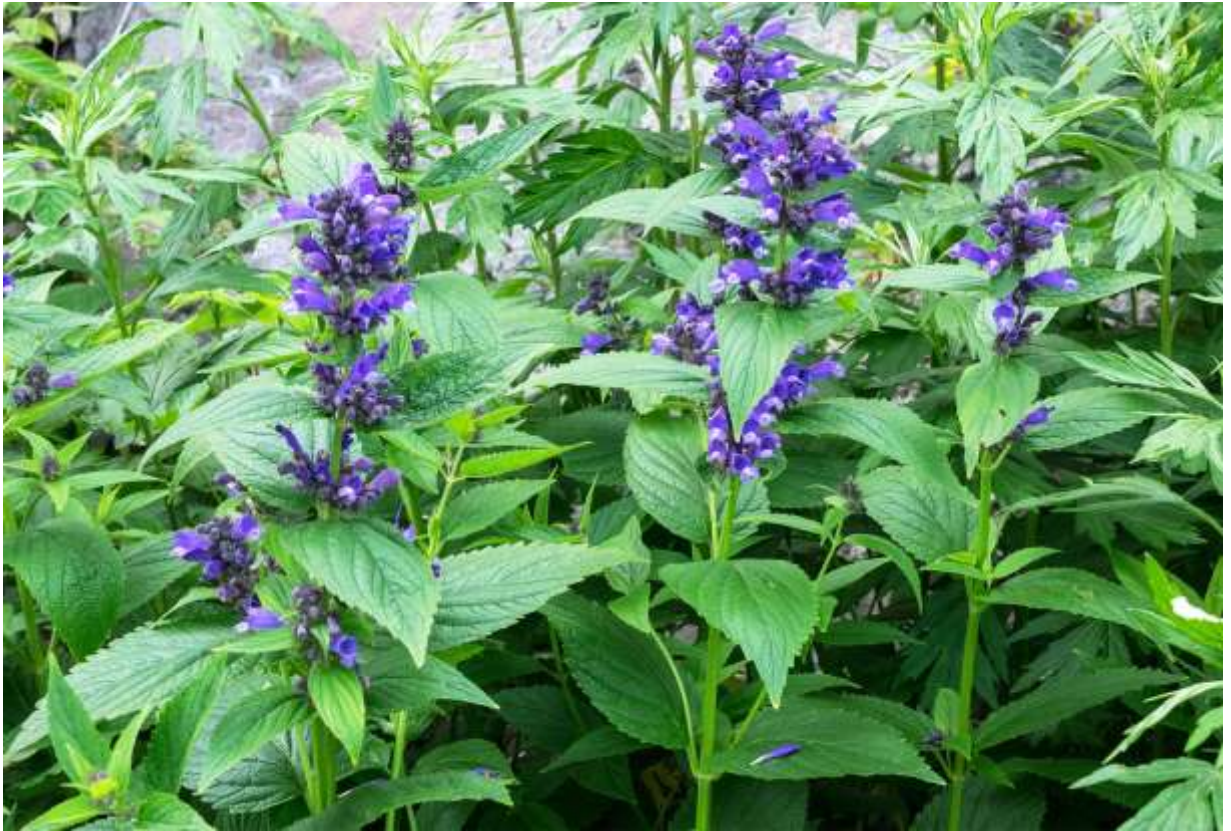
“Misogawa-sou” Family: Lamiaceae / シソ科 イヌハッカ属

北海道、本州、四国に分布する日本固有の多年草で、本州や四国では亜高山帯の草地や溪流沿いに生えるが、道内では山地の湿った斜面や海岸の草地で群生することが多い。四角い茎は直立して高さ50~100cmになり、時に細い枝が分岐する。葉は長さ5~14cmの広卵形で対生し、長さ1~10cmの柄がある。葉には鈍い鋸歯が目立ち、先は鋭く尖る。茎上部と枝先に短い花穂がつくが、上部の葉腋にも数個の花が集まって咲く。花は長さ25~30mmの2唇形で紫色。筒部は長くて上唇は浅く2裂する。下唇は3裂して中央裂片は大きく、白地に濃色の斑点がある。道内で見える花は大きくて花付きも良く、色も鮮やかで見栄えがするが、北アルプスで出会う花はやや貧弱で、色合いも写真の花ほど深みがないように感じるの、最良見だろうか。◇2019.07.03 知床半島、羅臼町