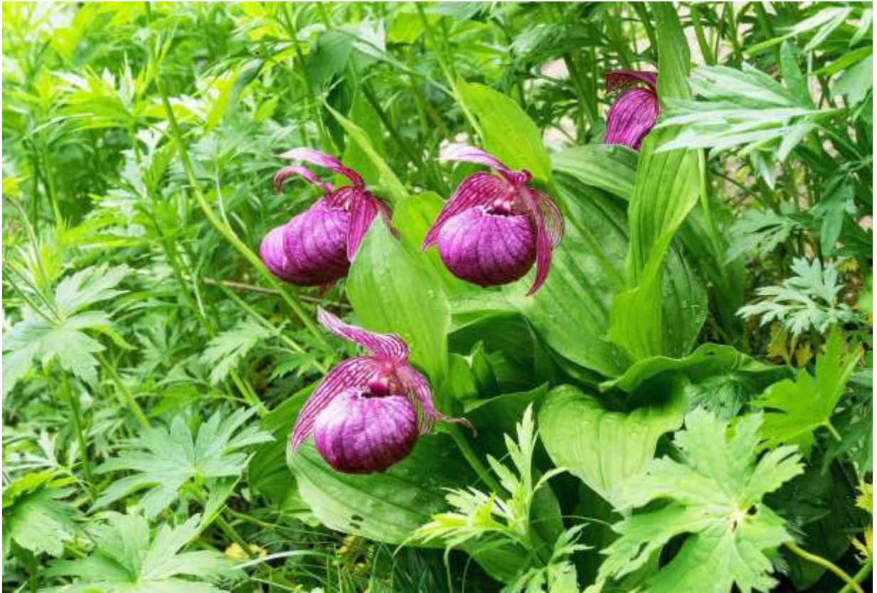
“Hotei-atsumori-sou” Family: Orchidaceae / ラン科 アツモリソウ属

中部地方以北の本州と北海道に分布する草丈25～40cmの多年草で、低地帯～亜高山帯の草原や疎林にごく稀に自生する。葉は長さ10～15cmの長楕円形で3～5枚互生し、縦皺があって先が鋭く尖る。花は茎頂に通常1個つき、花弁と萼片は赤紫色で、袋状の唇弁は径5～7cm。アツモリソウよりは唇弁が大きくて花色も濃く、日本固有の変種とされるが、アツモリソウとの違いは連続的という意見もある。平凡社図鑑では本州中部に限定とされ、変種名(var. hotei-atsumorianum )も違っているが、ここでは高橋英樹教授や梅沢 俊氏らの著書に従って表題の名称を使っている。もっとも、基準変種であるこの学名なら、日本固有ではなく東アジア～東ヨーロッパに分布することになる。花色以外はレブンアツモリソウと殆ど共通するが、自生地で見るとこの鮮やかな花は圧巻である。◇20xx年6月 北海道