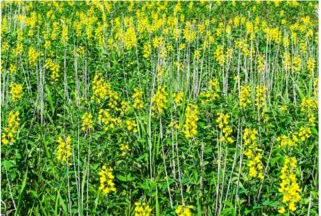
“Sendai-hagi” Family: Fabaceae / マメ科 センダイハギ属

中部地方以北の本州と北海道の海岸地帯や草地に生える草丈40～80cmの多年草で、国外での分布範囲は朝鮮半島から北米大陸北部まで。道内では山間部の道路脇でも見られるが、なんととっても多いのは海岸の原生花園で、6月に入ると、シーズン始めの花形役者として見事な花景色を展開する。葉は有柄の3出複葉で、小葉の長さ5～7cmと大きいため、群落をなすところでは結構なボリューム感がある。黄色い花はマメ科の特徴を示す長さ2～2.5cmの蝶形で、茎の先端の花序に多数つく様子は、種名にあるとおり外来種のルピナスを連想させる。しかし、花は似ているものの、北米に多くの自生種があるルピナスとは別の属で、葉の形も大分異なる。和名のセンダイハギについては、歌舞伎の「伽羅先代萩」にちなむという説が有力らしい。◇2016.06.07 白老町、ヨコスト湿原