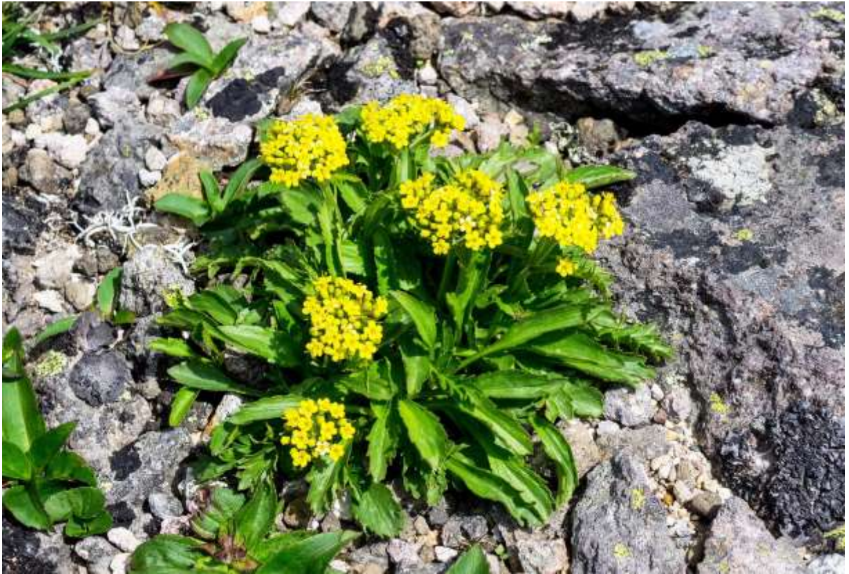
“Chishima-kinreika” Family: Caprifoliaceae / スイカズラ科 オミナエシ属

国内では大雪山系と日高山脈だけに生える絶滅危惧IB類の高山植物で、国外ではアジア大陸北東部のやや限られた地域に分布する。別名をタカネオミナエシというように、平地に咲くオミナエシ(p.237)とそっくりの黄色い花を茎頂の集散花序に付け、草丈は最大で20cm程度。根生葉は長さ2~5cmの長楕円形で羽状に中~深裂する。オミナエシの花は乾燥すると悪臭を放つが、チシマキンレイカの生花は良い香りがする。道内の海岸地帯には、チシマキンレイカと見間違ふほど低いオミナエシがあるが、において判別できるというのは面白い。同じ黄色い花を付ける高山植物でも、ミヤマアキノキリンソウ(p.234)は茎の上部までである葉がうるさいが、チシマキンレイカの方は茎葉が小さくていかにも高山植物らしく、夏の稜線に咲く様子はなかなか好ましい。◇2018.07.26 大雪山系赤岳