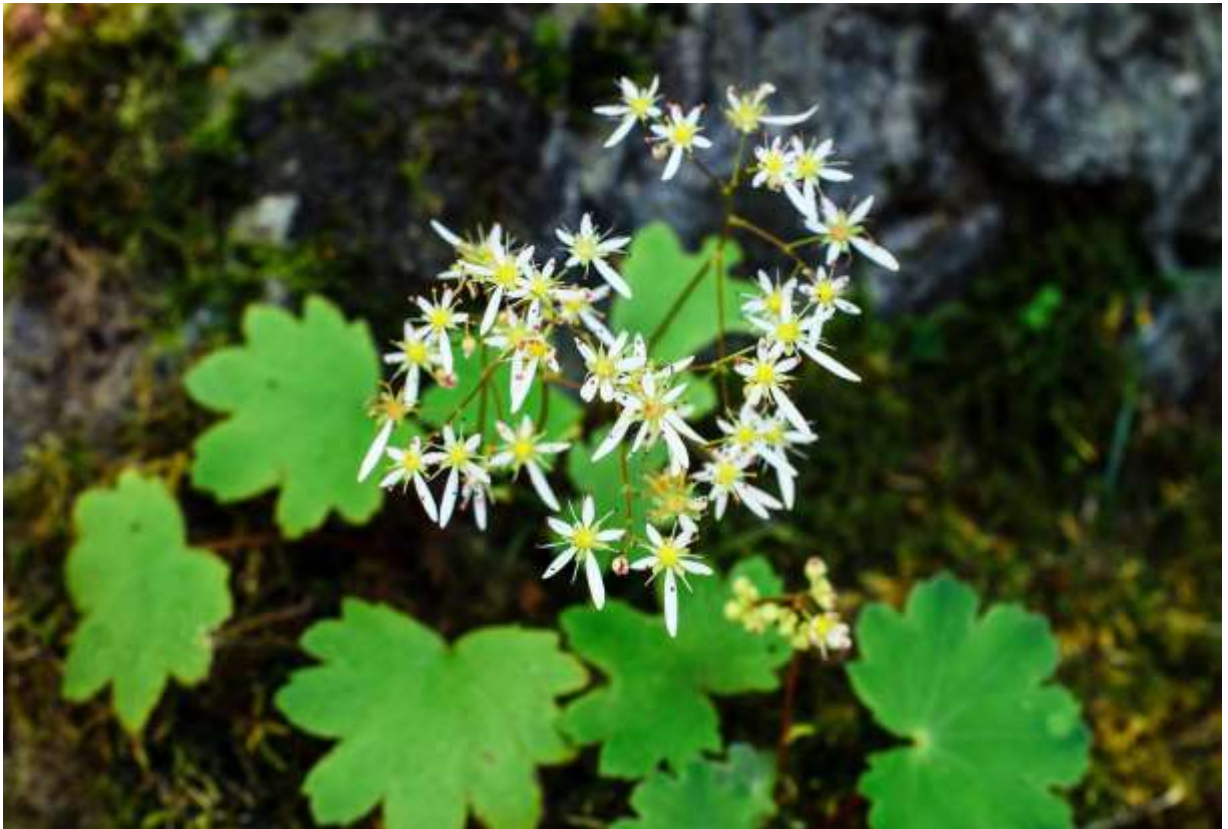
“Daimonji-sou” Family: Saxifragaceae / ユキノシタ科 ユキノシタ属

沖縄を除く日本全土と、朝鮮半島、サハリンに分布する草丈5~40cmの多年草で、海岸から高山までの湿り気のある岩上に生える。ダイモンジソウは珍しい植物ではないが、渓谷や溪流の湿った崖や岩場に生えており、葉も花も風情があって大変好ましい。厚みのある根生葉は長さ3~15cmの腎形で、掌状に5~17浅裂して不規則な鋸歯がある。白い花には5枚の花弁があり、漢字の大的字に似るからこの名前、というのによく知られているし、微笑ましい命名でもある。下2枚の花弁は長さ4~15mmと変異が大きく、上の3枚との長さのバランスを見比べるのも面白いし、雄しべの先につく赤い葯と黄色い子房との対比も好ましい。変異の大きい植物だが、最近では、高山型を独立した変種ミヤマダイモンジソウとして認めなくなった。◇2012.09.07 えりも町、ニカンベツ川