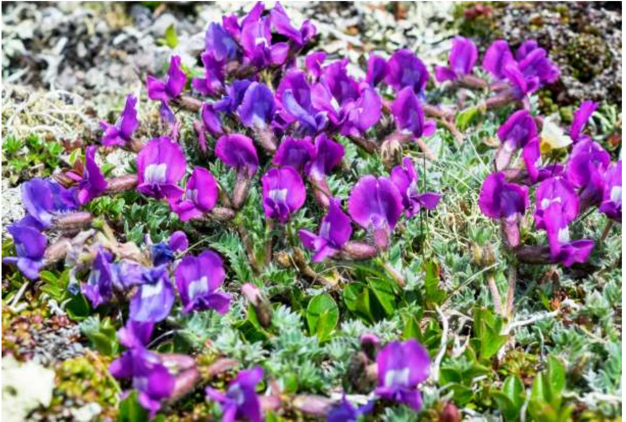
“Ezo-oyama-no-endou” Family: Fabaceae / マメ科 オヤマノエンドウ属

基準変種のオヤマノエンドウは日本固有で本州中部の高山帯に分布するが、この変種は北海道に固有で、大雪山に限って生育する絶滅危惧IB類の植物である。葉は羽状複葉で、9～15枚の先の尖った小葉からなり、両面には白い軟毛が密生する。花はマメ科の植物に共通する蝶形で、立ち上がった大きな旗弁の基部には白い斑紋がある。この斑紋上には通常花卉と同色の筋模様が発達するが、筋模様のない花も時々目にする。長さ2cm程度と決して大きな花ではないが、白く輝く葉の上で咲くので色彩対比が美しく、見通しのきく稜線上の鮮やかな赤紫色の花の集団は、遠くからでもよく目立つ。私はパミール高原で極めて太いさやをつけるオヤマノエンドウ属を見たことがあるが、日本の仲間は比較的スリムな実をつける。◇2019.07.02 大雪山系小泉岳