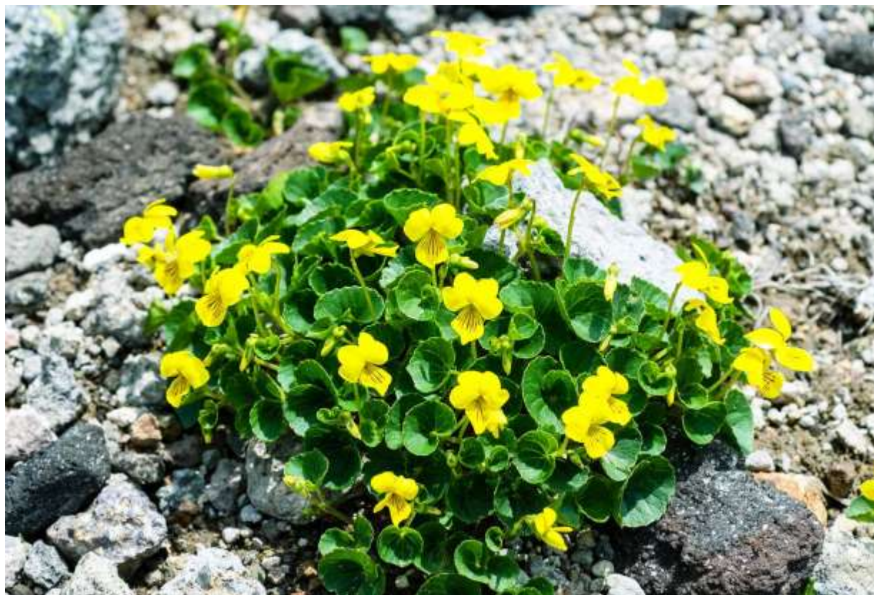
“Ezo-takane-sumire” Family: Violaceae / スミレ科 スミレ属

広義のタカネスミレには国内で生育地の異なる4つのタイプがあり、互いに異なる亜種として識別されている。種レベルでは朝鮮半島や極東ロシア、さらにはヒマラヤまで分布するともいわれるが、これら4亜種との関係は分かっていないらしい。エゾタカネスミレは北海道の高山帯に分布する。大雪山稜線の砂礫地帯では純群落を作ることが多く、雪解け直後の開花期には見事な景観となる。葉は少し艶のある深緑色で形の良い花とのバランスが見事だし、大きさ1~1.3cmの花の唇弁には茶褐色の筋模様が美しい。同じ高山性のスミレで少湿ったところに多いキバナノコマノツメ (B:p.155) よりも、花と全体の姿形が整っている。エゾタカネスミレの開花群落を見ることは、本格的な夏山シーズンが始まる前に大雪山へ登る楽しみの一つである。◇2007.07.08 大雪山系小泉岳