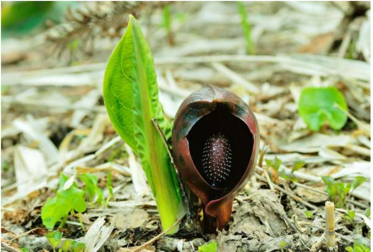
“Zazen-sou” Family: Araceae / サトイモ科 ザゼンソウ属

北海道と日本海側を中心とした本州の湿地に分布する草丈30～50cmの多年草で、国外では朝鮮半島から極東ロシアまで分布する。ミズバショウ（前ページ）と混生することが多いが、それよりは花期が少し早い。仏像の光背に似ると比喻される仏炎苞は、高さ10～20cmでチョコレート色が基本ではあるが、きれいな赤みを帯びた個体から黒茶色まで変化の幅が大きい。達磨大師に見立てられた中央の穂には多数の花があり、苞が開く前の雌しべの成熟期には発熱して20℃以上になり、周りの雪を融かすことが知られている。苞が開くと雄花が成熟するが、時間が経つと花粉が飛び散って汚れるので、写真のモデルとしては苞が開いた直後がベストタイミングだ。ザゼンソウは残雪の残る野山で最初に開花するので、この花に出会うのが毎年のシーズン始めの楽しみである。◇2007.05.05 月形町