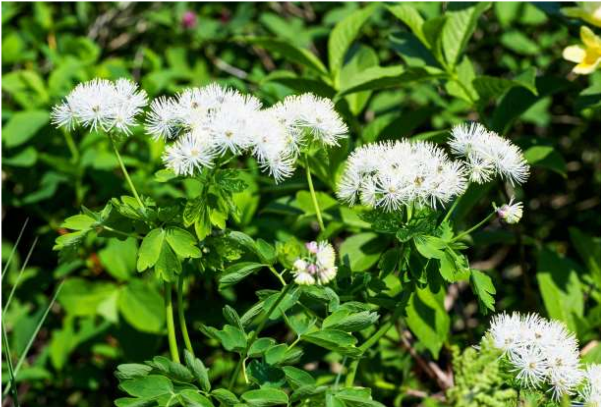
“Karamatsu-sou” Family: Ranunculaceae / キンポウゲ科 カラマツソウ属

草丈1mほどになる日本固有の多年草で、北海道と本州の低地帯から高山帯までの開けたところに生える。蕾を覆う萼は紫色で美しいが、花が咲くと落ちてしまう。直径1cmほどの花には花弁が無く、白色の雄しべが多数放射状につくが、その様子が唐松の葉の付き方に似ているとしてこの名前が付いた。カラマツソウの仲間は花弁がなくて花が皆似ており、素人には区分けが難しいといわれる。しかし、カラマツソウは小葉の先が3つに浅く裂けて丸みがあり、托葉は膜質で切れ込まず、目立って大きいというから、その独特の雰囲気一度覚えてしまえば見分けは難しくない。この花は普通、稜線に上がる前の山腹に群がって咲いており、すらりと伸びた茎にバランスよく展開する明るい緑色の葉と、茎の頂部にいくつも展開する白い球形の花の組み合わせが美しい。◇2017.07.07 大雪山系黒岳