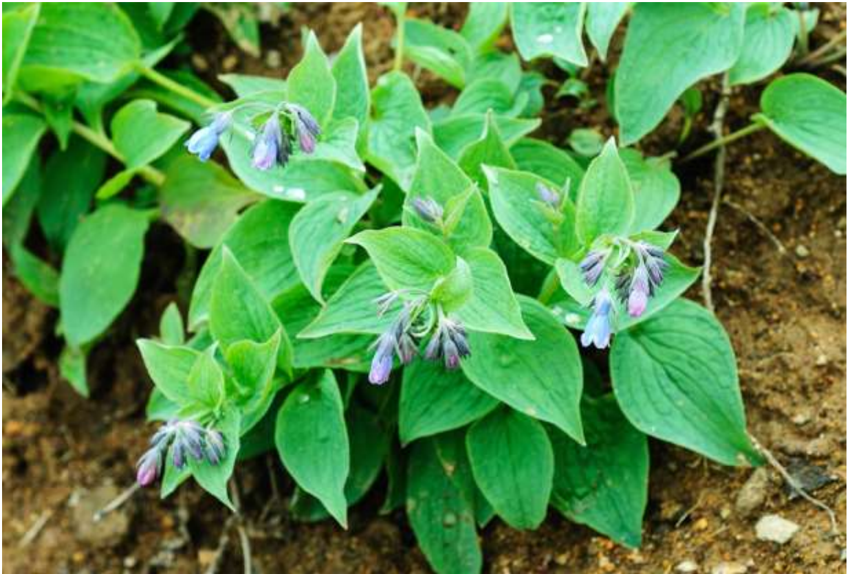
“Ezo-ruri-sou” Family: Boraginaceae / ムラサキ科 ハマベンケイソウ属

北海道の高山に生える多年草で、草丈は10～30cm。絶滅危惧IA類に指定されている。中部千島にあるものを別変種とすれば、本変種は日本固有だが、分けないとする説もあるようだ。エゾルリソウは茎も葉も白味のある緑色で、やや肉厚で艶のない葉には脈が目立つ。茎の先には厚ぼったい感じの花が10個ほど垂れ下がってつく。長さ8～12mmの花は青紫色の筒状で先が浅く5裂するが、開花前は赤紫色を呈する。葉の感じは少し違うものの、エゾルリソウの花の様子と付き方は、同属のハマベンケイソウ(p.209)とよく似ており、前者は高山に後者は海岸にという棲み分けが面白い。エゾルリソウの英語名はジャパニーズ・ブルーベルだそうだが、世界にはいろんな科の植物でブルーベルと呼ばれるものがあり、ヨーロッパにはユリ科とキキョウ科のブルーベルがある。◇2006.07.17 富良野岳