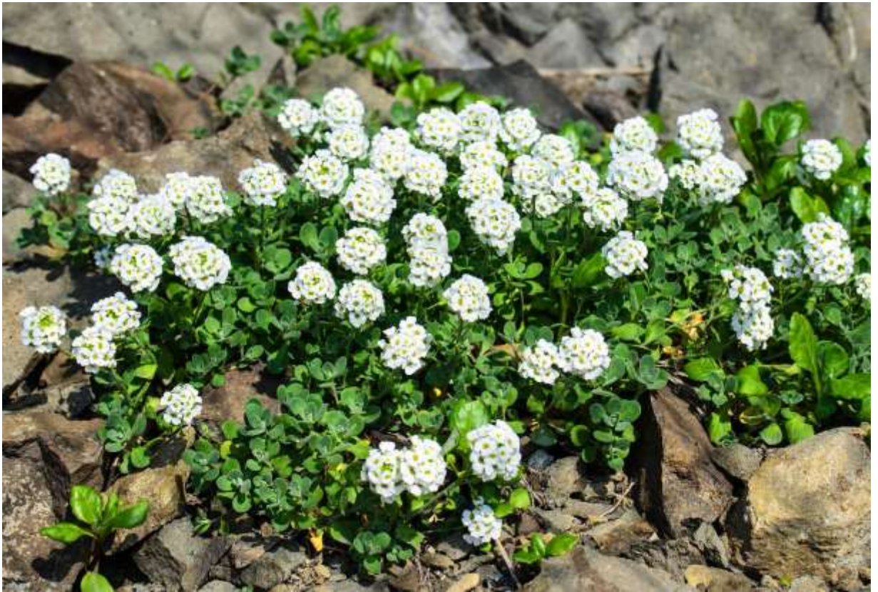
“Ezo-inu-nazuna” Family: Brassicaceae / アブラナ科 イヌナズナ属

国内では本州北部と北海道の海岸に生える多年草だが、「北方系の」という種名が示すようにアジアと北米の寒冷地帯に広く分布する。草丈は5~20cmだが、花の咲き始めはコンパクトにまとまっており、緑白色のロゼット状根生葉と、頂部で球状に集まって咲く花とのバランスがよい。花は白い4弁花で径8~9mmほどだが、花弁の先が少し凹んで中央に並んだ黄色い雄しべが可愛いし、株が群れるので遠目にもよく目立つ。太平洋沿岸や礼文島の海岸で、他の花が見られない岩場に群がって咲いている様子は、風景写真としても第一級の眺めである。ちなみに、国外のイヌナズナ属には黄色い花をつけるものが多いようだが、国内に自生する10種のイヌナズナ属では、黄色い花のナンブイヌナズナ(B:p.106)以外は全て白い花を咲かせる。◇2012.06.04 礼文島、西上泊