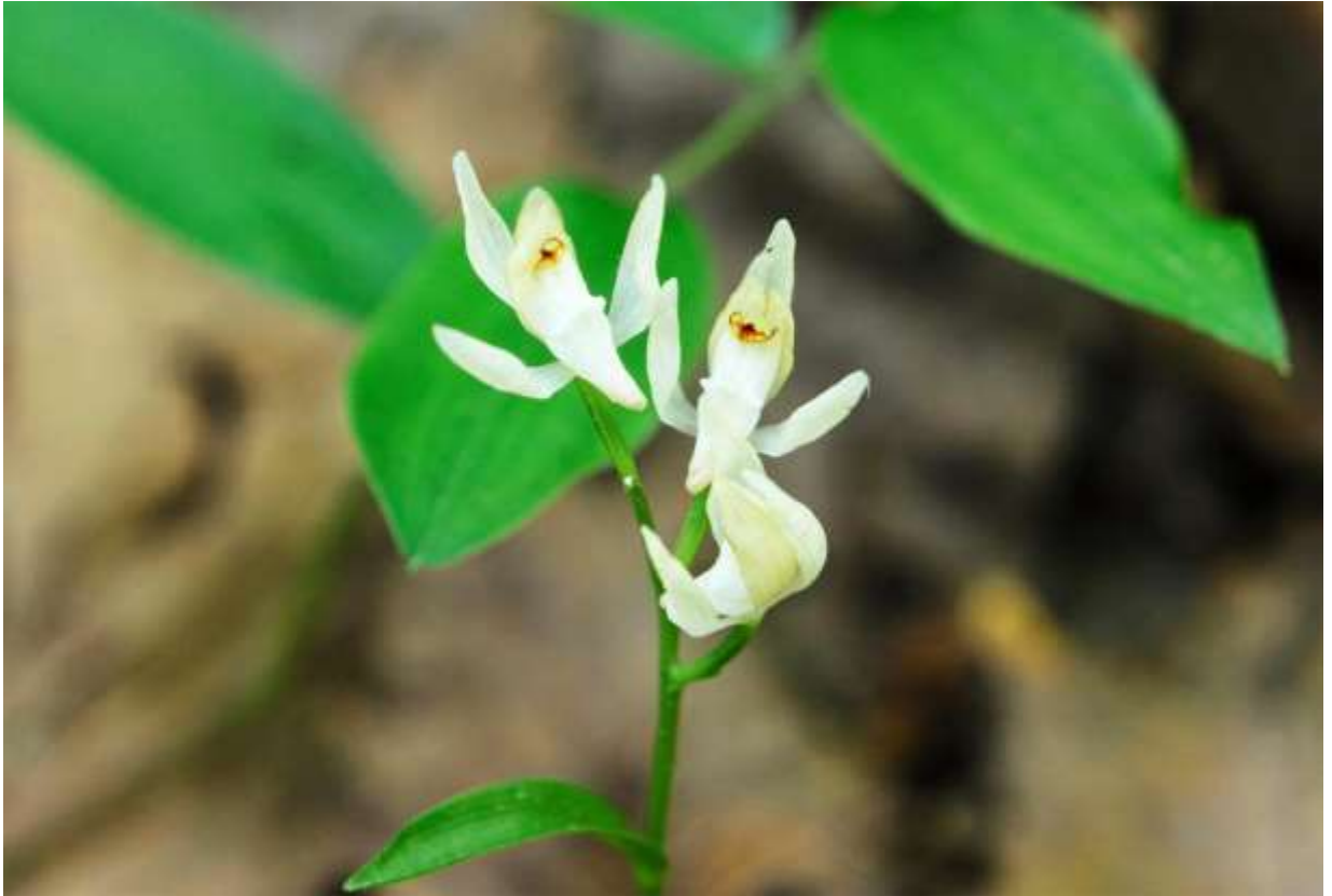
“Yuusyun-ran” Family: Orchidaceae / ラン科 キンラン属

日本各地に生える草丈10～15cmほどの多年草で、朝鮮半島にもあるという。従来。ギンラン（前頁）の葉が退化した変種とされてきたが、平凡社図鑑では独立種として記載されている。おとなしい造りのギンランの花に比べて、両手を挙げてふざけているようなユウシュンランの花は実に面白く、両者を別種とした見解は納得できる。ユウシュンランには葉脈がはっきりしない細長い葉が1～3枚あり、径1cmほどの白い花が上向きに数個つく。萼片と花弁は共に白色で、ギンランよりは大きく開き、唇弁の基部に突き出した距が目立つ。ユウシュンランという名前は、北海道帝国大学の助教授だった植物学者工藤祐舜の名前にちなむ。道内では近似種ササバギンラン(B:p.96)が普遍的で、ギンランは数が少なく、ユウシュンランはさらに少ない。◇2011.06.08 厚沢部町