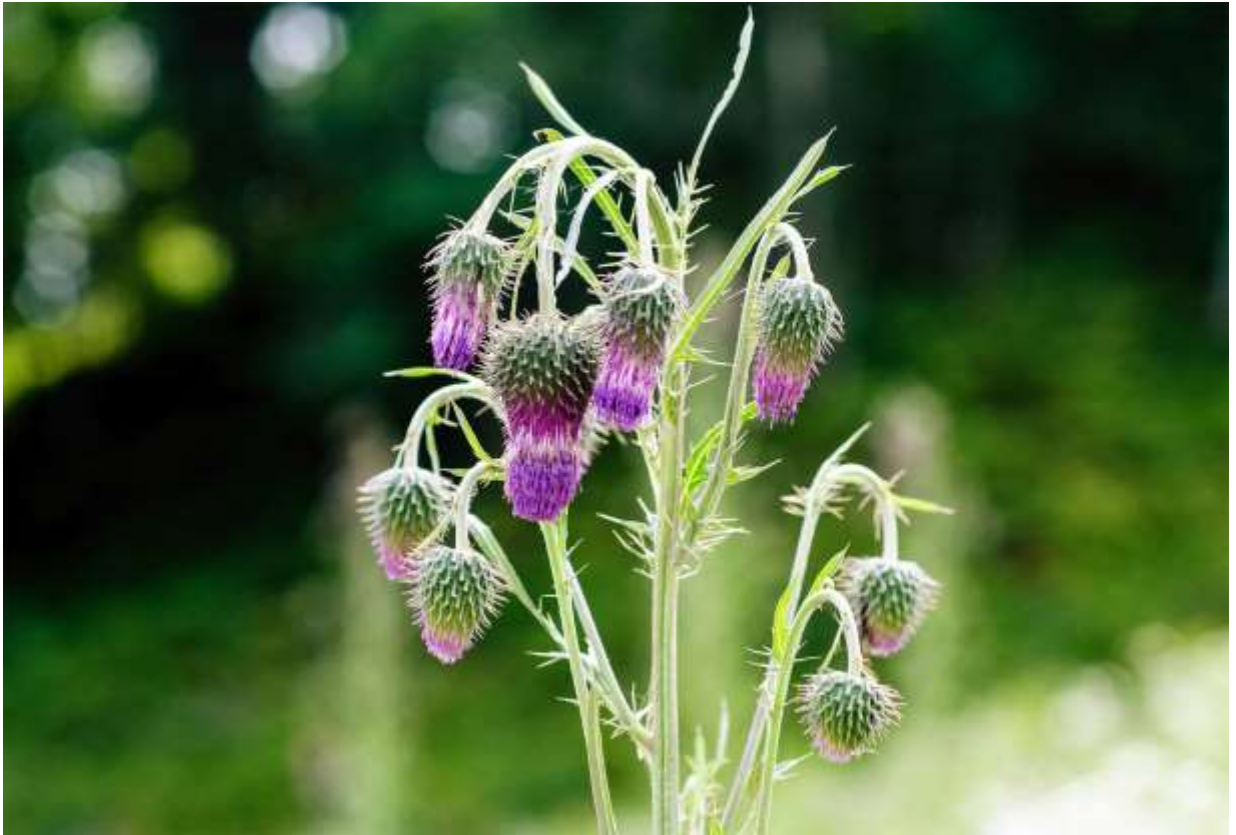
“Taka-azami” Family: Asteraceae / キク科 アザミ属

名前の通り高さ3mにもなる大型の二年草で、中部地方以北に分布し、道端や空き地などに生える。日本はアザミ大国で100種近くの種が自生するが、その多くは日本固有種で、大陸にもあるのは5種のみとのこと。タカアザミはその一つで、朝鮮半島から極東ロシアまで分布する北方系のアザミだ。まっすぐに伸びた太い茎から沢山の枝を出し、その枝先に100個以上もの頭花を咲かせる様子は、豪勢な花火かクリスマスツリーかという趣である。茎葉も大きくて長さは10~30cm。遠目には取っつきやすい姿ではないが、近寄って花を見ると気分が変わる。頭花は細長くて長さ2.5~3.5 cmほどだが、総苞片の並び方と紅紫色の筒状花が突き出す様子が面白いし、花と蕾が皆うなだれている様子も風流だ。私にとっては、道内に自生するアザミの中では一番のお気に入りだ。◇2006.08.15 占冠町