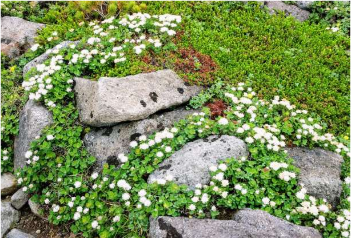
“Ezo-maruba-shimotuke” Family: Rosaceae / バラ科 シモツケ属

この仲間は一見同じような花をつけて紛らわしいが、基準変種マルバシモツケは本州中部からサハリンまで分布する落葉低木で、海岸から高山まで適応して高さは20cm～1m。葉は倒卵形で長さ15～80mm。変種エゾノマルバシモツケは高山に多く、高さ10～30cmと小型で、分布域も北米まで広がる。葉は長さ7～15mmと小さく、幅は広くて先は丸く、鋸歯があって表面はざらつく。花は径3～5mmと小さいが、多数集まって径3～5cmほどの花序となる。花弁は5枚で少し赤みを帯びた白色だが、花の中心部も淡紅白色なのでぼんやりとした印象だ。さらに多数の雄しべが突き出すものだから、花序全体が綿菓子みたいな感じで一種独特の雰囲気である。ツツジ科の小低木や草本の高山植物と隣り合って生えているが、花序の密度が高いので雰囲気がよい。◇2008.07.20 上川町、大雪山黒岳