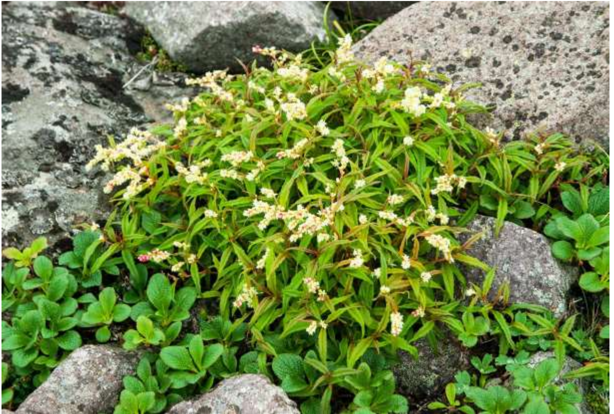
“Hime-iwa-tade” Family: Polygonaceae / タデ科 オンタデ属

国内では北海道に特産し、利尻島、礼文島と道内の高山に生える長さ5～30cmの多年草。国外では、朝鮮半島から極東ロシアにかけて広く分布する。絶滅危惧IB類に分類されていたが、現在はII類に変更されている。主に高山帯の岩れき地に生えるが、砂礫質の稜線でこんもりと大きな株を作ることもしばしば見られる。葉は互生し、長さ3～7cmの細長い披針形で厚くて艶があり、裏面の葉脈上を除いて無毛の事が多い。径3～4mmのごく小さな花が、茎先に出る細長い総状花序に沢山付く。目立つ花ではないが、黄白色の花と紅色の蕾が混じる様子はタデ科としては美しい方だ。本種は、花の咲く高山植物の中では極めて地味な部類だが、形の良い株に沢山つく紅白入り交じった花の様子が面白く、それなりに美しい。俗に言う「玄人好み」の高山植物とでもいえようか。◇2008.07.20 大雪山系黒岳