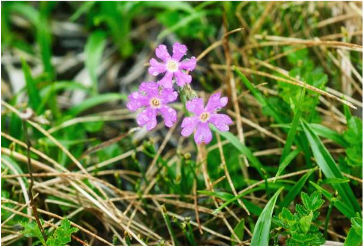
“Yuupari-kozakura” Family: Primulaceae / サクラソウ科 サクラソウ属

夕張岳の蛇紋岩地帯とその周辺湿地にのみ生える日本固有種で、絶滅危惧IB類に指定されている草丈5～10cmの多年草。根生葉は数枚あり、長さ1～3cmの倒披針形で先がややとがり、基部は次第に細くなる。縁には細かい鋸歯があり、裏面には白い粉状物がある。花は2～4個と数が少なく、鮮やかなピンク色の花は花冠が5裂して、径1.2～1.5cmに平開するが、裂片先端部の切れ込みはあまり大きくない。本種は道内に自生する他のサクラソウ属と似ているところが多いが、花冠筒部が萼の2倍以上長いのが特長だという。近年とみに数が減っているということで、ユウパリコザクラの会による保護活動が行われているが、ごく最近になって少しずつ回復しているというネット情報もある。保護活動の成果が上がることを期待したい。◇2006.07.10 夕張市、夕張岳