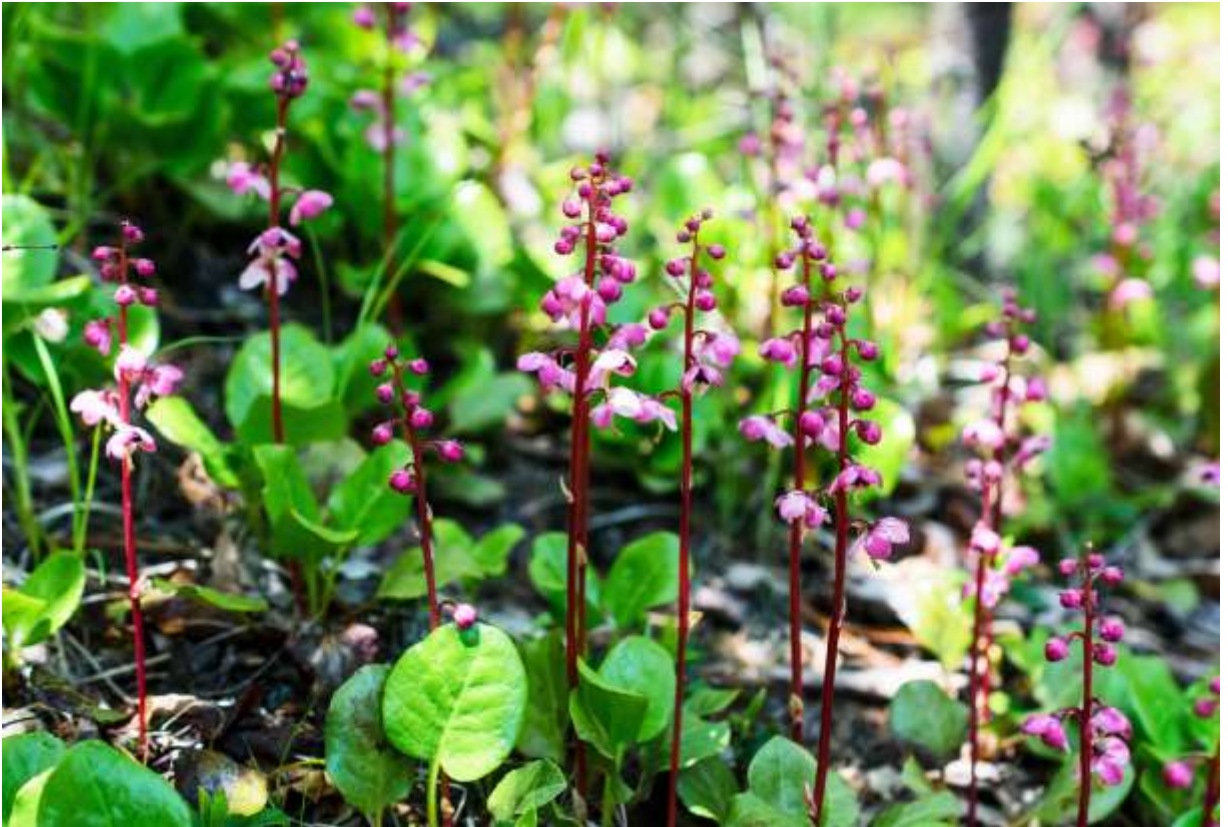
“Benibana-ichiyaku-sou” Family: Ericaceae / ツツジ科 イチヤクソウ属

中部地方以北に自生する草丈10~25cmの常緑の多年草で、国外では朝鮮半島からカムチャッカ半島にかけて分布する。従来は北米大陸に分布する P. asarifolia の亜種とされていたが、平凡社図鑑では独立した種とされている。広楕円形の葉は硬くて艶があり、2~5枚が根元に集まる。暗赤色の花茎にピンク色の花が総状に下向きにつく。花冠は5深裂して径12~15mmの広鐘形となり、長いピンク色の花柱が湾曲して突き出すのが目立つ。これは本州では深山の花だが、道内では低地帯~山地帯の明るい林内に生えることが多く、群生するところでは見事な景色となる。花色は濃淡まちまちだが、日当たりの良くないところでは白っぽい花が咲くようだ。イチヤクソウという和名は、一つの薬草で多くの薬能があるからだという。◇2017.06.12 苫小牧市、ウトナイ湖畔