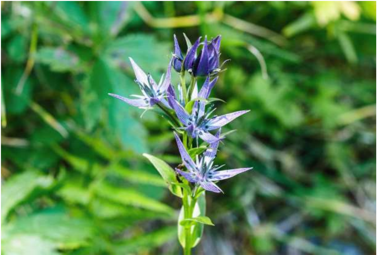
“Miyama-akebono-sou” Family: Gentianaceae / リンドウ科 センブリ属

中部地方以北の本州と北海道の比較的限られた高山に生える草丈15～30cmの多年草で、千島列島中部とサハリンにもあるらしい。私の体験では超塩基性岩や石灰岩地帯を好む様に思える。根生葉は楕円形で長さは3～8cmあるが茎葉は小さい。花は数個～10数個つき、花冠は帯黒青色～紫褐色で径2～3cmほど。5深裂した裂片には濃色の筋と細点があり、基部に2個の蜜腺が目立つ。花の色が暗めなのであまり目立たないが、センブリ属に共通する美しさがあり、特に明るくて青みの強い花は美しい。どこかの資料に「高山植物の貴婦人」という記述があったが、納得できる表現だ。しかし、咲いている場所によっては、焦げ茶色としか言いようのない花だけの所もあり、それしか見たことのない人には、この花の素晴らしさは伝わらないかも知れない。◇2008.08.23 夕張市、夕張岳