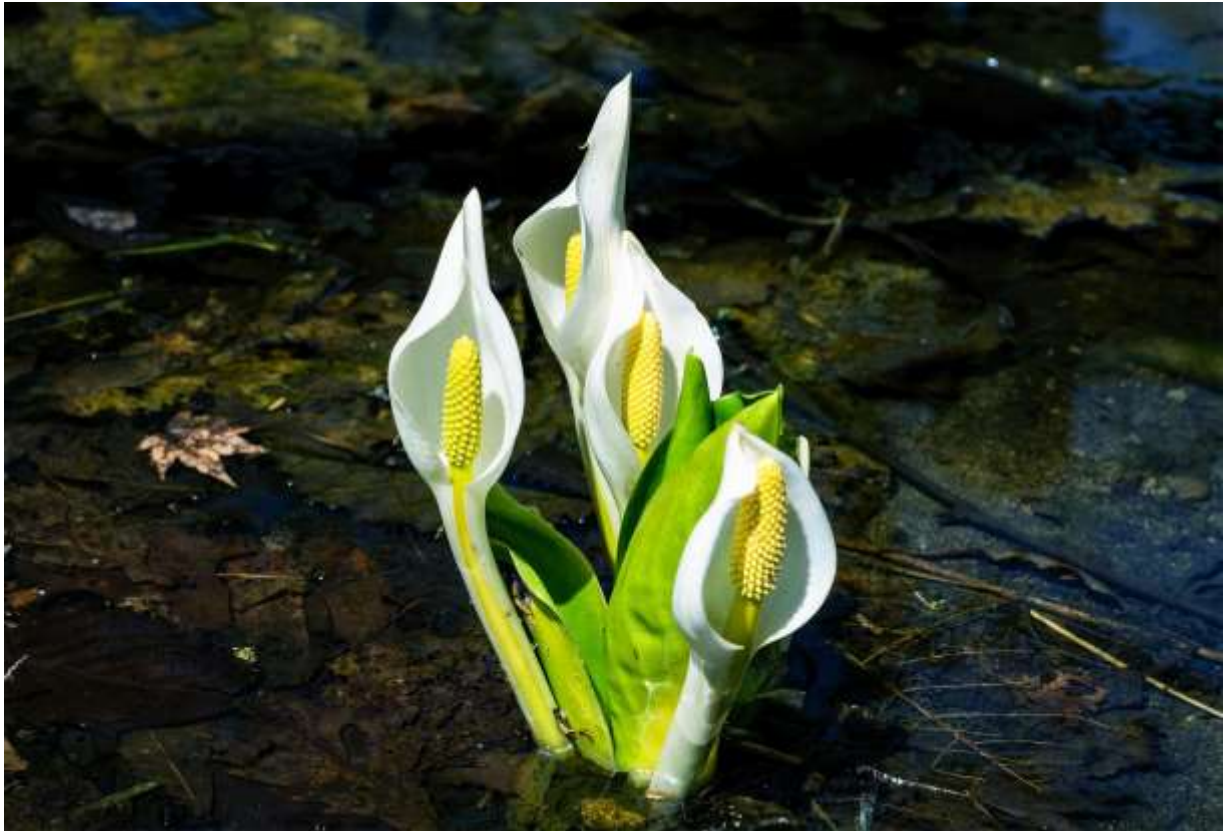
“Mizu-bashou” Family: Araceae / サトイモ科 ミズバショウ属

これを知らない人はいないだろうという程有名な植物で、近畿地方からシベリア東部までの低地や亜高山の湿地に生える多年草。開花期の草丈は10～30cmほど。標高の高いところでは初夏の花だが低地では早春の花であり、道内では極めてありふれた人里の植物だ。黄色い肉穂花序を囲む白い仏炎苞が印象的で、他の花に先駆けてこの花が浅い水中に群生する様子は実に美しい。日本ではロマンチックな花として好まれるが、北米西部にある別種の仏炎苞は黄色であり、強い悪臭があることからザゼンソウの仲間と合わせて「スカンクキャベツ」と呼ぶくらいで、もてはやす事はない。また、有毒植物でもあり、冬眠後の熊が老廃物を排出するためこれを食べるそうだ。日本のミズバショウの悪臭は弱いらしいが、夏には葉が1mにも伸びて花時の好印象が台無しになる。◇2006.05.04 苫小牧市