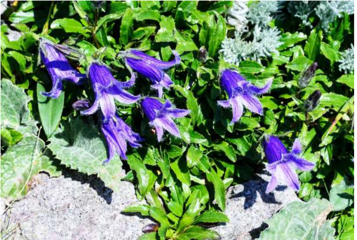
“Chishima-gikyō” Family: Campanulaceae / キキョウ科 ホタルブクロ属

北半球の寒冷地に分布する草丈5～15cmの多年草で、国内では本州中部以北の高山に生える。長い毛のある大型の筒状花はホタルブクロ (B:p.119) と似ているが、色の鮮やかさは断然こちらのほうに軍配が上がる。チシマギキョウが岩場で群れて咲く様は高山植物の典型だが、長さ4cmにもなる風格のある花は単独で咲いても様になる。日本の山では似たもの同士とされるイワギキョウ (B:p.118) の方は、ライトブルーの花色もあって軽快な協奏曲風なのに対して、こちらは重厚な交響曲風の形と色合いが持ち味である。葉を比べてみても、薄くてつやのない前者に対してチシマギキョウの葉は厚くて艶がある。北アルプスではあちこちに大きな群落があるが、大雪山系ではイワギキョウより少数派で、砂礫質の稜線にぽつりぽつりと咲いている。◇2011.08.09 大雪山系緑岳