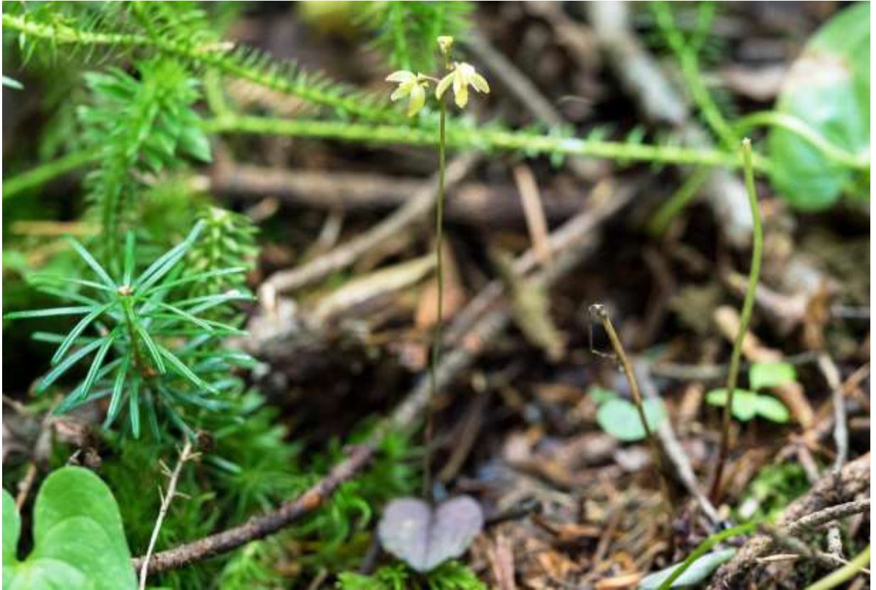
“Ko-ichiyou-ran” Family: Orchidaceae / ラン科 コイチョウラン属

北海道から山陰地方にかけてと四国に分布する多年草で、山地～亜高山帯の樹林下に生え、草丈は10～20cm。国外では、千島列島から極東ロシアにかけて分布する。地下の根茎から1枚の葉と1本の花茎を出す。葉は長さ15～30mmの広卵形で厚みがあり、全縁で基部は心形となる。葉は普通緑色で網状葉脈があるが、写真のような濃紫色のものも珍しくない。盛夏の頃、まっすぐ伸びた花茎の先に淡黄白色の花を1～数個つけ、花径は7～8mmでうつむいて咲く。萼片は長さ5～6mmの狭長楕円形で先は丸い。側花弁は萼片と同形だが、かなり小さい。唇弁は長さ5～6mmの長楕円形で、基部には赤い斑紋がある。名前の似たイチョウラン(p.82)は別属のランであり、全体の姿かたちと花の大きさや外観が全く異なるので、両者を見間違えることはないだろう。◇2017.08.01 苫小牧市、樽前山山麓