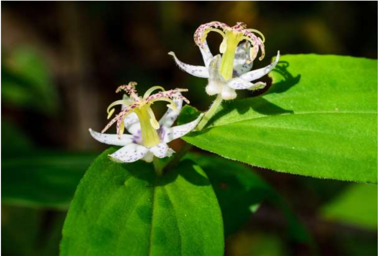
“Yamaji-no-hototogisu” Family: Liliaceae / ユリ科 ホトトギス属

北海道南西部から九州まで分布する日本固有の多年草で、山地の林内や草原に生えて草丈は30～60cmほど。茎には毛が多い。葉は先が鋭く尖った楕円形で長さ8～18cm。茎の先端と葉脇から毛の生えた花柄をだし、径2.5cmほどの花を1～3個咲かせる。花には白地に紫色の斑点のある花被片が6枚あって平開するが、3枚ある外花被片は内花被片より幅が広い。雌しべと雄しべの構造は大変面白く、雌しべは中央で立ち上がり、柱頭は大きく3つに分かれてその先端は2分する。分裂した部分には赤紫色の斑点がある。雄しべは6本で下方に湾曲し、3本は分裂した柱頭の下に、残りの3本はその間に配置される。この噴水のような垂直構造と、2種類の斑点は実に見事で美しい花だ。国内にはホトトギス属が12種あるが、北海道では2種が局地的に見られるのみである。◇2014.08.09 千歳市