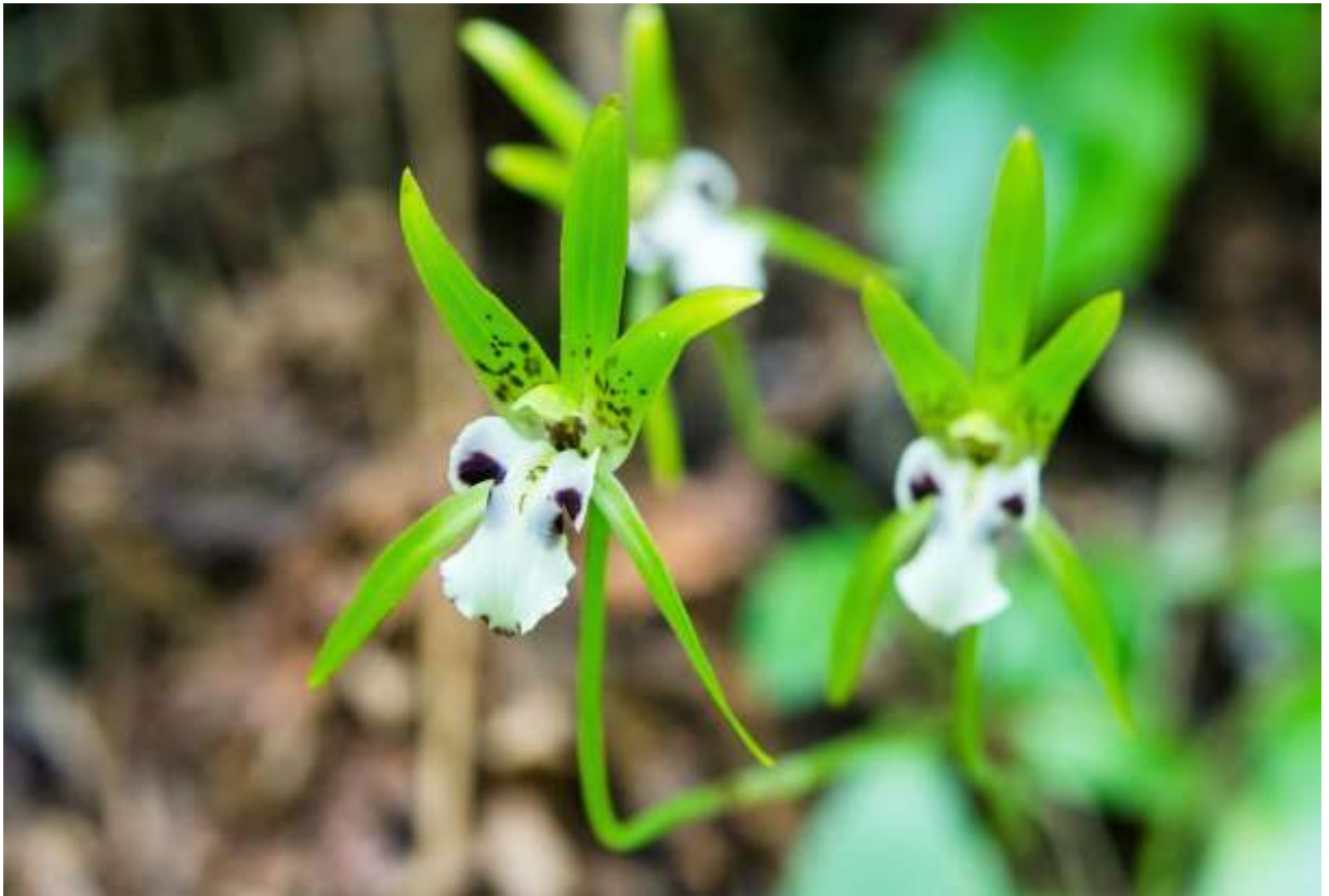
“Ichiyou-ran” Family: Orchidaceae / ラン科 イチヨウラン属

日本全土と千島からサハリンまで分布する草丈20cmほどの風情のあるランで、山地や亜高山の林床に生える。名前の通り根元に1枚だけつく葉は卵円形で厚く、長さ3～6cmで光沢があり地表近くに展開する。葉のわきからすっきりと伸びた細い花茎の先端に、幅2.5cmほどの花を1個つける。3個の萼片と側花弁は明るい緑色で長さ2～2.5cm、基部に紫色の細かい斑点がある。白い唇弁は3深裂し、中裂片は白くて大きく、側裂片には紫紅色の大きめの斑点が1つづつある。この斑点が目玉のように見えるので、花の正面像は動物の顔のようにも見えて面白い。直感的にはアニメ風のタツノオトシゴというところか。しかし、ときどき花弁と萼片の斑点が少なかったり全くない花があり、こちらはノッペラボーの顔かなどと、暗い林下の歩行を楽しませてくれる。◇2011.06.09 厚沢部町