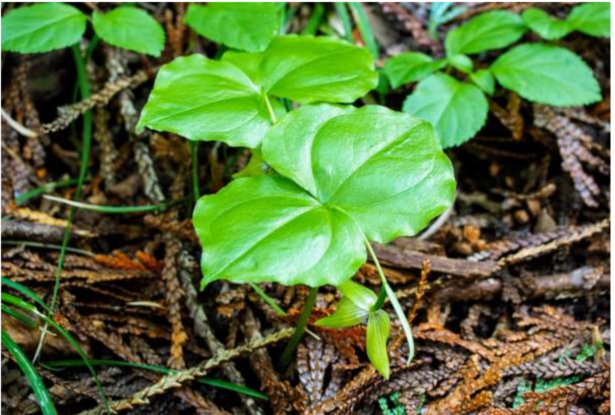
“Ko-atsumori-sou” Family: Orchidaceae / ラン科 アツモリソウ属

北海道西南部から中部地方までと、四国、九州の一部で低地～山地帯に生える草丈10～20cmの多年草で、中国と台湾にもある。長さ3～5cmほどの艶のある2枚の葉は茎頂で対生し、広卵形で縁が波打って先端は尖る。花は葉の脇から出る細い花柄の先端に一つ咲くが、蕾のうちは葉の上に顔を出しているものの、開花が進むと葉の下に下がってしまう。顔を地面にくっつけるようにして花を観察すると、長さ1cmほどしかない袋状の唇弁には紫色の筋があり、クマガイソウ（次頁）との近縁関係は明らかである。しかし、クマガイソウと違って唇弁は萼より大分小さく、上から観察したのでは、覆い隠すように被さる葉と萼片に隠されて殆ど見えない。何とも観察の難しい花だが、この花の造りと植物全体像は、窮屈な姿勢を強いられても一見の価値ありだ。◇2015.05.24 厚沢部町