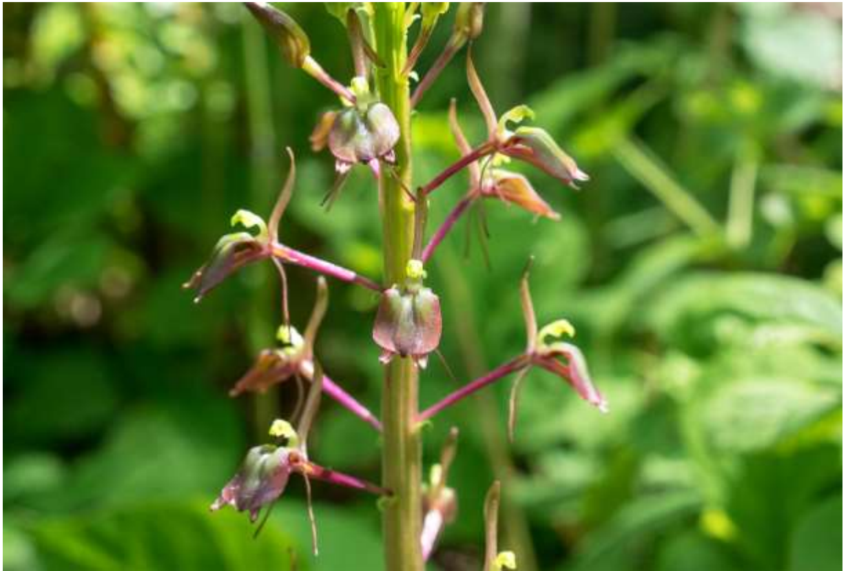
“Seitaka-suzumushi-sou” Family: Orchidaceae / ラン科 クモキリソウ属

全国の低地帯～亜高山帯の林下に生える多年草で、国外では朝鮮半島や中国・極東ロシアにも分布する。大きな株では草丈40cmになり、和名のとおりスズムシソウ(p.150)より背が高いが、若い株では背の低いものも多くある。花はスズムシソウに似ているがより小さめで、コンパクトに纏まっている。2枚の根生葉は弱い光沢のある広楕円形で長さ6～12cm、縁は縮れて縦筋が目立つ。花茎は2枚の葉の間から上に伸び、上部に数個～10数個の花をつける。唇弁は長さ9～12mmの倒卵形で先端に小突起があり、スズムシソウとは違って唇弁に筋は見られない。側萼片は細長く、先が唇弁の下から飛び出している。側花弁は糸状で下に垂れ下がる。写真のような帯紫色の花をつけるタイプと、緑色の花をつけるタイプとがあり、両者が隣り合って生えている事も多い。◇2019.06.14 千歳市