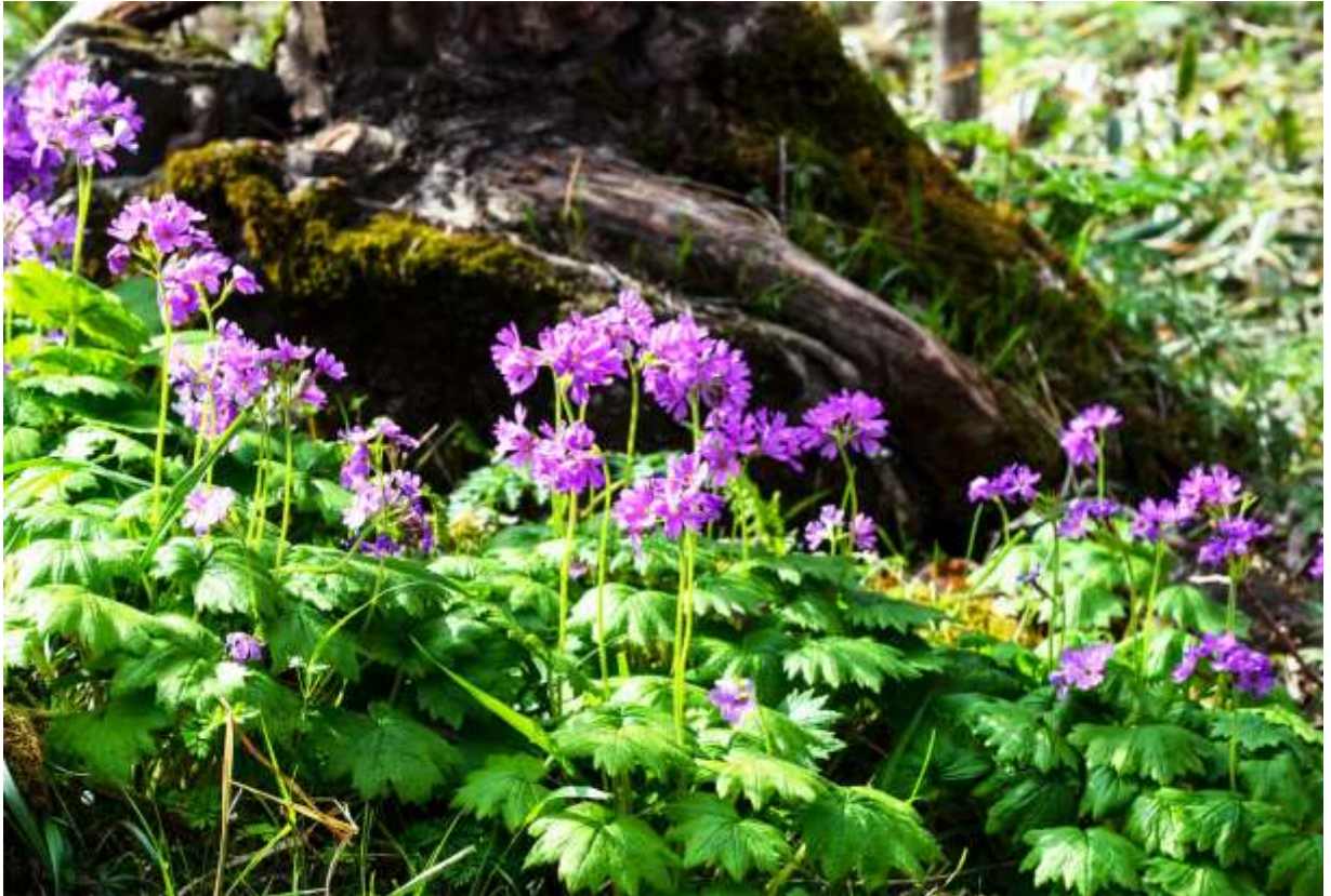
“Ezo-oo-sakura-sou” Family: Primulaceae / サクラソウ科 サクラソウ属

北海道東部と朝鮮半島に分布し高さ40cmになるサクラソウで、花茎、葉柄、葉裏に毛があることで基準変種のオオサクラソウと識別できる。日本のサクラソウ類の代表とされるサクラソウ (p.45) と比べると、エゾオオサクラソウのモミジ型の葉は品がよいし、花序の様子も数段上に思える。この変種は十勝地方と道東の海岸から標高1000m位まで分布し、北海道西部以南にあるオオサクラソウとは分布域を違えるが、一部には両方が混在するところもある。大きさ2cmほどの花は紅紫色で、花茎の上部に群がって付く。花色は暗めで鮮やかな色のものは少ないが、集まって咲くため斜面全体が紅紫色に見えることも珍しくない。広尾町の海岸林の下に自生する群落は規模も多く、オオバナノエンレイソウ(p.50)の白い花とのモザイク模様が何とも美しい。◇2012.05.17 様似町