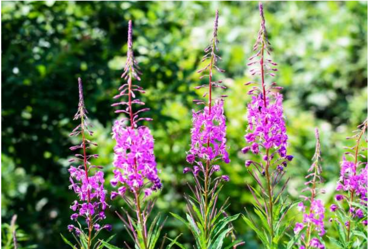
“Yanagi-ran” Family: Onagraceae / アカバナ科 ヤナギラン属

北半球北部の寒冷地に広く分布する草丈1~1.5mの多年草で、国内では中部地方以北の本州と北海道に生える。山火事後に大群落を作ることから、英語で Fire weed と呼ばれるように、パイオニア植物の典型である。柳に似るといわれる葉は長さ5~18cmで互生する。ランを思わせるとされる花の径は2~4cmで、長さ10~45cmになる総状花序を下から順に咲き上がる。花卉は4枚で鮮やかな紅紫色が美しい。道内では低地や山地の裸地に生えて、道路脇の崩壊斜面で群落を作ることが多いが、かつて信州の美ヶ原高原で見られたような大きな群落にはならない。しかし、なんと言ってもすごい景色は周北極地方にあり、アラスカやスカンジナビアの野山を真っ赤に染めるヤナギランの大群落は、ただただ圧倒されるのみの大迫力だ。◇2012.07.23 遠軽町、上白滝