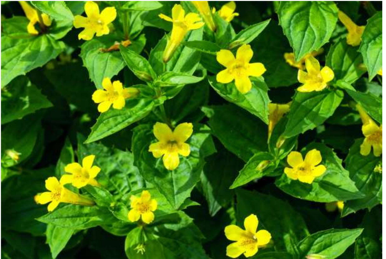
“Ooba-mizo-hoozuki” Family: Phrymaceae / ハエドクソウ科 ミゾホオズキ属

中部地方以北の本州と北海道に生える高さ10～50cmの多年草で、北方への分布は南千島からサハリンまでをカバーする。道内では、山地帯～亜高山帯の溪流沿いや湿地に群生することが多い。長さ3～8cmほどの葉は柄が無く鋭い鋸歯がある。大きく先が開いた筒状の花は正面から見ると平たくつぶれた形をしており、内部に赤い斑点と黄色い毛が多数ある。開花直前の蕾はあちこちが角張った面白い形だ。果実は細長い、ほおずきの実に似ているのが和名の由来だという。水のきれいな沢沿いで大きな花畑を作る割には名前が知られておらず、写真を撮っていると登山者からよく名前を聞かれる。日本アルプスでもよく見かける花だが、道内では特大の群落があちこちで溪流の崖を飾っており、形の良い葉と相まって絶好の撮影対象となる。◇2010.06.27 雨竜町