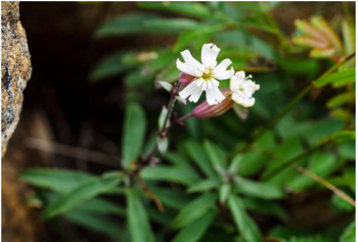
“Apoi-mantema” Family: Caryophyllaceae / ナデシコ科 マンテマ属

太平山に生えるカラフトマンテマの変種で、日高地方のアポイ岳に特産する絶滅危惧IA類の多年草。草丈は10～25cmで、茎と葉は紫色を帯びる。対生する葉は長さ2～4cmの線状披針形。茎先に数個の花を横向に付けるが、萼筒は少し膨れた円筒状で、紫色の筋が10本ある。萼筒の先に径1.5cmほどの花を平開する。花弁は5枚で先が2浅裂し殆ど白色だが淡紅色のものもある。また、花弁の基部に一對の付属物があり、水平に繋がりあって10弁の副花冠となる。この花は夜に咲く一日花で、綺麗な花を見られるのは、朝早くか曇った日の午前中に限られる。道内では帰化植物のマツヨイセンノウなどが路端で多く見られるが、日本の山に生えるマンテマ属の在来種は地域限定の希少種が殆どだ。この変種は、その中では最も容易に観察できるものの一つである。◇2011.08.04 様似町、アポイ岳