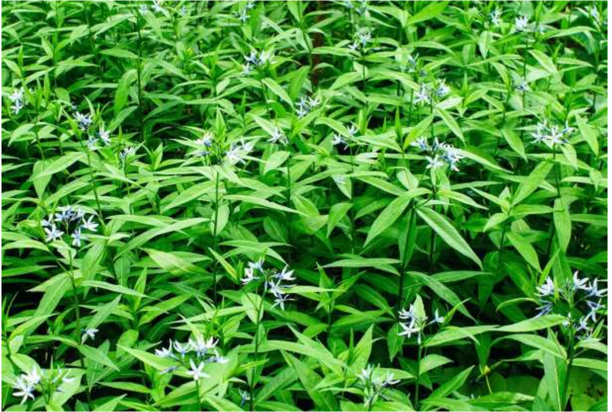
“Chouji-sou” Family: Apocynaceae / キョウチクトウ科 チョウジソウ属

低地帯の少し湿った林内や草地に生える高さ40～80cmの多年草で、四国以外の国内各地と、朝鮮半島や中国に分布する。国内での生育地は比較的限られているが、生えているところでは群落をなすことが多いようだ。写真を撮った林内の群落では、花よりもすっきりした感じの細長い葉が群れる様子に先ず目が行った。日当たりの良いところでは、沢山の花がついて葉が見えないほどの記述もある。互生する葉は長さ6～10cmの披針形で、柄が殆ど無くて全縁である。青紫色の美しい花は筒状で先が5深裂し、裂片は大きく開いて径1.3cmほどになる。花の形がチョウジ(Clove)に似ているからといわれるように、花冠の下部は細い。咲いている場所が場所だけに、この花の写真を撮るには、群がってくる蚊との戦いは避けられない。◇2006.06.18 札幌市、北区屯田