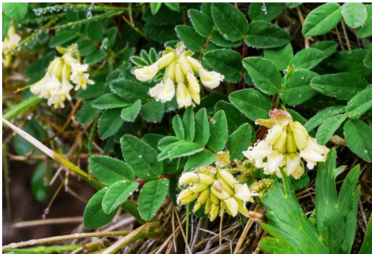
“Rishiro-ougi” Family: Fabaceae / マメ科 ゲンゲ属

北半球の寒帯から亜寒帯に分布する草丈10~30cmの多年草で、国内では利尻山、大雪山系と中部地方の一部に分布する。葉は奇数羽状複葉で、長さ1~3cmの狭卵形の小葉が3~6対ある。花は長さ1.5cmほどの蝶形花で、茎上部に5~10個かたまって総状花序になる。ゲンゲ属は北半球の温帯を中心に分布して約3000種にもなる大きな属だが、国内に自生するのは11種に限られる。また、国内には“オウギ”と名のつく植物が数種あるが、イワオウギ(B:p.186)はゲンゲ属ではなくイワオウギ属の植物である。イワオウギ属の花はゲンゲ属の花と一見似ているが、果実の形は全く違う。道内には全部で7種のゲンゲ属が自生するが、5種は黄白色の花をつけ、2種は紫色の花をつける。イワオウギ属は2種あり、黄白色と紫色の花が1種ずつである。◇2012.07.05 利尻富士町、利尻山