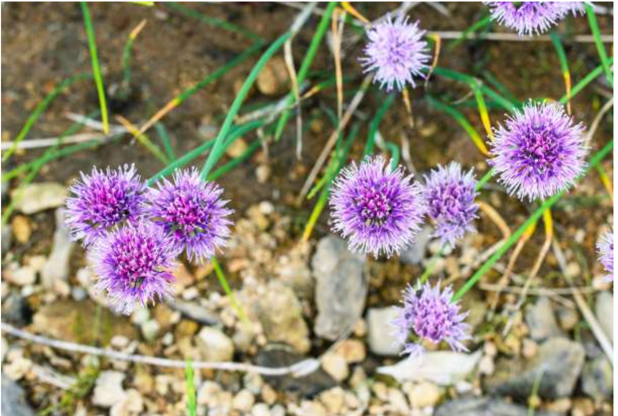
“Shirouma-asatsuki” Family: Amaryllidaceae / ヒガンバナ科 ネギ属

一見してネギの仲間と分かる草丈20～60cmの多年草で、本州の近畿地方以北と北海道の高山帯に生えるが、特に蛇紋岩地帯に多い。国外での分布は朝鮮半島から東部シベリアまで。葉は円筒形で長さ20～35cm、直径は4～5mm。花茎は中空で、先端に径3～4cmのピンク色の円形～半円形の花序をつける。基準変種エゾネギは本州北部から北半球に広く分布し、欧米ではWild Chivesと呼ばれて栽培もされるし、山菜としての利用も盛んだ。シロウマアサツキは基準変種とよく似ているが、雄しべは花被片と同長か少し長く、花数も多くて見栄えのする花序をつける。夕張岳の稜線湿原にはシロウマアサツキの大きな群落があり、開花期には見事な景色となる。開花前の蕾もやはりピンク色で、ギボウシのような蕾がずらりと並ぶのが壮観で面白い。◇2012.07.30 夕張市、夕張岳