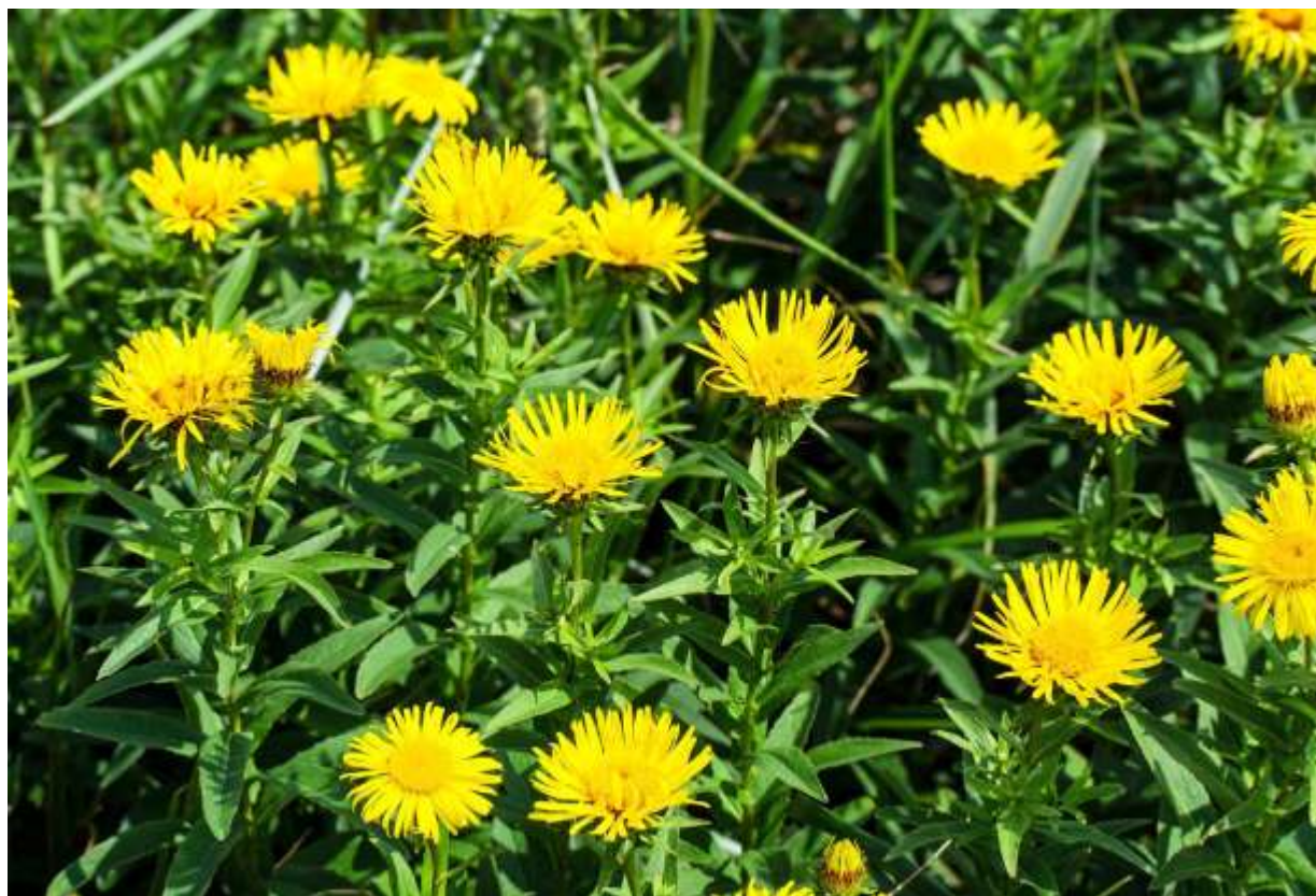
“Kasen-sou” Family: Asteraceae / キク科 オグルマ属

日本全土の海岸から山地にかけての日当たりの良い所に生える多年草で、草丈は30～80cmと生育環境によって変わる。「アジアの」という変種名が示すように、国外では朝鮮半島からシベリアまでの東アジアに広く分布する。黄花のキク科植物は数多いが、草丈が高すぎたり花の付き方がうるさかったりして魅力的なものは少ない。その中で、この頭花は径3～4cmと頃合いの大きさで、筒状花と舌状花のバランスも良く、草丈も頃合いで魅力的な植物の部類に入る。夏の海岸の草地で群落となり、この花が上向きで一斉に咲いていると、結構見栄えのする風景である。よく似た近縁種のおグルマと比べると、総苞片の形が違い、より乾燥したところに生えるという特長がある。漢字では「歌仙草」と書くが、この風流な名前の由来については定説が無いようだ。◇2012.07.27 寿都町、弁慶岬