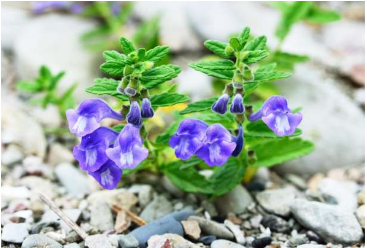
“Nami-ki-sou” Family: Lamiaceae / シソ科 タツナミソウ属

日本全土の海岸草地や砂浜に見られる多年草で、草丈は生えている環境によって10～50cmと変化する。国外では朝鮮半島からロシア東部まで分布するようだ。波が来るような所に生えるから浪来草、という和名の謂われはよく知られているが、海岸はもとより、山地の路端でも見られる。後者は人為的に拡散したものだだろう。長さ2～2.5cmほどの花は茎の上部で2個が同じ向きに並んでつき、鮮やかな青紫色の地に2本の白っぽい筋模様が粹だ。沢山の花芽があり下から順に咲き上がるので、花より下部には対になった鼓状の実が整然と配列し、上部にはいろんな成長段階にある蕾が並んで開花を待っている。花の時期は長く、初夏から秋の終わりまで咲いているが、盛期は初夏の頃だろう。とにかく葉も花もかわいらしく、順番待ちの行儀もよい優等生という感じである。◇2013.07.22 様似町