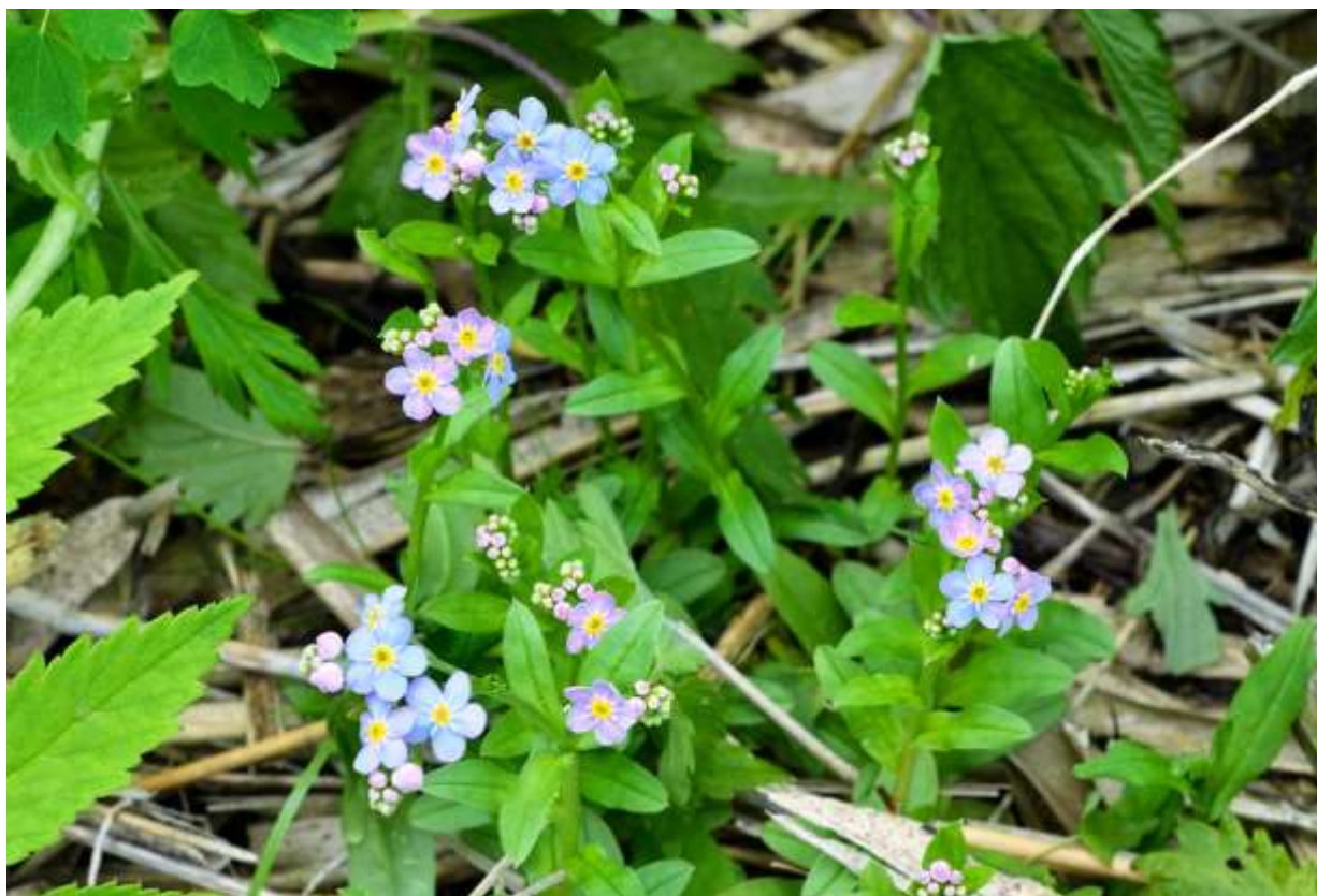
“Ezo-murasaki” Family: Boraginaceae / ムラサキ科 ワスレナグサ属

山地の湿ったところや沢沿いに生える草丈20~40cmの多年草で、ユーラシア大陸の亜寒帯や北アフリカに広く分布する。一般的に「忘れな草」と呼ばれる仲間では唯一の日本自生種で、国内での分布範囲は本州の中部地方以北と北海道に限られる。この仲間は誰でも知っている植物であり、巻いた花序を伸ばしながら基部から順に青い花を咲かせるが、蕾と咲き始めの花は赤紫色だ。花冠は5裂して裂片は平開する。国内では、園芸用に輸入されたヨーロッパ産の狭義のワスレナグサやノハラムラサキも広範囲に野生化している。これらは全体の印象がよく似ており、一見して見分けるのは難しいが、エゾムラサキの花は径6~8mmと大きくて平開し、萼には立ち上がった鉤状の毛があることで識別できる。 ◇2011.06.16 浜中町、霧多布湿原