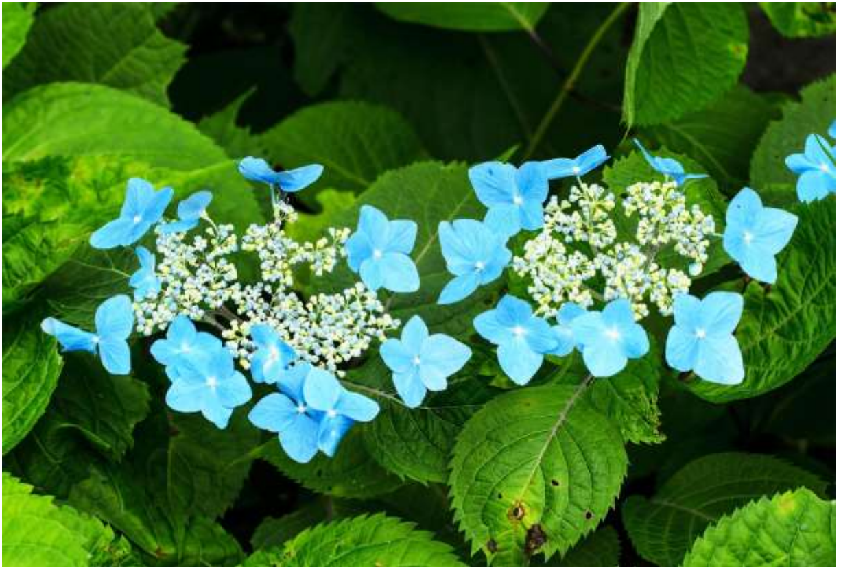
“Ezo-ajisai” Family: Hydrangeaceae / アジサイ科 アジサイ属

北海道と北陸地方以北の本州の日本海側に分布する日本固有の落葉低木で、山地の林内や谷間に生えて高さは2mにまでなる。アジサイは梅雨の花というイメージが定着しているが、道内のエゾアジサイは真夏の花だ。対生する葉は先の尖った楕円形で長さ10-17cmと大きく、ふちに荒い鋸歯がある。枝先に散房花序をだし、中心にある多数の小さな両性花を装飾花が取り囲む。装飾花は径が3~4cmほどで、3~5枚ある萼片は鮮やかな青色、中心の両性花も淡紫色が目立って実に美しい花である。装飾花の花色に多少の変異はあるが青味の強い花が圧倒的に多く、雨時には色が際だって特に印象深い。日本には多くのアジサイ属の種が自生するが、北海道にあるのはこの品種のみ。白い花をつけるノリウツギとツルアジサイは、平凡社図鑑では別属となった。◇2011..08.02 雨竜町、雨竜沼湿原