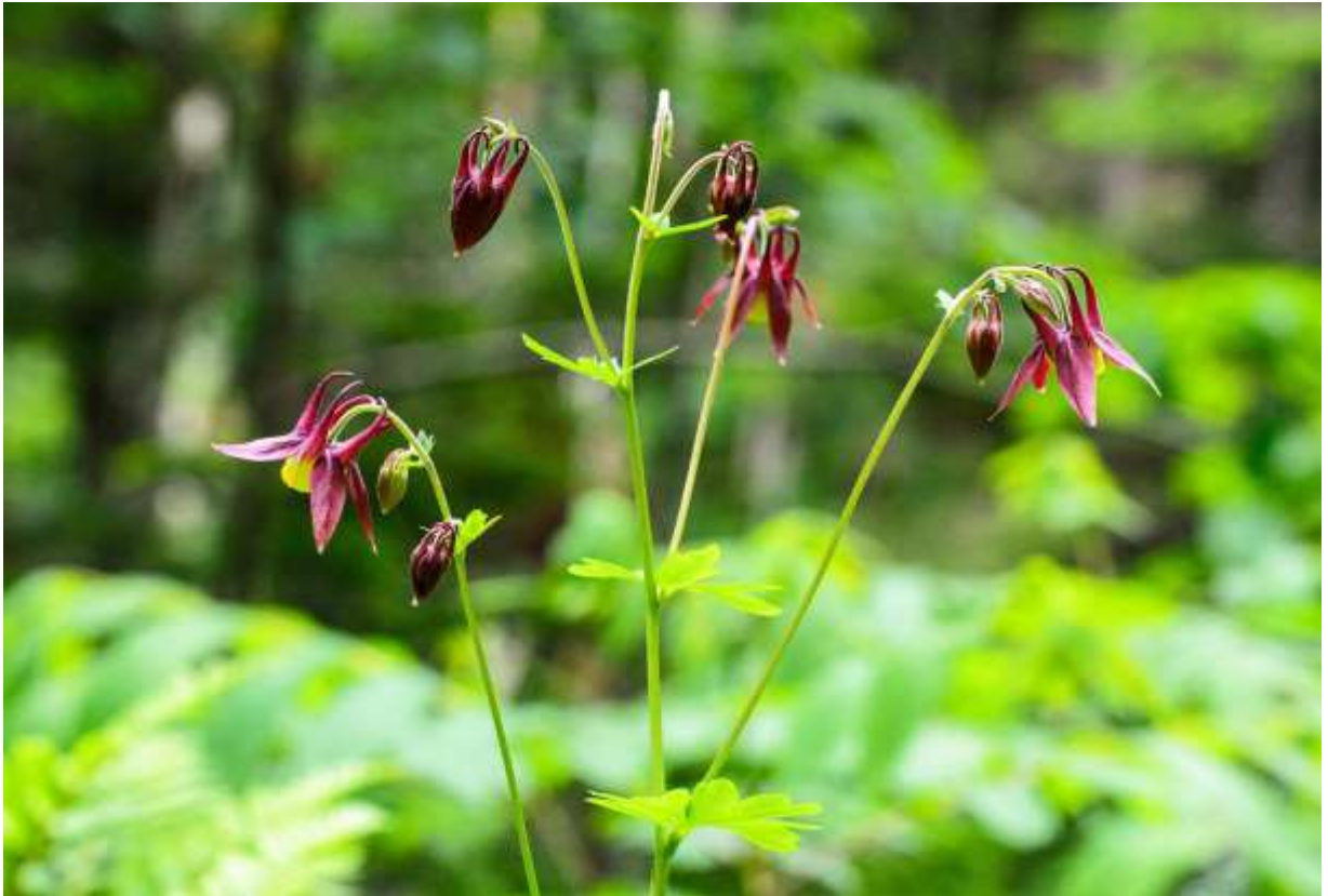
“Oo-yama-odamaki” Family: Ranunculaceae / キンポウゲ科 オダマキ属

日本全土と朝鮮半島からシベリア東部にまで分布する草丈40～80cmの多年草で、山地の林内や道ばたの草地に生える。葉はオダマキ属に特有の艶のある2回3出複葉で、花が無くても美しいが、花は花でまた格別の器量好しである。下向きに咲く花は直径が3～4cmで、赤茶色～紫茶色の萼片が5枚ある。筒状に纏まる淡黄色の花弁5枚は長さ12～15mmで、後ろに突き出す距は内側に巻く。道内では、距が巻き込まない基準変種ヤマオダマキよりは、こちらの方が数が多いようだ。派手な配色で庭植えにされることの多い近縁種ミヤマオダマキ（次頁）よりは萼片の幅が狭く、茶色い萼片とクリーム色の花弁の組み合わせは渋い美しさだ。この花に関しては、沢山花をつける背の高い大株よりは、少数の花をつける小型の株の方が好ましい。◇2014.06.14 置戸町