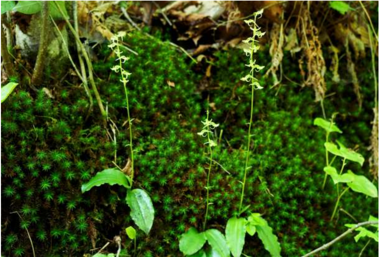
“Jinbai-sou” Family: Orchidaceae / ラン科 ツレサギソウ属

北海道西南部から九州にかけて分布する日本固有の多年草で、低地～山地帯の樹林下に生え、草丈は20～40cmになる。茎は細長く、基部の近くに長さ5～12cmの長楕円形の葉が対生状に互生する。この葉には短い葉柄があって表面には艶があり、縁は波状に縮れる。茎には小さな鱗片状の葉数個がまばらに互生し、茎の上部には5～10個の花が穂状につく。花期は8～9月で、国内にあるツレサギソウ属の種としては最も遅い。花は緑白色で背萼片と側花弁は長さ5mmほど。側萼片は披針形でそれより少し長い。唇弁は長さ1cmほどの広線形で下方に強く彎曲する。距は長さ15～20mmで後方に突き出し、下方に緩く彎曲する。本属の他の種でもこの花と似たものが多いが、本種の根元にある大きな葉は特徴的で、開花前でもジンバイソウと分かる。◇2017.08.26 苫小牧市、樽前ガロー