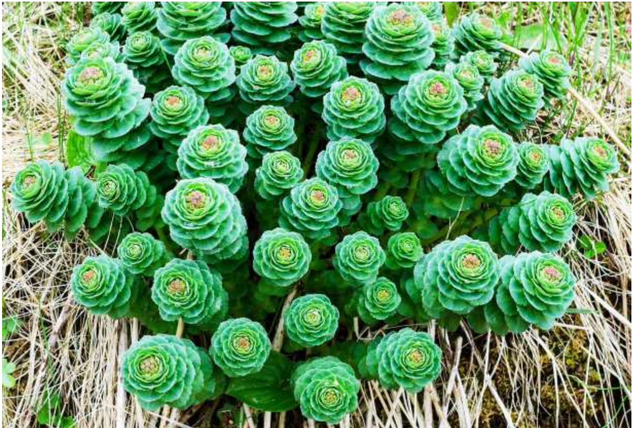
“Iwa-benkei” Family: Crassulaceae / ベンケイソウ科 イワベンケイ属

北半球の寒冷地や高山に広く分布する多年草で、国内では中部地方以北に自生する。岩場に生えるという名前だが、道東の海岸では岩場のみならず土の上にも普通に生えている。ベンケイソウ属の常として雄花と雌花があり、黄色い雄花は賑やかに展開して結構美しい。しかし、ここで本種を取り上げたのは花の美しさからではなく、何本も立ち上がった茎と葉の集団としてのユニークな構成から。写真は花が開く前のもっとも印象的な段階のもので、草丈は10cm以下であるが、花が開く頃になると草丈が30cmにもなり、葉と葉の間が間延びして魅力が色あせてしまう。鋸歯状の肉厚の葉が密に重なった様子と青緑色の色合いはびっくりするほど美しく、北海道の早春の海岸植物の中では一番の別嬪さんとして、私のお気に入りである。◇2011.05.20 根室市、ノッカマップ