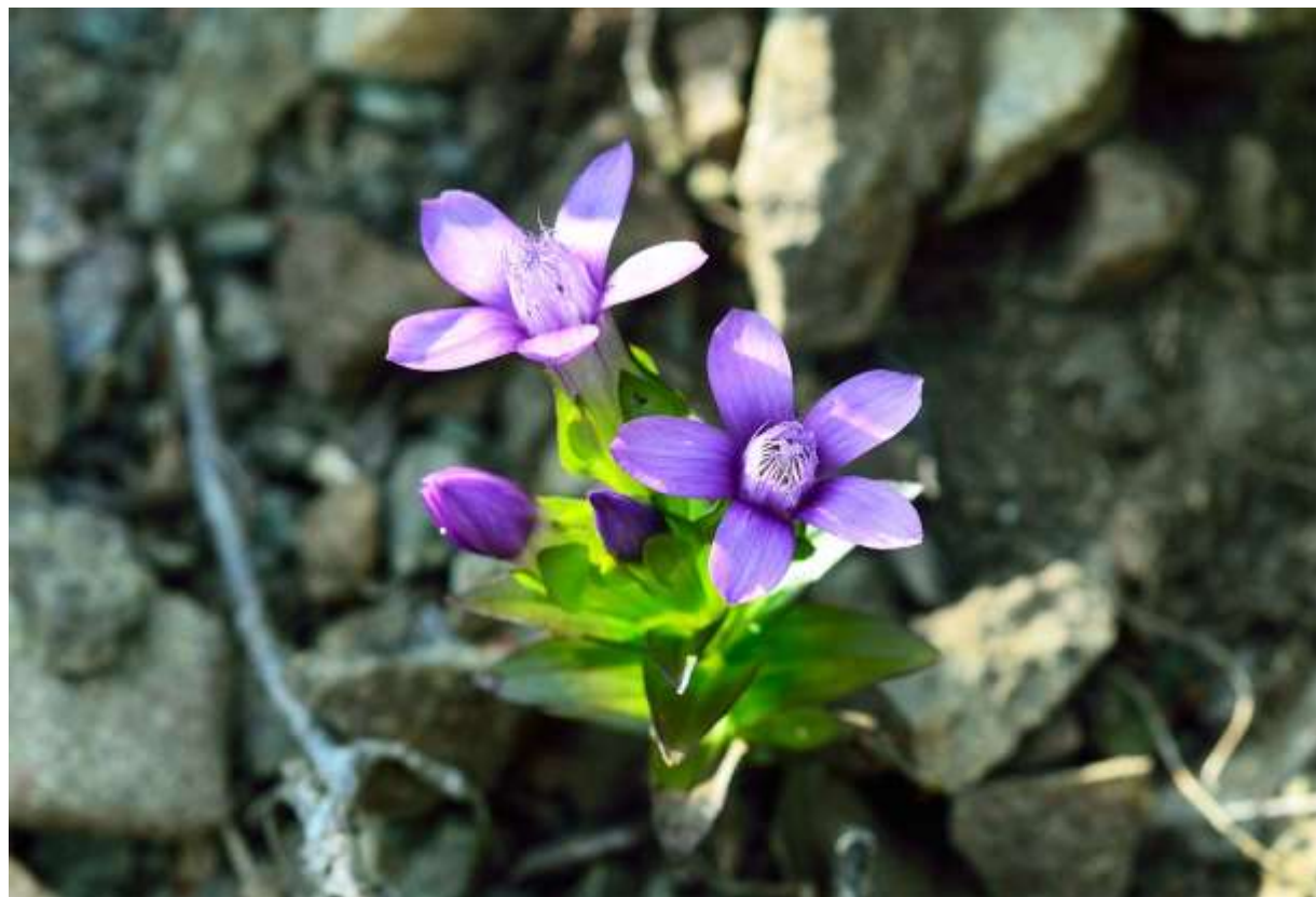
“Chisima-rindou” Family: Gentianaceae / リンドウ科 チシマリンドウ属

礼文島のれき地や草地に生える草丈5～20cmの2年草で、礼文島ではシーズン最後の花である。他には利尻島と道内日本海側の限られた山に生えるが、国外では千島列島、サハリンからアリューシャン列島まで分布する。チシマリンドウの茎は四角に角張っており、先が分岐して枝先や葉脇に一個ずつ花をつける。葉は対生し長さ1～3cmで先が少し尖る。筒状鐘形の花は長さ2～3cmで先が5裂し、裂片は平開する。花の中央部には糸状に細裂した内片がある。花の数は千差万別で、一株に2～3個しかないものから数十個つけるものまでと変化に富む。道内には同色のよく似た花を咲かせるリンドウが3種類あるが、生育地は重ならない。加うるに、本種の内片はユウパリリンドウ（前頁）ほど基部まで細裂しないし、オノエリンドウよりは花冠の裂け方が深い。◇2011.08.19 礼文島、礼文滝