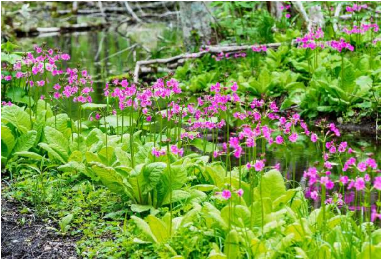
“Kurin-sou” Family: Primulaceae / サクラソウ科 サクラソウ属

留萌地方以南の北海道と近畿地方以北の本州に分布する日本固有の多年草で、草丈は40～70cm。長さ40cmにもなるへら状の葉は明るい緑色で、表面にしわがあって縁が内側に巻き込む。大きな葉が根元に集まって展開する様子はサクラソウ(p.45)そっくりだが、花がなくてもその大きさからすぐクリンソウと分かる。花茎の上部には輪生する花が3～7段つき、下段より順次咲き上がる。横向に咲く5弁花は紅紫色～淡紅色だが、のど元の色が濃い。クリンソウはエゾシカが嫌うため近年とみに数を増やしており、道東の沢沿いや林道脇などでは驚くほど大規模な群落となっている。美しい花をつける野草が増えるのは結構なことだが、エゾシカに食われて他の植物が激減していることの反映とあれば、喜んでばかりはいられない。◇2015.05.22 えりも町