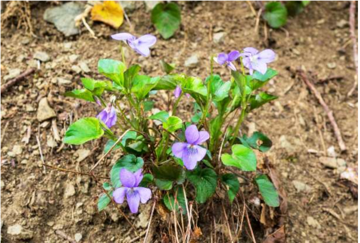
“Ainu-tachitubo-sumire” Family: Violaceae / スミレ科 スミレ属

中部地方以北の本州と北海道に分布する草丈5～25cmの多年草で、山地帯の草地や礫地、明るい広葉樹林内に生える。国外では朝鮮半島、中国東北部、極東ロシアなどに分布する。茎は数本群がって立ち上がり、分岐する。葉は長さ2～6cmの円心形で波状の鋸歯があり、上面は艶があって下面は紫色を帯びることがある。花は淡紫色～赤紫色で、径は2cmほどだが、花弁の形は細いものから丸みのあるものまで変異が大きい。花弁の長さは10～15mmで、側花弁の基部には白毛が密生する。唇弁の距は白色で長さは4～6mmほど。アポイタチツボスミレは、道内の塩基性岩地帯に適応した変種である。本種は数の多いタチツボスミレとよく似ているが、距が紫色ではなく白色なのと、側花弁に毛があること見分けがつく。距が白いオオタチツボスミレは側花弁に毛がない。◇2012.05.14 函館市、函館山