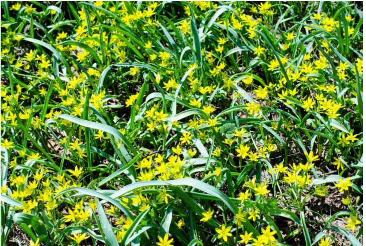
“Kibana-no-amana” Family: Liliaceae / ユリ科 キバナノアマナ属

ユーラシア北部に広く分布する草丈20cmほどの多年草で、国内では北海道、本州、四国の低地から山地に生えるが、道内では人里近くで大きな群落となることが多い。根元から1本生える線形の葉は白っぽい青緑色で、長さは15~35cm。これまた根元から1本伸びた花茎の先に、径2.5cmほどの黄色い6弁花が3~10個咲く。キバナノアマナの英語名は「ベツレヘムの黄色い星」だそうだが、クリスマスツリー上部の星は五角星が普通ではなかったっけ？ 六角星ならダビデの星じゃないかとも思うが、特に詮索する必要もなかりょう。この花は、北海道の黄色い春の花の代表格で、ゴールデンウィーク頃の北大構内では、「ここは一体どこだっけ」と思わせるほど多くの自生株が出現し、地表が見えなくなるほど大量の花を咲かせている。◇2011.04.30 札幌市、北海道大学構内