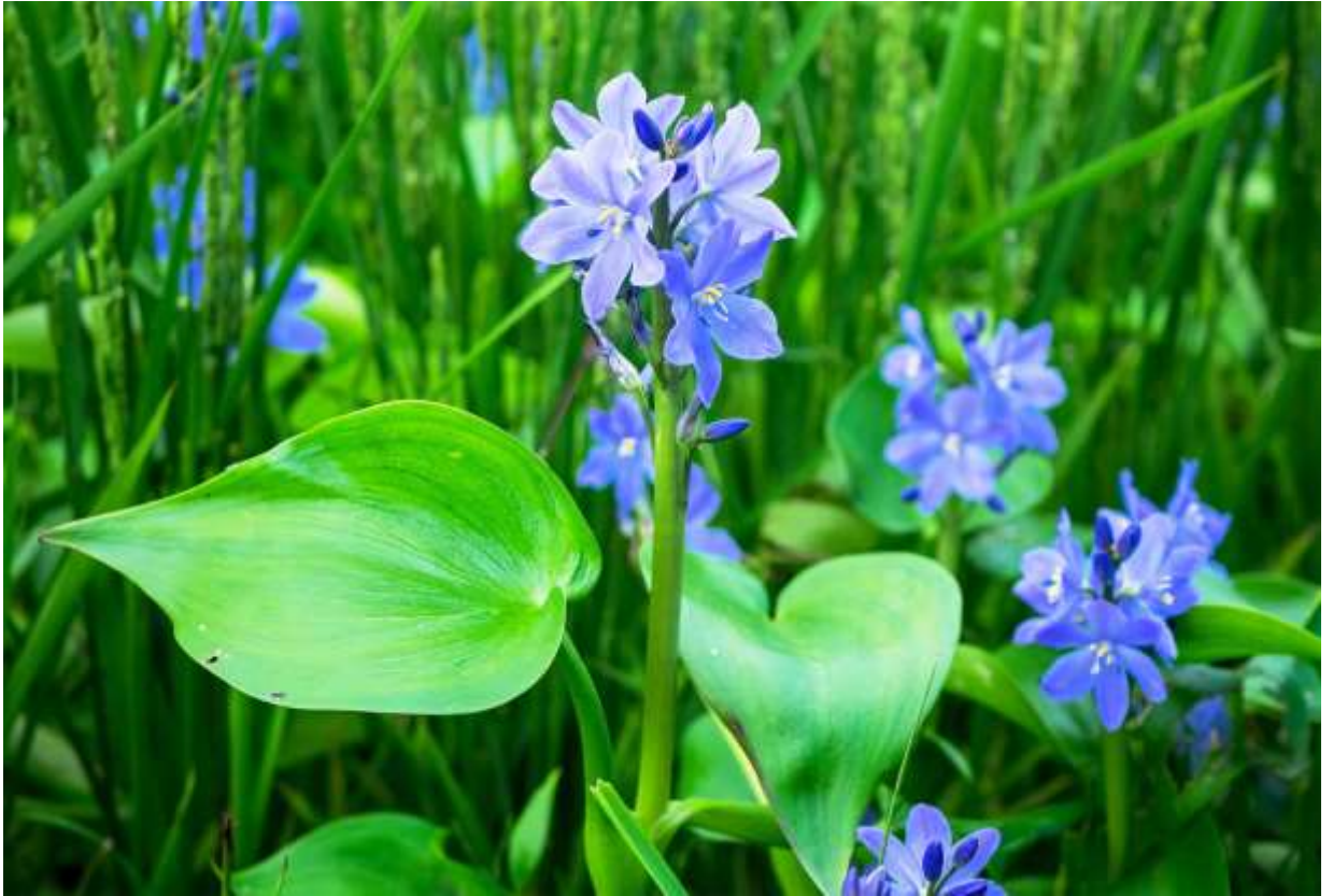
“Mizu-aoi” Family: Pontederiaceae / ミズアオイ科 ミズアオイ属

日本全土を含む東アジアに広く分布し、水田や低地の水辺などに生える1年草。草丈は30～70cmになる。根生葉には長さ10～20cmの長い柄があり、先の尖った円心形で、厚みと光沢のある葉身の長さは5～20cm。茎葉はより小型で葉柄も短い。葉より上に総状の花序を出し、径2.5～3cmの美しい青紫色の花を横向に平開する。花被片は6枚あり、内花被片の方が外花被片より幅が広い。雌しべは1個で雄しべは6個あるが、そのうちの1個だけが下側に垂れて青紫色の葯をつけ、残りは黄色の葯をつけるのが面白い。花は1日花で花序の下から咲き上がるのだが、蕾の数が多いので同時に咲いている花数も多く、群生する所では目にも鮮やかな花景色となる。除草剤の使用で激減したといわれるが、一部の水田では最近数が増えているように思える。◇2018.08.26 当別町