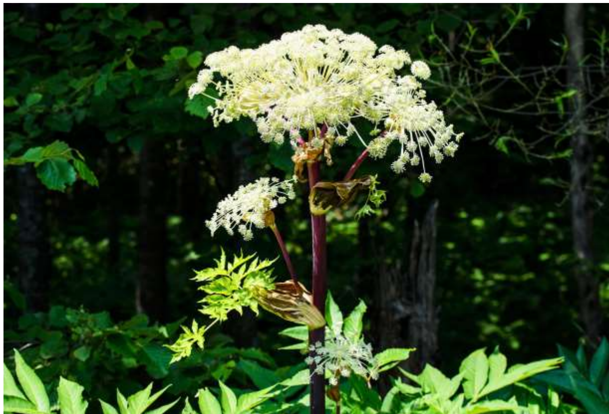
“Ezo-nyuu” Family: Apiaceae / セリ科 シシウド属

北海道と中部地方以北の本州に分布する巨大な多年草で、高さ3m以上にもなる。生育環境は海岸草地から山地までと広く、国外では千島、サハリン、カムチャッカ半島に分布するという。とにかくその存在感は威圧的ですからあり、大型のセリ科植物の多い草原でも他を圧倒してそびえ立つ。赤みを帯びた太い茎は中空で直径10cm近くにもなり、その頂部に大きな蕾を付けるので開花する前から目を引く。蕾を覆う大きな鞘に見られる大胆なしわ模様はグロテスクなほどドラマチックだが、開花直後にしおれて、はがれ落ちてしまう。開花後の花序も当然巨大で、打ち上げ花火のスターメインが今まさに広がらんとする風情だ。しかし、全体の様子はセリ科に共通するもので特筆するほどではなく、エゾニュウの面白さは開花直後までであろう。◇2012.07.23 遠軽町、上支湧別