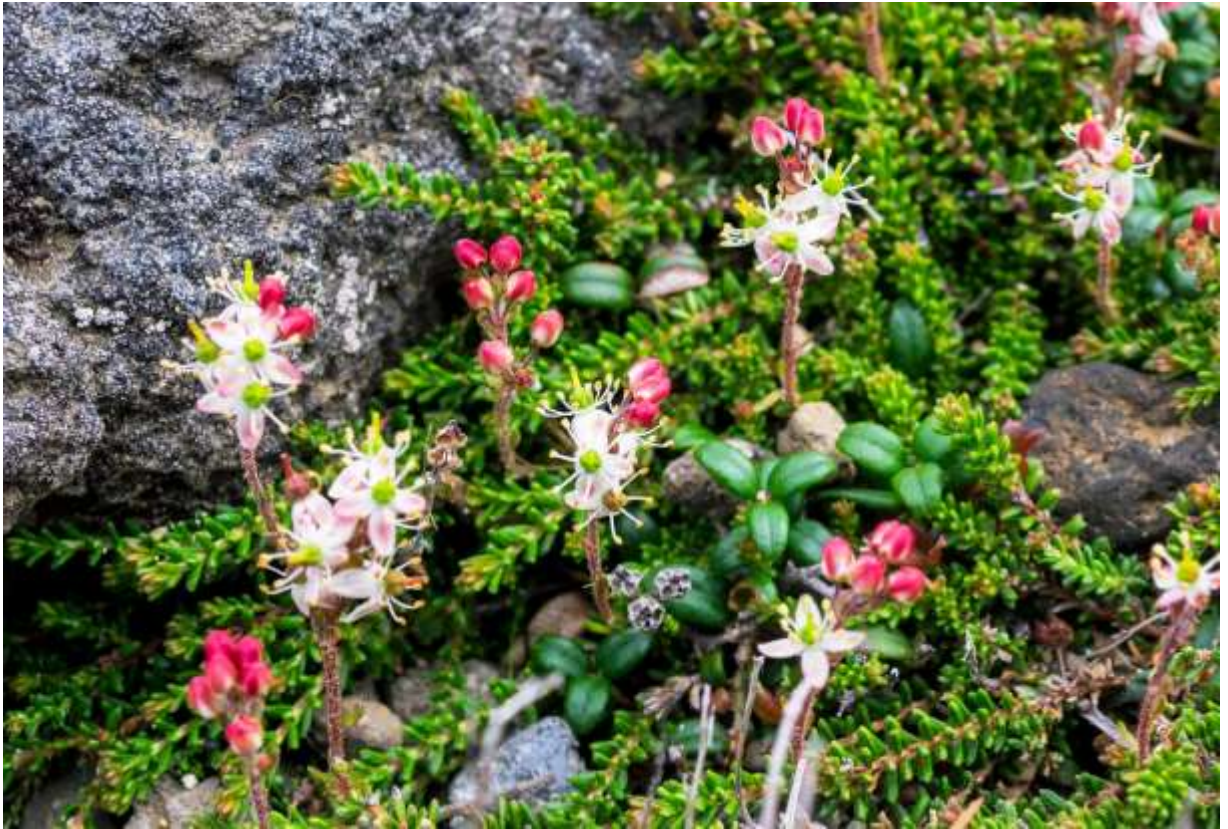
“Chishima-tsuga-zakura” Family: Ericaceae / ツツジ科 チシマツガザクラ属

本州北部からカムチャッカ半島まで分布する 1 属 1 種の常緑小低木で高さは2~7cm、サハリンにはないという。本州の自生地早池峰山と八甲田山ではそれほど多くはないが、大雪山では風の強い稜線に大きな群落を作ってマット状に広がっている。ツガザクラという名前は共通でも、この花はアオノツガザクラ(p.191)やコエゾツガザクラ(p.192)のような壺状ではない。大きさが7mmほどのユニークな花は、花冠が基部まで裂けて4枚の花弁状になり、8本の雄しべが突き出してブラシのようにも見えるし、線香花火という表現もある。極めて小さい花ではあるが、白い花冠にあざやかな赤色の斑紋があることや、突き出した黄色の雄しべがダンディで、群がって咲く様子は結構目を引く。蕾が真っ赤なのもなかなかおしゃれな感じだ。◇2018.07.25 上川町、大雪山系赤岳