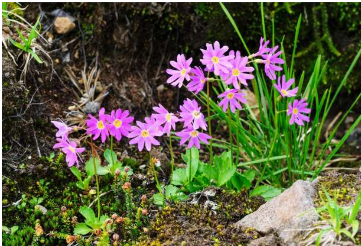
“Ezo-kozakura” Family: Primulaceae / サクラソウ科 サクラソウ属

北海道から北米の北太平洋周辺域まで分布する草丈10~20cmの多年草。日本にはサクラソウ属が25種類ほど自生しており、ピンク色の花をつけるものが多いがどれも美しい。その中でも国内での個体数が一番多いのはこのエゾコザクラではなかろうか。道内の高山で雪田が融けたあとに群がって咲き、目にも鮮やかなピンク色のカーペットを広げる。根元に集まった艶やかな葉からすっきり伸びた花茎の先につく花は径2~2.5cmで、5つに深裂して平開し、その先は浅く2分裂する。花の中心（喉部）は鮮やかな黄色でよく目立つ。花色は濃淡様々のピンク色で個体差が大きい、殆ど赤色といっても良いものもある。淡いピンク色のコエゾツガザクラ(p.192)と並んで群落を形成し、北海道の夏山風景を代表する花といえよう。◇2008.07.20 大雪山系北海岳