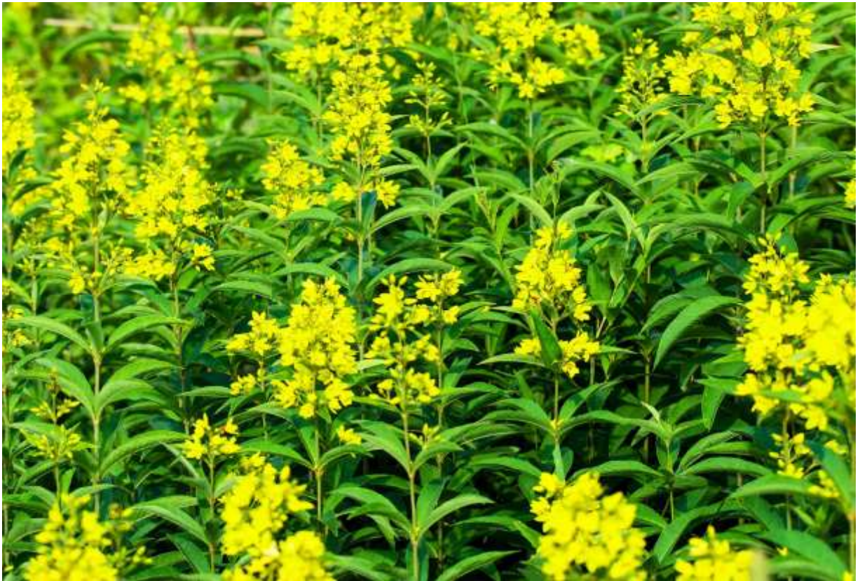
“Kusa-redama” Family: Primulaceae / サクラソウ科 オカトラノオ属

高さ1mにもなる大型の多年草で湿地に生育し、四国を除く日本各地と東北アジア一帯に分布する。道内では湿原や道路脇で普通に見られる。輪生又は互生する葉は長さ4～12cmの先の尖った長楕円形で、背の高い茎に整然と多数つき、花の方も茎の上部でそれに負けないくらい多数咲く。黄色い5弁の花は平開せず中央部の突起が面白い。花の直径は1.5cmほどと大きくはないが、何せ背の高い茎につく花数が多いのと、湿原に群生することが多いので、夏の盛りを象徴する景色として記憶に留まる。惜しむらくは花色がおとなしいことで、もう少し派手な黄色だったら印象も強まるだろうに。クサレダマという名前は、熱帯で栽培される「マメ科木本のレダマに似た草」という意味だそうだが、江戸時代の命名者のセンスのなさにあきれる。◇2012.07.28 蘭越町