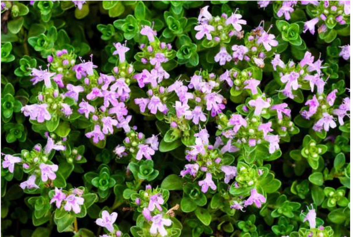
“Ibuki-jyakou-sou” Family: Lamiaceae / シソ科 イブキジャコウソウ属

これは高さ3~15cmの矮小低木で、ハーブとして知られるタイムの仲間である。北海道から九州北部まで分布するが四国にはない。国外では朝鮮半島とサハリンに分布する。光沢のある卵形の葉が十字対生し、茎上部に7~8mmのピンク色の花を密につける。変種名が伊吹山由縁であるように、本州では比較的高い山に生えるが、道内では低山でも見られ、礼文島では海岸近くの岩場に大きな群落を作っている。かつて地質調査で北イタリアの草地を歩いていたら、良いにおいがするので足下を見ると、タチジャコウソウの群落の中を歩いていた。中世のヨーロッパでは、行軍中の軍隊が肉塊をハーブでくるんで保存したというが、こんなに沢山あるのなら、さもありなんと納得した。残念ながら、日本には野生のタイムを刈り取れるような所はないだろう◇2011.08.04 様似町、アポイ岳