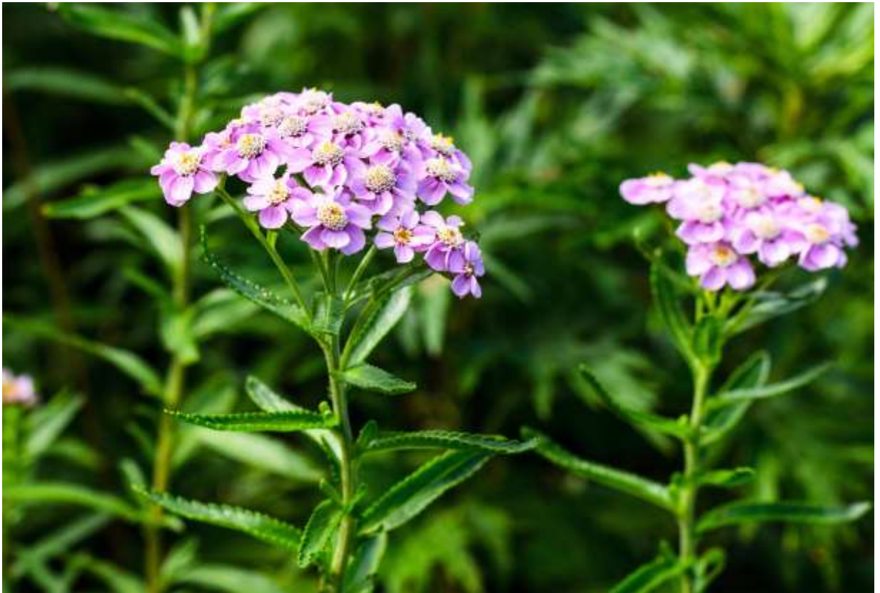
“Kita-nokogiri-sou” Family: Asteraceae / キク科 ノコギリソウ属

本州中部から北海道、南千島、サハリンに分布し、海岸から低山の草原に生える草丈30～70cmの多年草。茎葉は細長くて長さは5～10cm、細かく羽状に浅～深裂するが、切れ込みは別亜種のノコギリソウより浅く別種エゾノコギリソウよりは深い。これら3つの種と亜種はよく似ているが、葉の付け根に1～2対の葉片のあるのが本亜種の特長だ。頂部に多数つく頭花は径が10～15mmで、中心部の筒状花を6～8枚の舌状花が取り囲み、花色は白色から淡紅色まで変化する。ノコギリソウの仲間は国内に数種類自生するがあまり目立たず、一般的には園芸植物という認識だろう。しかし、道内では自生する種類も数も圧倒的に多く、道外からの訪問者には、道路沿いのあちこちで目にする赤いノコギリソウ類は新鮮な驚きとして目に映る。◇2012.08.09 えりも町、襟裳岬