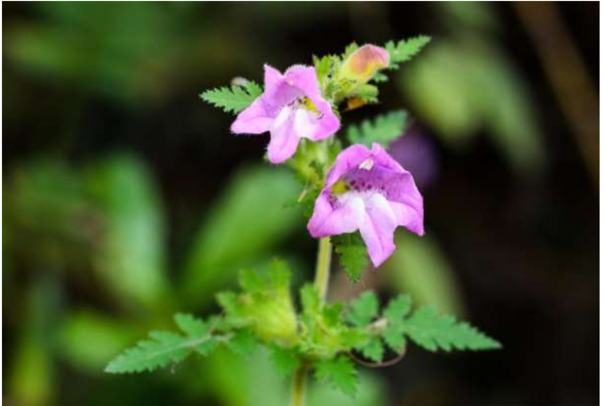
“Ko-shiogama” Family: Orobanchaceae / ハマウツボ科 コシオガマ属

北海道中央部から九州にかけて分布する草丈20～70cmの1年草で、低地帯～山地帯の日当たりの良い草地に生える。国外では朝鮮半島からシベリア南東部にかけて分布する。これはイネ科などの植物の根に寄生する半寄生植物で、直立する茎は多少分岐し、全体に腺毛が密生して触るとベタつく。対生する葉は長さ4～7cmの羽状複葉で、小葉はさらに不規則に裂ける。枝上部の葉腋に、鮮やかなピンク色の花を1個ずつ横向に咲かせるが、花は太い2唇形で花冠の長さは2cmほど。上唇は浅く2裂して縁が外に反り返り、下唇は上唇より長くて横に大きく広がり、先の方が3裂する。下唇の中央裂片には2筋の隆起部があり、白い毛が生えていて基部には紅紫色の斑点がある。黄色や白色の花の多い秋の野山では、この鮮やかな花はよく目立つ。◇2011.09.28 白老町、萩の里