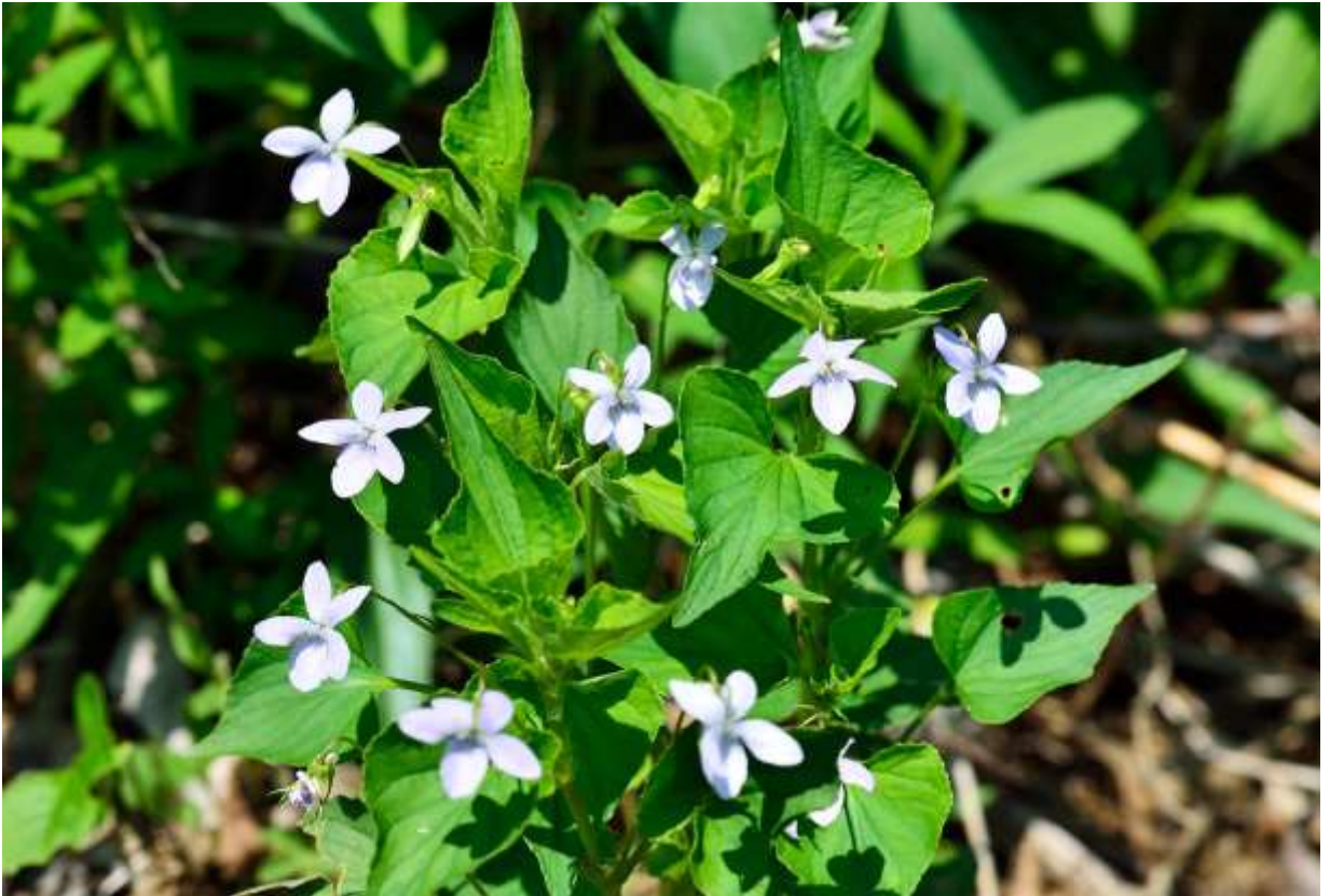
“Ezo-no-tachi-tubo-sumire” Family: Violaceae / スミレ科 スミレ属

地上茎があつて草丈が40cmほどになるスミレで、国内では岡山県以北の本州と北海道に、国外では朝鮮半島から極東ロシアまで分布する。茎の上部に付く葉は心形で大きく、長さは最大5.5cmになる、葉柄の基部には櫛の歯状に裂けた長さ3cmほどの托葉がある。茎の頂部に淡青紫色の花が数個付き、花の径は1.3~2cmほど。5枚の花弁の周囲は白味を帯びるが、写真の個体のように花全体が白色のものも結構多い。距は白色で長さ2~3mmと短い。高い草丈の割には小さい花だが、全体的な佇まいが良い。いろんなスミレ類が咲いている所を歩いていても、他のスミレ類とは雰囲気が違うのですぐに気がつくし、出会えば思わず足を止めて見入ってしまう。道内のスミレ愛好家の間でも人気の高いグループにランクインしているであろう。◇2012.05.31 苫小牧市、ウトナイ湖畔