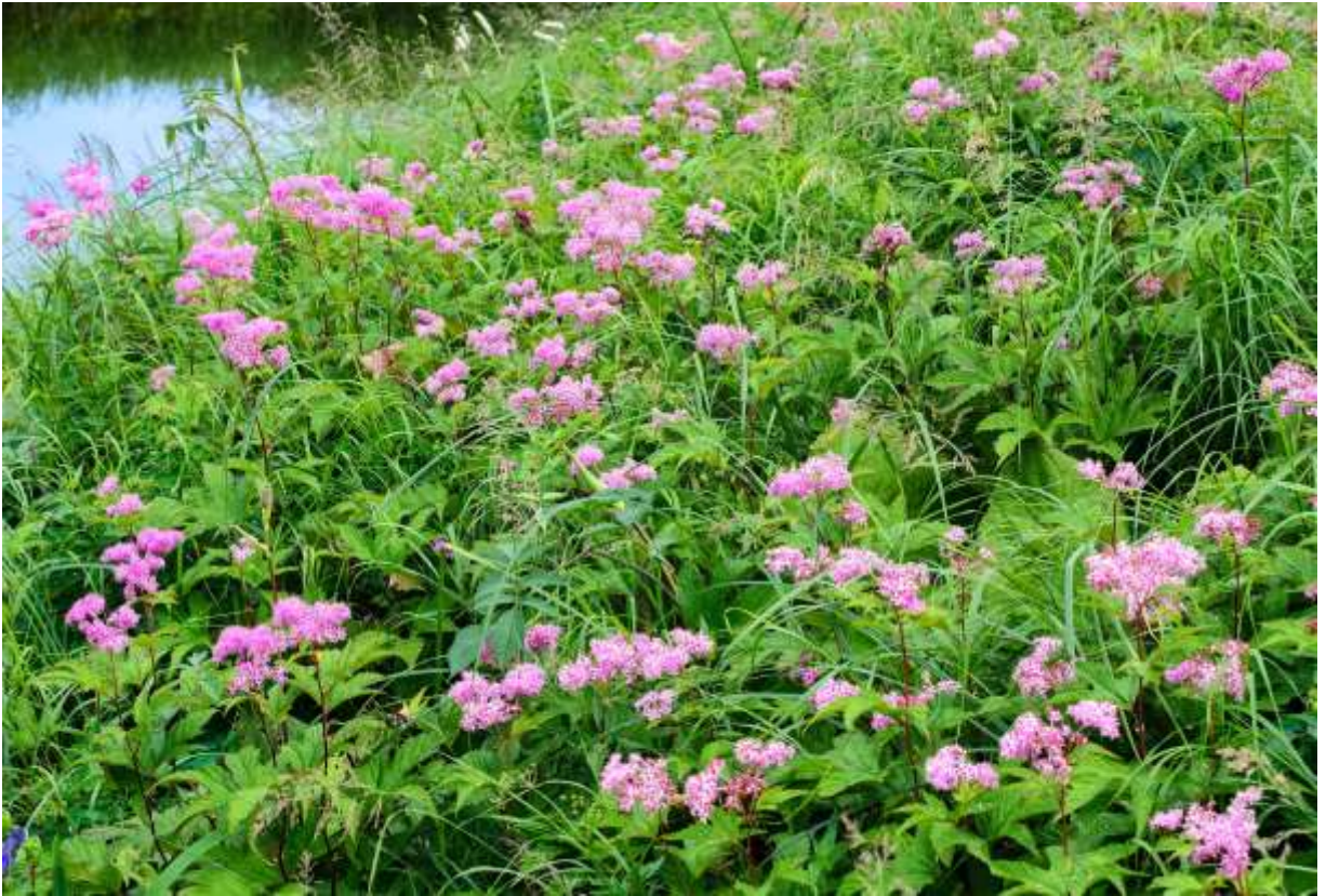
“Ezo-no-shimotsuke-sou” Family: Rosaceae /バラ科 シモツケソウ属

北海道の湿原に多い草丈1mほどの多年草で、ピンク色の小花が多数集まって綿菓子のような塊を数個着けるが、花色の鮮やかさは場所によって大きく異なる。雨竜沼湿原では特に濃いピンク色の株が多く、それが水辺を縁取って咲くので見事な夏景色となる。また、紫色のクガイソウ(p.159)と入り交じって咲くことも多く、その花模様はシモツケソウとクガイソウが入り交じって咲く信州の八方尾根と共通する。この花は茶花として利用される栽培品種のキョウガノコとそっくりだが、そちらの方は本州以西に分布するシモツケソウかその近縁種が起源とのことなので、本種とは別な種となる。一部のネット情報でこれを北海道固有とするものを見るが、日本の固有種ではなく、朝鮮半島北部から極東ロシアにかけても分布するという。◇2011.08.02 雨竜町、雨竜沼湿原