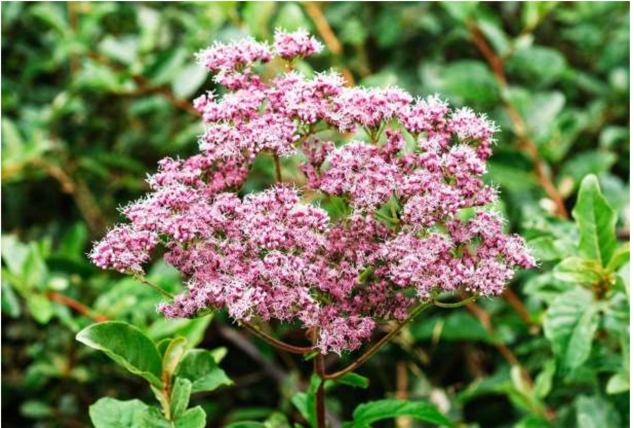
“Sawa-hiyodori” Family: Asteraceae / キク科 ヒヨドリバナ属

日本全土の日当たりの良い湿地に生える草丈40～90cmの多年草で、国外では中国から朝鮮半島を経て東南アジアまで広く分布する。葉はこの写真には写っていないが、細長く対生するものと、3全裂して6枚が輪生するように見えるものがある。茎は上部で分岐して散房花序をだし、多数の頭花がつくが、花の色は淡紅紫色から白色までと変異が大きい。筒状花の先は5裂し、2分裂した長い花柱が折れ曲がって長く伸びる。遠目には何かごちゃごちゃして変な花だが、近寄ってみれば、淡紅紫色の花と白っぽい花柱の入り交じっている様子が独特の雰囲気結構面白い。道内では、比較的乾いたところに生えるヨツバヒヨドリの方が圧倒的に多いが、花の美しさからするとサワヒヨドリの方に軍配が上がるだろう。◇2006.09.18 えりも町、百人浜