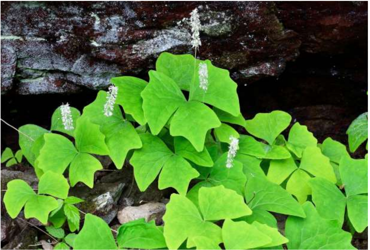
“Nanbu-sou” Family: Berberidaceae / メギ科 ナンブソウ属

北海道と東北地方北部に分布する多年草で、暗い林下の特徴的な葉は花のない時でも気になる存在だ。日本固有種とする説があるが、中国にもあるという情報もある。全体の作りはなかなかユニークで、根元から細長い葉柄と花茎が1本ずつ伸び、葉柄の先には3枚の小葉が付いて長さは5~7cmくらい。花茎の先にはヒトリシズカ(p.19)に似た花穂が付くが、弱々しくて目立つ花ではない。ナンブソウ属は小さなグループで、本種の他には北米西部に1種を数えるのみだが、これらを同一種とする説もあるようだ。北米の A. triphylla は英語名ではVanilla Leafと呼ばれ、乾いた葉を揉むとバニラのおいがるという。和名は想像できるとおりで、マキシモビッチの採取助手だった須川長之助が、岩手県の南部地方で採取したことによる。◇2012.06.08 占冠村、赤岩青巖峽