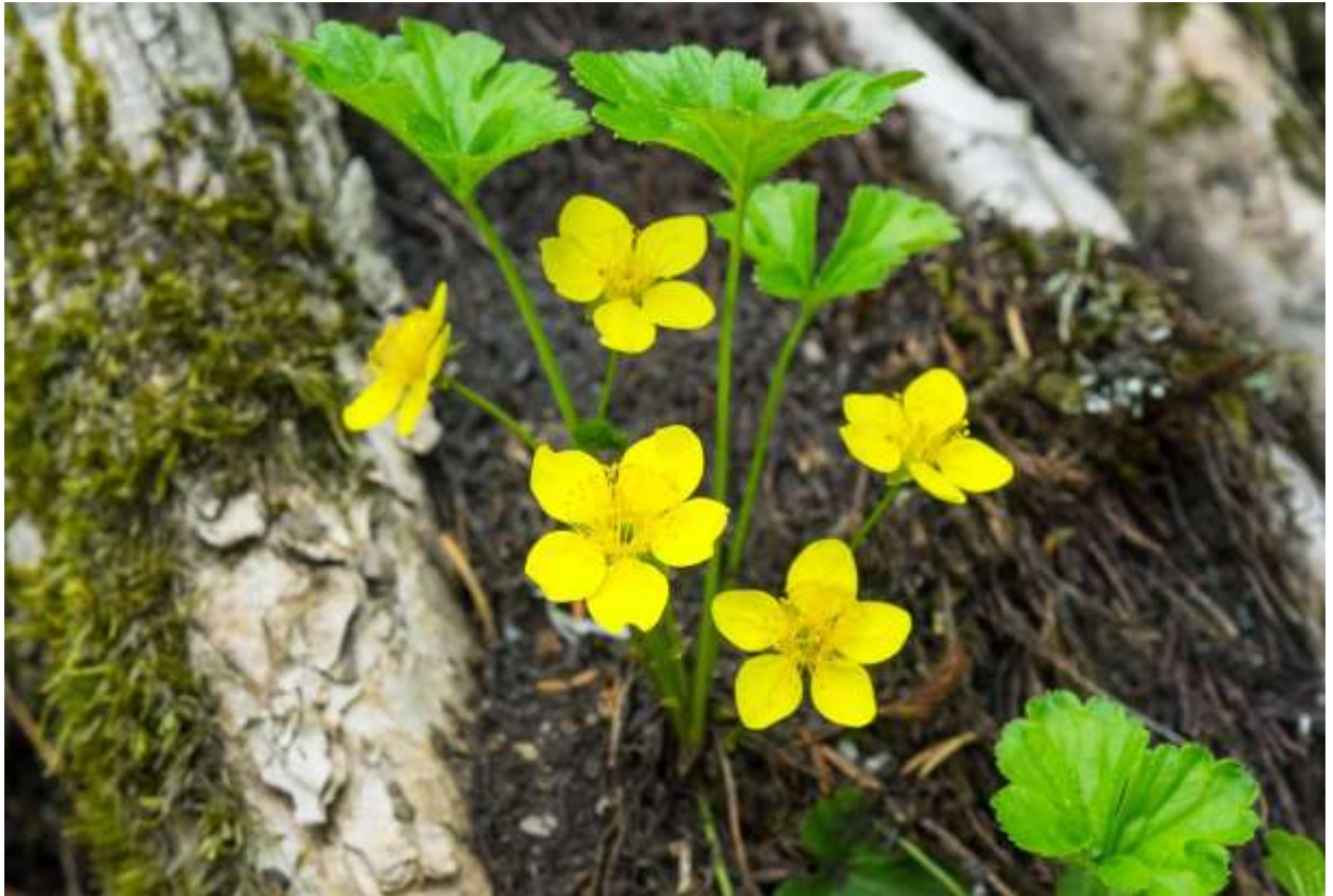
“Ko-kinbai” Family: Rosaceae / バラ科 ダイコンソウ属

近畿地方以北に分布する草丈15cmほどの多年草で、山地帯の明るい林下に生える。国外では、朝鮮半島からシベリア東部までの北東アジアに広く分布する。地中を細い根茎がはい、その先端から葉柄を出して群生することも多いが、一般的に花付きはまばらで、群落全体が黄色い花で被われることは少ない。葉は全て根生し、3~10cmもある柄の先に起伏に富んだ3出複葉をつける。小葉は長さが2~3cmのゆがんだ卵形で更に浅く3~5裂し、縁には荒い鋸歯がある。春の盛りに根茎の先から花茎を伸ばし、その上部に径2cmほどの黄色い5弁花を1~3個平開する。雄しべは多数あるが整った配列で、あまりうるさい感じがしない。新緑の色も鮮やかな形の良い葉と、端正なつくりの黄色い花の組み合わせは魅力的で、開花直後の花は特に美しい。◇2019.05.16 札幌市、白井川林道