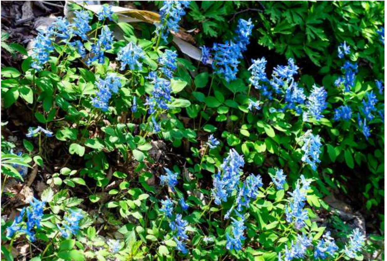
“Ezo-engosaku” Family: Papaveraceae / ケシ科 キケマン属

北海道からサハリンにかけて分布する多年草で、草丈は10～30cm。道内では野原や畑の周りはおろか、住宅地や路傍にも群がって生えており、春に目立つ花といえまづこの青い花、というのが北海道に住まうものに共通の感覚であろう。葉は1～2回3出複葉で小葉の形は変異に富み、紐状に細かく切れ込むものから、卵形まで千差万別である。長さ2cmほどの花の色も変化が大きく、赤みを帯びたものから殆ど白色といえるものまでであるが、なんといっても多いのは鮮やかで明るい青紫の花。その鮮やかな色彩と数の多さは、道外からの訪問者を驚かせる。山菜として利用できると思うが、漢方薬の原料でもあるらしいから沢山食べるのは止めておいた方がよい。本種は本州北部にも分布するとされてきたが、それは別種オトメエンゴサクとする説が有力なようだ。◇2006.05.07 札幌市、円山