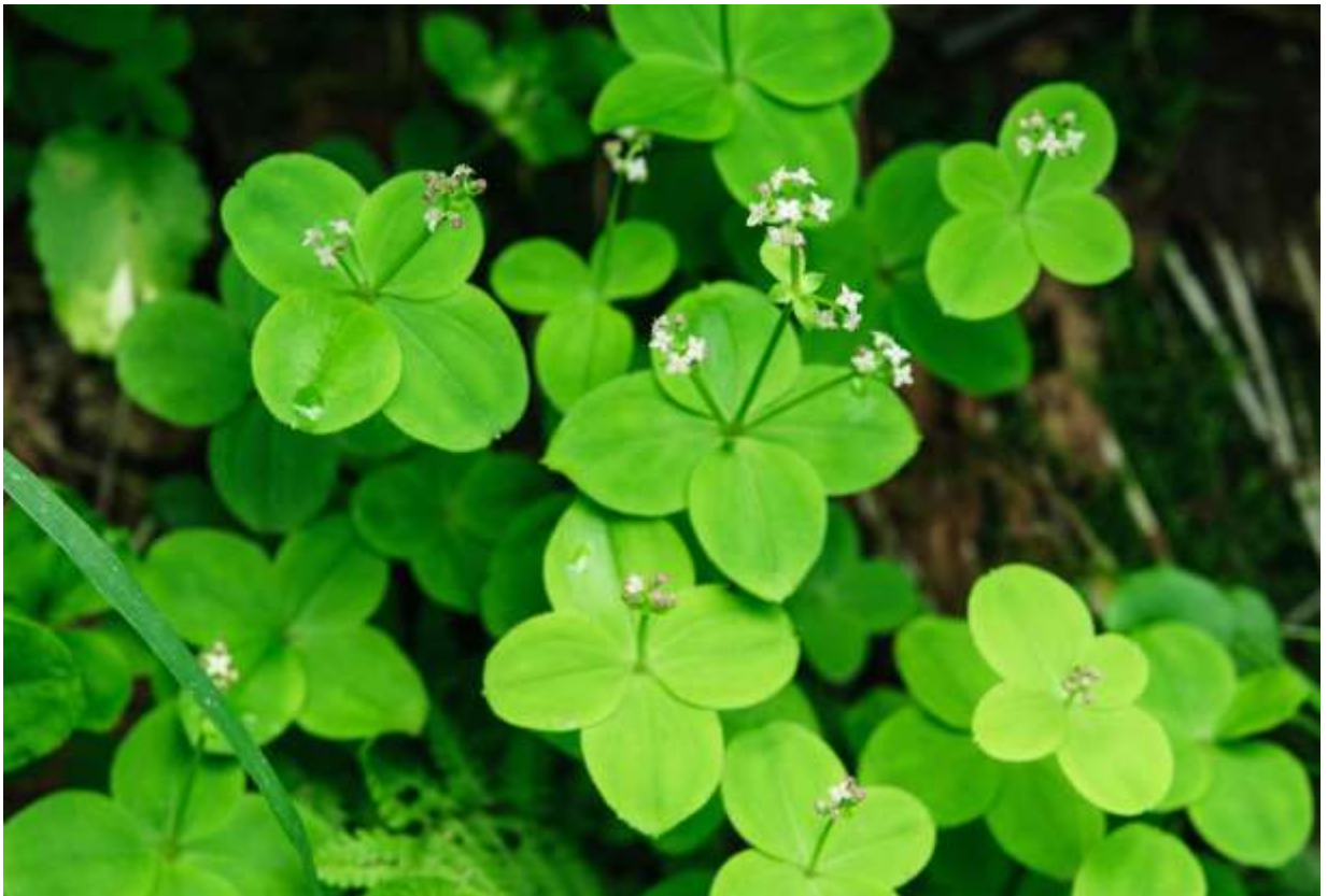
“Ezo-no-yotsuba-mugura” Family: Rubiaceae / アカネ科 ヤエムグラ属

東アジアと北米大陸北部に広く分布する草丈10~20cmの多年草で、国内では北海道と中部地方以北の本州に自生し、亜高山の林内や岩場の下などで群落となることが多い。長さ2~3cmほどの広楕円形の葉には3本の主脈が明瞭で、4枚輪生状につくパターンを2~3回繰り返す。丸くて形の良い葉が幾何学的に展開するので、花が無くてもよく目立ち、大きな群落ではユニークな景観となって面白い。白い花冠は径3mmほどと極小さいが、葉の輪生配置に合わせて4裂するのも興味深い。ついでに、茎の方も断面が四角いので、上から下まで統一がとれている律儀な植物だ。道内では普通に見られて珍しい植物ではないが、特徴的な葉が群がっていると、展望のないところでの単調な登山に気分転換をもたらしてくれる。◇2009.08.08 上川町