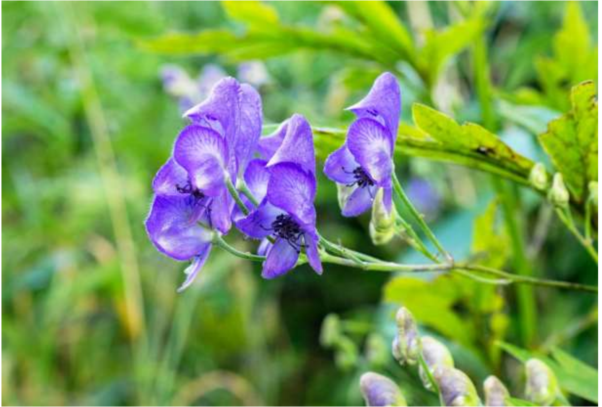
“Ezo-torikabuto” Family: Ranunculaceae / キンポウゲ科 トリカブト属

溪谷や風の弱い山地では弓なりに曲がり、原野では直立するなど形態変化の多い疑似1年草で、茎の長さは70cmから2mまでになる北海道固有の植物。葉は3全裂し、裂片はさらに細かく裂けるが、道内にあるトリカブト属の中では切れ込みの程度は中程度というところだろう。長さ3cmほどの青紫色の兜形の花は、5個の萼片と中に隠れて蜜腺化した2個の花弁からなり、葉脇に数個ずつまとまって咲く。国内には30種を越えるトリカブト属が自生するが、この亜種は中でも最強の毒性があるらしい。エゾトリカブトは、道南と道東を除く北海道全域に生えるごく普通の野草で、山地はもとより札幌郊外の住宅脇でもこの美しい花を簡単に見られる。しかし、どこにでもあるが故に、春の山菜シーズンになると、誤食による中毒騒ぎが毎年繰り返されている。◇2019.09.02 札幌市、手稲山