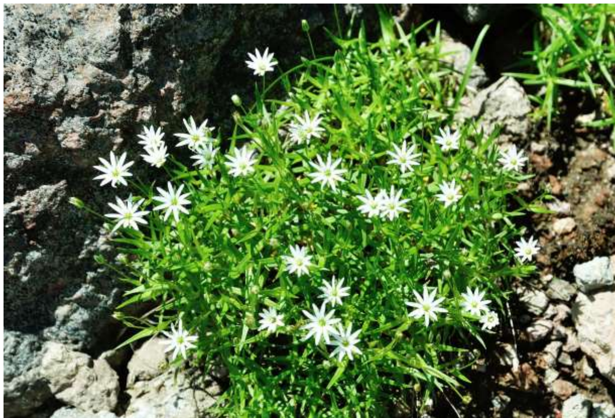
“Ezo-iwa-tsume-kusa” Family: Caryophyllaceae / ナデシコ科 ハコベ属

大雪山系に特産する日本固有の多年草で、稜線の岩礫地に生えて草丈は5~20cmほど。絶滅危惧IB類に指定されている。本種の分布域は限られるものの、生えているところでは大きな株がいくつも見られ、こんもりと整ったマウンド状の株一面に純白の花がちりばめられて、いかにも高山植物らしい佇まいが美しい。葉は長さ10~25mmの線形で先は尖る。花は径1.5cmほどの白色花で、開花している花数は少な目だが蕾が沢山あり、開花期は長い。花弁が2深裂して10枚あるように見えるのはハコベ属に共通する特徴だが、本種の花弁は形が良いので、個別の花としても優美な印象を与える。日高山系と夕張山系には、別種でより大型で、絶滅危惧IA類に指定されているオオイワツメクサがあるが、簡単に見られる花ではなく、私はまだ見たことがない。◇2010.07.17 大雪山系北鎮岳