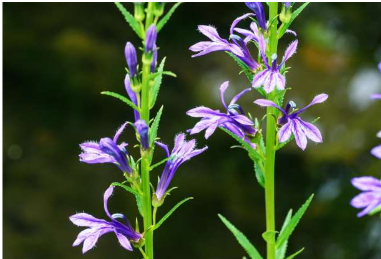
“Sawa-gikyō” Family: Campanulaceae / キキョウ科 ミゾカクシ属

日本全土と朝鮮半島、中国、極東ロシアに分布する多年草で、低地～高山帯の水辺や湿原に生え、茎は分岐しないで高さ50～100cmほどに伸びる。互生する葉は長さ4～7cm。鋸歯のある披針形で先が尖る。鮮やかな濃紫色の花は長さ2.5～3cmで下部から順に咲き上がる。花冠は上下2唇に分かれ、上唇は2裂して反り返る。下唇は3裂して平に展開するが、中心部に白斑があって中心脈が明瞭に現れる。サワギキョウの花はここまでだけでも十分にユニークな造りだが、上唇裂片の間からは雄しべが合着した花柱が突き出しており、他に類例を見ない面白い形の花である。サワギキョウは毒草のためエゾシカの食害が無く、道内の高層湿原や海岸草地では大きな群落を作ることが多い。ユリ科の花が終わった後の湿原では、晩夏の季節の貴重な主役である。◇2014.08.08 札幌市