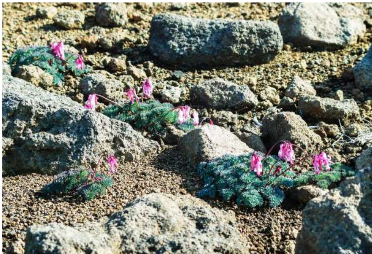
“Koma-kusa” Family: Papaveraceae / ケシ科 コマクサ属

火山の砂礫地に多いパイオニアプラントで、草丈は5～20cm程度。高山植物の女王と呼ばれることも多い。蕾が馬の顔に似ているのでこの名前が付いたが、昔は効能あらたかな薬草として、本州の霊山参りの人たちに採取されたらしい。コマクサは本州中部からシベリア東部にかけて分布するが、北米大陸の近縁種と比べても、花と葉の形がユニークだ。大雪山赤岳にあった群落は盗掘により貧弱化していたが、保存と移植の努力が実って見応えのあるレベルまで回復した。それは喜ばしいのだが、元来自生していなかった山に持ち込む人がいるらしく、天塩岳では抜き取りが行われた。こちらの方は困った話である。八ヶ岳や秋田駒ヶ岳などには、自然状態の大群落が残っているが、北海道の花の方が一般的に色が濃いように思える。◇2007.07.08 大雪山系赤岳