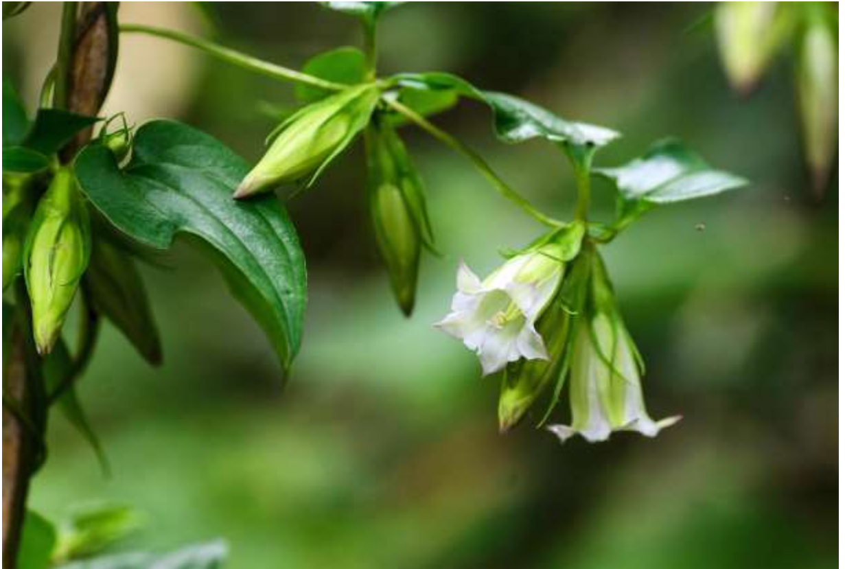
“Tsuru-rindou” Family: Gentianaceae / リンドウ科 ツルリンドウ属

日本全土と朝鮮半島、サハリン南部に分布するつる性の多年草で、低地帯から山地帯までの林内で地面を這ったり他のものに絡み、茎の長さは40～200cmになる。対生する三角状卵形の葉は長さ3～8cmで艶があり、先が尖って3脈が目立つ。薄紫色の花はラッパ形で長さは3cmほど、先が5裂して径は2cmほどになる。花は美しいのだが地表近くで咲くことが多い上に、花色が淡くてあまり目立たない。しかし、果実は真っ赤に熟してナツメの実や若いタマゴタケを連想させ、枯れた花冠から突き出してよく目立つ。山道を歩いていて地表近くで咲くツルリンドウの花に気づくのは、赤い実のある茎に咲いた残り花であることが多い。リンドウの仲間の常として、ツルリンドウも漢方薬の世界では胃薬として利用されているとのことだ。◇2012.09.01 石狩市、黄金山