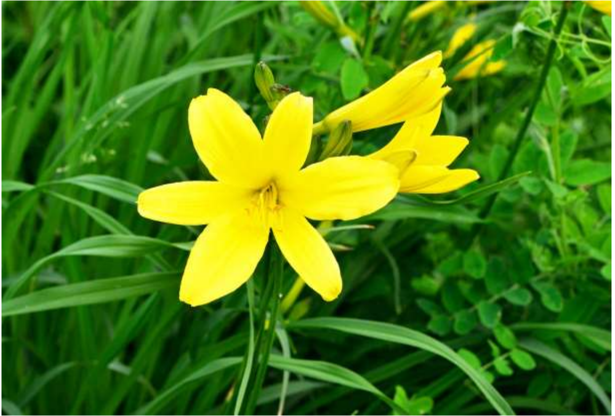
Ezo-kisuge” Family: Asphodelaceae / ワスレグサ科 ワスレグサ属

北海道と南千島にある草丈80cmまでの多年草で、海岸に近い草地に生える。基準変種は中国にあるマンシュウキスゲとされるが、専門家の間でも諸説あるらしい。径7~8cmになるレモンイエローの花は、夕方に開花して翌日の昼頃にしぼむ一日花だ。花は本州以南にある別種ユウスゲ (B:p.209) とよく似ているが、エゾキスゲの方が草丈は低めで花も頑丈そうに見える。この傾向は同属別種のゼンテイカ(B:p.210)とも共通し、かつてエゾゼンテイカとも呼ばれた道内の個体は、本州のニッコウキスゲとも呼ばれる個体よりはがっしりした作りだ。道内の海岸では、一般的にはゼンテイカが多くてエゾキスゲは少ないが、小清水原生花園ではエゾキスゲの花が集団で咲いている。しかし、色の淡いこの花は、群れないで草むらにぽつんぽつんと咲いている方が風情があるかも。◇2011.06.30 小清水町