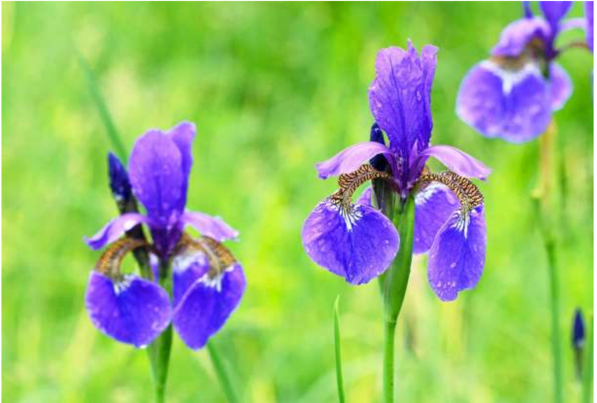
“Ayame” Family: Iridaceae / アヤメ科 アヤメ属

日本全土からシベリアまでのアジア北東部に分布する草丈30～60cmの多年草で、日本に自生するアヤメ属7種を代表する種といえよう。この仲間は湿った所や水中に生えるというイメージが一般的だが、アヤメとエヒメアヤメ(B:p.6)は比較的乾いた山野を好み、山道の路傍や斜面にも群がって咲いている。葉は長さ30～50cmの広線形で、幅は5～10mmと狭い。アヤメ属の花は大きな外花被片と内花被片に加えて、発達した花柱が特徴的で各々3個ずつある。アヤメの花は径8cmほどと特に大きくはないが、大きな紫色の内花被片が立ち上がって印象的な外観だ。紫色の花柱は外花被片の上位で平開し、先が2裂して裂片には鋸歯がある。外花被片は広倒卵形で平開して先が垂れるが、せばまった基部に、アヤメという名前の元となった黄色と紫色の顕著な虎斑模様がある。◇2014..06.30 浦幌町