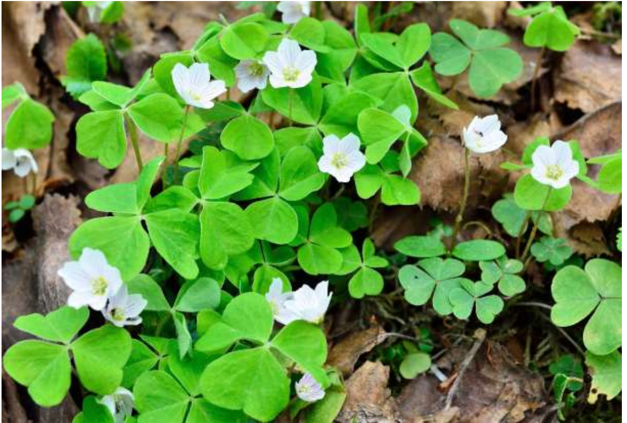
“Ko-miyama-katabami” Family: Oxalidaceae / カタバミ科 カタバミ属

北半球の温帯～亜寒帯に広く分布する高さ5～15cmの多年草で、国内では中国地方を除く全国の山地帯～亜高山帯の樹林下で見られる。葉はカタバミ属に共通の3出掌状複葉で、3枚の小葉が輪生状に配列する。小葉は角が丸みを帯びた心形で、マメ科のクローバーの葉に似ている。花は径2cmほどの5弁花で、白色の花弁に淡紅色の筋が発達することが多いが、花弁全体が淡紅色になるものもある。コミヤマカタバミは春の山歩きでよく目にするが、柔らかい緑色の葉と白い花の雰囲気が好ましく、数の少ない赤花を探しながら歩くのもなかなか楽しい。しかし、花を楽しめるのも晴天の日中のみ、日が陰ると花も葉も閉じてしまう。住宅地に生えるカタバミと同様に、葉にはシュウ酸カルシウムが含まれており、かじると独特のすっぱみがある。◇2011.06.08 士別市、天塩岳登山道