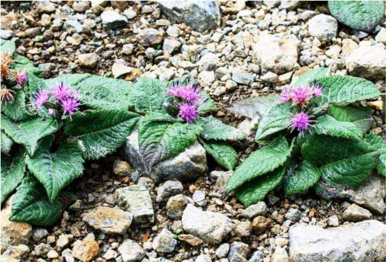
“Yukiba-higotai” Family: Asteraceae / キク科 トウヒレン属

夕張岳と日高山脈北部の超塩基性岩地帯に生える草丈4～13cmほどの多年草で、北海道の固有種。全体に白いクモ毛が多い。地面に張り付くように生えるため、草丈は低いが横方向への展開は結構大きい。タデ科植物のように見える葉は厚くて光沢があり、長さ4～9cmほどの広卵形で柄があり、裏面には綿毛が密生して白く見える。頭花は径1.5cmほどで数個～十数個まとまってつき、小花は全て赤紫色の筒状花だ。北海道ではエゾシカが増え過ぎて問題となっており、夕張岳でも食害は大きいようだ。本種の咲く吹き通しでもエゾシカの足跡が目立つが、今のところは本種もユウバリソウもある程度まとまった数が残っている。もっとも、以前の状態を知らないので、増減の傾向については私には判断がつかない。◇2012.07.30 夕張市、夕張岳