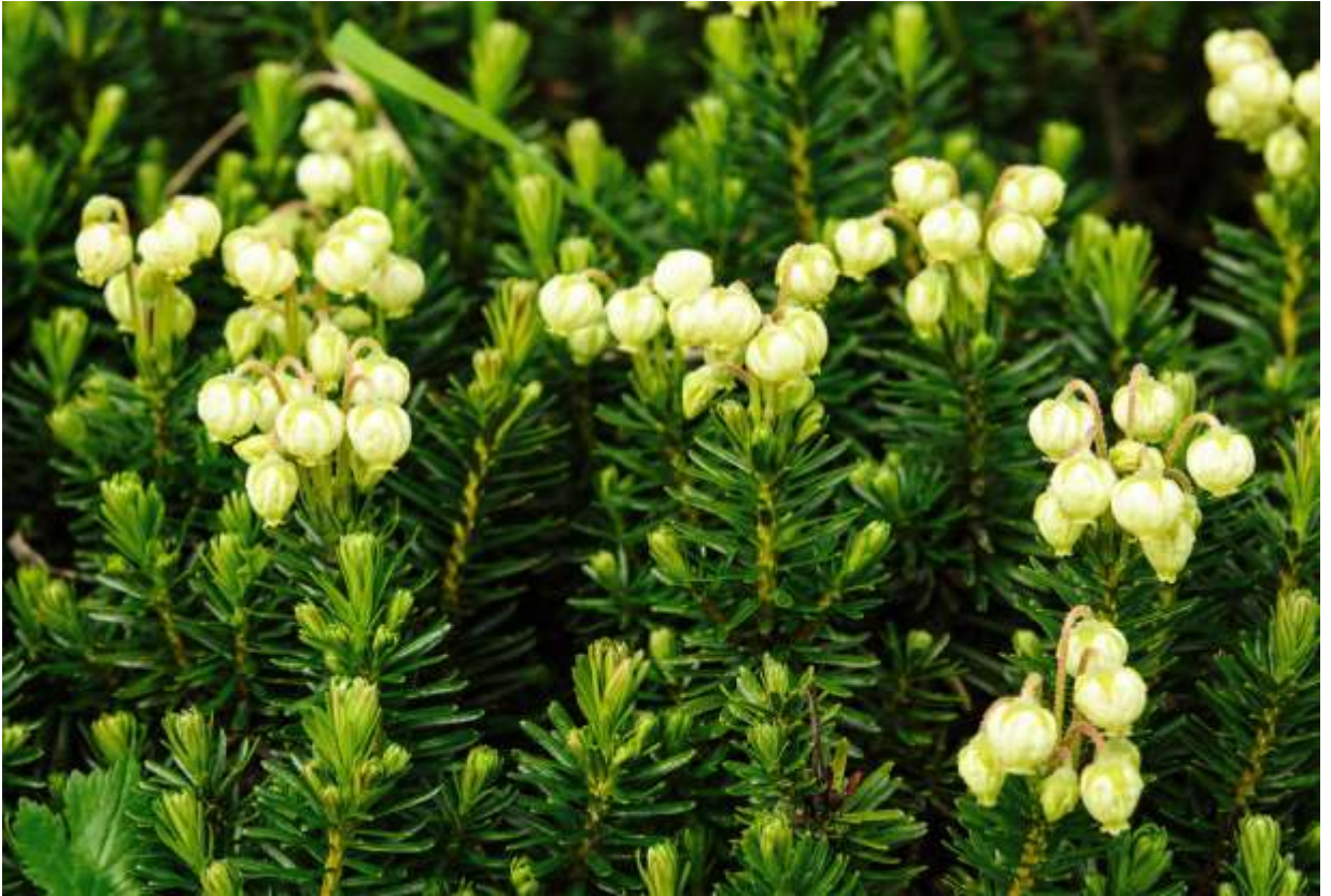
“Aono-tsuga-zakura” Family: Ericaceae / ツツジ科 ツガザクラ属

高山に生える常緑の小低木で、高さは10～30cmほど。樹木のツガに似た葉と緑色の花からこの名が付いた。北海道にはツガザクラ属が3種分布しているが、エゾノツガザクラとナガバノツガザクラが東北地方を南限とするのに対し、アオノツガザクラは日本アルプスや白山でも普通に見られ、3種の中では最も分布範囲が広い。国外ではアラスカまでの環北太平洋寒冷域に分布する。本種は比較的湿ったところを好むようで、雪渓が消えたあとに大群落を作る。長さ7～8mmの壺形の花は緑がかった白色でありぱっとしないが、枝先に10個近くの花をかたまっつけてつけるため、群落を作っているところでは落ち着いた美しさがある。花は下向きだが実は上向きになり、長く伸びた花柄の先にいくつも並んで直立する様子は微笑ましい。◇2009.08.08 大雪山系赤岳