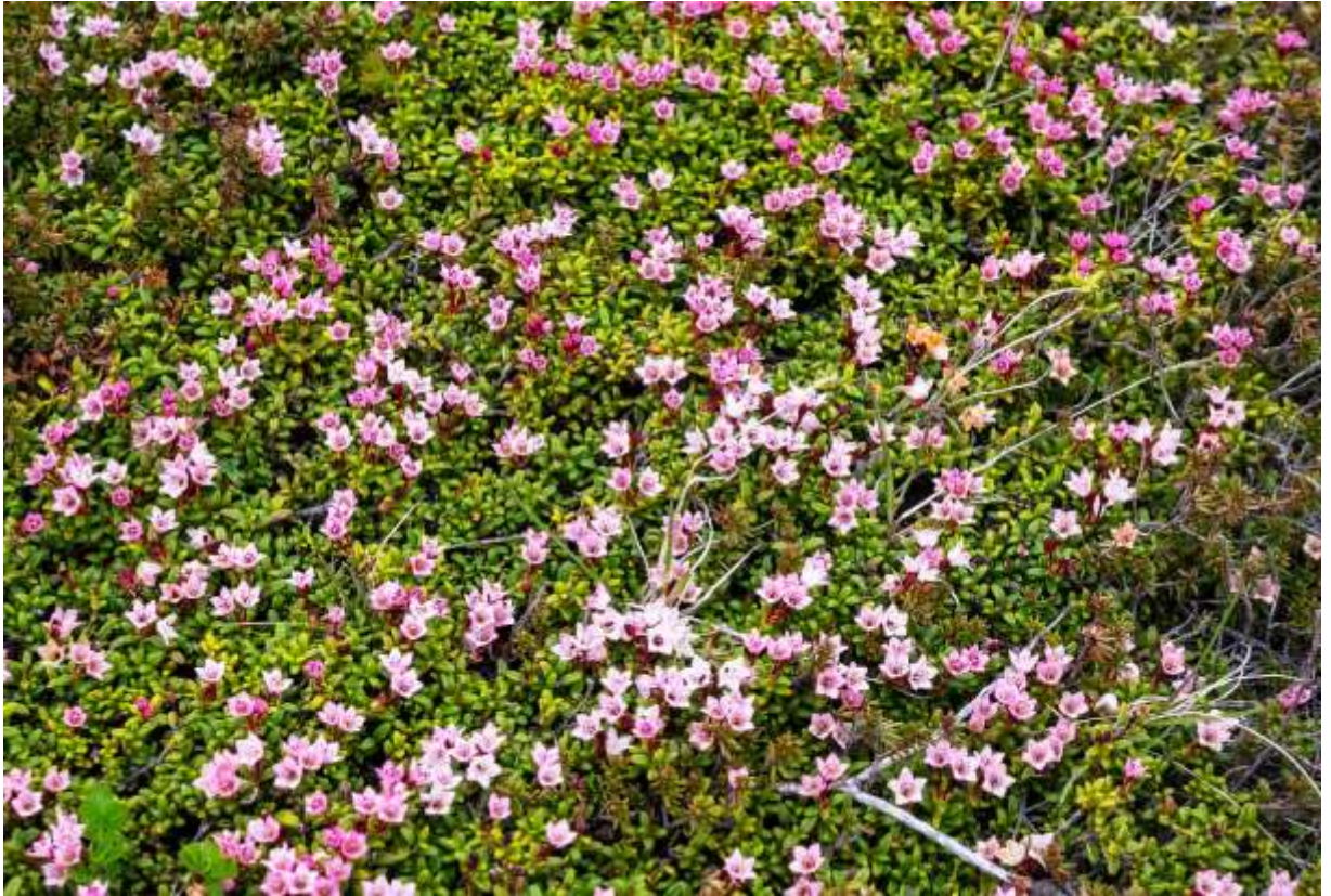
“Mine-zuou” Family: Ericaceae / ツツジ科 ミネズオウ属

北半球北部に広く分布する常緑の矮小低木で、国内では中部地方以北の高山帯に生える。米粒大の葉は艶があり、びっしりと密生してマット状に広がる。径4～5mmと小さい花は枝先で上向きに付き、鐘形で先が4～5中裂する。日本アルプスや東北地方の山でみられる花はピンクがかった白色で、咲いていてもあまり目立たないが、道内では濃いピンク色のものも多く、遠目で見ても容易に判別できる。本州では高さ15cmにも立ち上がる株を見るが、大雪山では地面にへばりついているように育つものが多い。和名のスオウは由来が分かりにくい、イチイ（オンコ）の別名で、本種の葉がイチイに似ているからという。ミネズオウの生える地理的範囲は極めて広いので、アルプスやカナディアンロッキーでのトレッキングでも、このおなじみの花に良く出会う。◇2019.07.20 大雪山系赤岳