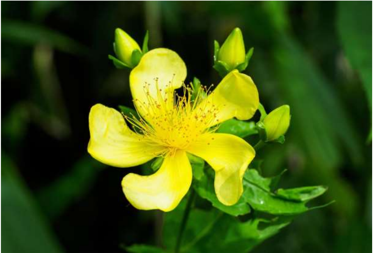
“Tomoe-sou” Family: Hypericaceae / オトギリソウ科 オトギリソウ属

日本全国の低地帯～山地帯で日当たりの良い草地や林縁に生える多年草で、草丈は50～130cmが普通だが、風の弱い所では2mにもなる株も見られる。国外では東アジア各地に広く分布し、北米大陸東部にもある。茎は直立して4稜があり、良く枝分かれする。葉は長さ4～10cmの披針形～長楕円形で対生するが、草姿に独特の雰囲気があり、一度覚えてしまえば花がなくても直ぐ分かる。葉を透かすと明点が多数あるが、黒点はない。茎や枝の先に上向きにつく花は径4～6cmと大きく、黄色い5枚の花弁がゆがんだ巴型に平開する。花の中心にある雌しべは花柱が5裂して反り返る。雄しべは多数あり、赤い葯が目につくが少しうるさい。花は朝開いて夕方に萎む1日花であり、形の崩れるのが早いので、綺麗な花が見られるのは午前中に限られる。◇2017.07.24 江別市、野幌森林公園