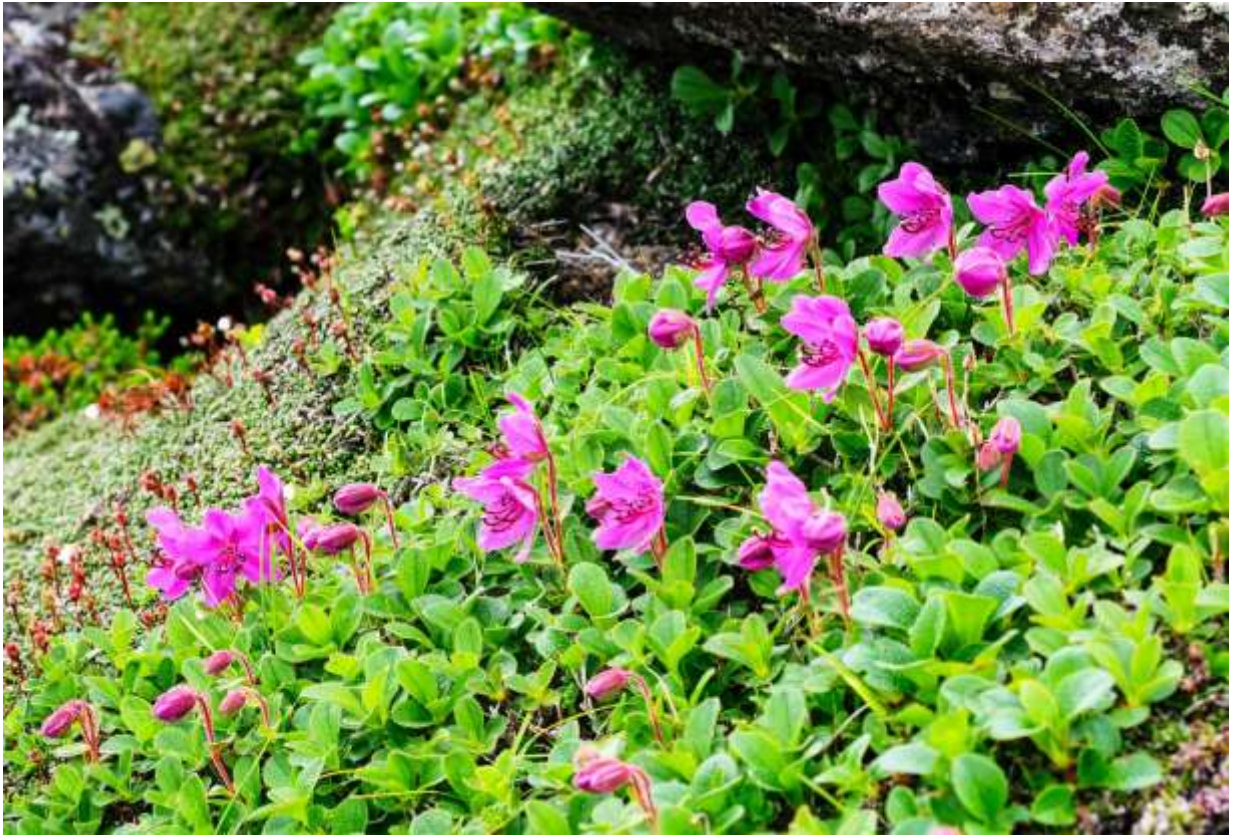
“Ezo-tsutsuji” Family: Ericaceae / ツツジ科 エゾツツジ属

環境により高さが5~30cmと変化する高山性の落葉小低木で、国内では東北地方北部と北海道、国外ではアジア北東部からアラスカまで分布する。倒卵形の葉には毛が多く、長さは3cmほど。枝先から長く伸びた花柄の先で横向に咲く花は、極端に低い背丈に比べてかなり大きく、直径が3~4 cmほどの漏斗状で5深裂する。花冠は紫紅色で、上部裂片の内側には茶色の斑点があり、10本ある雄しべのうち下方の5本は長く伸びて上方に湾曲する。この鮮やかな花が高山帯に群生する様は見事なもので、稜線上や稜線より少し下がった斜面に群がって咲く、紅紫色のコエゾツガザクラ(p.182)の群落とは少し趣の異なる豪華さである。しかし、花色の鮮やかさは場所によって違うようで、くすんだ色のものも結構多いし、数は少ないが白い花もある。◇2008.07.20 大雪山系黒岳