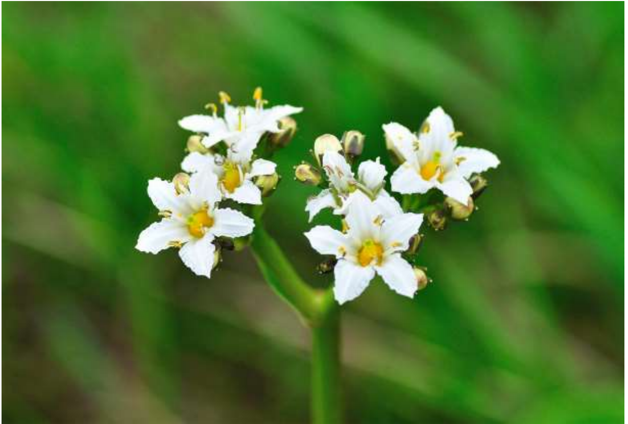
“Iwa-ichou” Family: Menyanthaceae / ミツガシワ科 イワイチョウ属

中部地方から千島列島中部まで分布する湿地性の多年草で、群生することが多い。銀杏の葉に似た厚い根生葉は15cm以下の高さだが、花茎は40cmにも伸びて白い花を10個ほど集散状に着ける。花は径12mmほどの漏斗状で、花冠は5深裂する。花の中心にある黄褐色の子房が目立っており、花冠裂片の縁が波打っている事と合わせて、小さいながら美しい花である。イワイチョウは純群落を作ることが多く、艶のある深緑色の葉が密生して広がる様は、花のない時期でも美しい山岳風景となる。北米大陸北西部には基準亜種のアメリカイワイチョウがあり、Deer Cabbage（鹿のキャベツ）という位だから沢山生えているのだろう。しかし、ネットの画像を見ると花の形は平凡で花冠裂片の波打ちも小さく、日本のイワイチョウの方がより美しく感じる。◇2010.06.27 雨竜町、雨竜沼湿原