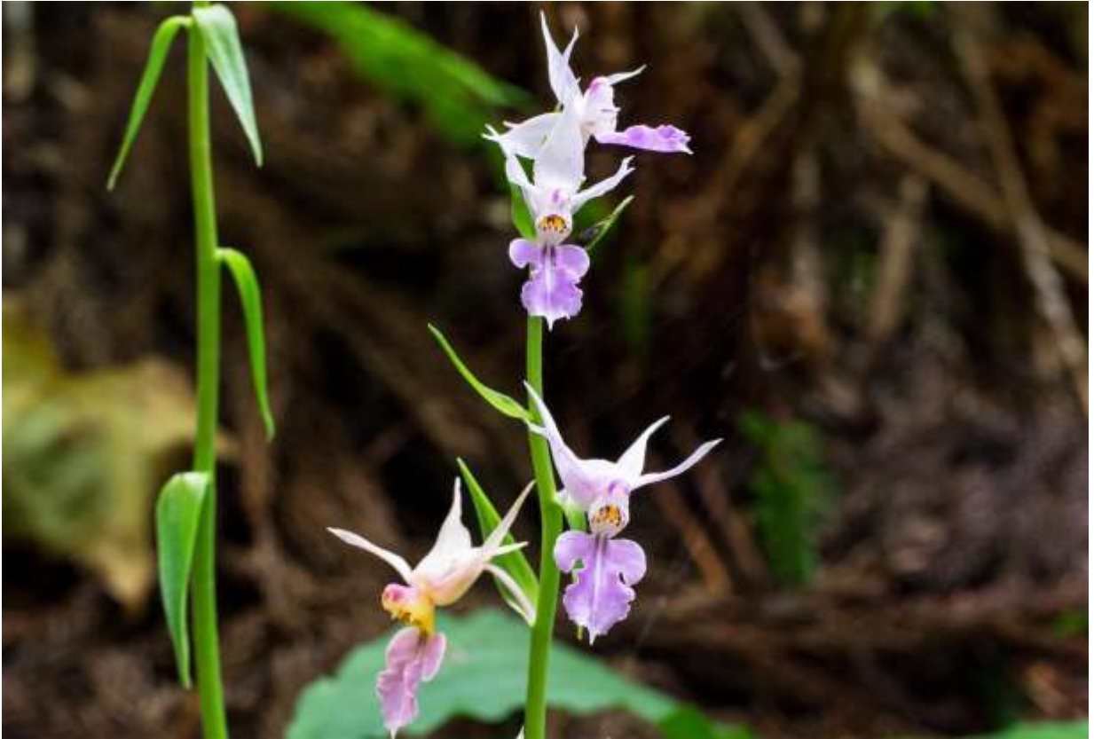
“Natsu-ebine” Family: Orchidaceae / ラン科 エビネ属

道南の奥尻島から九州にかけての樹林下に生育する草丈20～40cmの多年草で、長さ10～30cmの狭長楕円形の葉が数枚あり、長く伸びた花茎の先に10～20個の淡紫色の花が総状に咲く。萼片は長さ15～20mmの狭卵形で先が尖り、後方へ反り返る。側花弁は線形で先が尖る。唇弁は広卵形で3深裂し、中裂片は大きくて縁が波状に縮れ先が突出する。これはエビネの仲間としては最も遅く咲く種で、上品な色合いの花は実に美しい。国外での分布範囲は朝鮮半島南部からヒマラヤ東部までと広い。奥尻島には葉の裏面に毛のある個体があって変種オクシリエビネとして区分するという説があるが、この特徴は顕著でないという記述もある。私が奥尻島で観察した範囲では、写真に示す株を含めて、葉裏に毛のある個体は見つけられなかった。◇2017.08.28 奥尻島