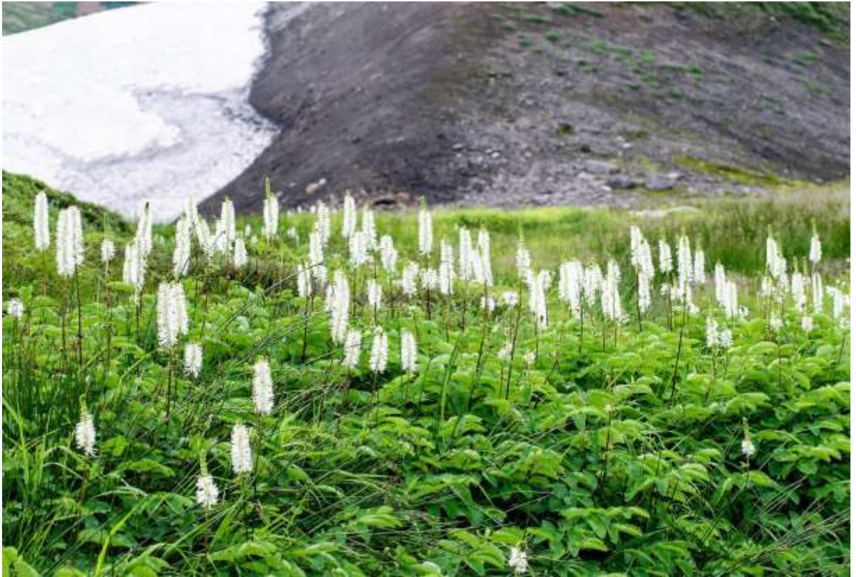
“Takane-touuchi-sou” Family: Rosaceae / バラ科 ワレモコウ属

これは草丈30～80cmの多年草で、北海道と本州中部の高山の、湿った草地や礫地に生えるが東北地方にはない。国外では朝鮮半島から極東ロシアを經由して、北米大陸の西北部まで広く分布する、国内にはワレモコウ属が7種あるが、その中では、花序が直立するこのタカネトウウチソウが最も端正なたたずまいと言えよう。根生葉はこの仲間に共通の長い奇数羽状複葉で、長さ3～5cmの小葉が5～6対あり、花が無くてもすぐにワレモコウ属と見当が付く。長さ10cmにも達する穂状花序は下から咲きあがり、夏の終わりの大雪山で真っ白な花穂が林立する様子は、遠くからも目立って美しい風景である。花には花弁がなく、白く見えるのは長さ1cmほどの先がふくらんだ雄しべだが、ワレモコウ属に多い特長として、赤味のある花穂をつけることもある。◇2006.08.27 大雪山系北海沢