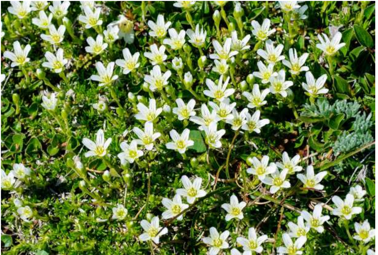
“Ezo-miyama-tsume-kusa” Family: Caryophyllaceae / ナデシコ科 タカネツメクサ属

大雪山に特産する草丈3~5cmの多年草で、稜線の礫地に生える。葉は多肉質で縁に毛が多く、やや扁平な針形で弓状に彎曲し、長さは5~20mm。茎頂で上向きに咲く白い花は径1cmほどの5弁花で、花弁は狭倒卵形。近縁別種のエゾタカネツメクサとよく似ていて、大雪山で出会う株はどっちなのか見分けが付きにくいですが、エゾタカネツメクサの葉脈は1本なのに対し、この変種は3本なのが見分けのポイントだ。また、葉の幅が少し広めで、草丈がより低いという特長もある。両者は共によく分岐してマット状に広がり、沢山の花を上向きにつけ、いかにも高い山に登ってきたことを実感させる植物である。エゾミヤマツメクサは、日本アルプスと八ヶ岳に生えるミヤマツメクサとは兄弟関係にある変種同士で、母種は極東ロシアから北米西部の周北極圏に分布する。◇2007.07.08 上川町、大雪山赤岳