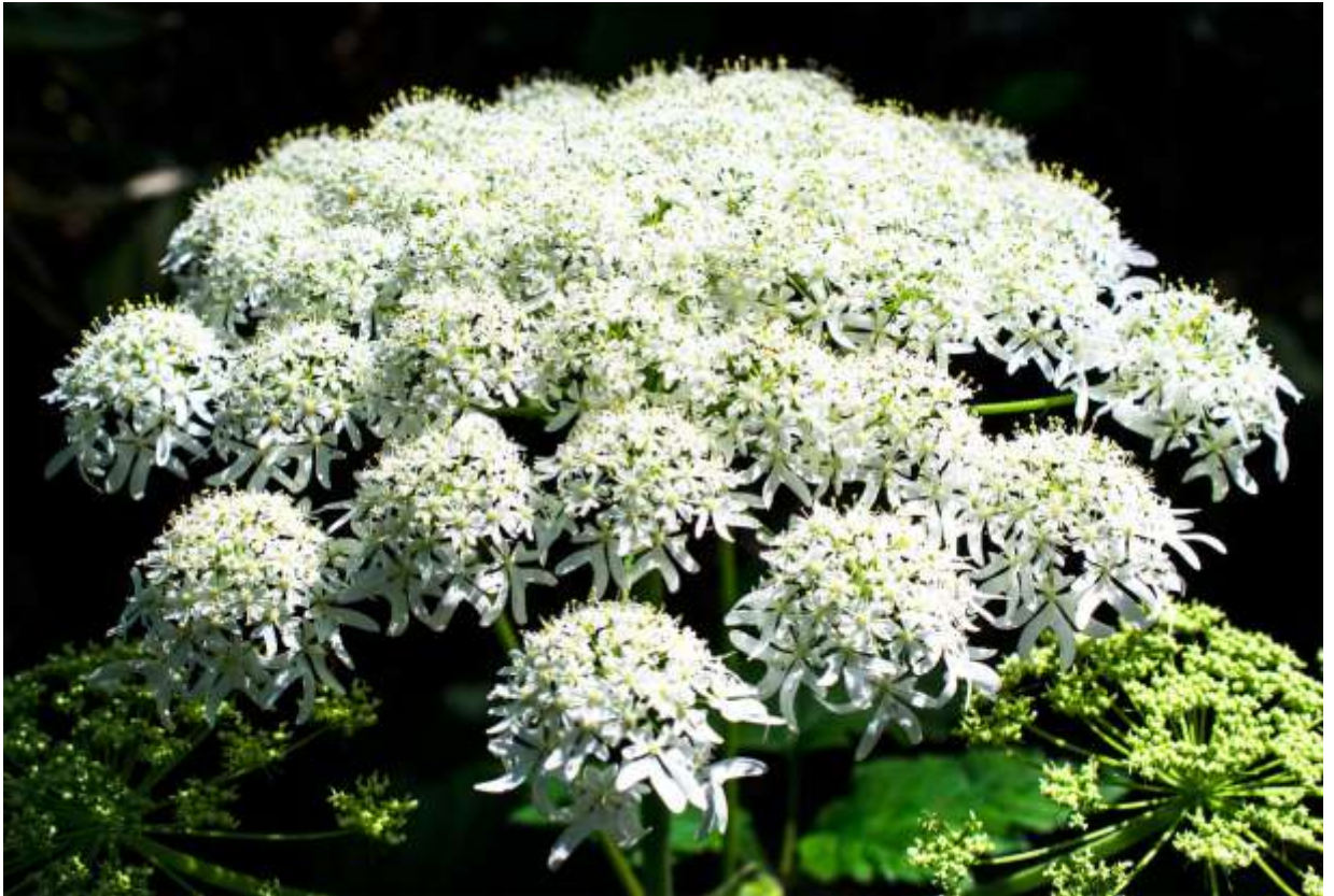
“Oo-hana-udo” Family: Apiaceae / セリ科 ハナウド属

道内では低地や山地の日の当たる場所に群生することの多い大形の多年草で、草丈は2mにも達する。国内では近畿地方以北で見られるが、その分布は千島からカムチャッカにまで達する。葉は3出複葉で顔が隠れるほど大きく、茎の頂部に大きな笠状の複散形花序を形成する。個々の散形花序は5数性の花が多数集まった半球形で、花序中心部では小さいが周辺部では大きく、周辺花の先が回遊魚の尾びれ状に2裂するのが特長だ。この純白で豪華な複合花序は、上や横から眺めても美しいが、逆光状態で下から見上げると精緻なレース編みのようで面白い。6月に道内を鉄道で移動すると、オオハナウドの群落が線路脇のあちこちに咲き誇っていて目を奪われるし、野幌森林公園の遊歩道ではこの花が垣根状に立ち並び、花のトンネル状の所もある。◇2012.06.13 江別市、野幌森林公園