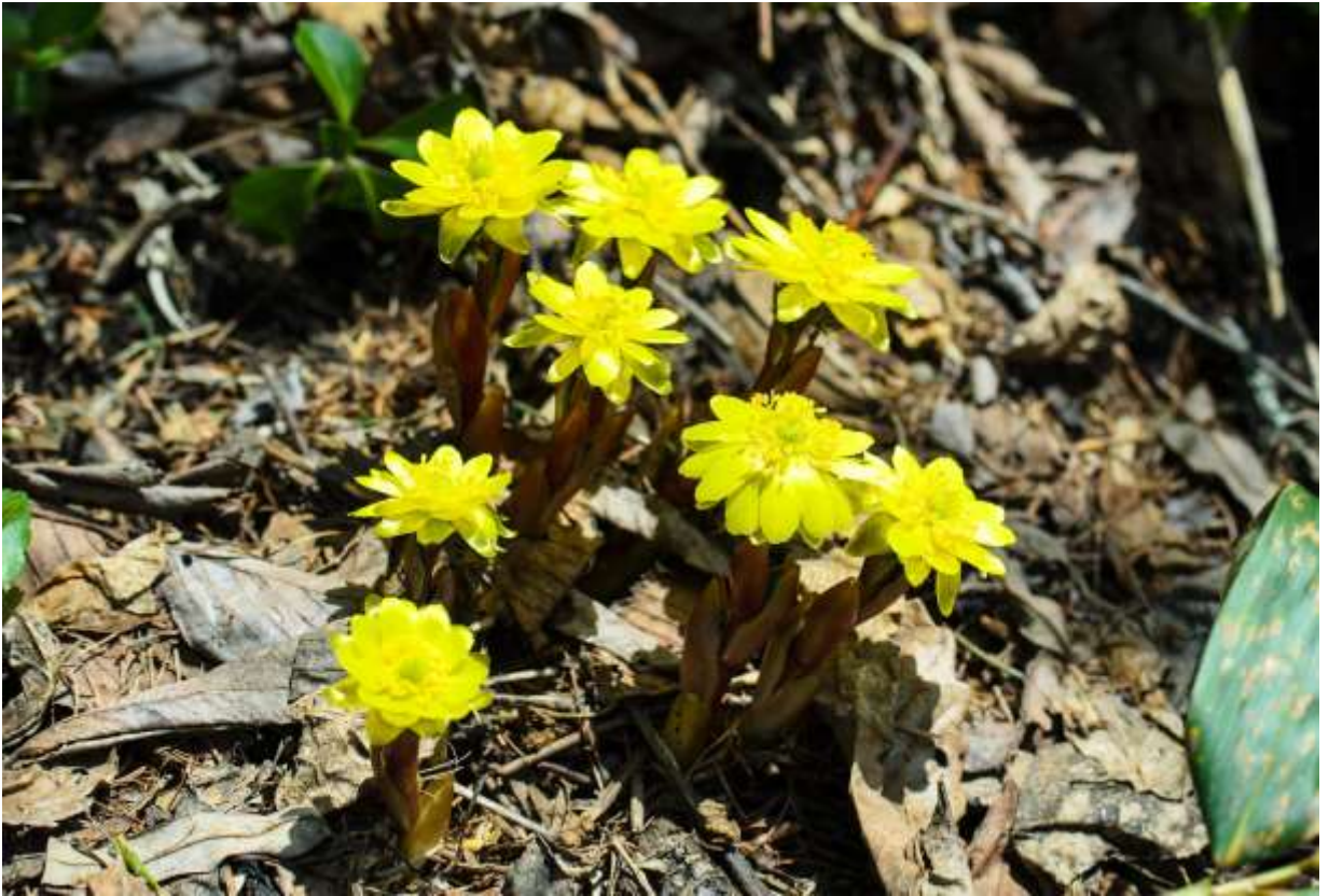
“Kitami-fukujyu-sou” Family: Ranunculaceae / キンポウゲ科 フクジュソウ属

道東や道北の海岸草地や広葉樹林下に生える多年草で、開花時の草丈は10～15cm。国外では朝鮮半島からシベリア東部にまで分布する。日本にはフクジュソウの仲間が4種自生しており、道内にはキタミフクジュソウとフクジュソウがあるが、両者が揃って自生する地域は限られている。本種は一茎一花であることと、葉裏に毛が密生して白く見えるのが特徴だ。まだ冬枯れの気配が残る早春の林床でいち早く芽を出し、木々の若葉が展開する前に開花して、来年への備えを終える植物は「春の妖精」と呼ばれる。一般に「春の妖精」といえば、種類と数の多いアネモネ属の花を連想する人も多いだろうが、道内での「春の妖精」の一番手は、3月末から咲き始めるフクジュソウ属の2種である。和名の元になった北見市では、国道や道道沿いの斜面を明るく彩る。◇2012.04.15 北見市、常呂町