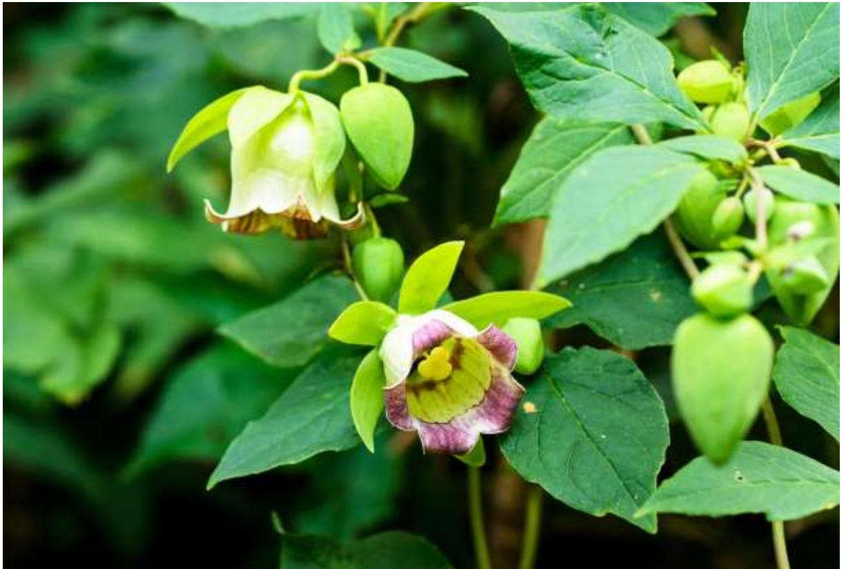
“Tsuru-ninjin” Family: Campanulaceae / キキョウ科 ツルニンジン属

日本全土を含む東アジア一帯に生えるつる性の多年草で、明るい林内や道端で他の植物に巻き付いて育ち、長さ2~3mに伸びる。茎を切るとサポニンを含む白い乳液が出て、韓国では薬用植物とされているようだ。葉は短い側枝に4枚輪生状に付くことが多く、両端の尖った楕円形で長さは2~10cm。長さ3cmほどの鐘形の花を多数つけるが、淡緑色の大きな萼片が目立つ。花冠は浅く5裂し、裂片は後方に反り返る。花冠の外側は白っぽくて模様が無く、内側には紫褐色の模様がある。この模様は株による変異が大きく、中には全く模様のないノッペラボーの花もある。昔からある和名の付け方には何かルールがあるわけではなく、ツルニンジンも明らかにキキョウ科の花だが、根がウコギ科のチョウセンニンジンと似ているからこの名前になったという。◇2011.08.24 札幌市、藻岩山