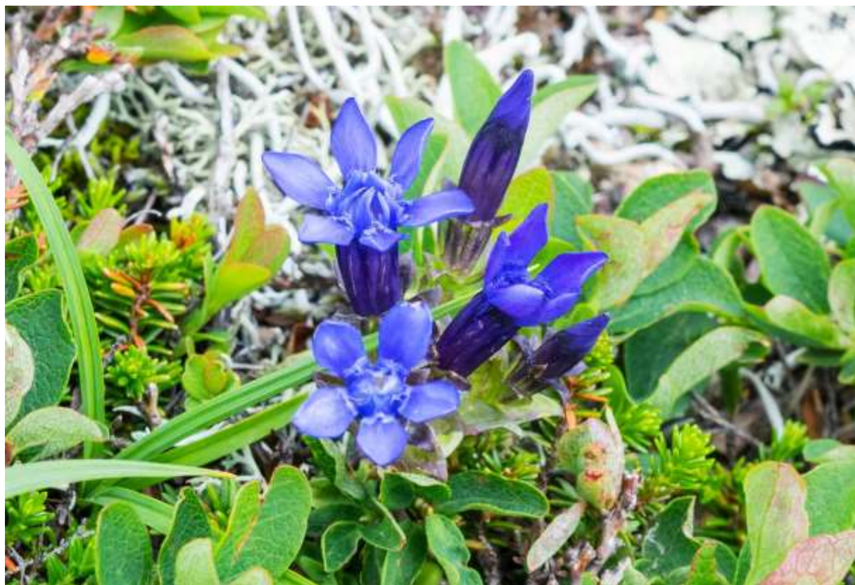
“Rishiri-rindou” Family: Gentianaceae / リンドウ科 リンドウ属

利尻山、夕張岳と大雪山系の限られた場所にだけ生える草丈5～12cmの多年草で、国外では朝鮮半島からカムチャッカ半島にかけて分布する。葉は長さ7～15mmの長楕円形で対生し、柄が無くて全縁である。花は濃い青紫色で花冠の長さは2.5cmほど。花冠は通常5裂するが、6裂するものも少数見られる。花冠裂片はやや半曲する一方で、花冠副片は内側に折れるので、花の形がスッキリしている。同じような環境に生えて数の多いミヤマリンドウ（次頁）よりは、花の大きさ、色合い、形、希少性の全てにおいて、こちらの方が高得点をつけられる。国内に自生するリンドウの仲間は22種あるが、北海道にはそのうちの11種が分布しており、北海道を南限とするものが本種を含めて3種ある。◇2018.07.25 大雪山系小泉岳