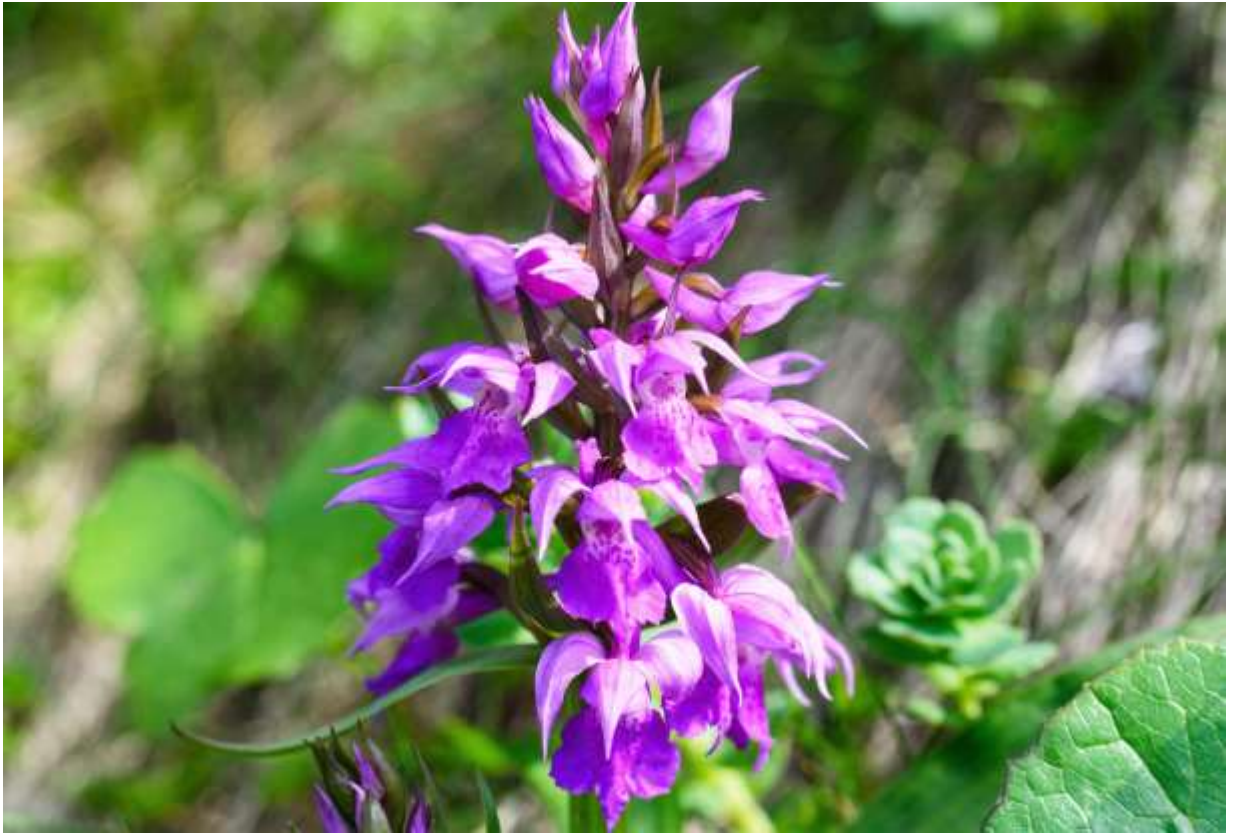
“Hakusan-chidori” Family: Orchidaceae / ラン科 ハクサンチドリ属

本州中部から北海道を経てアラスカまで分布する北方系のランで、草丈は10～40cm。広線形～披針形の葉が数枚互生し、葉の長さは5～15cm。直立した茎の中程から頂部までびっしりと密集した赤紫色の花を総状につける。花は径2cmほどで、萼片や側花弁の先が鋭く尖る。花の形と色には変異が多く、普通はさえない暗赤紫色だが、鮮やかな赤紫色のものや白色のものもよく見る。山では葉に暗色の斑点のある「ウズラバ」と呼ばれるものをよく見かけるが、これはウズラの卵の模様になぞらえたものとのこと。本種は、本州では高山植物として知られているが、道内では山岳地帯から海岸近くまで普通に生えており、道北では国道脇の雑草の趣すらある。こんな立派なランが、雑草のごとく生えている北海道の自然はうれしい限りである。◇2012.06.04 礼文島