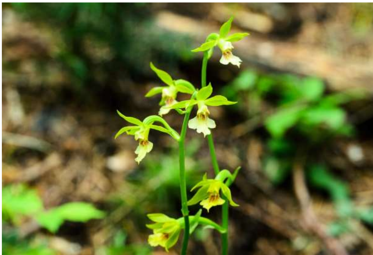
“Kinsei-ran” Family: Orchidaceae / ラン科 エビネ属

四国を除く日本各地に分布する草丈30～50cmの多年草で、山地帯～亜高山帯の樹林内に生える。日本固有種かと思っていたがチベットにもあるという。分布範囲は広いが自生地は局所的で、どこにでもあるという状況ではないようだ。エビネ属としては開花期が遅い方だろう。根元に数枚～10枚ほどつく葉には光沢があり、長さは15～30cmで折りたたまれたような縦皺が目立つ。根元からひょろりと伸びた花茎は少しくねくねし、上部に数個～12個の花をまばらにつける。黄緑色の萼片3枚は先の尖った披針形で、優美に彎曲する様が美しい。側花弁2枚も黄緑色で細長く、萼片よりは短い。唇弁は萼片と同長で大きく3裂し、基部に黄褐色の部分があつて良いアクセントになっている。これは薄暗い林下に生えて目立たないが、味わいのある美しい花である。◇2014.07.13 札幌市