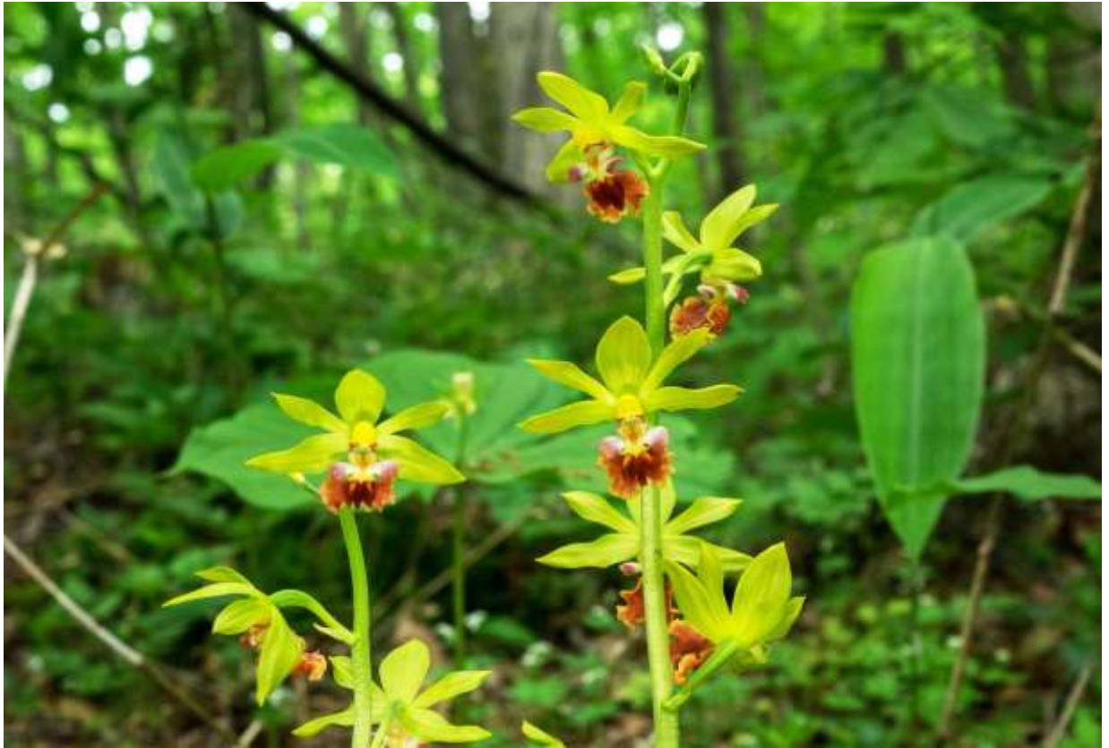
“Sarumen-ebine” Family: Orchidaceae / ラン科 エビネ属

日本全土とアジアの冷温帯の林床に生えるエビネ属の一種で、草丈30～50cmの多年草。エビネの仲間が少ない北海道では貴重な花であり、かつては札幌近郊の野山にも多かったそうだが、今では数少なくなってしまった。エビネの仲間は葉が枯れないで越冬するが、越冬した葉は艶もなくて地面に張り付いている。しかし、古い葉の中心から出る新しい葉が鉢状に開きかけている様子は秀逸だ。この新しく出る葉には艶があるので、全体的な姿形に対する評価ポイントが更に高くなる。すっきり伸びた花茎にややまばらに多数つく径4cmほどの花は、和名の通りの猿面で美しいとはいえない。しかし、黄緑色の萼片と側花弁を従えた赤茶色の唇弁には、複雑なしわや切れ込みがあつて、期待にたがわない面白い形をしている。◇2019.05.28 千歳市