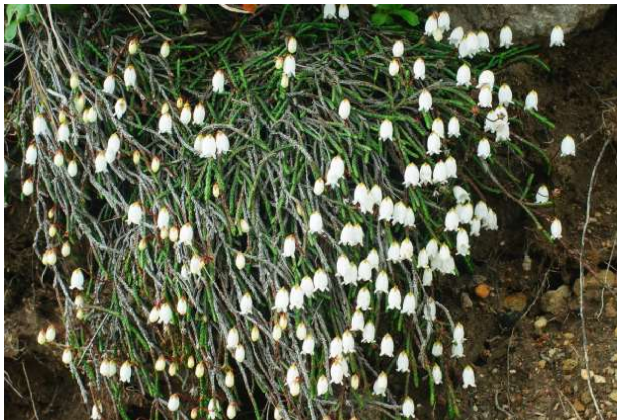
“Iwa-hige” Family: Ericaceae / ツツジ科 イワヒゲ属

高山帯で地面に這うように伸びる常緑の小低木で、れき地や岩場に生え、よく分岐してマット状に広がる。イワヒゲは本州中部からアラスカまでの北太平洋沿いに分布する北方系の種で、この仲間の数種はヒマラヤ山脈や北極周辺に広く分布している。国内での分布の中心は大雪山系と思われ、表大雪では崖や砂礫地に大きな群落が発達する。似つかわしくない名前をつけられた近縁のジムカデ（次頁）とは違い、岩場に生えたひげ状の枝由来と思われる和名は納得できる。細い枝は鱗状の葉でびっしり覆われて緑色の紐のようになり、その先端に近い葉腋から伸びた長さ2～3cmの細い花柄の先端に、壺状の白い花を1個下向きにつける。花の大きさは長さ7mm程度と小さいが、沢山の花が同じ方向を向いて垂れ下がる様はよく目立って美しい。◇2009.08.08 大雪山系白雲岳