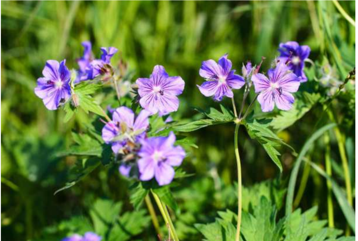
“Chishima-fuuro” Family: Geraniaceae / フウロソウ科 フウロソウ属

本州北部と北海道に分布する草丈20～50cmの多年草で、本州では高山植物だが、道東や道北では海岸地帯にも生育する。国外での分布範囲は広く、北太平洋沿岸域を回り込んでカナダ北西部にまで達する。道内に多いエゾフウロよりは全体にがっしりとした造りで、葉の裂片も幅広いし、花が茎頂にまとまって付くので見栄えがする。花は径2.5～3cmの5弁花で、花色は青紫色のものが多く、赤紫色に近い花もある。また、北海道の中央高地では淡い色の花が多く、殆ど白色といえるものについては品種トカチフウロとして識別されている。この仲間の葯は濃い紫色で、開花直後の花の美しい構成要素だが、時間が経つと色あせて縮んでしまう。キキョウ科にもよく見られる自家受粉を防ぐための方策なのだろうが、開花期間の長い花ということにもなろう。◇2013.06.30 浜中町