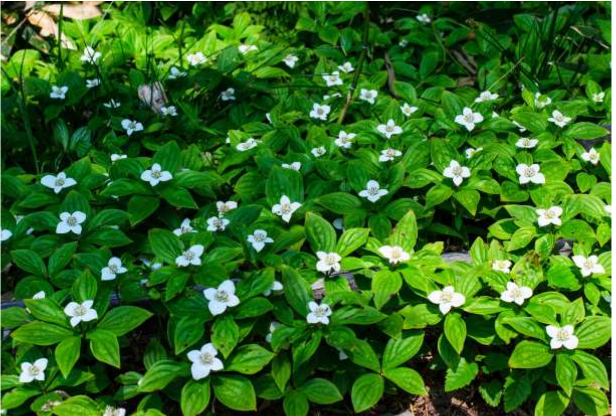
“Gozen-tachibna” Family: Cornaceae / ミズキ科 サンシュユ属

本州中部以北と北海道から北米大陸東部まで広く分布する常緑性の多年草で、草丈は5～20cm。本州では高山帯～亜高山帯に多いが、道内では大雪山の稜線から道北の海岸近くの林下までと生育範囲が広い。地下茎で広がり、そこから花を咲かせる茎と咲かせない茎が立ち上がり、前者では6枚の葉が、後者には4枚の葉がつく。葉は倒卵形で長さ2～8cm。ミズキ科というだけあって、葉は北米原産のハナミズキによく似ている。花は長さ0.7～2.5cmの白い苞4枚が目立つが、中心部に径2.5mmのごく小さい筒状花が集まって咲く。開花当初は筒状花がコンパクトにまとまって黄色の色調が美しいが、時間が経つと筒状花はばらけ、黒化した雌しべが飛び出して見苦しくなる。径5～8mmほどの果実は球形で、赤く熟して美しい。◇2012.06.30 上川町