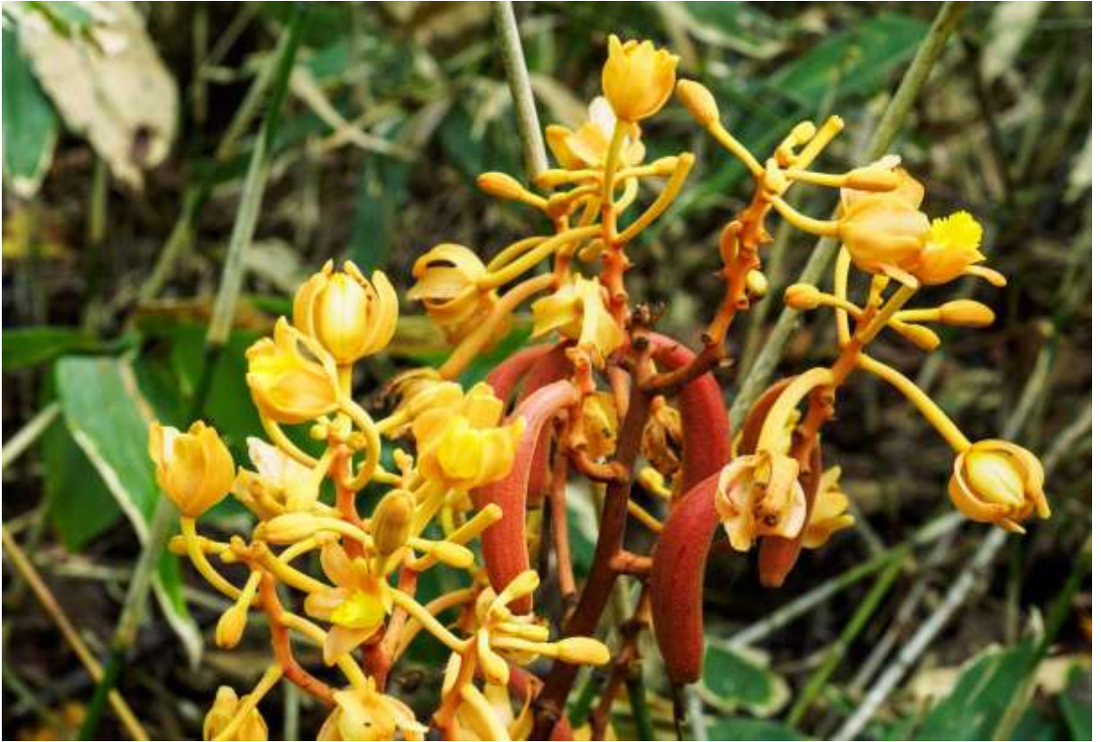
“Tsuti-akebi” Family: Orchidaceae / ラン科 ツチアケビ属

日本全国の低地～山地帯で、落葉樹林下や笹藪などに生える草丈50～100cmの腐生植物で、ナラタケ菌と共生し、光合成はしないので葉はない。花茎はやや赤味を帯びた褐色で、花柄や萼は黄褐色を呈する。直立する花茎の上部に沢山の枝をだし、枝から伸びた花柄の先に花を咲かせる。花は径3cmほどで半開し、全体に肉厚である。萼片は長さ15～20mmの長楕円形で、側花弁もほぼ同長。黄色で目立つ唇弁は萼片より少し短く、内側に少し巻き込んで、縁は細かく切れ込む。花の向きはバラバラだし、美しいとは言い難いが面白い花ではある。写真の中程には、和名の元になった赤褐色のアケビ状の果実が見られる。ネット情報では比較的珍しい植物とのことだが、札幌では近郊の山はもとより、山際にある市街地の公園にも生えてる。◇2017.08.31 札幌市、手根区