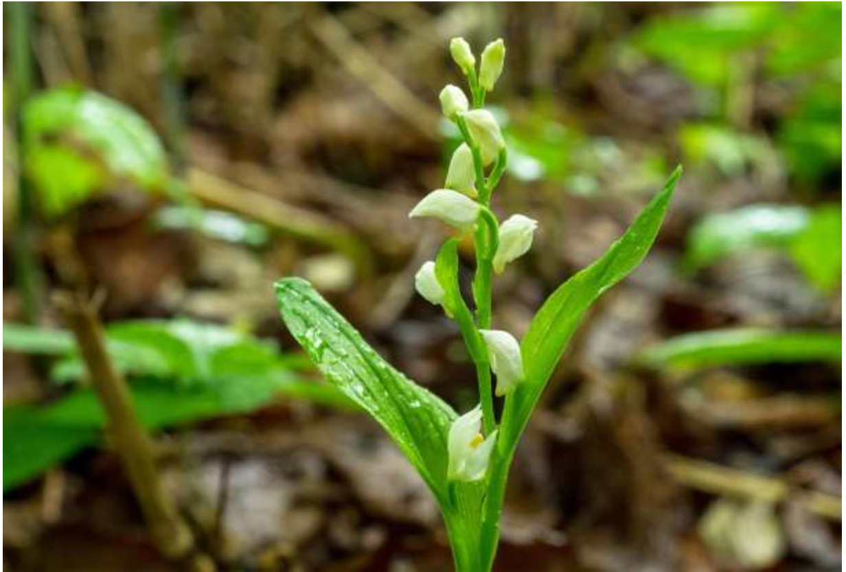
“Gin-ran” Family: Orchidaceae / ラン科 キンラン属

日本全国の山地や丘陵で広葉樹林の林下に咲く草丈10～30cmの多年草で、朝鮮半島からヒマラヤ東部にかけても分布する。茎は直立して毛がなく、長さ3～8cmの葉3～6枚が互生する。茎の先に白い花が5～10個つき、花序は最上位の葉と苞よりも高い位置にある。花は長さ1cmほどでありあまり開かないが、白い萼片と白い花弁が3枚ずつあり、広披針形の側花弁は萼片よりは短い。唇弁は3裂し、中裂片は楕円形で先が尖る。唇弁の基部は短い距となって外に突き出す。花自体は特に美しいとはいえないが、植物全体の雰囲気は何とも雅な好ましいランだ。ギンランは菌と共生するので、山から庭に移植しても育たない。本州では激減したというが、道内では今でも普通に見られるランで、春の里山歩きを楽しくしてくれる。◇2019.06.10 札幌市、定山溪天狗岳