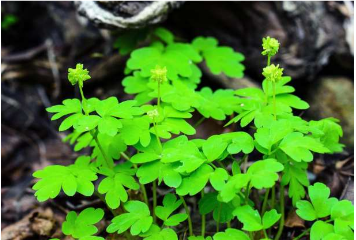
“Renpuku-sou” Family: Viburnaceae / ガマズミ科 レンプクソウ属

北半球の温帯と北西アフリカに広く分布する草丈5~15cmの軟弱な多年草で、国内では北海道、近畿地方以北の本州、北九州の湿った林内に生える。黄緑色の花は足下にあってもすぐには気づかないほど目立たないが、葉はユニークな形で面白い。根生葉は2回3出複葉で、茎の中程には3出複葉の茎葉が対生する。葉には光沢が無く、布のような雰囲気だ。レンプクソウにはゴリンバナ（五輪花）という別名があるとおり、茎頂に5つの花が集まって径6-7mmほどのブロック状に咲く。上端で上向きに咲く花は花冠が4裂するが、横向に咲く4つの花は5~6裂するという珍しい構成だ。こういう面白い植物があることを知らなければ見過ごしてしまうが、知った後はあちこちに生えていることに気がつく。札幌近郊では、登山道脇にも普通に生えている。◇2012.05.08 札幌市、円山公園