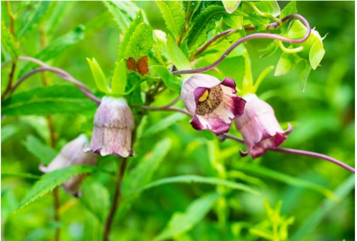
“Baa-sobu” Family: Campanulaceae / キキョウ科 ツルニンジン属

日本全土と、朝鮮半島から極東ロシアまでの山野の林下や林縁に生えるつる性の多年草で、つるの長さは2mほど。花のよく似たツルニンジンがジイソブとも呼ばれるのに対して、「お婆さんのそばかす」という意味合いでバアソブと呼ばれている。花は長さ2～2.5cmとツルニンジンより小型で、外側は白色ではなくて茶紫色のものが多し、内側の色模様もかなり濃い。花期は7～8月で秋に咲くツルニンジンよりも季節が早く、葉の裏に白い毛が生える点でも違いがある。ツルニンジンは多くの場所で普通に見かけるおなじみの花だが、バアソブは数が少なく、事前情報なしではおいそれとは見られない珍しい花だ。そのこともあり、運よくこの花に出会えた時は、期待に違わない美しさに満足すること請け合いである。◇2016.08.10 白老町