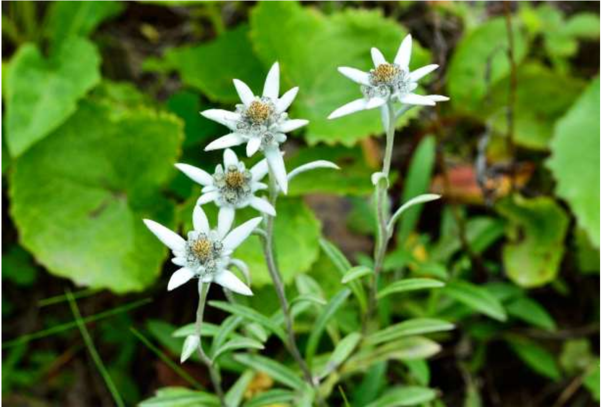
“Ezo-usuyuki-sou” Family: Asteraceae / キク科 ウスユキソウ属

北海道と極東ロシアに分布する草丈15～30cmの多年草で、絶滅危惧IB類とされている。道内では礼文島と道東の海岸草地のほか、中央高地の高山～亜高山帯にも自生する。これはヨーロッパアルプスで有名なエーデルワイスの仲間であり、全体に白い綿毛がある。ロゼット状の根生葉と互生する茎葉は、裏面に特に毛が多くて白く見える。白い花弁のように見えるのは綿毛に覆われた苞葉で、大きさの異なるものが組み合わさっている。5～22個の頭花を密につけ、中心部にある雌花の周りを雄花が取り囲むが、開花直前の花を見ると「ライオンの足」という属名のいわれとなった「ネコ科動物の足裏」という発想に納得である。ウスユキソウ属の花は花後もしばらく形が崩れないが、美しいと思える期間は、開花直前から頭花が咲いた直後までに限られよう。◇2014.07.16 礼文島、礼文林道