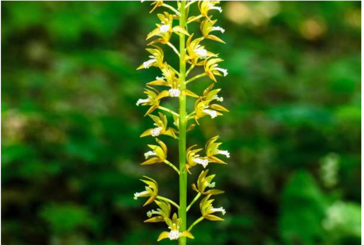
“Kokei-ran” Family: Orchidaceae / ラン科 コケイラン属

日本全土と台湾から極東ロシアまでの近隣諸国に分布するランの仲間で、長さ20～30cmの細長い葉が2枚つき、その脇から高さ20～40cmの花茎が立つ。葉は乾燥した感じで艶がなく、表面に筋状のしわが目立つが、枯れることなく冬を越して春には枯れる。花序は長さ10～20cmほどの総状で、長さ8mmの花が沢山付いて下から順に咲き上がる。3個の萼片は褐色がかった黄色の披針形、2枚の側花弁も同色の披針形だが濃色の筋がある。唇弁は白色で赤紅色の斑点があるのが普通だが、斑点のないノッペラボーの個体も多く見られる。ランの仲間は全国的に数が減っているが、道内のコケイランに関しては、今のところはあちこちの林下で普通に見られて心強い。時には、住宅地近くの林内に多数林立するという、ビックリするような光景にも出合う。◇2012.06.11 白老町、萩の里自然公園