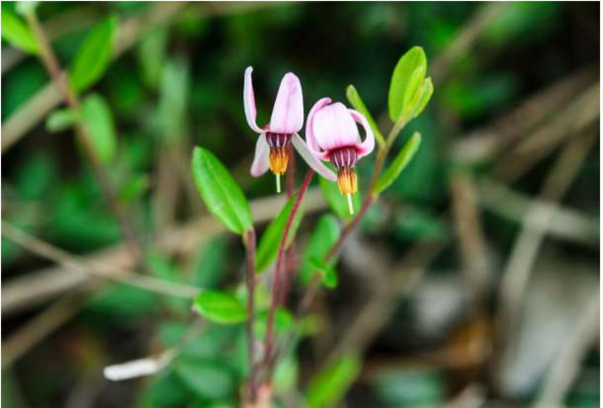
“Tsuru-koke-momo” Family: Ericaceae / ツツジ科 スノキ属

北半球の寒冷地に広く分布する高さ10cmほどの常緑小低木で、国内では北海道と中部以北の本州で高層湿原に自生する。ミズゴケ類の生える様な湿原環境で細い茎を伸ばし、その先から1~4本の花柄を立ち上げて、先端に1個ずつ淡紅色の花を下向けにつける。花冠は4深裂し、裂片の長さは7~9mmで背面に反り返る。大きめの子房は濃赤紫色で淡紅色の筋模様が入るのがしゃれており、束になったオレンジ色の雄しべと、そこから突き出す白い雌しべまでの繋がりが実に美しい花だ。ツルコケモモとその近縁種の実はクランベリーとしておなじみで、私が一時期居住した米国マサチューセッツ州の海岸地帯では、秋になるとクランベリー畑に水を張り、水面に浮いた実を機械ですくって収穫していたのを思い出す。◇2011.07.02 幌別町、サロベツ原野