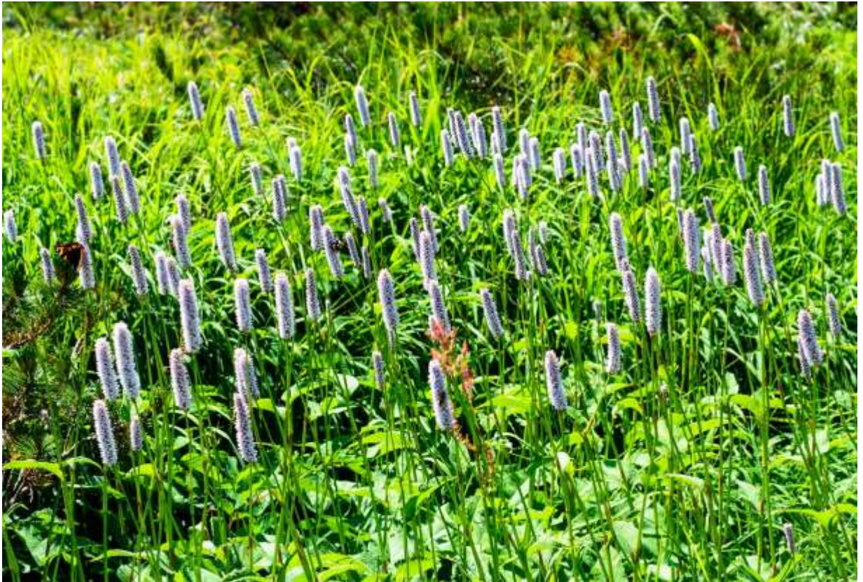
“Ezo-ibuki-tora-no-o” Family: Polygonaceae / タデ科 イブキトラノオ属

本州中部から極東ロシアまで分布する草丈20～100cmの多年草で、本州に多いイブキトラノオとは兄弟関係の亜種同士だ。道内では夕張山地、中央高地から礼文島の海岸近くまでの広い範囲に分布するが、生えている場所は限られる。根生葉はタデ科の特徴を良く示していて長さ20cmにもなる。茎の頂部に付く花穂は長さ3～6cmで淡紅色だが、白色に近いものも多い。基準亜種は北半球の寒冷地帯に広く分布し、ヨーロッパでは古くから知られる薬草で食用にもなる。エゾイブキトラノオはイブキトラノオよりは花穂が太くて色も濃めだが、ヨーロッパアルプスで見かける基準亜種の花穂は、もっと太くて色の鮮やかなものが多い。この背の高い花は群生することが多いので、花時の自生地では目立って圧倒的な存在感を示す。◇2011.08.09 大雪山白雲小屋付近