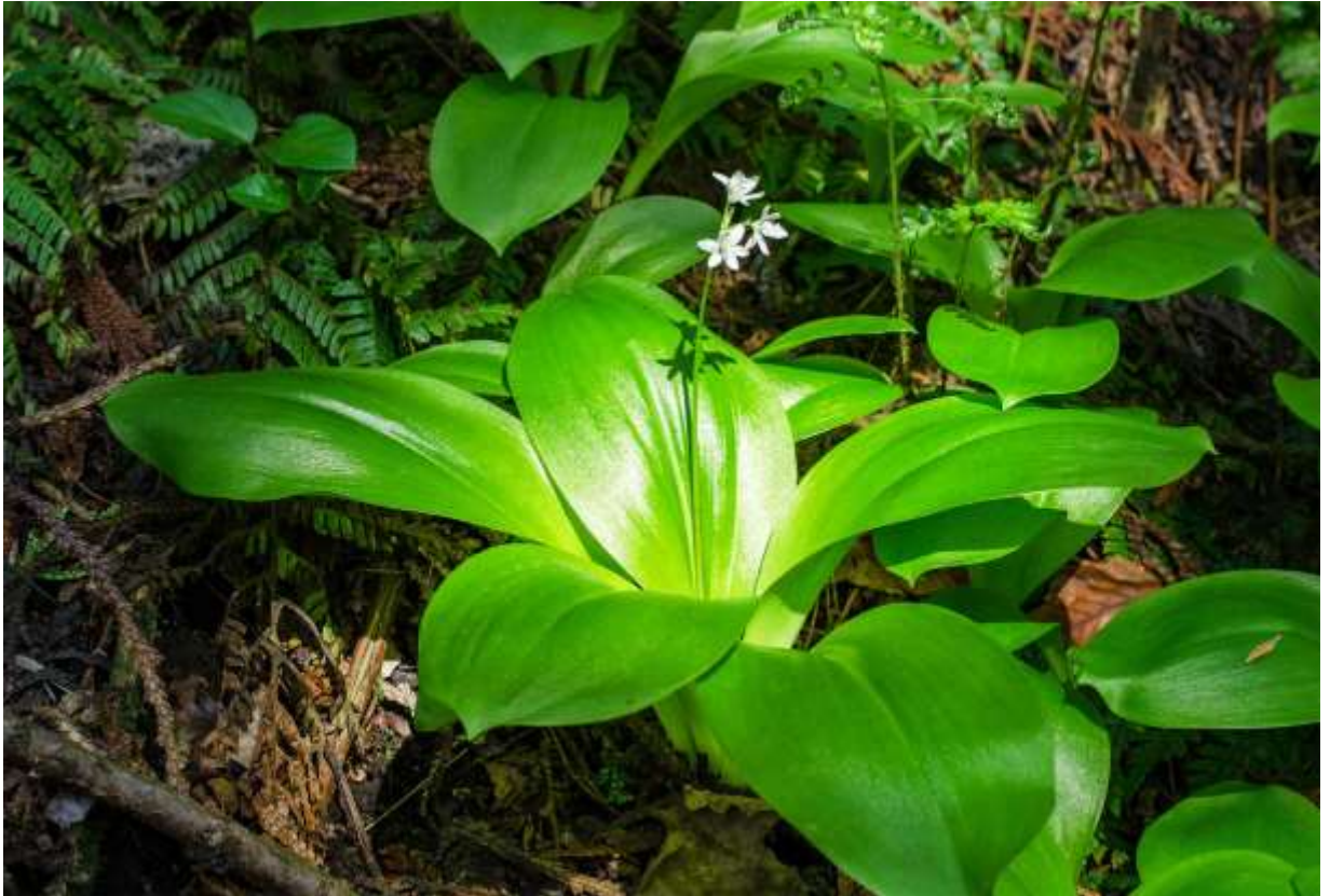
“Tsubame-omoto” Family: Liliaceae / ユリ科 ツバメオモト属

北海道と近畿地方以北の本州を含む東北アジアに分布する多年草で、古くから栽培されている「オモト」によく似た大きな葉が目立つ。花時の草丈は15~30cmだが、開花後は花茎が倍の高さになる。私は本州であまり大きな群落を見た経験がなく、やや珍しい植物という印象であったが、北海道に来たらあきれるほど普通にあり、あちこちで目を見張るほどの大群落に出会う。すらりと伸びた長い花茎の頂部に白い花が群がって咲く風情もなかなかのものだが、長楕円形で長さが15~30cmもある根生葉の存在感は圧倒的だ。花のない時期であっても、葉の傷んでいない株に出会えば思わずほおがゆるむ。花後に花茎は長く伸びて鮮やかな藍色の実をつけるが、実のある風情もなかなか良い。和名のツバメの由来については、これまで説得力のある説を聞いたことがない。◇2012.05.14 厚沢部町