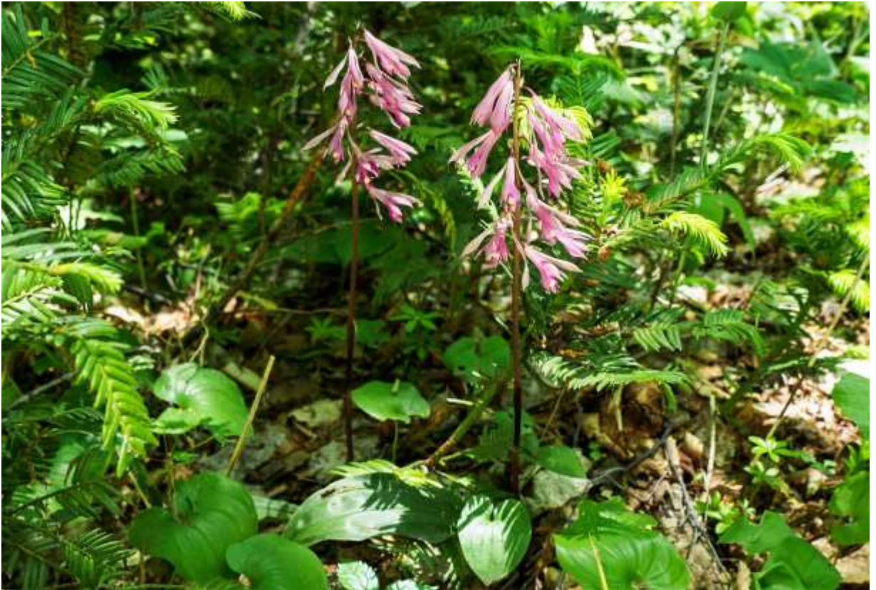
“Saihai-ran” Family: Orchidaceae / ラン科 サイハイラン属

日本全土の山地の樹林下に生える高さ30～50cmの多年草で、近隣諸国とヒマラヤにも分布する。笹に似た葉は普通は1枚だけで長さが15～35cmと大きく、艶があって緑色のまま越冬することが多い。長く伸びた花茎の先に多数の花を一方に偏って斜め下向きにつける。花は長さ3～4cmで、萼片と側花弁は淡紫褐色～淡紅紫色でありあまり開かない。唇弁は先が3裂し、側裂片は鮮やかな紅紫色でよく目立つが、棒状に突き出したずい柱との組み合わせはカマキリみだ。サイハイランはラン科としては地味な部類であるが、自生株を採取して庭植えにする人が未だにいる。しかし、うまく開花しても衰弱して数年で枯死するのは、共生菌からの栄養を必要とする腐生植物だからであり、比較的数が多いとはいえ、採取するのは止めるべきである。◇2018.06.06 江別市