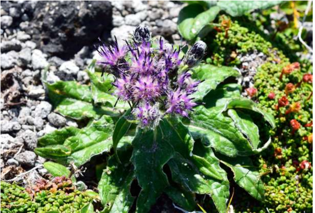
“Usuyuki-touhiren” Family: Asteraceae / キク科 トウヒレン属

トウヒレン属は日本に64種も分布しており、さらに多くの変種や品種がある。このうち59種が日本固有だという。本種は高山の礫地や草地に生える北海道固有の種で、葉の形や毛の生え方の違いで多くの品種があったが、現在はウスユキトウヒレンとその変種ユキバトウヒレンの2つに纏められ、前者は絶滅危惧IB類に指定されている。写真はウスユキトウヒレンと考えているが、ユキバトウヒレンとの違いはあまり定かではない。地面にへばりつくように広がった葉は長さが8cmほどまでになり、先の尖った葉の縁が波打って独特の存在感がある。頭花は鮮やかな紫色が目を引くが、突き出した暗色の雄しべはこの仲間に通ずる特徴だ。これは、とにかく丈夫な植物で、夏が終わっても色あせた頭花がそのままの形で残っていることが多い。◇2011.08.09 大雪山系北海平