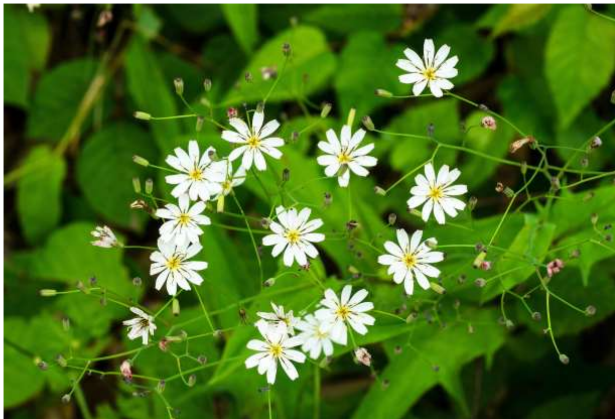
“Shiro-bana-niga-na” Family: Asteraceae / キク科 ニガナ属

日本全土と朝鮮半島から極東ロシアの一部まで分布する草丈40~70cmの多年草で、低山から高山帯の林縁や草地に生える。茎を切ると苦みのある汁が出るので“〇〇ニガナ”と呼ばれる仲間の一員だが、どこにでもあって黄色い花を咲かせるハナニガナよりは、生えている場所は少ない。頭花は直径2cmほどだが、茎が極めて細くて長いので、宙に浮いているように見える。黄花のニガナの仲間には多くの種や亜種、変種があり、あまりにも普通に見られるので気にもとめないが、シロバナニガナが群生しているとオヤと思って足が止まる。特にスキーリフトの下では大群落を作っていることが多く、接写するつもりで近づくと、結構美しい花だなと再認識することになる。一つの株で多数の蕾をつけ、花を順に咲かせるので花期は長い。◇2011.08.02 雨竜町、雨竜沼湿原