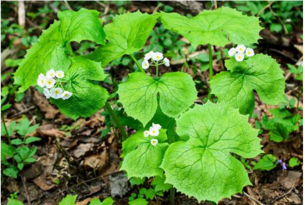
“San-kayou” Family: Berberidaceae / メギ科 サンカヨウ属

本州の中部地方以北からサハリンまで分布し、湿り気のある山地に生える多年草で、草丈は30～60cm。本州中部では深山に咲く花というイメージだが、道内では札幌の円山公園でもお目にかかれる。とにかく美しいけど変わった姿の植物で、1本だけ伸びた茎は2分裂して先端に葉を1枚ずつ付ける。下の葉には長い柄があり横長の腎円形で幅30～35cm。上の葉には柄が無くてより小型だが、両方共に中央部に深い切れ込みがあり、縁には粗くて不規則な鋸歯がある。茎頂から伸びた花柄の先に径2cmほどの白い花が3～10個つき、平開する6枚の花弁と、緑色の柱頭、黄色い雄しべの配置がおしゃれな感じだ。カヨウとは蓮の葉を表す言葉で、サンカヨウの葉が蓮の葉と似ているとして、「山の蓮の葉」という意味で和名が付いたという。◇2012.05.09 札幌市、砥石山