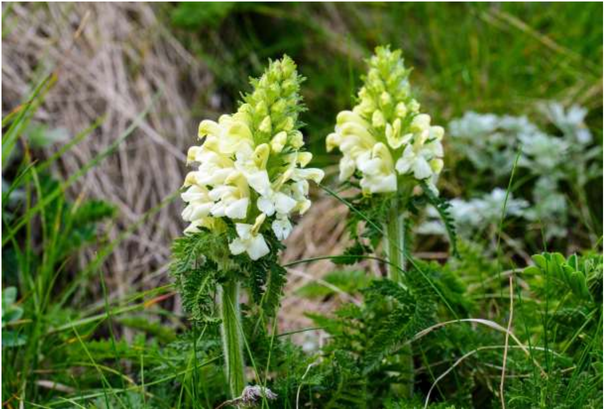
“Nemuro-shiogama” Family: Orobanchaceae / ハマウツボ科 シオガマギク属

道東と道北の海岸近くの岩場や草地に生える草丈15～30cmの多年草で、南千島、サハリンにも分布する。互生する葉は羽状に全裂し、裂片はさらに深裂して鋭い鋸歯があり、人参の葉のようだ。茎は太く、葉にも茎にも白色の軟毛が密生する。花は白色～淡黄色で茎の上部に密集して多数つき、花冠は上下2唇形で上唇は下唇より長くて下向きに曲がる。花は下から上に咲き上がるが、上唇は上から見ると少し曲がってついており、花全体がカザグルマのように時計回りの模様を作って面白い。もっとも、これは赤い花をつけるタカネシオガマにも共通する特徴だ。ネムロシオガマは国内では北海道限定だが、道内でも生えているところは限られる。根室半島では岩場に小型の株が多くあり、礼文島では草地に生える背の高い株が多く見られるようだ。◇2012.06.05 礼文島