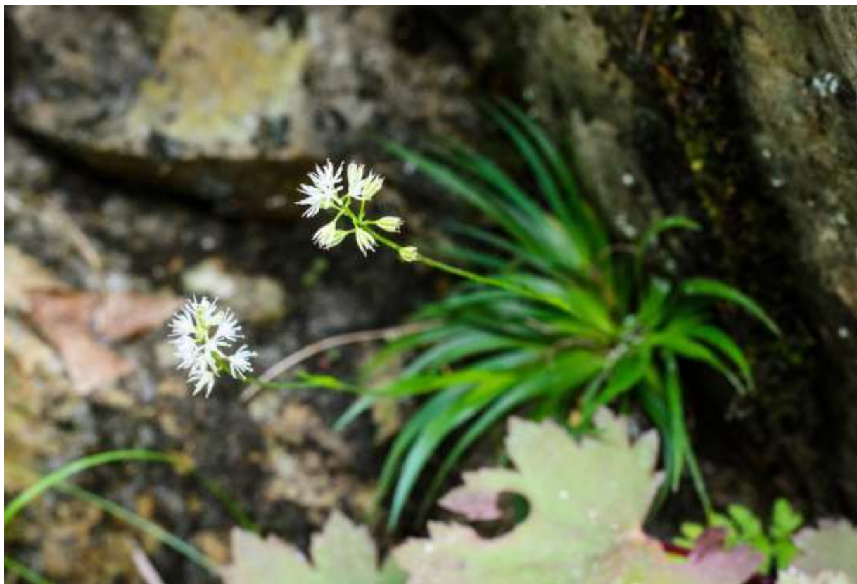
“Apoi-zekisyou” Family: Tofieldiaceae / チシマゼキショウ科 チシマゼキショウ属

北海道と本州の中部地方以北の高山帯や山地帯の岩上に生える草丈6~20cmの多年草で、韓国の済州島にも自生する。基準変種のチシマゼキショウよりは花がまばらにつき、花柄も長さ2~5mmと長い。前のバージョンでは写真の個体をチャボゼキショウとしたが、平凡社図鑑では、チャボゼキショウとアポイゼキショウを別々の変種とし、前者は本州以南に分布するとされている。アポイゼキショウは、アポイ岳の稜線に生えるものは花茎が垂直に立って草丈も低いが、溪谷の崖に生えるものは花茎が横に長く伸びる。根生葉の長さは4~12cmと変異が大きい、やはり溪谷に生える株では長くなる。とにかく生えている場所によって雰囲気が大きく異なる植物だが、私の好みからいえば、写真の様に深い溪谷の切り立った崖に生えているものがベストである。◇2012.08.03 平取町、糠平川