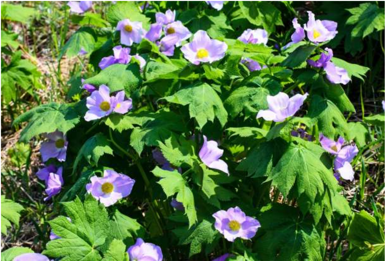
“Shirane-aoi” Family: Ranunculaceae / キンポウゲ科 シラネアオイ属

日本の大型の野草としては最も美しい花をつけるものの一つで、北海道西部から本州中部までの日本海側に分布する1属1種の貴重な日本固有種である。本州では限られた山の高い場所でしか見られないが、道内では海岸から山頂近くまでのあちこちに、大きな群落が普通に見られる。葉は3枚あり、下の2枚は掌状に7~11中裂し、3枚目の葉は小型で鋸歯縁。茎頂に1個付く径5~8cmの大きな花には花弁が無いが、淡紅紫色の4個の萼片が花びら状に展開して実に美しい。V字型にくっついた2本の雌しべはそのまま成長し、魚のしっぽ状の果実になるので、花が無くてもすぐ見分けが付く。萼片の形と色には変化が大きいですが、純白の花は道内でもかなり珍しいものなので、自生する白花に出会えた人はラッキーと喜ぶべきであろう。◇2012.05.28 札幌市、手稲山