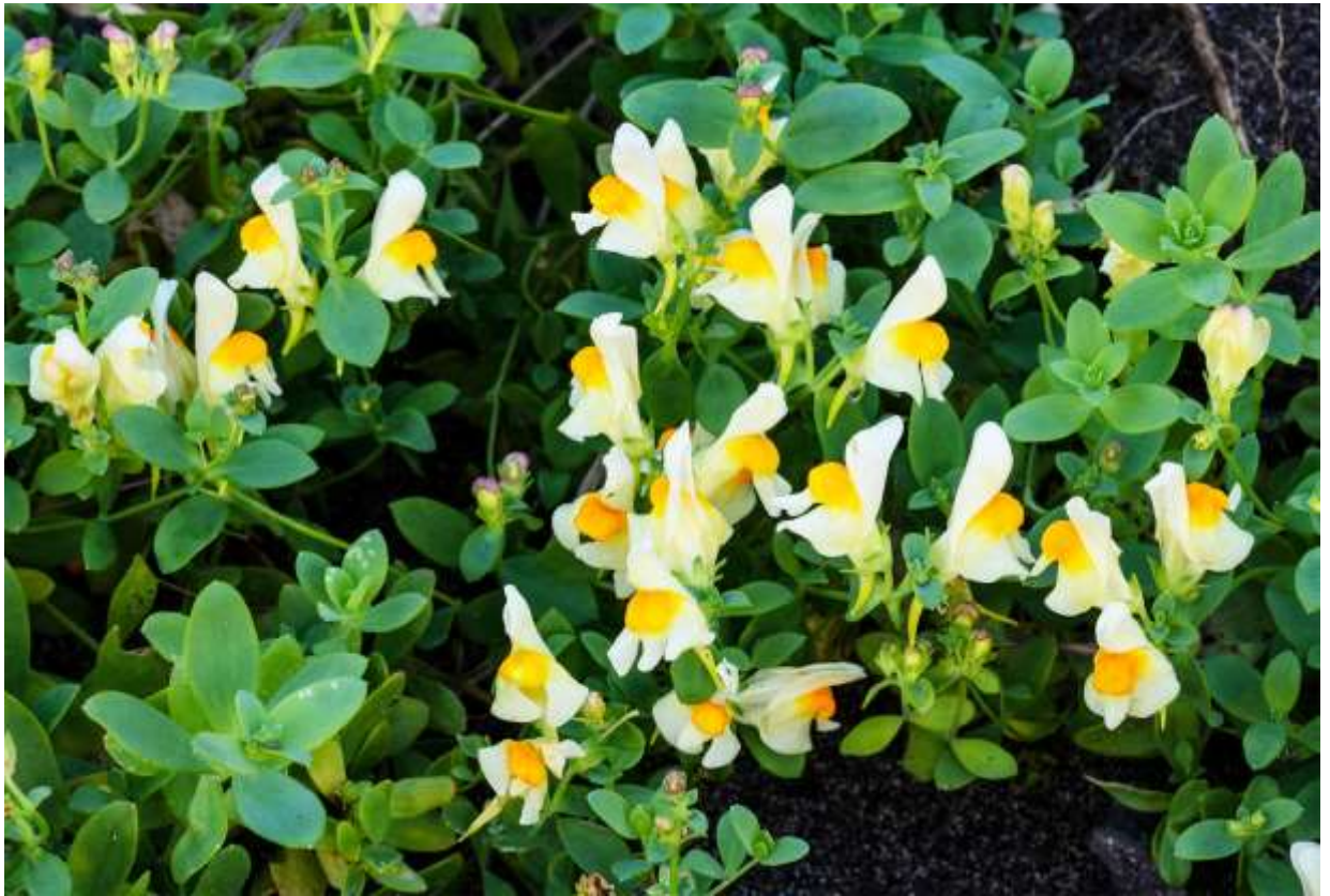
“Un-ran” Family: Plantaginaceae / オオバコ科 ウンラン属

北海道、本州の大部分と四国北部に分布し、海岸の砂地を這うようにして生える多年草で、長さは20～40cm。国外では朝鮮半島と極東ロシアに分布する。和名は海岸のランという意味だろうが、似ているランは思い当たらない。むしろ、キンギョソウを思わせる花の造りで、中央に丸く飛び出したオレンジ色の部分と後ろに突き出した距が面白い。緑白色の葉は長さ1.5～5cmの楕円形で鋸歯はなく、このユニークな花との組み合わせは好ましい。花は似ているものの、高く伸びて風情のない帰化植物のホソバウンランと比べると、日本のウンランは遙かに風情がある。国内ではウンラン属はこの1種のみだが世界には100種ほどあり、ヨーロッパアルプスには、紫色とオレンジ色の組み合わせという、派手で美しい花を持つ近縁種( L. alpina )が存在する。◇2011.09.23 石狩市、石狩浜