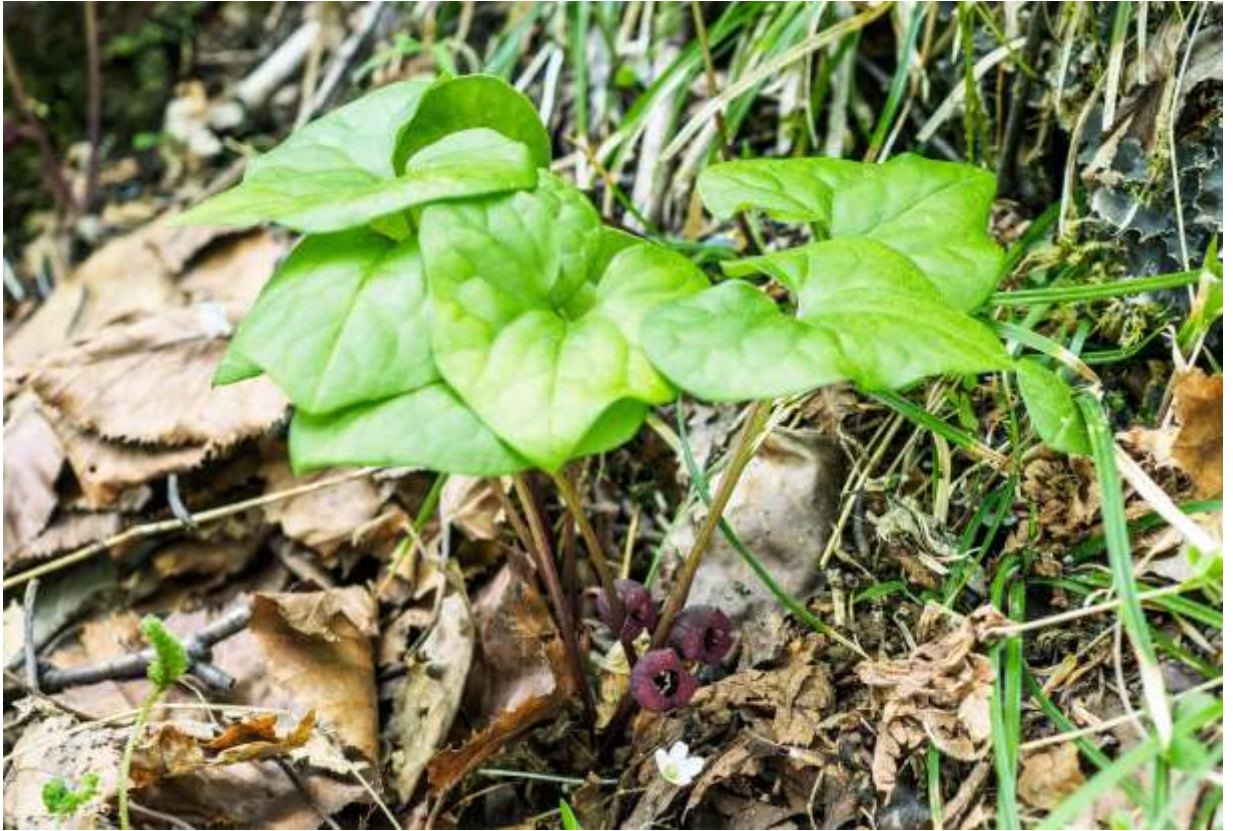
“Oku-ezo-saisin” Family: Aristolochiaceae / ウマノスズクサ科 カンアオイ属

日本には50種以上のカンアオイ属があるが、その多くは地域性が強くて日本固有種も多い。加えて、この仲間はずもともと温帯系で寒冷地への適応は鈍い。その中で、このオクエゾサイシンだけは北方系の種で分布範囲が広く、本州北部からサハリンやシベリア東部まで分布するようだ。当然の帰結として、本種は道内に自生する唯一のカンアオイ属であり、春の女神ともいわれるヒメギフチョウの食草でもある。根元から高さ10~15cmまで伸びる2枚の葉は、カンアオイ属を特徴付けるハート形で先はややとがる。花は葉の間から出る柄の先で横向に1個付き、花弁は無く、肉厚の赤茶色の萼が3分裂して先が反り返る。花の径は10~15mmほどだが、地味な色合いなのと根元で咲くため、意識して探さないと気づかないことも多い。◇2017.05.25 占冠村、赤岩青巖峽