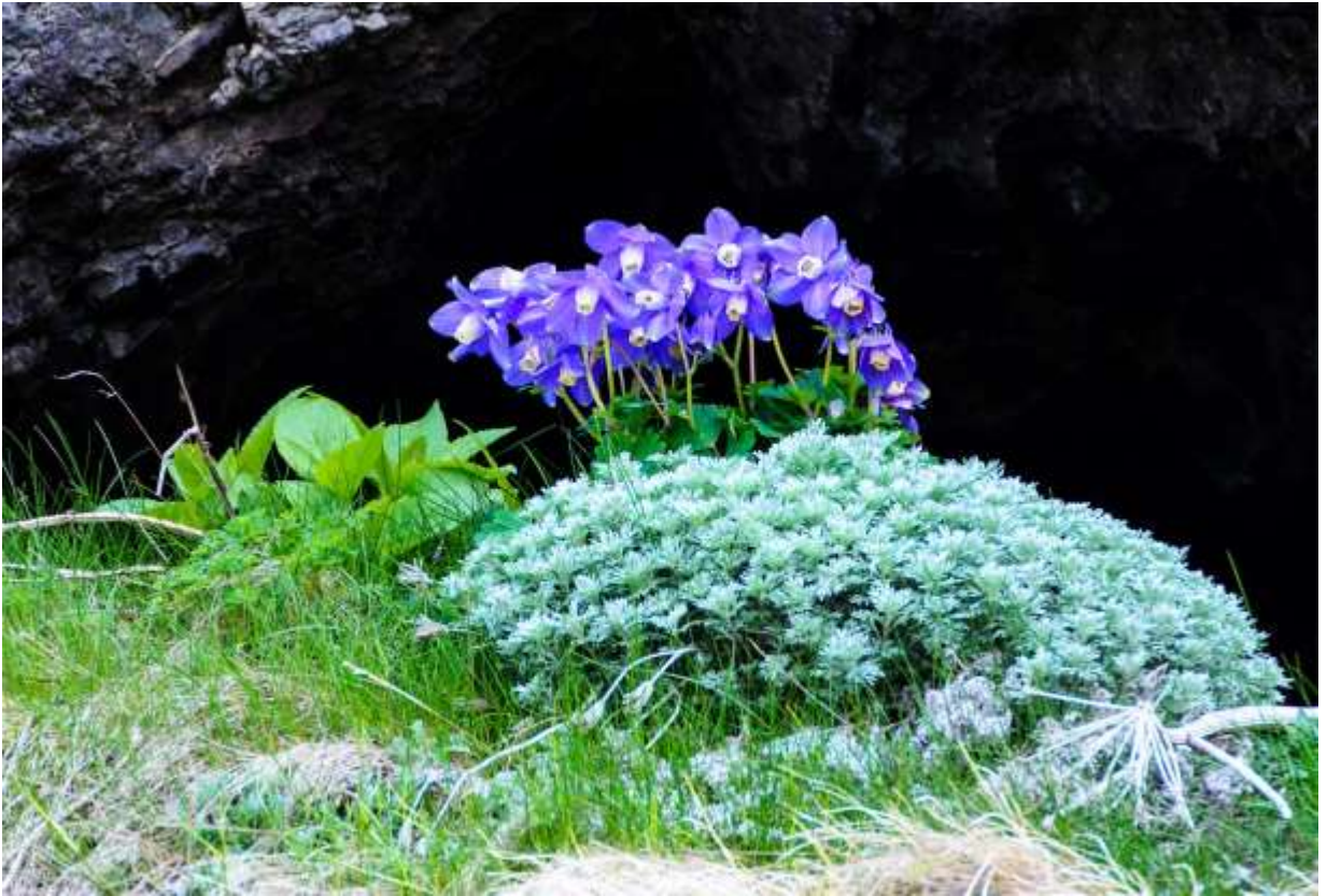
“Miyama-odamaki” Family: Ranunculaceae / キンポウゲ科 オダマキ属

中部地方以北の日本列島と東アジアに分布する草丈15～30cmの多年草で、山地帯～高山帯の岩場や草地に生えるが、礼文島では海岸でも普通に見られる。根生葉は2回3出複葉で小葉はさらに裂けるが、硬くて光沢のある青緑色の葉を持つこの植物は花が無くても美しい。鮮やかな青紫色の花は下向きに咲き、径は3～4cm。萼片は5個あり広卵形で笠状に広がり、その内側に花弁が円筒形にまとまって付く。花弁は先端が白く、基部からは萼の間を抜けて距が後方に伸びて内側に巻く。とにかく花の造りが面白い上に、青紫色の萼と白い花筒の組み合わせは、日本の野生花としては最高の造形だ。私が子供の頃、近所の石垣の間から咲いているオダマキの美しさに魅了された記憶があり、その原種なのだから、魅力を感じるのも当然といえば当然かもしれない。◇2012.06.04 礼文島、江戸屋