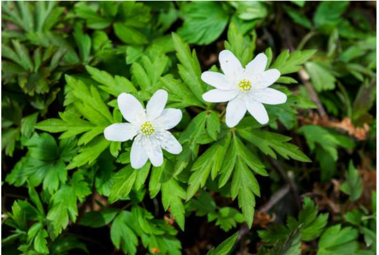
“Urahoro-ichige” Family: Ranunculaceae / キンポウゲ科 イチリンソウ属

最近（1984年）になって国内に自生することが分かった草丈10～20cmほどの多年草で、道東の限られた地域に生える。しかし、種名からも分かるように、中国や極東ロシアに広く分布し、ロシア沿海州では最も普通に見られるアネモネだという。道内にも多いキクザキイチゲ（B:p.20）と似ているが、全体にやや小ぶりで花も径2～3cmと小さく、花卉状萼片の数も5～8枚と少なめである。青花もあるキクザキイチゲとは異なり、本種の花は白花のみ。また、茎葉の子葉の切れ込みが深いともいわれるが、ある程度の変異幅があるし、キクザキイチゲにも切れ込みの深いタイプがあるので、明確な違いとはいえないようだ。本種の小さくまとまった花は可愛らしいという表現がぴったりで、おおらかに展開するキクザキイチゲの花とは違った意味での好ましさがある。◇2017.05.01 浦幌町、留真