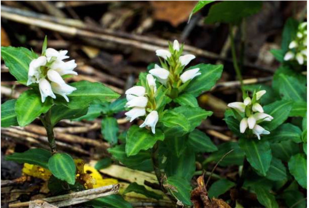
“Akebono-syusu-ran” Family: Orchidaceae / ラン科 シュスラン属

日本全国の低地帯～山地帯の樹林下に生える常緑の多年草で、朝鮮半島にも分布する。茎は地を這い、先端が立ち上がって高さ5～10cmになる。葉は長さ2～4cmの卵状楕円形で数枚が密に互生し、縁は不規則に波打って白い縦筋状の葉脈が目立つ。花は茎上部に数個～10個ほど横向きにつき、長さ1cmほどで淡紅色を帯びるが、殆ど白色の花も多い。萼片は長さ8mmほどの狭卵形で、花弁もほぼ同長。背萼片と側花弁は癒着して断面が三角状となり、舌状の唇弁を覆う。花はあまり開かないが、正面から見ると立体的でユニークな構造が面白い。この花はミヤマウズラ（次頁）と似ているが、草丈は低いし、葉が花序直下まで密生するので全体的な印象はかなり異なる。ランとしては地味な花だが、花の少ない時期の林内に咲くので結構目立つ存在である。◇2017.08.31 江別市、野幌森林公園