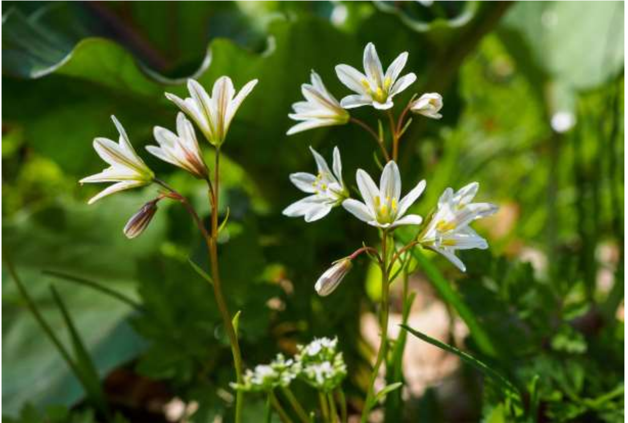
“Hosoba-no-amana” Family: Liliaceae / ユリ科 チシマアマナ属

日本全土を含む東北アジアに分布する草丈10-25cmの多年草で、低地や低山の明るい林内に生える。チシマアマナ属には20種ほどあるが、周北極植物であるチシマアマナ(p.138)を除いてはアジアに限定らしい。本種の根生葉は1個で、長さ10-20cmの線形。下部の茎葉は長さ3-6cmだが、上部ほど小さくなる。茎上部に白色の花を1～5個つけ、長さ1～1.5cmの花被片には緑色の筋が入る。花被片は6枚が普通だが5枚のものも見られるし、細長くて縁がうねったタイプと、ずんぐりした真っ直ぐなタイプとがある。ひよろひよろと伸びて、あまり目立たない花だが、近寄ってよく見ると、ストライプの入った白い花被片と、黄色い葯の目立つ6本の雄しべの組み合わせはなかなかしゃれている。群れて咲くことは少ないのだが、撮影地では群生することもある。◇2019.05.12 恵庭市、恵庭公園