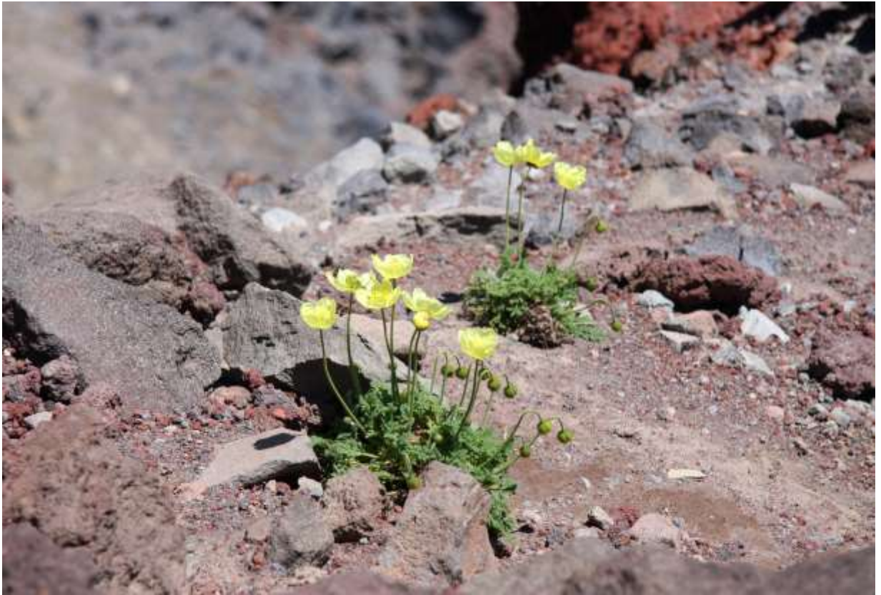
“Rishiri-hinageshi” Family: Papaveraceae / ケシ科 ケシ属

これは国内に自生する唯一のケシで草丈は20cmほど。利尻山の山頂部に特産し絶滅危惧IB類に指定されている。全体に荒い毛が生え、根生葉は粉白色をおびた緑色で羽状に細かく切れ込む。花茎の先に付く蕾は下向きだが、開花すると直立して上向きとなる。花は淡黄色の4弁花で直径は4~5cmほど。太い緑色の子房がよく目立つ。荒い毛の生えた2枚の萼片は開花すると落下する。最近の遺伝子検査で、外見の似ている外来種か栽培種が、利尻山上部の自生地でも本種と混じって生えていることが判明した。明らかに人為的な繁殖の結果である。本物のリシリヒナゲシは自生地において減少しており、登山道から観察できる株は数少ない。遺伝子を確認しながら自生株を増やすとする、地元の方々の努力に期待したい。◇2008.06.30 利尻山上部