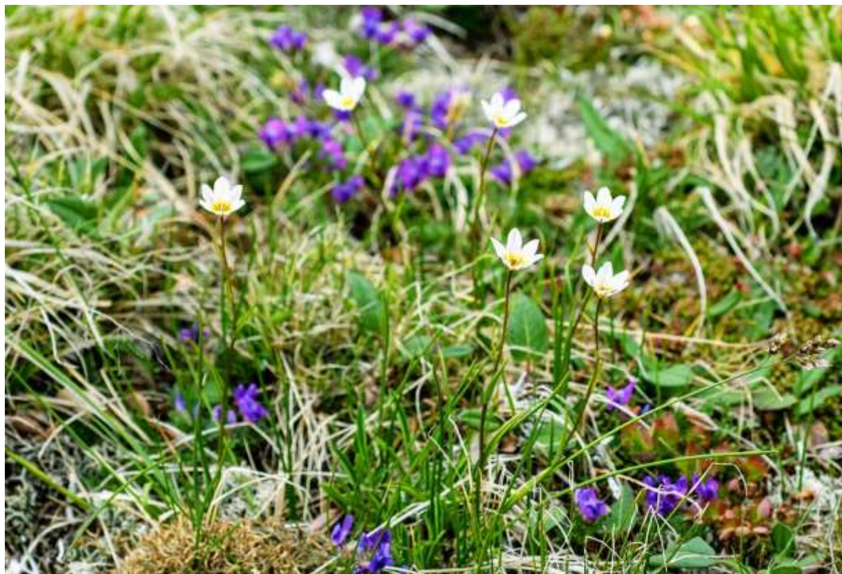
“Chishima-ama-na” Family: Liliaceae / ユリ科 チシマアマナ属

北海道と中部地方以北の高山に生える高さ7～15cmの多年草だが、花がおとなしいのであまり目立たない。国外では北半球の周極地方と高山に分布し、ヨーロッパではアルプスや英国に自生する。北米大陸では西部に広く分布するが、東部には分布しない。高山の花としてシーズン最初に咲くものの一つで、大雪山ではホソバウルップソウ(p.90)やエゾオヤマノエンドウ(p.127)と一緒に咲いている。ひょろりと伸びた茎の根元には長さ20cmにもなる細長い根生葉が2枚あり、茎にも小さめの細長い葉が2～4枚つく。花は茎頂に1個上向きにつき、大きさは径2cmほど。白い花被片が6枚あって中央部が黄褐色を呈する。全体の姿形がぱっとしないし、花もさほど美しくはないのだが、岩場で風に揺られて咲いている姿は高山植物らしくて好ましい。◇2006.07.02 大雪山系小泉岳