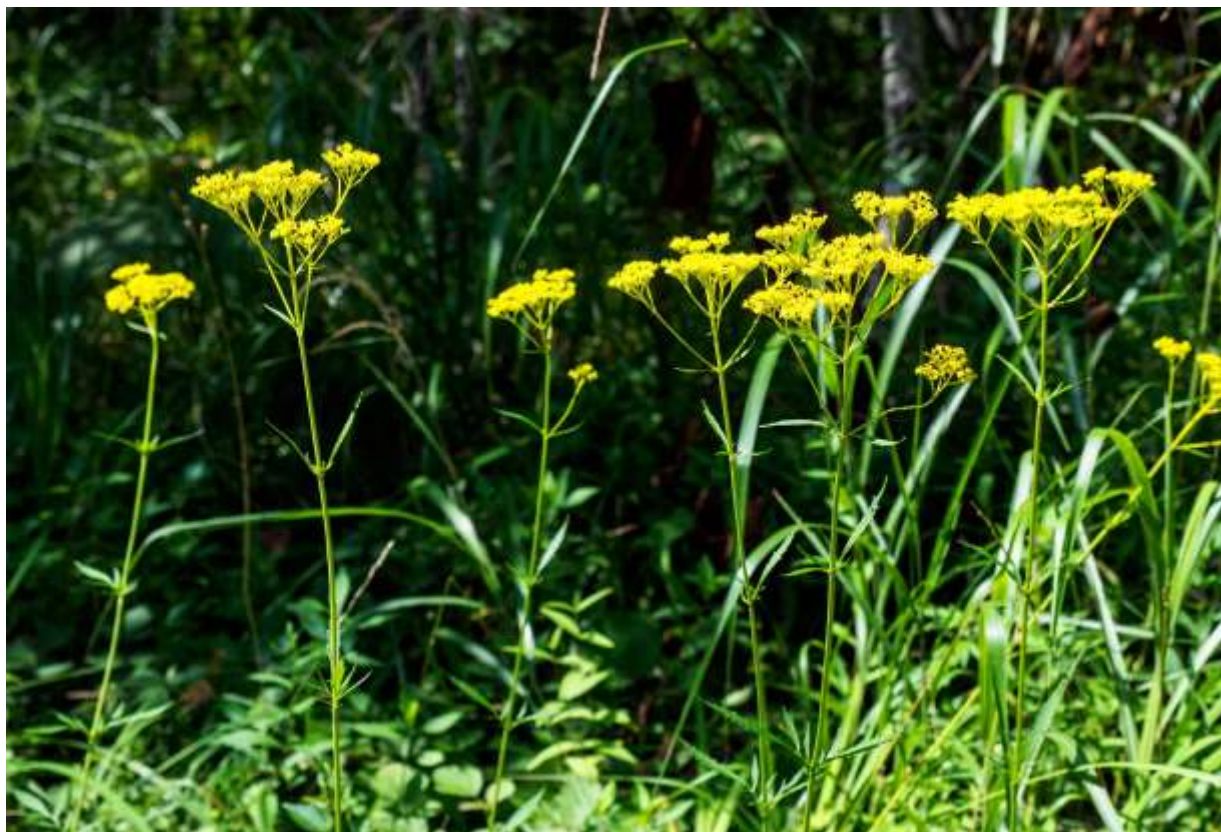
“Omina-eshi” Family: Caprifoliaceae / スイカズラ科 オミナエシ属

日本全土と朝鮮半島からモンゴル・シベリア東部にかけて分布する多年草で、日当たりの良い山地草原や海岸の草地に生える。これは、いわずとも知れた秋の七草の一つだが、本州では大きな群落は数少なくなってしまった。しかし、道内では珍しい花ではなく、8月の始め頃から高速道路の斜面にも多く咲いている。黄色の花を付ける秋の野草は多いが、本種の花は赤みのない純粋な黄色であり、草丈が1m以上にもなって上部で枝分かれする草姿と相まって、遠目にもよく目立つ。しかし、花は鮮やかだが、乾かすといやなにおいがする。道内の海岸地帯には、草丈が低くてがっしりした造りの株が多く、すらりと伸びて風に揺れているオミナエシの風情はないが、道産子馬を連想して、それなりに微笑ましい。◇2017.08.26 苫小牧市、勇払原野