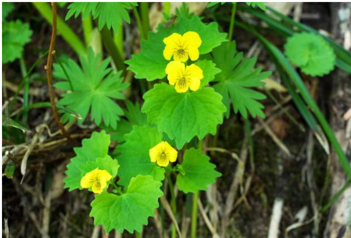
“Jinyou-kisumire” Family: Violaceae / スミレ科 スミレ属

亜高山帯～高山帯に生える北海道の固有種で、絶滅危惧IB類の多年草。生えている場所は大雪山系と札幌近郊に限られており、どこでも見られるわけではないが、大雪山の一般登山道では、注意深い人なら簡単に見つけられるところがある。草丈は15cmほどで、葉を3枚付け、下の2枚は名前の通りの腎形だが、上の葉は小型の三角形だ。葉は柔らかく、丸みのある鋸歯があって独特の雰囲気を出す。茎の頂部から伸びた花柄に黄色い花を横向けに1～2個つける。花の大きさは1.5cmほどで、唇弁には明瞭な濃茶色の網目模様があり、他の花弁にも同色の筋模様があるが、模様部分が凹むので花弁全体に凹凸が生まれて面白い。ジンヨウキスミレは国内の黄色いスミレ中では最も美しい種と思われ、道内でのみ出会えるというのは何かうれしい。◇2017.07.07 大雪山系黒岳