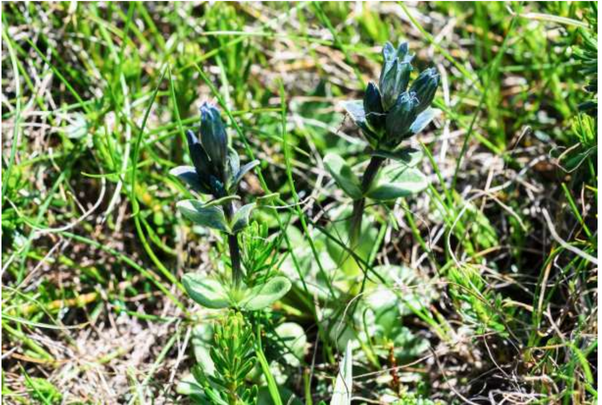
“Yokoyama-rinndou” Family: Gentianaceae / リンドウ科 リンドウ属

北東アジアから北米大陸北西部まで広く分布する多年草で、草丈は5～12cmほど。ツンドラや高山など樹木の生えない草原やれき地に生え、日本では大雪山系の限られた場所にだけある。厚みと艶のある葉は全縁の長楕円形で、長さ7～15mmの葉が数段対生する。茎頂に1～数个つく花は長さ12～15mmと小さく、先は浅く5裂して太陽光の強いときだけわずかに開く。花冠の色調は国内にあるどのリンドウとも違っており、青インク色で全く目立たない。種小名の glauca は「淡青緑色の」という意味だが、地質学の世界にはglaucinite（海緑石）という粘土鉱物があり、道内の海成層にも含まれている。海緑石はヨコヤマリンドウの花よりは緑色がかった色調だが、この花に出会うと海緑石を思い出し、親近感を覚えるのが我ながらおかしい。◇2011.08.09 大雪山系白雲岳