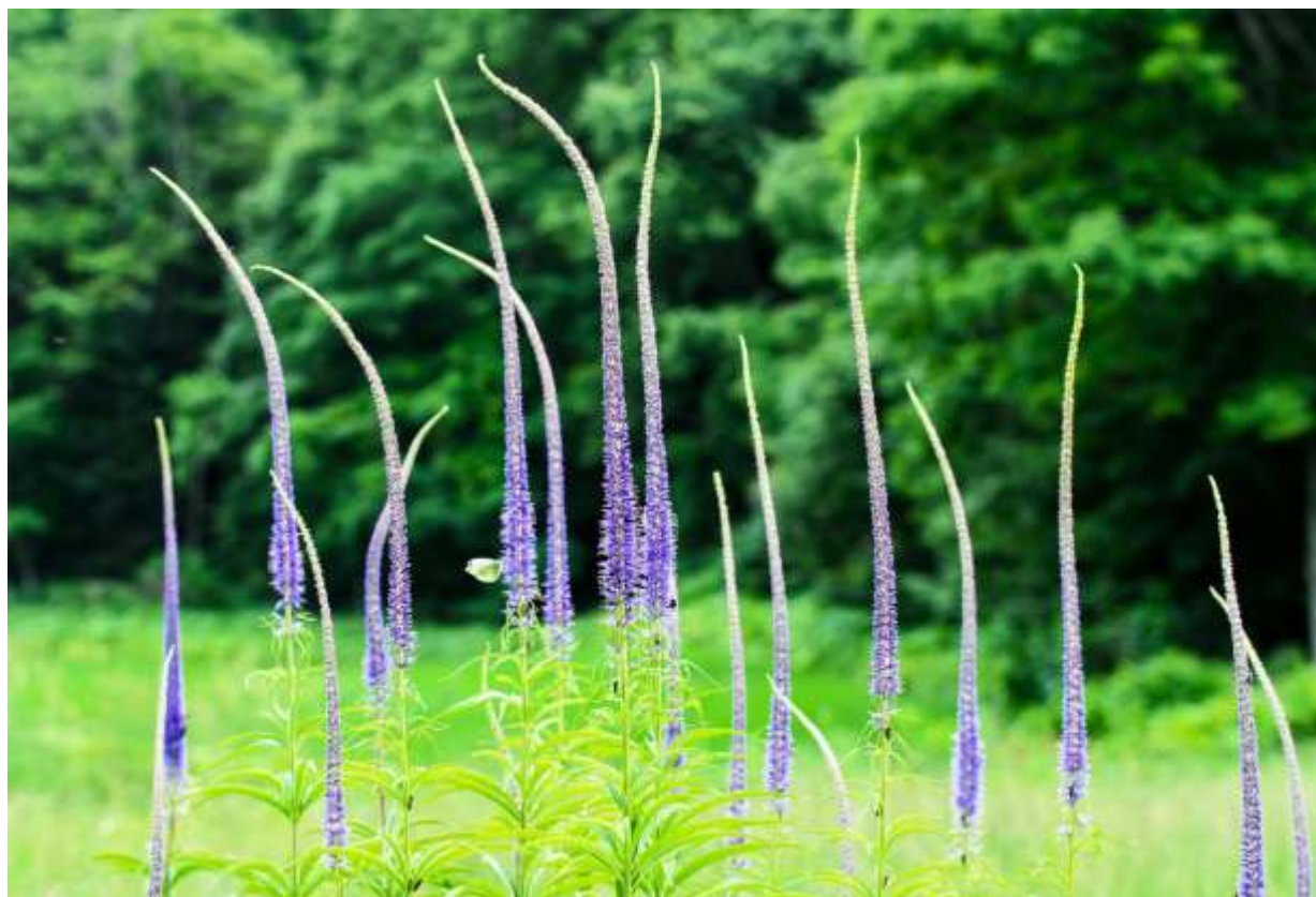
“Kugai-sou” Family: Plantaginaceae / オオバコ科 クガイソウ属

北海道と本州北部に分布する何とも豪快で美しい多年草。高さが最大2mに達するまで成長し、長さ20～40cmにもなる花穂を立ち上げて群生する様は、他に類を見ない花景色である。ちなみに、クガイソウという名前は、輪生する葉の繰り返しが9層あるということによる。平凡社図鑑では、本州のクガイソウと北海道のエゾクガイソウを分けずに表題名で統一したので、国内での分布範囲が広がった。しかし、この新分類には異論がありそうだ。エゾクガイソウの葉は7～8枚が多段輪生し、長さ10cmほどの披針形で縁に鋸歯がある。鮮やかな紫色の総状花序は長さ7～8mmの花の集合体で、突き出した雄しべで白く縁取られ、下から順に咲き上がる。本種は、上部葉腋から小型の花穂を放射状に分岐するものが多いが、やはり花穂はすっきり一本だけの方が好ましい。◇2012.07.21 足寄町