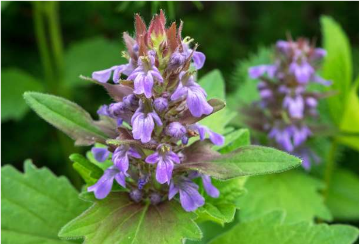
“Kaijin-dou” Family: Lamiaceae / シソ科 キランソウ属

中部地方以北と九州に隔離分布する日本固有の多年草で、低山の明るい林内や草地に生え、草丈は30～40cm。茎は直立してあまり分岐せず、数対の葉が対生する。中・上部の葉は長さ4～8cmの卵形～広卵形で、大きく不規則な鋸歯がある。上部の葉と苞は、部分的に赤紫色を帯びることが多い。花は茎頂に5～8段輪生状につくが、花序の長さが草丈の1/10ほどしかないので、遠見にはやや地味な感じがする。しかし、近寄ってよく見れば、なかなか個性的な花で面白い。花冠は赤紫色の2唇形で長さは18mmほど。上唇は半円形で2浅裂し、下唇は3中裂して大きな中裂片の先は2浅裂する。うがった見方をすれば人形のようにも見える花だが、片足を前に踏み出しているのが面白い。カイジンドウとは不思議な和名だと思ったが、語源は「甲斐のリンドウ」だそうで納得である。◇2019.06.07 千歳市