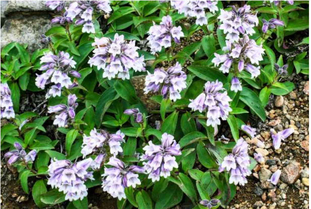
“Iwa-bukuro” Family: Plantaginaceae / オオバコ科 イワブクロ属

東北地方と北海道の火山に多い草丈5～20cmの多年草で、安定しない砂礫地に生えるパイオニアプラントの一つ。別名をタルマイソウというように、支笏湖近くの樽前山では本種の群落が卓越して発達する。国外では千島列島からアリューシャン列島にかけて分布する。茎には四稜があり、対生する葉は長さ4～7cmの肉厚の長楕円形だ。長さ2.5cmほどの筒状の花は、桐の花に似ていて全体に長い毛が生えており、桐の花よりは赤みの勝る色調だが白花もある。地質学的には樽前山と同じ火山ながら、大雪山に生えるものは色の濃い花が多いようだが、標高が1000mほど高いことの反映だろうか。イワブクロはゴマノハグサ科の一員とされてきたが、APG分類体系ではオオバコ科に変わり、北米大陸の Penstemon 属からも分かれて、I属1種の独立した属となった。◇2012.07.22 足寄町、雌阿寒岳