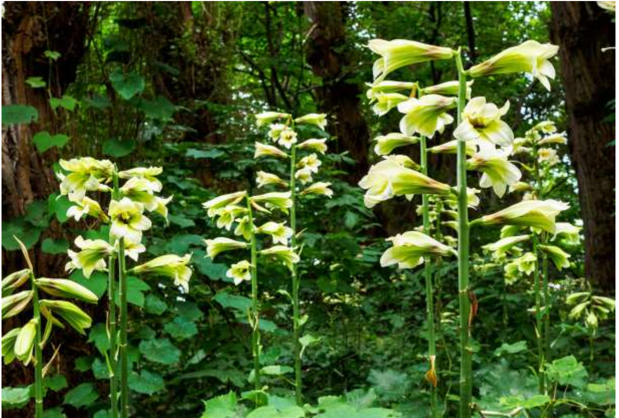
“Oo-uba-yuri” Family: Liliaceae / ユリ科 ウバユリ属

本州の中部地方以北と北海道から南千島とサハリンにかけて分布する大形の多年草で、主に薄暗い林内に林立し、高さは2m近くに達する。直立する太い茎の下部から中部にかけて葉柄のある厚い葉を輪生状につけ、葉身は長さ15~25cmの長楕円形。茎の上部に数個から20個ほどの大きな花を穂状につける。6枚の花被片からなる花は長さ10~15cmほどあり、外側は緑白色で根元近くにある暗紫色の模様が良いアクセントとなっている。オオウバユリは花も豪華だが開花前の擬宝珠状の蕾が面白い。また、花後に直立する果実の様子も面白いし、種子の飛び散った後も果実の殻をつけたまま立ち枯れて残るなど、殆どの季節を通して存在感を発揮している。道内ではあちこちで普通に見かける花なので、1年を通しての形態変化を楽しめる。◇2018.07.17 札幌市、新琴似