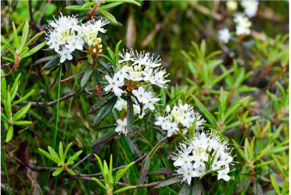
“Iso-tsutsuji” Family: Ericaceae / ツツジ科 ツツジ属

東北地方から北海道・千島列島を経てサハリンまで分布する常緑の小低木で、亜高山帯や高山帯に生えて樹高は1m近くにまでなる。革質の葉は長さ3~5cmの長楕円形で縁を巻き込むが、開花時には新しく芽吹いた若葉が目立つ。白い花冠が5裂した花が枝先に集まって直径7~8cmほどの球状になるが、突き出た雄しべが立体感を演出し、火山地帯では大きな群落を作ってなかなか美しい。少し前まで、葉裏に白毛の多いものをエゾイソツツジ、茶褐色の毛が多いものをカラフトイソツツジと呼んでいたが、平凡社図鑑ではこれらを統合して単にイソツツジとされてれる。高山に生えるツツジ科の多くがそうであるように、イソツツジも酸性土壌の火山地帯や酸性湿原を好み、道内では弟子屈町アトサヌプリの大群落が有名である。◇2013.07.04 蘭越町、ニセコ五色温泉