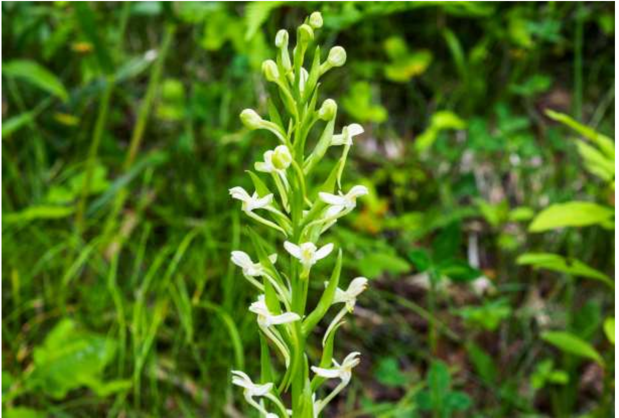
“Tsure-sagi-sou” Family: Orchidaceae / ラン科 ツレサギソウ属

北海道西南部から九州まで分布する多年草で、低山の日当たりの良い草地や林下に生え、草丈は40～60cm。国外では朝鮮半島や、中国からネパールにかけて分布する。葉は5～8枚が互生し、長さ10～16cmの長楕円形で、柄はなくて先が尖る。葉は上部のものほど小さく細くなる。茎の上部に10数個の白い花が穂状につき、苞は狭披針形で花より長い。花は径15mmほどで背萼片と側花弁は兜状になり、側萼片は鳥の翼のように展開して後方に反り返る。唇弁は長さ15mmほどで先端は少し外側に彎曲する。距は長さ30～40mmで、弧を描いて後方にのびる。この花は数あるツレサギソウ属の中でも、最も空飛ぶ鳥を連想させる優美な花だ。ただし、サギソウほどは鷺に似ていないし、他の鳥を連想するにも、唇弁を尾羽と見立てれば長い距が余計ものかも知れない。◇2017.06.24 北杜市