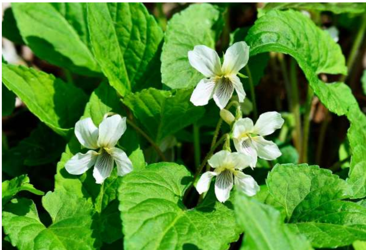
“Hikage-sumire” Family: Violaceae / スミレ科 スミレ属

模式標本が函館で採取されたので種名は蝦夷となっているが、実際には日本全土と朝鮮半島や中国にも分布する白花の莖で、道内での分布は道南・道央と道東の南部に限られる。名前の通りあまり日の当たらない林下に生えることが多い。草丈は5~12cmで、長さ3~7cmほどの卵形~長卵形の葉は柔らかく、基部は心形で葉脈は凹む。乳白色の花は径2cmほどと大きめで、唇弁に明瞭な紫色の筋が入り、側弁にも控えめな筋のあることが多い。側弁基部には毛があり、距は太めで7~8mmほど突き出す。葉の表面が焦げ茶色を帯びた株も散見されるが、関東の高尾山にはこの特長が顕著なものが多く、品種タカオスミレとして区分される。撮影地の函館山はスミレ類の多いところだが、白い花が群れて咲くのでヒカゲスミレの群落はよく目立つ。◇2012.05.14 函館市、函館山