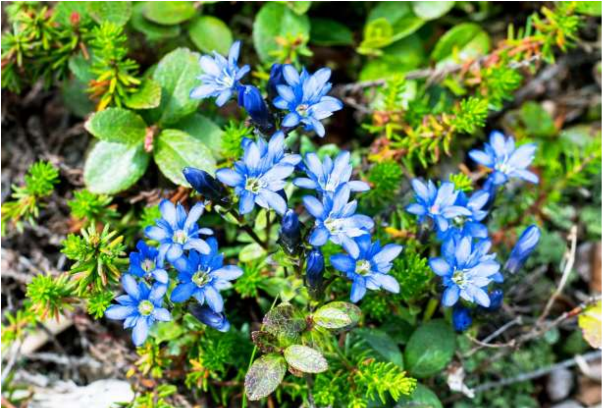
“Miyama-rindou” Family: Gentianaceae / リンドウ科 リンドウ属

北海道と本州の中部地方以北に分布する日本固有の多年草で、高山の湿った草地に生え、生息環境によって草丈は3～15cmとばらつく。長さ5～12mmの葉は長楕円形で、対生して厚くて光沢がある。花は茎の上部に1～数個つき、青紫色の花冠は長さ1.5～2.2cmで先が5裂し、裂片の基部には白い斑点がある。また、裂片の間に三角形の副片がある。日が当たると裂片と副片は共に平開して鮮やかだが、曇りや雨の時には閉じて目立たなくなる。裂片と副片の色と形態には変異が大きく、先が丸いもの、少し尖ったもの、色の薄いものと千差万別だ。これは、国内の高山性のリンドウ属では最も普通の花だが、群れて咲いているのを見ると、いつもすがすがしい気分になる。この花の上でコヒオドシが羽を広げている光景などは、最高の撮影モデルであろう。◇2015.07.30 大雪山姿見平