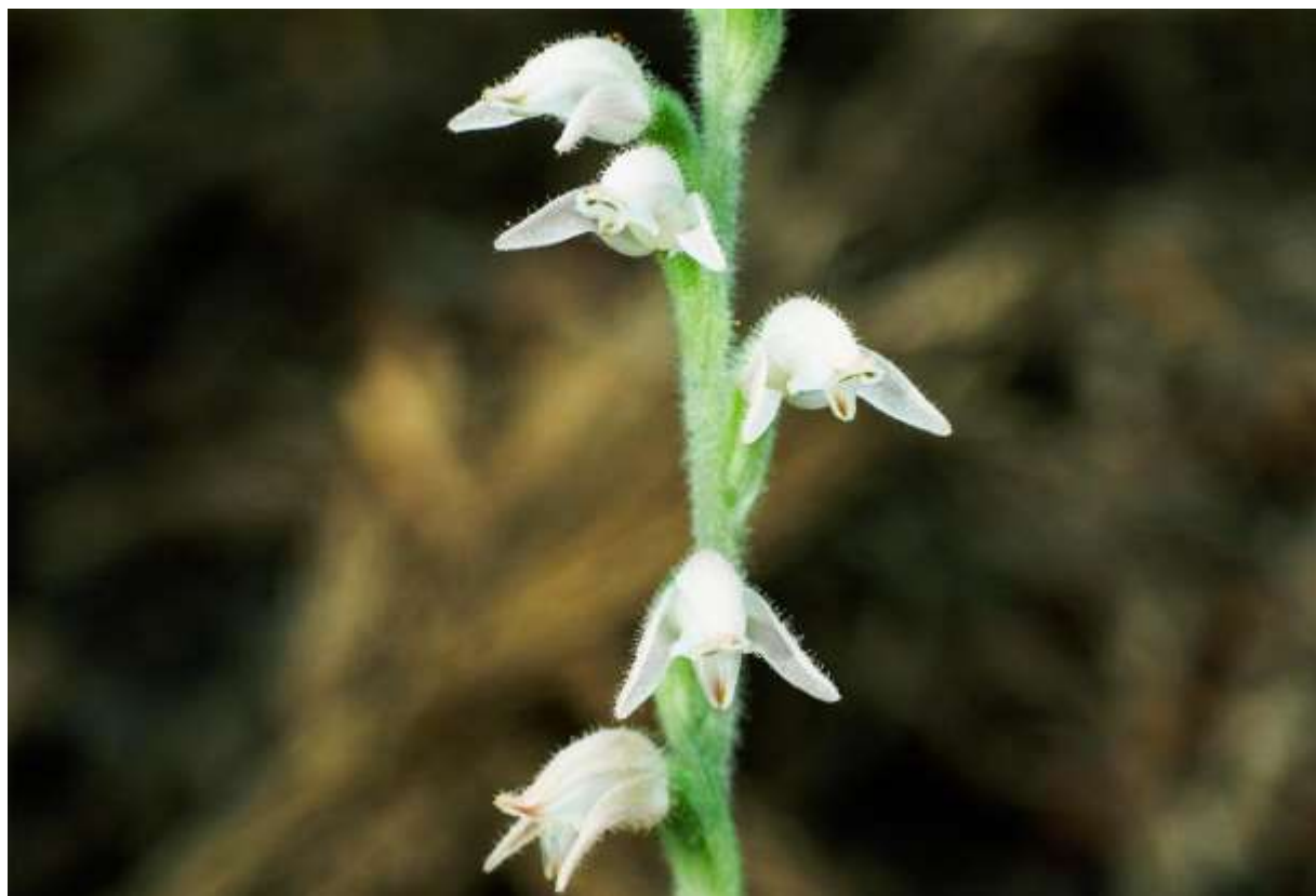
“Miyama-uzura” Family: Orchidaceae / ラン科 シュスラン属

日本全国に分布し、低地～山地帯の林内に生える常緑の多年草で、草丈は10～25cm。国外では、東アジアからヒマラヤにかけて広く分布する。和名に深山とあるが、低地の人里近くにも普通に生える。葉は茎の下部に纏まって互生し、長さ2～4cmの先の尖った広卵形～長卵形で、濃緑色の地に白い網目状の斑がある。夏の終わり頃に花茎を伸ばし、5～12個の淡紅色の花を一方に偏り気味につける。花柄や花には細かい毛が密生する。花は長さ6～12mmで、側萼片はへの字形をした長披針形で大きく開く。背萼片は舟形で長さ8mmほど、先端の内側に黄褐色の斑点が2個ある。唇弁は長さ7mmほどの卵形で、基部はくぼんで袋状になる。背萼片の斑紋が目で側萼片が翼のように見え、多くの人が小鳥を連想するであろう可愛い花である。◇2017.08.28 奥尻島