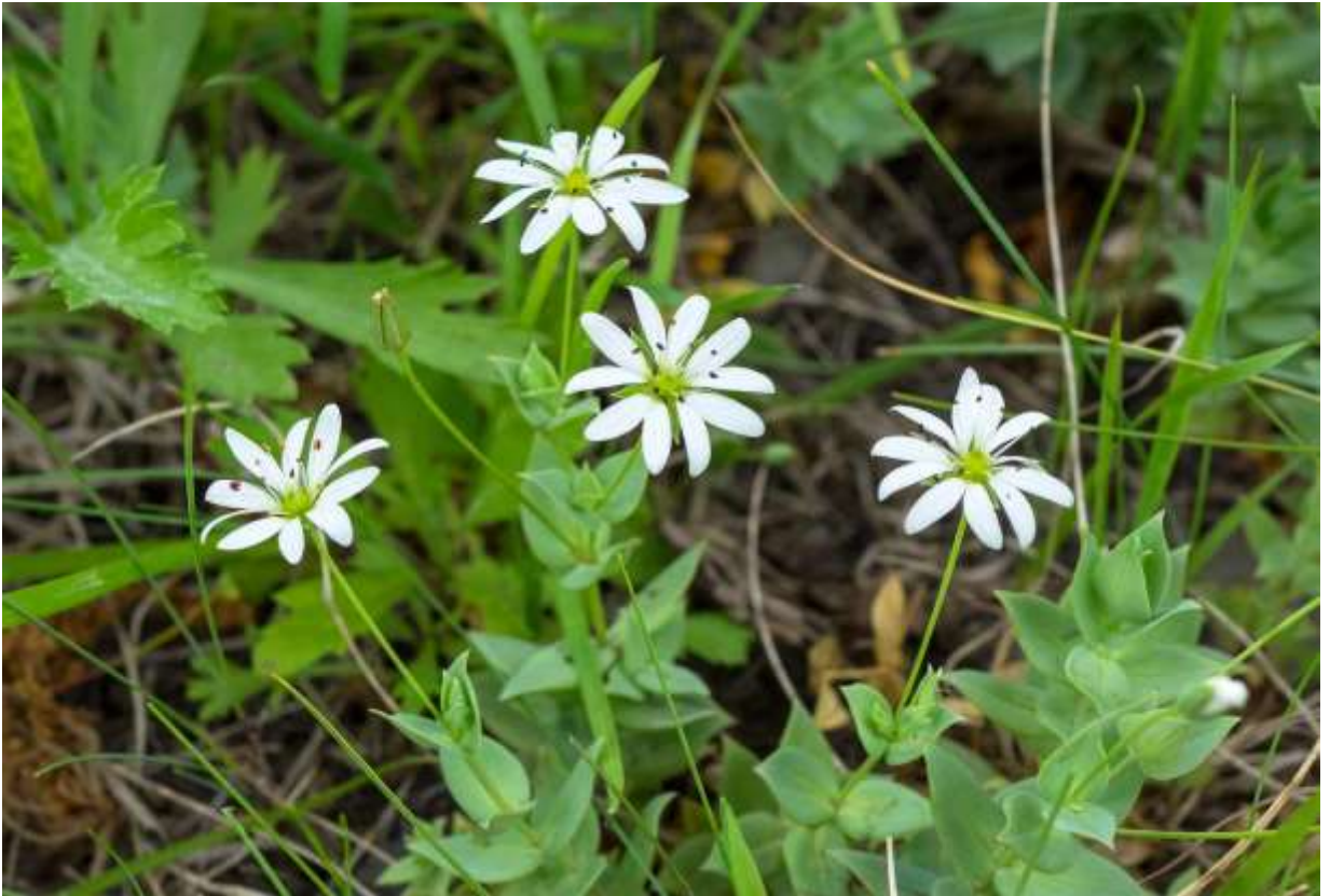
“Shikotan-hakobe” Family: Caryophyllaceae / ナデシコ科 ハコベ属

中部地方以北の比較的限られた山域に分布する草丈3~15cmの多年草で、国外では東北アジアからアラスカまで広く分布する。これは、本州では亜高山帯~高山帯の岩礫地に生える魅力的な高山植物であるが、北海道では、高山帯はもとより知床半島の海岸にも自生する。シコタンハコベは全体に無毛で灰白色を帯び、茎は根元で分岐して株立ちとなる。やや肉厚の葉は対生し、長さ1~3cmの狭卵形で先が鋭く尖る。茎頂や葉脇から長い花柄が伸び、径1.5~2cmの白い花が上向きにつく。花弁は5枚で萼片より長く、長さは7~10mmほどだが、深く2裂して10枚の花弁があるように見える。雄しべは10本ある。開花直後の葯は赤く、白い花弁との組み合わせがチャーミングなのだが、時間をおかずして黒くなり、すぐに落ちてしまうのが残念だ。◇2019.07.03 知床半島、斜里町