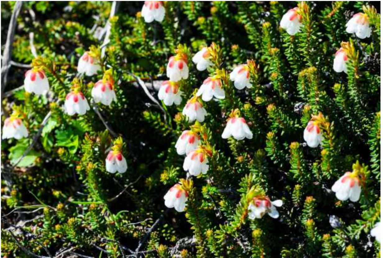
“Ji-mukade” Family: Ericaceae / ツツジ科 ジムカデ属

本州中部から北米大陸北西部までの寒冷地に広く分布する常緑の高山性小低木で、枝の高さは3～5cm、花の長さは4～5mmと小さい。ツツジ科には鐘状の可愛い花を下向きに着けるものが多いが、本種の花は純白の花冠の形と赤い萼のバランスが絶妙で、この仲間では一番の器量よしといえよう。それにしても、この美しい花にジムカデという和名はいただけない。直線状の枝に密生する葉の様子がムカデを連想させるというのだろうが、全くふさわしくない名前をつけたものだ。英名の方はアラスカ・ベル・ヒースで、極めてまっとうな名前である。この種は大雪山では結構大きな群落を形成しているが、最近訪れたカナダのバンフ国立公園では、近縁別種の見渡す限りの大規模な純コロニーに出会い、さすがに大陸は違うと感心させられた。◇2011.08.09 大雪山系赤岳