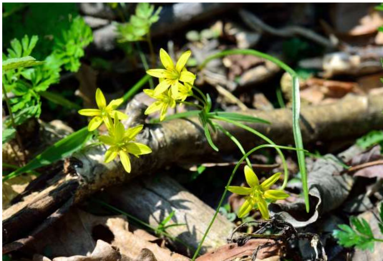
“Ezo-hime-amana” Family: Liliaceae / ユリ科 キバナノアマナ属

道東と道北の山地に自生する草丈15cmほどの軟弱な多年草で、他の草に寄りかかっていることが多い。ロシアや中国にもあるようだが、正確な分布範囲は不明だ。地下の鱗茎から線形の葉1枚と1本の花茎をのぼすが、葉は幅2~3mmしかなく花被片の幅も狭いので、混生していることが多いというキバナノアマナ（前ページ）との見分けは容易である。根生葉は長さ8~20mmで表面が凹み、花茎上部には苞葉が2個つく。花は花茎の先に1~3個つき、径1.5cmほどと小さいが、花色が目立つ黄色なので容易に見つかる。国内では北海道にしか自生せず、絶滅危惧II類に指定されていることもあって注意していた植物だが、礼文島以外では見たことがなかった。しかし、撮影地ではキバナノアマナは見当たらず、本種のみが広範囲の道路脇斜面で多数咲いていて驚いた。◇2012.05.06 浦幌町