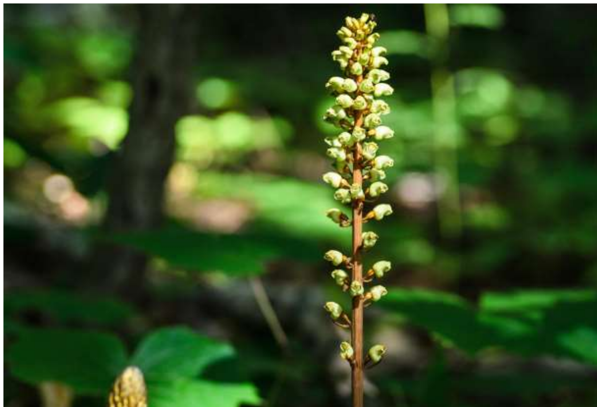
“Oni-no-yagara” Family: Orchidaceae / ラン科 オニノヤガラ属

日本全国の低山帯～亜高山帯の林下や湿原に生える多年草で、草丈は50～100cm。葉緑体のない菌従属栄養性のランで、ナラタケ菌に寄生する。国外では、極東ロシア～中国～ヒマラヤまで広く分布する。地下には長さ10cmほどの塊茎があり、中国では漢方薬材料として栽培される。直立する茎は黄褐色で、鱗片状の葉がまばらにつき、その上部に20～50個の花が総状について下から順に咲き上がる。花は萼片が癒着した壺形で長さ1cm、唇弁は花筒より少し突き出して下方に曲がる。花色は黄褐色が普通だが、緑色の花をつける品種もある。矢柄（ヤガラ）は矢の軸のことで、この植物を地面に刺さった矢に例えての命名だが、薄暗い林内に何本も直立した姿は少し異様で、「鬼の」という連想も納得できる。しかし、花は可愛くて愛嬌がある。◇2012.07.10 札幌市、西岡水源地