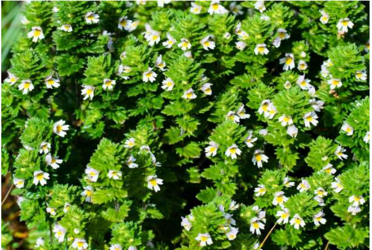
“Ezo-kogome-gusa” Family: Orobanchaceae / ハマウツボ科 コゴメグサ属

これは日本固有種タチコゴメグサの変種で、東北地方北部と北海道に分布する1年草である。海岸から亜高山帯までの広い範囲に生え、草丈は5~25 cm。日本にはこの仲間が結構多く、合わせて9種（固有は7種）、地域固有の変種も数えると20種類以上もある。しかし、花の小さい種類が多く、高山で出会うもの以外はあまり存在感がない。私自身も、最近までコゴメグサの仲間は高山植物だと思っていた。この変種の葉は茎の全体に対生して密に付き、鋸歯状の切れ込みが目立つ。長さ6 mmほどしかない花は上下2唇に分かれ、上唇は2裂し、下唇は3裂して裂片の先がさらに2浅裂するという、この仲間に通じる特徴的な造りだ。また、花冠の内側には黄色い斑と紫色の筋があり、小さいながらも味のある花である。撮影地では大きな群落を形成していた。◇2012.08.09 えりも町、襟裳岬