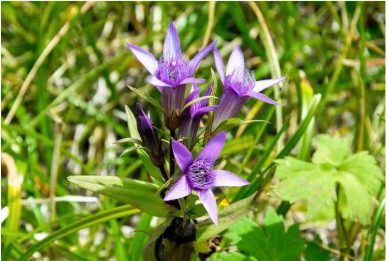
“Yuupari-rinndou” Family: Gentianaceae / リンドウ科 チシマリンドウ属

これは北海道の限られた高山だけに生える草丈5~30cmの日本固有種で、絶滅危惧IB類に指定されている。国内にはチシマリンドウ属が2種1亜種あり、赤紫色の花色と花冠内部をふさぐ内片が特徴だが、道内にはその全てが揃って分布している。この亜種は夕張岳の蛇紋岩地帯が特にお好みだが、日高山脈と大雪山系の一部にも分布するらしい。個体の様子は生息環境によって大きく変化し、高層湿原の個体（上の写真）は大きく育って長さ3cmになる花の数も多いが、吹きさらしの砂礫地に生える個体では葉が小さくて目立たず、写真よりより小型の花が1個か2個、地面から直接生えているように見えて面白い。花の名山と騒がれすぎの夕張岳でも、この花が咲く頃には花が目当ての登山者はあまり見あたらない。◇2008.08.23 夕張市、夕張岳