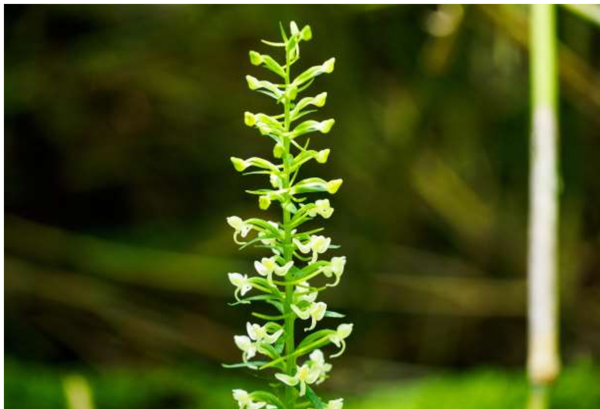
“Oo-yama-sagi-sou” Family: Orchidacea / ラン科 ツレサギソウ属

全国の低地～山地帯で樹林内に生える大形の多年草で、草丈は30～60cm。国外では千島列島、サハリンと台湾にも分布するらしい。茎の下部に長さ10～20cmの光沢のある大きな葉が2枚つく。この葉は鈍頭の狭楕円形でよく目立ち、その上には細長い鱗片葉が2～7枚互生する。盛夏の頃、白色～淡緑色の花を多数穂状につけ、下から順次開花して行く。苞は花より少し長い。側萼片は白色の鎌状で、上向きに彎曲して横に広がる。帯緑白色の唇弁は長さ5～7mmの広線形で下方に延び、先端部が後方に反り返る。距は長さ15～20mmあって細長く後方に延びる。背萼片と側花弁は短くて前方に突き出す。これは小さい花だが、飛び立つ鳥のようにも見えて面白い。このランは下草の少ない暗い林内にも生え、やや繊細な造りではあるが、良く目だって印象的である。◇2016.08.03 江別市