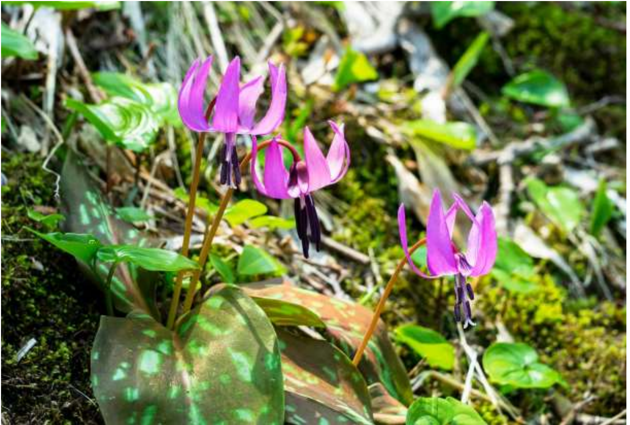
“Kata-kuri” Family: Liliaceae / ユリ科 カタクリ属

種名に日本を謳っているが、日本全土と北東アジアに分布する代表的な「春の妖精」の一つ。本州では限られた保護区に見物客が殺到するほどの人気がある。道東と道北を除く道内ではどこにでもある野草だが、旭川市の突硝山にある大群落はスケールが大きく、全山が鮮やかなピンクに染まって見応えがある。カタクリは発芽から10年近く経って、葉が2枚になったら花を咲かせる。鮮やかなピンク色の花被片は6枚で長さは4～6cmほど、基部にW字形の蜜標がある。艶のある大きな葉と、根元から一本だけ立ち上がった花茎の頂部に付くピンク色の花の組み合わせはいつ見ても美しく、万葉の時代からカタカゴと呼ばれて日本人に好まれたのも理解できる。花は夜になると閉じ、日がさすと開き始めて昼前には写真のように反転する。◇2013.05.09 室蘭市、地球岬