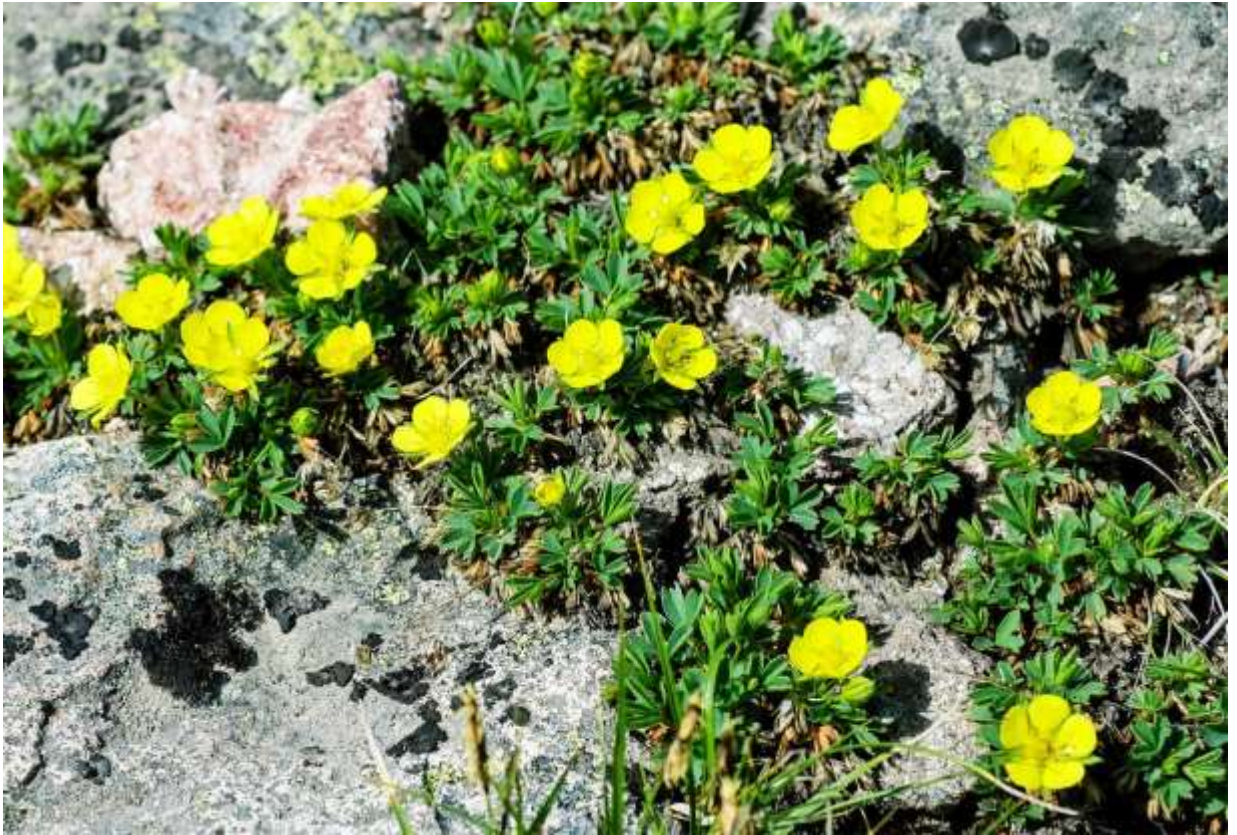
“Meakan-kinbai” Family: Rosaceae / バラ科 タテヤマキンバイ属

北海道と南千島に固有の高山性の多年草で、草丈は10cmほど。絶滅危惧IA類とされていたが、2007年に絶滅危惧II類に変更された。キンバイと名の付く植物は日本の山に数多いが、本種以外は皆キジムシロ属である。本種のようなレモンイエローの花はキジムシロ属にはなく、低地のオミナエシ(p.237)と似た色合いといえる。花は径1.5cmほどの5弁花で、花卉の間に明瞭な隙間があり、そこに配置される緑色の萼片との組み合わせが絶妙だ。この美しい花は、形の良い青緑色の葉とのコンビネーションも魅力的で、最近キジムシロ属から独立したのも十分納得できる。模式標本は雌阿寒岳で採取されたが、知床半島から羊蹄山まで、道内のあちこちの山に分布する。表大雪の稜線にも多く生えており、最も手軽に見られるのは黒岳の稜線であろう。◇2006.07.02 上川町、大雪山赤岳