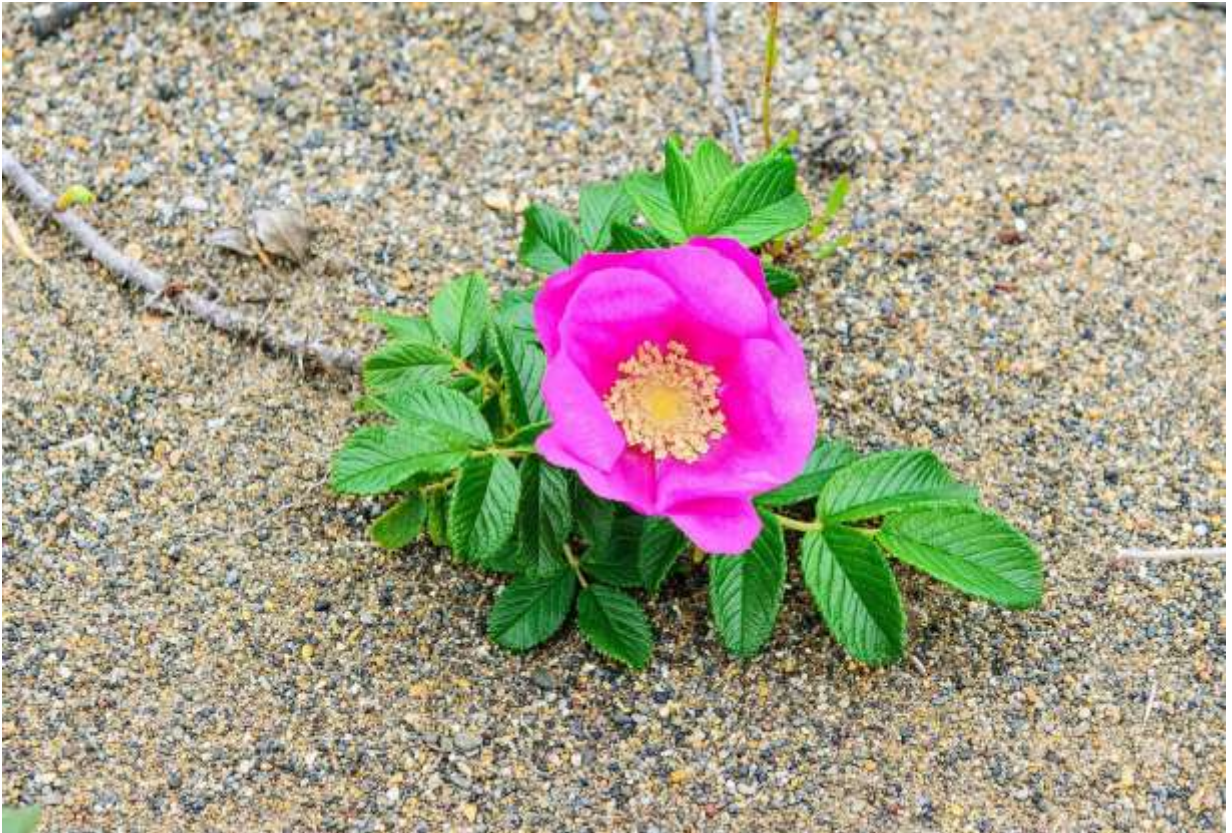
“Hama-nasu” Family: Rosaceae / バラ科 バラ属

朝鮮半島から極東ロシアまでの海岸に生える落葉低木で、高さは最大1.5mほどになる。国内での分布は茨城県以北の太平洋沿岸と島根県以北の日本海沿岸で、北海道では全ての海岸線で自生株を見ることができる。英語の俗名はJapanese Roseだそう。花は5弁花で径6~10cmと大きく、野生の花とは思えないほど美しいが、枝にある棘には要注意。道路脇や公園にも多く植えられており、こんもりと茂って花つきも見事だが、本当に雰囲気が良いのは、風の強い海岸に生える矮小な株や、地面に沿って長く伸びた枝先に少数の花が咲く様子だ。真っ赤に熟する実は大きくて食用になるが、果肉は薄くてジャムにするのには骨が折れる。最近では、薬用植物としての研究や利用が盛んになっているらしい。 ◇2011.07.01 浜頓別町、ベニヤ原生花園