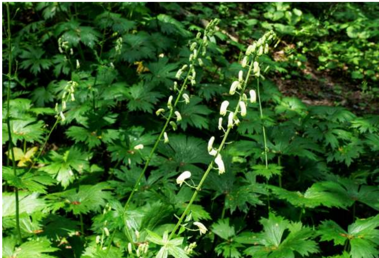
“Ezo-reijin-sou” Family: Ranunculaceae / キンポウゲ科 トリカブト属

道内の山地帯～高山帯の林縁や草地に生える草丈50～120cmの多年草で、北海道の固有種だ。同属のトリカブト類とは異なり花は黄白色で細長い、花の基本的な構造はトリカブト類と共通する。最大30cmにもなる腎円形の葉は7～9裂して裂片はさらに切れ込む。芽吹き後に形の良い大型の葉が密集する様子は存在感があり、山野草の初心者だった頃は、一体どんな花が咲くのだろうと期待したものだ。花は長さ2cmほどと大きくはないが、すらりと伸びた茎の中程から先端にかけて、沢山の花が円錐状に並ぶ様子はなかなかインパクトがある。道内にはこの他にも局地的に分布する近似の固有種が数種あり、花柄の毛の生え方や距の形などが異なるものの、一見しただけではエゾレイジンソウと見分けがつかないほど良く似ている。◇2018.06.07 札幌市、砥石山