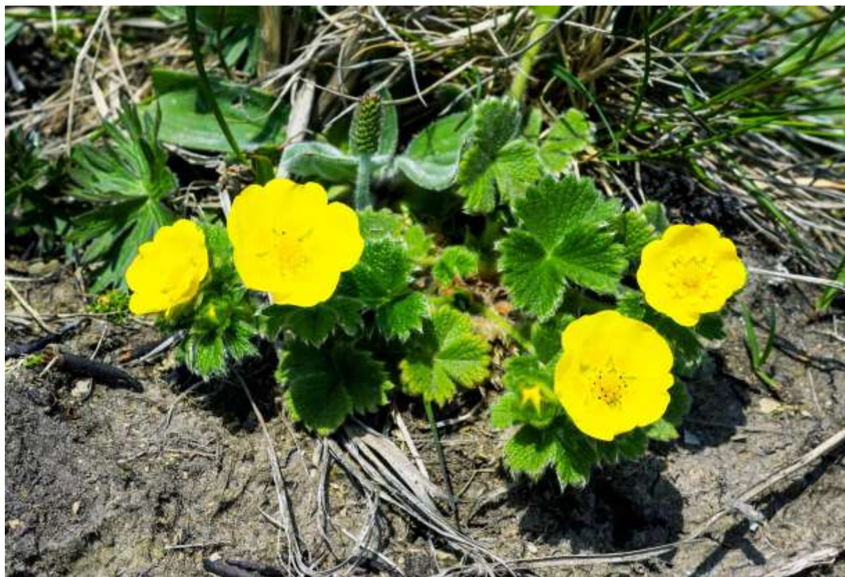
“Chishima-kinbai” Family: Rosaceae / バラ科 キジムシロ属

これは、日本では北海道にしか分布しない種で、花は径3～4cmとキジムシロ属としては特大サイズだ。全体に白い毛が密生して、葉は厚みがあり、国内に数多くの種がある本属の中で最も印象的な種であろう。和名が示すように、国外では千島列島からカムチャッカ半島にまで分布する。葉は3出複葉で、丸みのある小葉には浅い鋸歯があり、葉脈は明瞭でへこむ。花は茎先に3～7個つき、花弁、萼片、副萼片は5個ずつある。花弁の形は変異が大きいが、幅広のものでは基部に形の良い隙間ができる。さらに、花弁の基部は橙色で筋模様が発達し、黄色い雄しべとのコントラストが美しい。チシマキンバイは海岸の岩場に生えるが、低い草丈に大きな花の組み合わせは高山の花という雰囲気だ。生息地の意外性もあり、一目見たら忘れられないインパクトがある。◇2018.06.05 根室半島