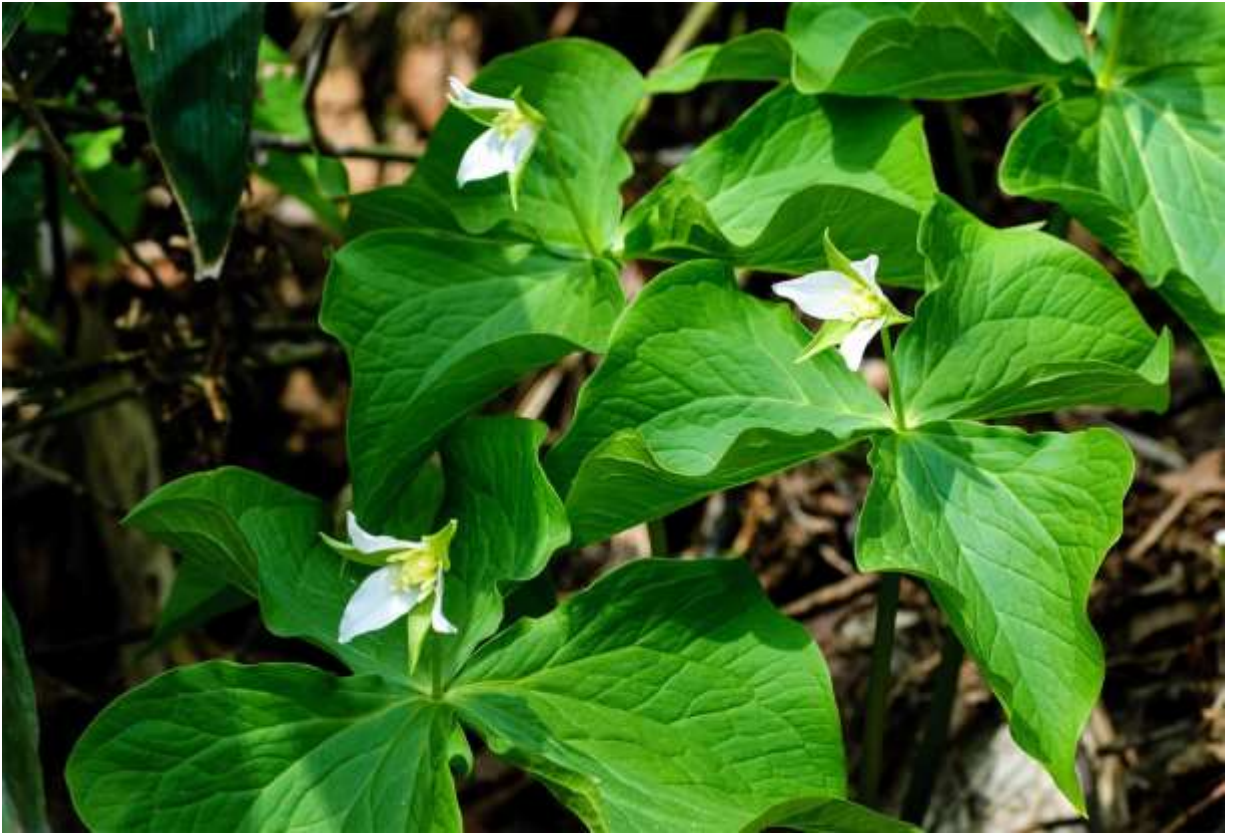
“Miyama-enrei-sou” Family: Melanthiaceae / シュロソウ科 エンレイソウ属

日本各地と東アジアに広く分布する草丈20～40cmの多年草で、茎の上部に大きな広卵形の葉が3枚輪生し、そこから長い花柄を伸ばして白い花を1個横向につける。道内では低地帯から山地帯の湿り気のある林内で普通に見られるが、大群落を作るオオバナノエンレイソウ（前頁）よりは少ないだろう。花が咲くまでに10年以上かかるため、小さい株も多いが、花の咲く株の葉は長さ幅共に10～17cmほどあり、葉脈が明瞭で先が尖る。緑色の萼と白い花弁は3枚ずつあり、長さは共に3cmほど。開花してから時間が経つと花弁が赤みがかかることも多いが、最初から赤紫色の花も時々見られる。大きな花がどかんと上向きに咲くオオバナノエンレイソウと比べるとおとなしい花だが、横向に慎ましく咲くミヤマエンレイソウの花の雰囲気も好ましい。◇2016.05.15 占冠村、赤岩青巖峽