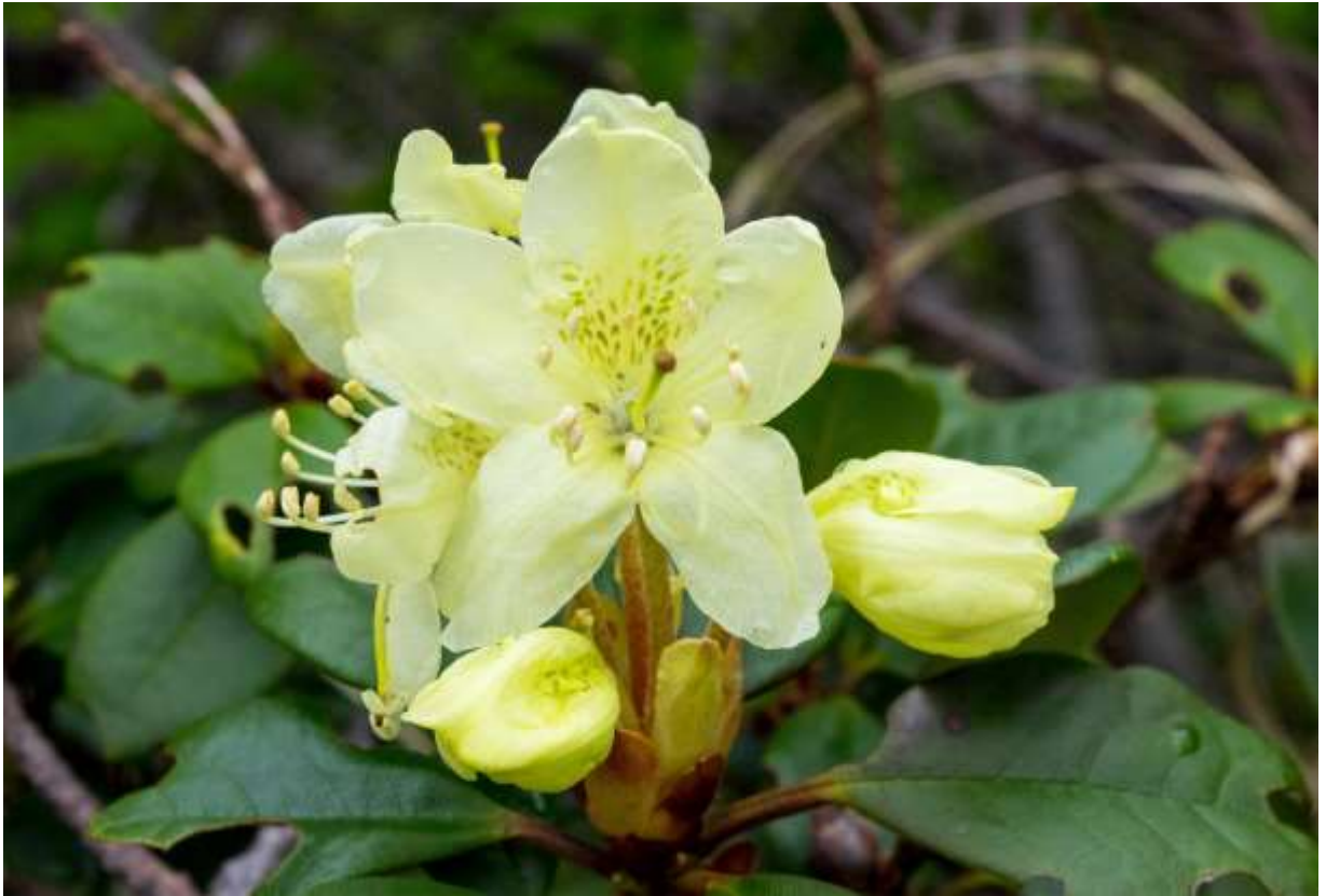
“Kibana-syakunage” Family: Ericaceae / ツツジ科 ツツジ属

東シベリアから日本まで、北西太平洋沿岸域の寒冷地に分布する常緑の小低木で、国内では北海道から中部地方までの高山に分布する。大雪山の稜線では10～20cmの高さだが、風の弱い山腹では1mになることもある。厚くて艶のある葉は長さ2～5cmの楕円形で、葉脈は凹んで表面のしわが目立つ。淡黄白色の花は径3～4cmの漏斗状で、花付きが特別良いわけではないが、まだ目立つ高山植物の花がない時期に、見渡す限りキバナシャクナゲが開花する風景は大雪山ならでの贈り物であろう。しかし、名前の通り黄花といえるのは蕾の間だけで、開花するとやや黄色みを帯びた白色になるのが普通なので、ここに示すほど黄色い花はまれである。花の終わりには赤みがさすことが多いが、開花直後から赤みの強い花も見られるし、蕾のうちから黄色みのない白花もある。◇2019.07.02 大雪山系赤岳