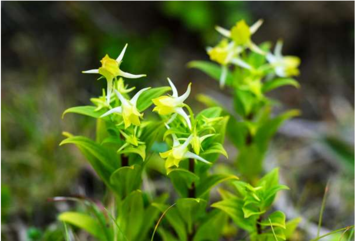
“Hana-ikari” Family: Gentianaceae / リンドウ科 ハナイカリ属

日本全土から東ヨーロッパまで広く分布する2年草で、草丈は環境によって10～60 cmと変化する。信州では夏から初秋に咲く高原の花として知られているが、道内では海岸草地にも多い。対生する葉の脇から細い花柄を出して花をつけるが、数ある野草の中でも、この花の形は特別変わっている。長さ1cmほどの花は深く4裂し、下部が長く伸びた距となって突き出すいかりに似た形となり、これが和名の由来となった。淡黄色の花冠と白い距の対比が美しい花だ。春に咲くメギ科の植物にもこれと似た形の花を咲かせるものがあり、そちらの方はイカリソウ属として多くの種がある。ハナイカリはエゾシカが食べないリンドウ科の植物なので、鹿の食害が目立つ勇払原野や襟裳岬でも、草丈の低い頑丈なハナイカリがあちこちで群生している。◇2012.08.09 えりも町、襟裳岬