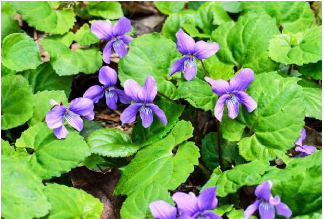
“Miyama-sumire” Family: Violaceae / スミレ科 スミレ属

これは北半球の高山や寒冷地に広く分布する多年草で、草丈は3～10cm。九州を除く日本全国の山地帯～亜高山帯の樹林下、林縁や草地に生えるが、北海道では海岸近くにも自生している。葉は長さ2～4cmの心形で、縁には波状の鋸歯が目立って先は尖る。花は径1.5～2cmの鮮やかな赤紫色で、5枚の花弁は少し外側に巻き込むことが多いようだ。唇弁の基部には白地に赤紫色の筋模様がある。唇弁の距は長さ6～8mmの円筒形で、後方へ真っ直ぐ突き出す。これは道内では普通に見られるスマイレで、草丈は低いが群生して地を覆い、色鮮やかな大きな花が固まって咲くのでよく目立つ。葉に白斑のある品種フイリミヤマスマイレとは花色と葉の質感が大分異なっており、開花期もフイリミヤマスマイレよりは少し遅めのように感じる。◇2012.05.30 石狩市、黄金山