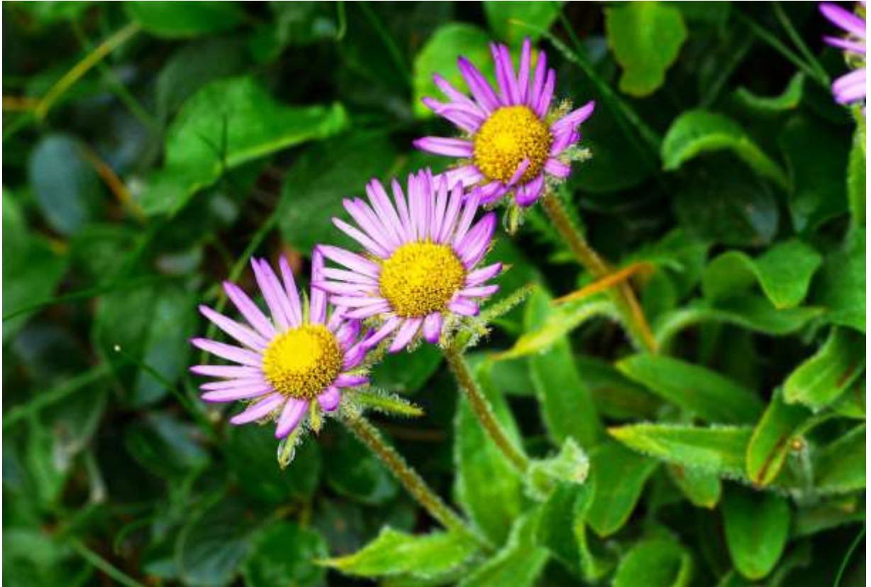
“Miyama-azuma-giku” Family: Asteraceae / キク科 アズマギク属

東アジア北部に広く分布する草丈10～35cmの多年草で、国内では北海道と本州の中部地方以北の高山に生える。ミヤマアズマギクは花色や葉に変異が多く、アポイ岳の超塩基性岩地帯には変種アポイアズマギクがあるし、道内の海岸地帯では基準亜種アズマギクに近いタイプも見られる。ミヤマアズマギクの茎や葉には毛があり、根生葉は長さ5～10cmのへら形で、茎葉は上方ほど小さい。茎の先に平開する頭花を1個つけ、花の大きさは径3cmほど。花の中心にある筒状花は濃い黄色で、周りを取り囲む舌状花は色の濃い赤紫色が基本である。この花は、日本に数多いキク科植物の中でも最も美しい花の一つだろう。キク科の植物としては全体がほどよい大きさで葉とのバランスも良く、高山の稜線で色鮮やかな株に出会えれば、登山の努力が報われる。◇2012.07.05 利尻山上部