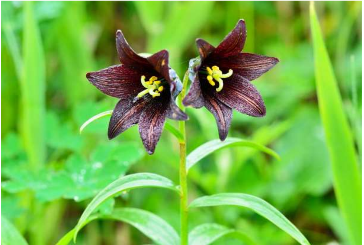
“Kuro-yuri” Family: Liliaceae / ユリ科 バイモ属

中部地方から北海道を経由して北米大陸北西部にまで分布する草丈15～50cmの多年草で、高山から沿岸低地までの草地に生える。ちなみに、平凡社図鑑では従来あったエゾクロユリやミヤマクロユリを変種として区別していない。クロユリの葉は長さ3～10cmほどの披針形で、コバイモの仲間と違って下部の葉は2～4段に輪生する。茎頂に暗紫褐色の花を1～数个斜め下向きにつけるが、花被片は長さ3cmほどの長楕円形で、表面には黄色の細かい斑点と筋模様がある。百合にしては珍しい色だとよく言われるが、これはユリ属ではなくバイモ属であり、海外のバイモ属には黒褐色を帯びたものが多い。肥沃な土地では花が沢山付き草丈も大きくなるが、湿原に自生する株では1花か2花が普通であり、いかにも野の花という風情が好ましい。◇2014.06.16 浜中町、霧多布湿原