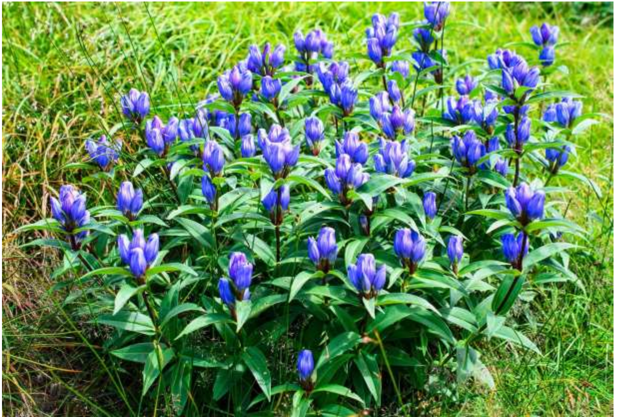
“Ezo-oyama-rinndou” Family: Gentianaceae / リンドウ科 リンドウ属

これは低地～山地帯に生えるエゾリンドウの高山型品種で、国内では山形県以北に分布する。草丈は20～40cmと低く、花が頂部にだけ少数付くのが特徴だ。国外での分布は分からないが、エゾリンドウが自生するアジアの高山にはあるだろう。ちなみに、これはオヤマリンドウ(B:p.249)とは別の種である。葉は長さ4～8cmとエゾリンドウより少し小さく、花も小さめである。しかし、8月後半の大雪山旭岳の中腹では、目に鮮やかな青紫色の花をつけたこの品種が至るところで群落を作り、見応えのある景観となる。日射のあるときしか花を開かないリンドウ科の中でも、この仲間は特に開花の度合いが小さく、日中でも花の頂部が少し開くだけだが、他に目立つ花のない晩夏の高山草原に大きな群落を作るので、花が閉じていても視覚的なインパクトは大きい。◇2012.08.30 大雪山系裾合平