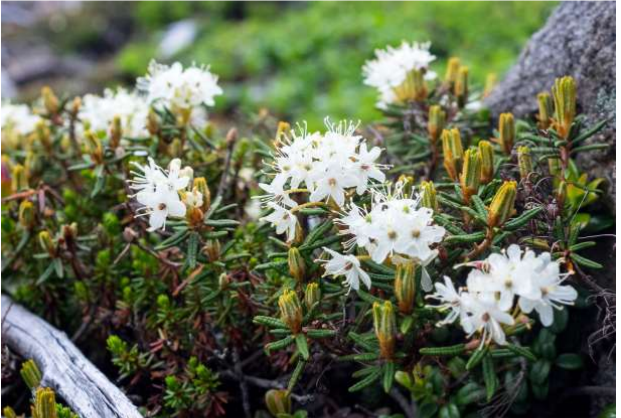
“Hime-iso-tsutsuji” Family: Ericaceae / ツツジ科 ツツジ属

アジアと北米大陸の北部寒冷地や高山に分布する常緑小低木で、地を這って広がり高さは20cmほど。国内での分布は道内に限られ、大雪山系の高山帯に生える。この仲間は分類に諸説あり、本種はイソツツジ（前頁）の亜種や別種の変種などとされてきたが、平凡社図鑑では独立した種となった。個人的には独立した種の方がスツキリする。イソツツジと同様に、若い枝には赤褐色の長毛が密生する。葉は長さ1~3cm、幅1~3mmの線形で、縁は裏側に曲がり込み、裏面には褐色の長毛が密生する。イソツツジよりは全体に小型だし、地表に低く広がって白い球状の花序が展開するので、いかにも高山植物という雰囲気があって好ましい。大雪山では、イソツツジより自生地は限られるし、花はイソツツジにそっくりなので、気をつけていないと見過ごしてしまう。◇2019.07.02 大雪山赤岳