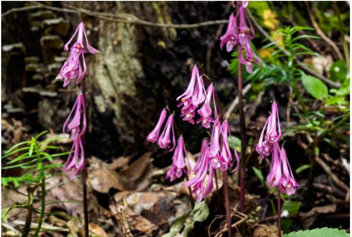
“Moiwa-ran” Family: Orchidaceae / ラン科 サイハイラン属

北海道と本州北部に分布するとされる日本固有の腐生植物で、低地～山地帯の広葉樹林に生え、草丈は20～40cm。ネット情報によれば分布範囲はもっと広く、四国にも分布するらしい。ふつう葉を持たず、菌寄生に強く依存するが、まれには葉のあるものもあるようだ。葉がないこと以外ではサイハイラン(次頁) とよく似ているが、花色が濃くてより、色鮮やかである。花茎は暗紫色で、その上部にやや一方に偏って10数個の花を総状につける。花はあまり開かず斜め下向きに咲くが、唇弁以外の花被片は鮮やかな赤紫色で、ほぼ同長の狭長披針形。唇弁はピンク色がかった白色で、先はサイハイランのようには裂けずに丸い。写真は和名の由来となった藻岩山で撮影したものだが、艶やかな花が群れ咲く様子は、感動ものであった。◇2019.06.18 札幌市、藻岩山