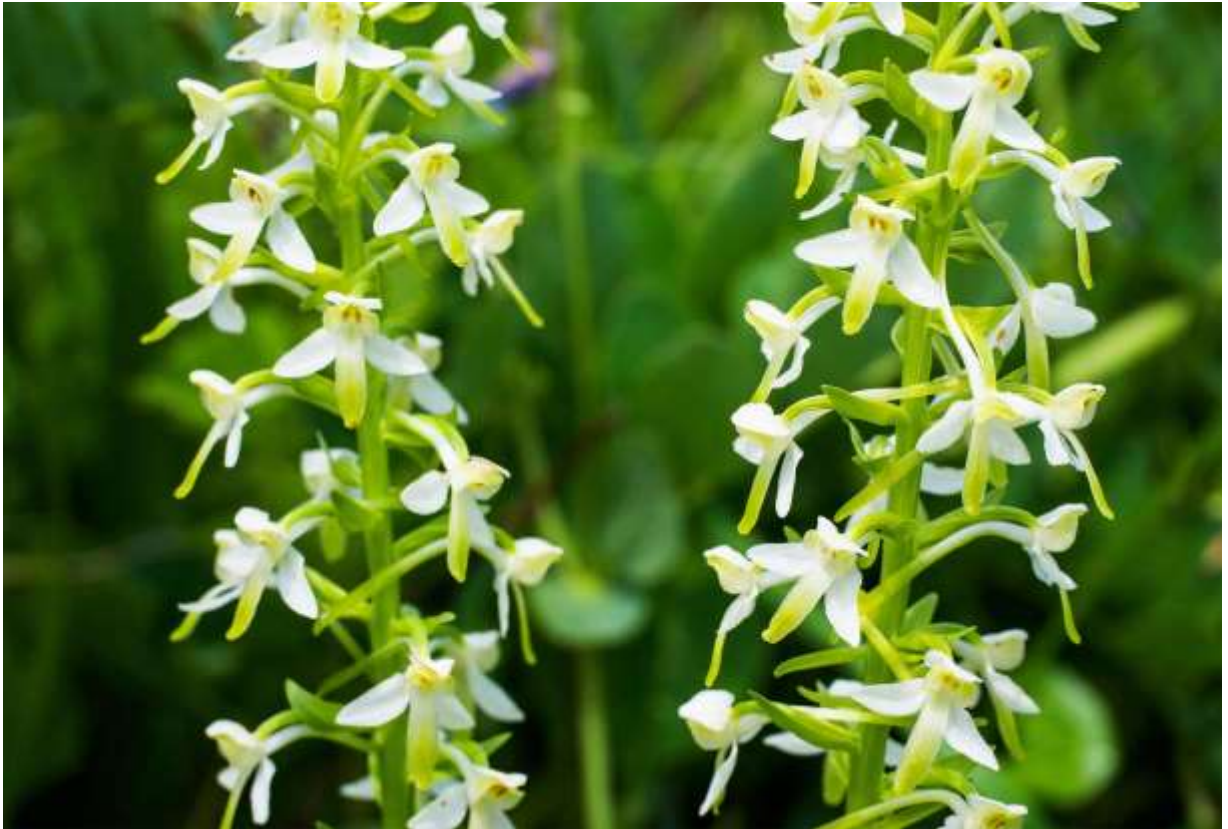
“Ezo-chidori” Family: Orchidaceae / ラン科 ツレサギソウ属

北海道、千島、極東ロシアの海岸草地から亜高山にかけて分布する比較的大型のランで、草丈は最大60cmほどになる。根元にツバメオモトに似た大型の葉を2枚向かい合わせに付け、フタバツレサギの別名がある。長楕円形の葉は長さ10~18cmで艶がある。茎の上部に多数付く緑がかった白色の花は径2cmほど。遠目にはあまり目立つ花ではないが、近寄ってみると白くて幅広の側萼片がクリオネの翼足のようなだし、長い舌状の唇弁と後ろに反り返った距の効果もあって躍動感のある面白い花だ。道内の山では時々見かけるものの数は多くないが、オホーツク海沿岸の海岸草地では乾いた砂地で普通に見られる。時には群生して、このあたりではとても数の多いハクサンチドリ(p.81)と勢力争いをしているように見えることすらある。◇2017.06.21 石狩市、聚富原生花園