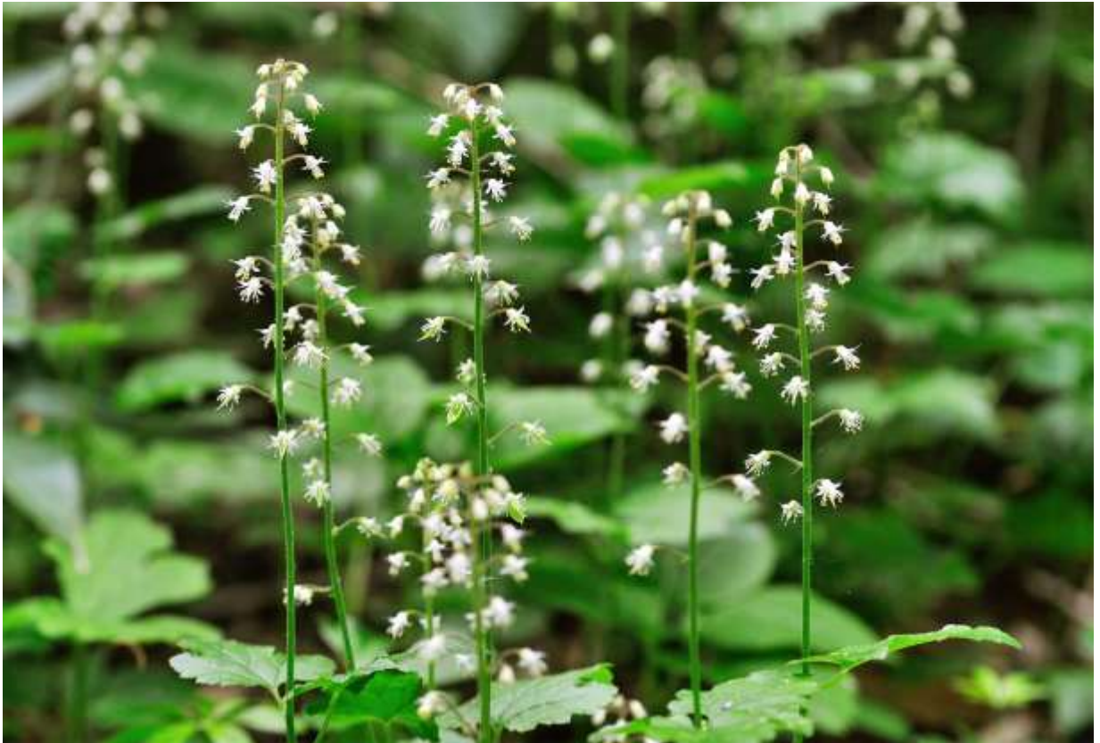
“Zuda-yakusyu” Family: Saxifragaceae / ユキノシタ科 ズダヤクシュ属

九州を除く日本各地から中国を経てヒマラヤにまで分布する草丈10～40cmの多年草で、山地帯～亜高山帯の林下に生える。5裂するモミジ形の葉は茎の中程まで互生し、花序は長くて径3mmの小さな花が数個～25個ややまばらにつく。白い花卉のように見えるのは5裂した萼片であり、本当の花弁は線状で萼片より長く広がる。雄しべは10本あり花の中心で真っ直ぐに突き出すが、この雄しべと線状の花弁との組み合わせが、ズダヤクシュの花をちょっと変わった面白い花と思わせる由縁である。ズダヤクシュという和名が、「ぜんそく薬の材料」という意味なのはいろんな文献で紹介されている。とにかく派手な花ではないが、全体の風情が何となく優雅で、溪流沿いに群がって咲いているような所では、絶好の被写体になる。◇2010.06.19 札幌市、定山溪天狗岳