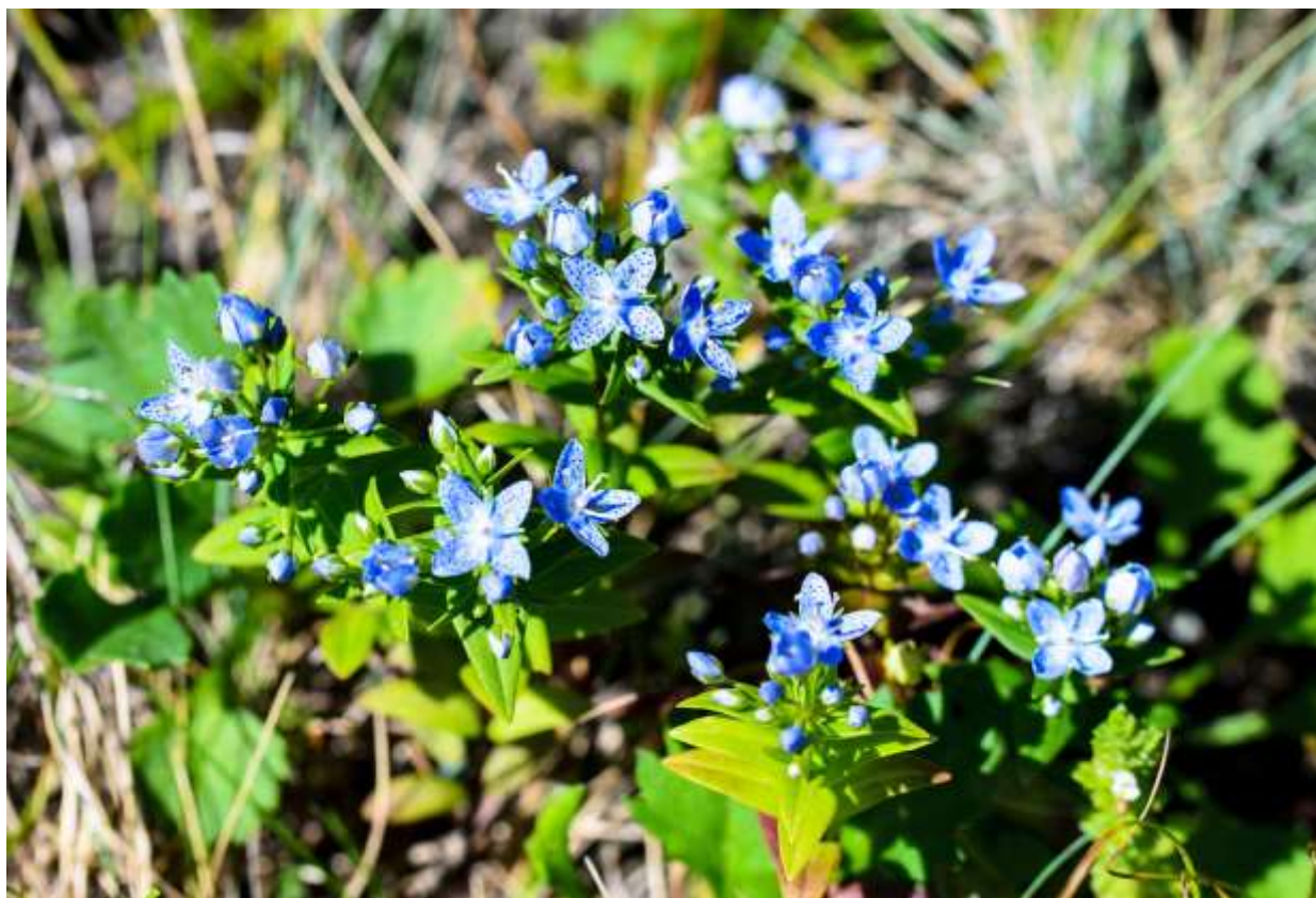
“Chishima-senburi” Family: Gentianaceae / リンドウ科 センブリ属

朝鮮半島から北東アジアにかけて分布する草丈10~30cmの多年草で、国内では中部地方以北に自生する。本州では高山に生えるが、道内では海岸から亜高山帯まで分布しており、襟裳岬周辺では特に数が多い。日本に分布するセンブリ属の中では開花期が早い方で、低地では8月に入ると咲き始める。センブリ属には花冠が4裂するものと5裂のものがあり、前者は后者より花が小さいのが普通だが、チシマセンブリは4弁状の花を持つ北方系の種だ。明るい青紫色の花は径1cmほどで、花弁状裂片の真ん中に狭三角形の密腺があり、その周りに黒点が散らばる様子が面白い。センブリ (B:p.253) の仲間なので苦さは折り紙付きらしく、エゾシカはこれを食べないので、シカの踏み跡が多いところほど、この青い花が目立つ秋景色となる。◇2012.09.07 襟裳岬