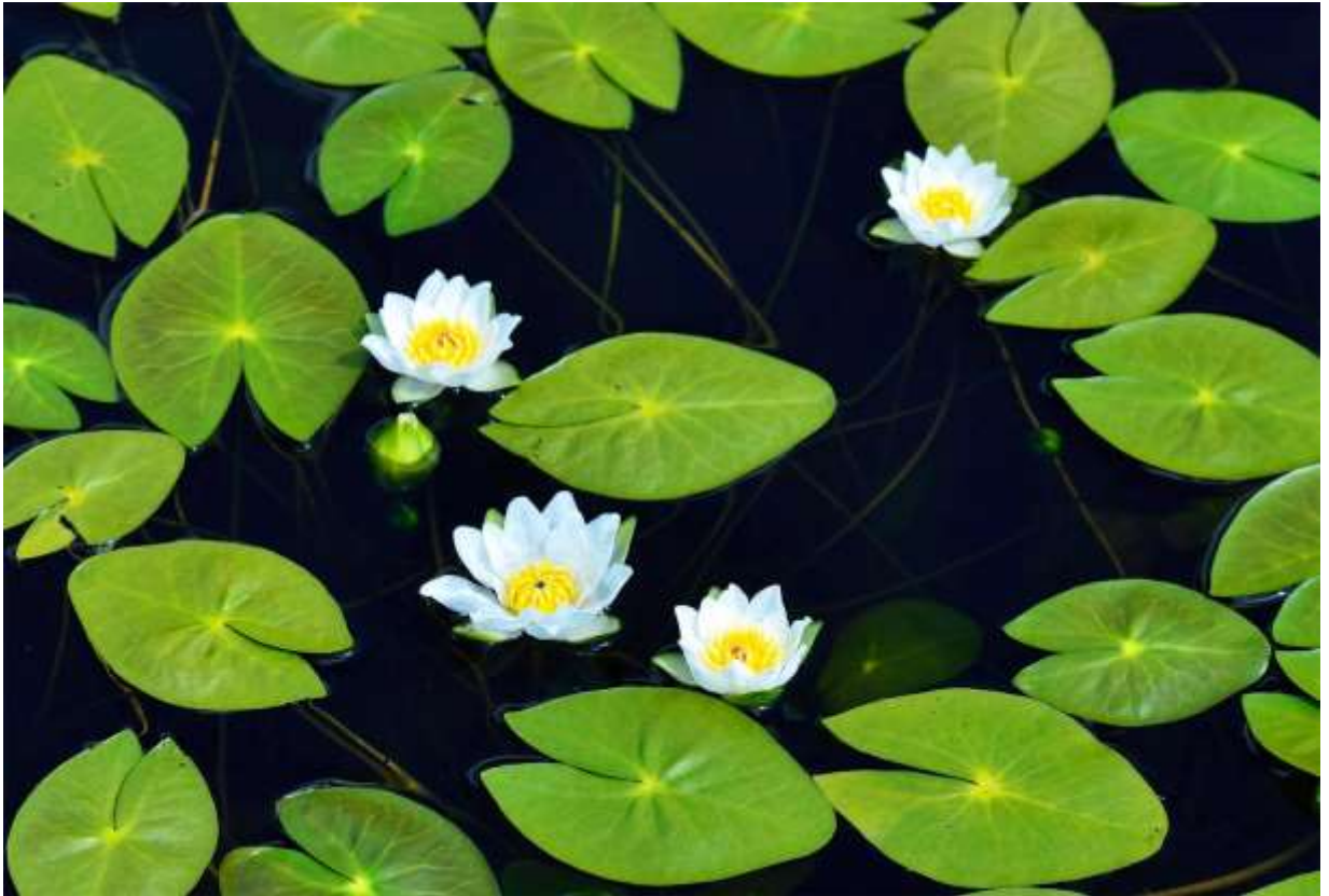
“Ezo-beni-hituji-gusa” Family: Nymphaeaceae / スイレン科 スイレン属

北海道の池や沼に生える日本固有の多年草で、北半球に広く分布するヒツジグサの変種とされる。光沢のある水上葉は水面に浮かび、V字型の切れ込みがアクセントになっていて、白い花とのコントラストが美しい。長く伸びた花茎の先に径5cmほどの花が1個つく。花には緑白色の大きながく片が4個あり、白色の花弁は8～15枚で、黄色い雄しべと紅紫色の柱頭盤のコンビネーションが実に美しい。ヒツジグサは夜には花を閉じ、昼前に開き始めて午後2時（未の刻）前には満開となるが、その性質はこの変種でも同じである。雨竜沼湿原では、同じように柱頭盤が赤くなるオゼコウホネ（B:p.154）やウリュウコウホネとの競演が見られるが、エゾベニヒツジグサの群落を間近に見るのなら、ここ浮島湿原の方が適しているだろう。◇2012.07.23 上川町、浮島湿原