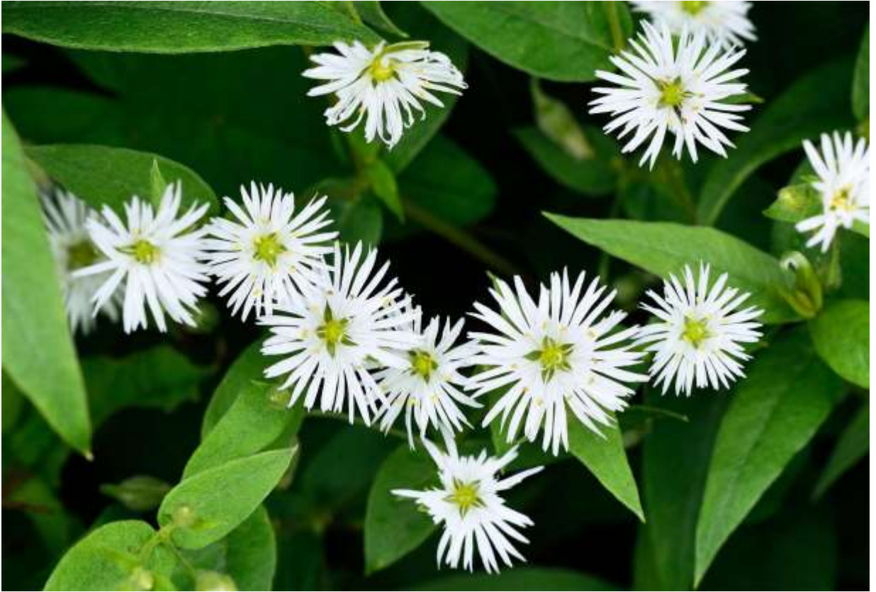
“Ezo-ooyama-hakobe” Family: Caryophyllaceae / ナデシコ科 ハコベ属

本州の一部と北海道の湿った草地や湿原に生える多年草で、国外では朝鮮半島から極東ロシアまで分布する。草丈は40～80cmほどになり、よく分岐して茂みを形成する。葉は無柄で対生し、長さ6～12cmの長卵形で先は尖る。花は大きな茂みの枝先にまばらに咲くので一見あまり目を引かないが、径2cmほどとハコベ属にしては大きめの花は、よく見ると繊細な造りで実に美しい。白色の花弁は5枚あり、先が不規則に細かく裂けて、一つの花弁で10片くらいになる。子房は緑色で白色の花柱が3本あり、10本の雄しべの先にある黄色い葯と白色の花弁の配置が絵になる。道内では渡島半島に多い別属オオバナノミミナグサの花は、最大径2.5cmでより大型だが、花弁の先が2中裂するだけなので、繊細な美という観点からは本種の方が上だろう。◇2013.07.25 浜頓別町、ベニヤ原生花園