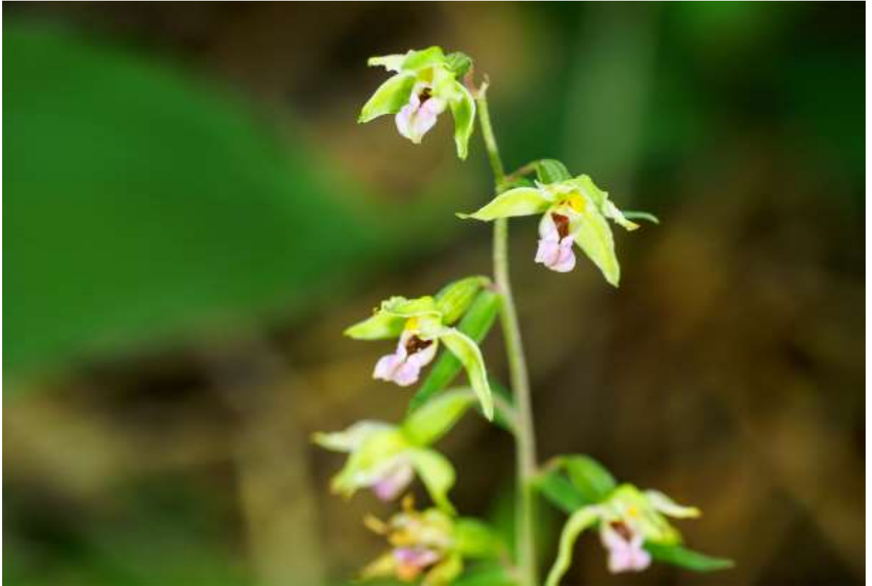
“Ezo-suzuran” Family: Orchidaceae / ラン科 カキラン属

日本全国の低地～亜高山帯の林内に生える多年草で、アオスズランとも呼ばれて草丈は30～60cmほど。国外ではユーラシア大陸北部とアフリカの北部に広く分布する。平凡社図鑑では、海岸林に生えるものを変種ハマカキランとして区別はしない。本種の茎は直立し、長さ7～12cmの茎葉数枚が互生する。茎上部に20～30個の花が総状につき、下から順に開花する。苞葉は下部では花より長めだが上部では短め。花は径1.5cmほどでややうつむき加減に咲く。萼片は緑色で長さ9～12mmの狭長卵形。側花弁も緑色で、萼片よりは少し幅広でより短い。唇弁は卵状披針形で淡紅色の混じった白色。後部は袋状になり、内部が暗褐色を呈する。草丈の割には小さい花をつけるので目立たないが、花をよく見るとカキラン属だけあって美しい。◇2017.07.27 江別市、野幌森林公園