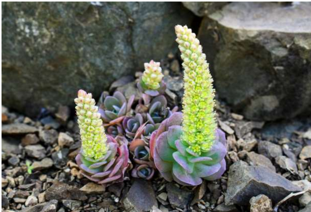
“Komochi-rence” Family: Crassulaceae / ベンケイソウ科 イワレンゲ属

北海道特産の多肉植物で海岸の岩場に生え、花茎の高さは最大10cmほど。ランナーを出し幼苗を作って増えるので、花を咲かせる親株の周辺に子株が集合して微笑ましい。開花した株は枯死する。葉は卵形～広卵形で粉白色を帯び、先が少し尖るものと尖らないものがある。小さい花が花茎の周りに密集して付き、棍棒状に立ち上がって面白い。花弁は5枚で白色だが、萼と花の中心部が緑色でなので全体が緑がかって見える。10本ある雄しべの先端は黄色から淡紅色でよく目立つ。日高地方の海岸では、コハマギク（前頁）と並んで季節のトリをつとめる花であり、両者は同じ岩場で競演していることも多い。花をつけていない時期でも砂漠の多肉植物然とした姿は魅力的で、いつ出会ってもレンズを向けてしまう。◇2011.11.05 えりも町