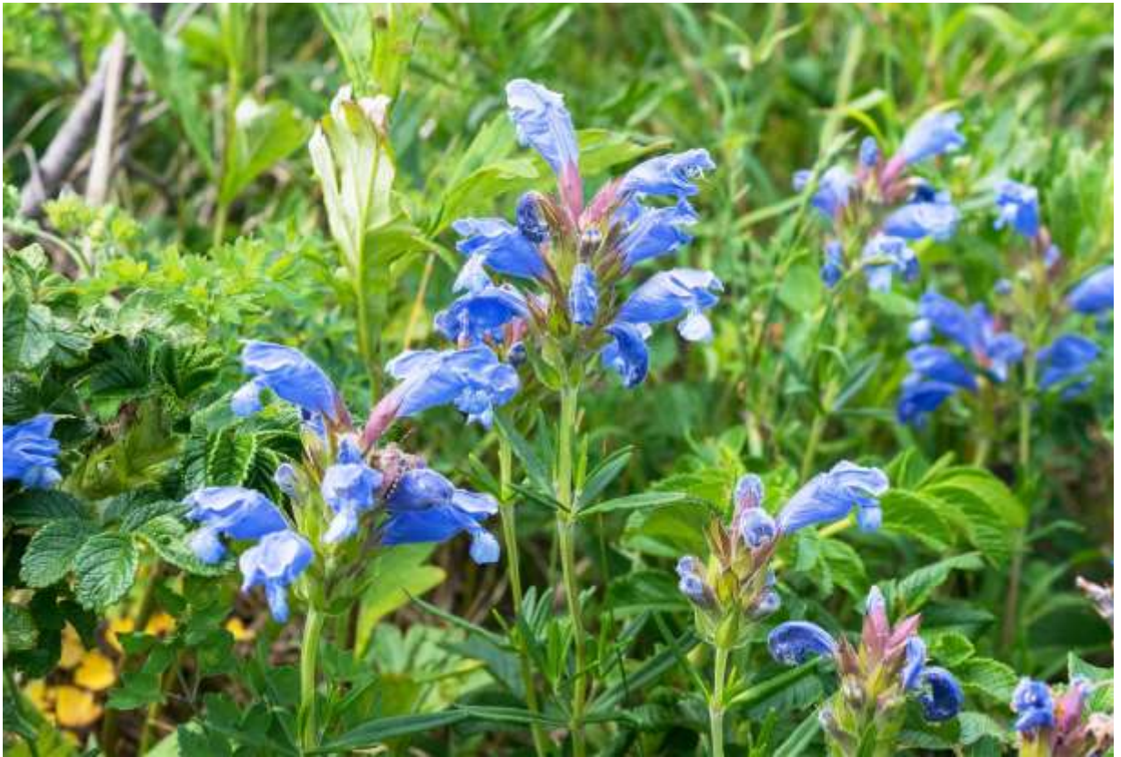
“Musya-rindou” Family: Lamiaceae / シソ科 ムシャリンドウ属

東北アジアに広く分布する草丈15～50cmの多年草で、国内では中部地方以北に自生し、道内では海岸の草地で見ることが多い。四角い茎には白い細毛があり、肉厚で広線形の葉が束状に生える。茎の先に短い花序があり、青紫色の唇状の花を密につける。花冠は長さ3～3.5cmと大きく、2唇形で上唇は先が下方に曲がって2浅裂し、下唇は3裂して中央の裂片がさらに2浅裂する。萼裂片は淡赤紫色で先が鋭く尖る。花冠にも白い細毛が密生して、花の形と色合いは桐の花に似ているが、先端部の構造が複雑で何となくすっきりしない花である。しかし、鮮やかな大きい花を密生させるので、草丈の低い海岸草地ではよく目立つ。あまり普遍的な植物ではないが、オホーツク海沿岸には群生する所があり、遊歩道脇でのオンパレードは華麗である。◇2019.07.01 北見市、ワッカ原生花園