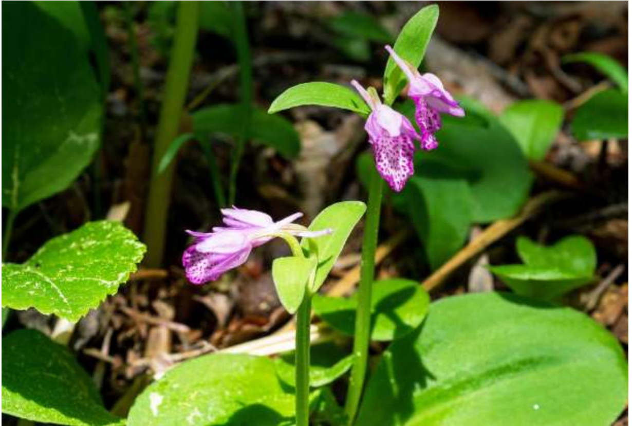
“Kamome-ran” Family: Orchidaceae / ラン科 カモメラン属

北海道、本州の東半分と四国に分布する草丈10～20cmの多年草で、低地帯～亜高山帯の湿った林床に生える。朝鮮半島と極東ロシアにもあるという。根元に長さ4～6cmの広楕円形の葉が1枚あり、葉の付け根から花茎を伸ばして、その先端にふつうは2個の花と苞葉をつける。花は淡紅色で長さは1.5cmほど、萼片3個と側花弁が上方に集まって兜状になる。唇弁は広楕円形で平開し、縁が波打って全面に濃紅紫色の斑点がある。カモメランの花はユニークな形態と色彩で、最近まで国内に近縁種はないとされてきたが、平凡社図鑑では、オノエラン(B:p.200)が新たにカモメラン属に分類され、世界に9種あるという。カナディアンロッキーで花の色が本種と似通った G. rotundifolia を見たが、紅紫色の斑点は少なく、花弁の形もこの花よりはダイナミックな造形で驚いた。◇2018.06.03 根室市