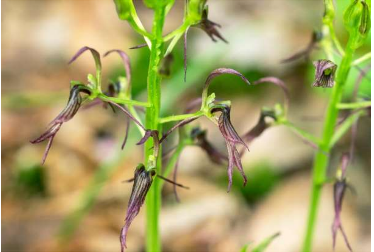
“Jigabachi-sou” Family: Orchidaceae / ラン科 クモキリソウ属

日本全土と朝鮮半島から極東ロシア南部にまで分布する草丈10～20cmの多年草で、山地の林下に生える。葉は2枚だけで対生し、先の尖った卵形で長さは4～8cmほど。葉の縁は細かく波打ち、葉脈の間に横脈が浮き出てあみだくじのように見えるのが面白い。直立した花茎の上部に10～20個の花が付き、花の大きさは2cmほどだが、細長いがく片ばかりが目立つボリューム感の乏しい花だ。側花弁は糸状で大きく水平に開く。幅の狭い唇弁は基部で折れ曲がって下を向き、表面には7本の濃い筋がある。側がく片は寄り添って唇弁の下から突き出す。花色は写真の様な紫褐色が普通だが、緑色の品種もある。スズムシソウ(p.150)ほどではないが、この花も昆虫のジガバチとある程度似かよった外観だ。しかし、肉食性のジガバチがこの花に飛来する確率はどのくらいだろう。◇2018.06.19 苫小牧市