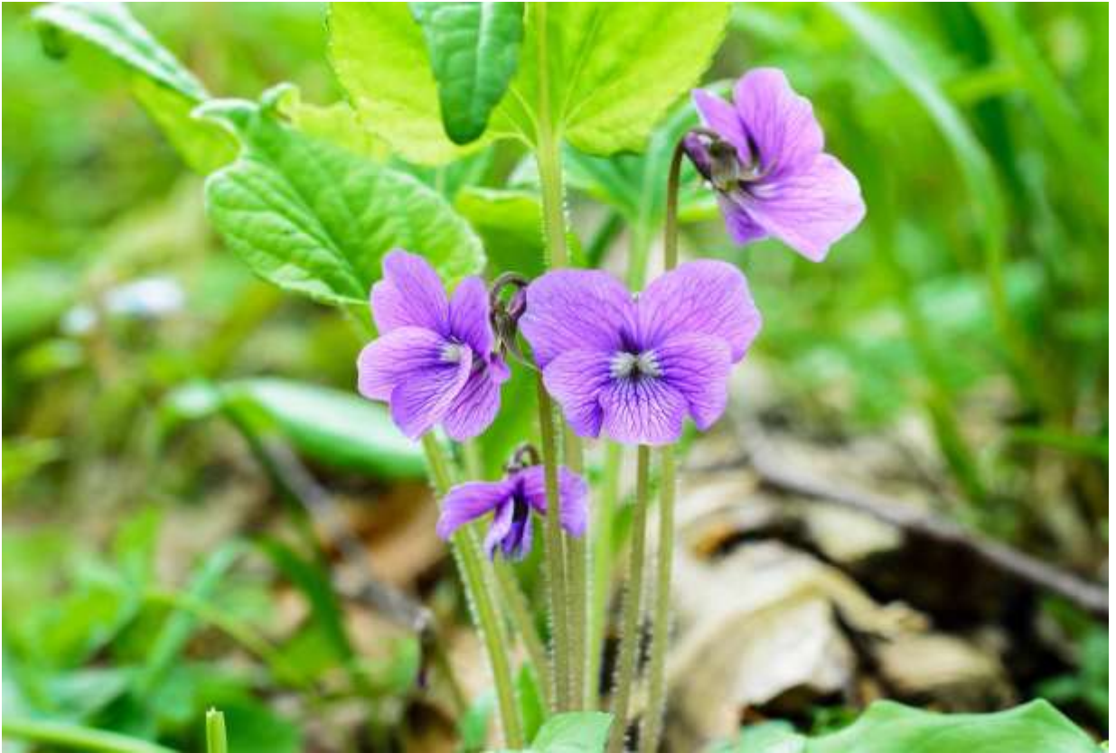
“Sakura-sumire” Family: Violaceae / スミレ科 スミレ属

日本全国の低地～低山帯で、明るい林下や林縁に生える草丈8～15cmの多年草。道内では太平洋側に多く、国外では朝鮮半島から中国東北部にも分布する。花の大きさが2.5cmほどと国内のスミレとしては最大級で、「スミレの女王」とも呼ばれる。根生葉は長卵形で先が尖り、長い葉柄があって立ち上がるので、花は葉の陰に隠れるように咲くことが多い。和名は花卉の先が桜の花のようにへこむからの命名で、写真の花はその特徴を示すが、へこまない花も多い。撮影地の花は落ち着いた紅紫色だが、場所によってはもっと鮮やかな色調のものもある。側花卉の基部には白い毛が密集し、花の中心部が閉じているように見えるのも特長の一つだ。生えている場所が比較的限られており、花も大きく美しいので、スミレ愛好家でなくても大人気のスミレである。◇2012.05.21 恵庭市