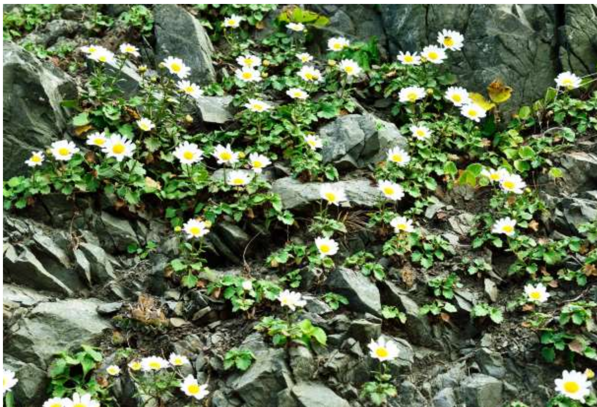
“Ko-hama-giku” Family: Asteraceae / キク科 キク属

茨城県以北の本州太平洋側岸と、北海道の太平洋岸に分布する日本固有の多年草で、海岸の崖や草地に群生することが多い。厚みのある葉は光沢があり、長さ幅とも1~4cmで5つに浅~中裂する。直径4~5cmの頭花は、筒状花の周りを舌状花が取り囲む典型的な菊の花だが、白い花卉が艶やかで心地よい。大きめの頭花と比べて草丈は10~30cmと低いし、艶のある葉と分岐の少ない茎との組み合わせも好ましい。また、岩場に群がって咲くのも美しく、一年の最後を飾る花ということもあって、遠出をしてでも毎年見に行きたくなる菊の名品だ。日本には海岸に咲くキク属が多くあるが、地域性の強いものが少なくない。道内でも太平洋側はコハマギク、日本海側はピレオギク、知床半島と根室半島にはチシマコハマギクと棲み分けているのが面白い。◇2011.11.05 えりも町