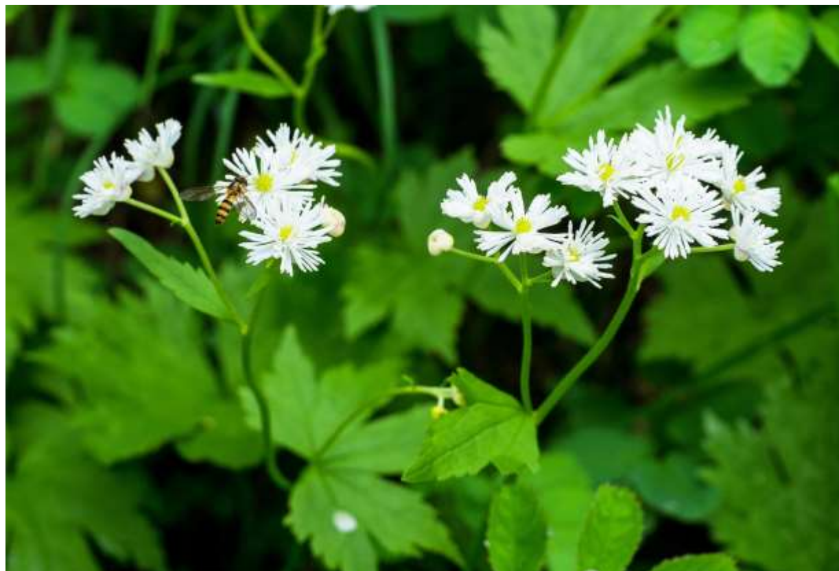
“Momiji-karamatsu” Family: Ranunculaceae / キンポウゲ科 モミジカラマツ属

千島列島南部から九州まで分布する草丈15～100cmの日本固有の多年草で、道内では山地帯～亜高山帯の湿ったところに生える。根生葉には長い柄があり、葉身は円形で径5～30cm。掌状に3～7深裂して、縁には粗い切れ込みと鋸歯がある。茎葉は無柄で大分小さい。茎頂に径1～1.5cmの白い花を沢山つけるが、萼片は開花直後に落ち、花弁も無くて白い雄しべが多数ある。モミジカラマツの花は単独ではどうと言うことはないが、大きくて形の良い葉は魅力的だ。あまり花に詳しくない頃は、開花前の群落を見てどんな花が咲くのだろうと期待したのだが、咲いてみればご覧の通りの目立たない花で少しがっかりしたものだった。しかし、本州では高山に咲く花であり、稜線にまとまって咲くところでは山岳写真の良い前景となる。◇2015.07.30 大雪山系黒岳