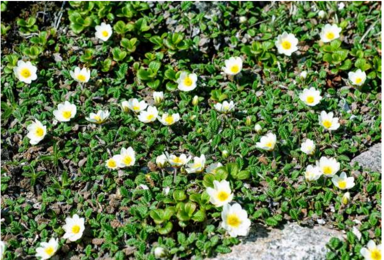
“Chonosuke-sou” Family: Rosaceae / バラ科 チョウノスケソウ属

高さ5~10cmほどになる高山性小低木で、マット状に広がる小判形の葉と、径3cm以上にもなる白い8弁花のコントラストは印象的だ。より細めの葉を持つ基準変種の方は、北半球高緯度地方に普遍的だが、この変種は北東アジアだけに分布する。最終氷期以降の地球温暖化の進行過程で一時的寒冷期（ヤンガードリアス期）があり、その名前は本種の属名（ドリラス）から来ているので、地球科学者には特別な想いのある花である。この変種の和名は、ロシア人植物学者マキシモビッチの植物採取助手だった須川長之助にちなみ、牧野富太郎が命名した。。長之助がタイプ標本を採取した立山では、小さな群落が一カ所に残るだけだが、大雪山には数が多いし、日本アルプスや八ヶ岳にも多くの群落が健在なのはうれしい限りである。◇2007.07.08 大雪山系小泉岳