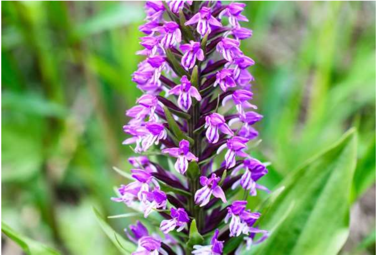
“Nobine-chidori” Family: Orchidaceae / ラン科 ノビネチドリ属

四国、中部地方以北の日本列島と、朝鮮半島から極東ロシアまで分布する大型のランで、草丈は25～60cmになる。群生することは少ないが道内では数の多いランで、海岸地帯から亜高山までの林縁や道端に咲いている。花のよく似たテガタチドリ (B:p.201) との大きな違いは葉の形で、テガタチドリの葉が広線形なのに対して、ノビネチドリの葉は長楕円形で長さが7～15cmあり、目立つ葉脈と波打つ縁が特徴である。茎頂に穂状花序をだし、幅1cm以下の小さな花が密に沢山つく。唇弁には白い筋があって先が3裂し、距は短い。花色は赤紫のものが多いが濃淡様々で、白色の花も結構多い。全体の大きさに比べて随分と小さな花だが、可愛い小鳥のような花がびっしりと並んでおり、チドリと呼ばれる日本のランの中ではピカイチの美しい花といえよう。◇2012.06.29 札幌市、滝野