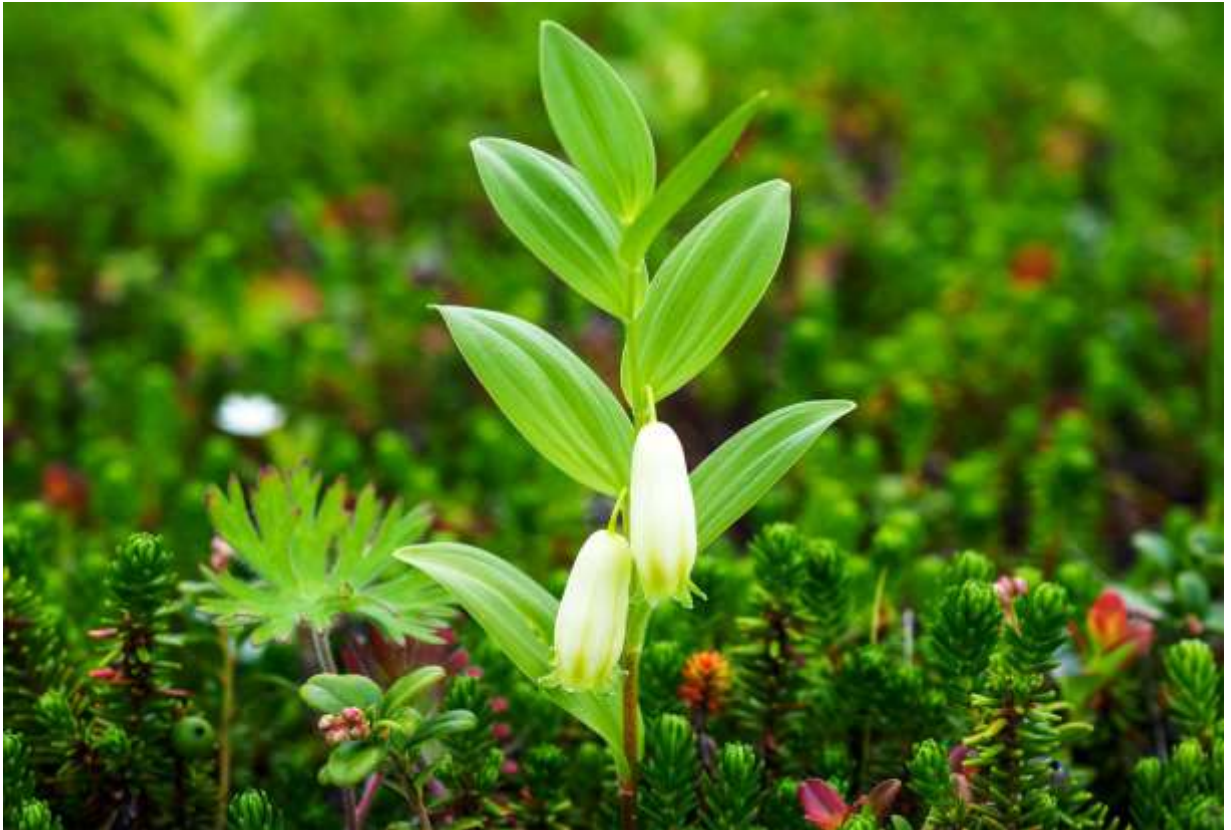
“Hime-izui” Family: Asparagaceae / クサスギカズラ科 アマドコロ属

朝鮮半島からシベリアまでの海岸砂地や山地の草地に生える多年草で、国内では九州と中部地方以北に隔離分布し、日当たりの良い所に生える。生えている環境によって草丈は10～45cmと変化し、風の強い海岸砂地の個体は極端に小さい。葉は長楕円形で互生し、長さは4～7cmほどで葉脈がはっきりしており、艶があって美しい。花は葉脇から1個ずつ垂れ下がるが、横向に咲くものもある。筒状の花は緑白色で長さ15～18mm、先端部は緑色で浅く6裂し、裂片は反り返る。この花は花色が地味で美しいというよりは可愛いらしい。特に、海岸砂地に生える小さい株の場合は、草丈に不釣り合いなほど大きな花を何個か下垂する様子が何とも面白く、海岸植物の中でのペット的存在だ。ちなみに、和名のイズイはアマドコロの漢名だそうだ。◇2018.06.22 豊北原生花園、豊頃町