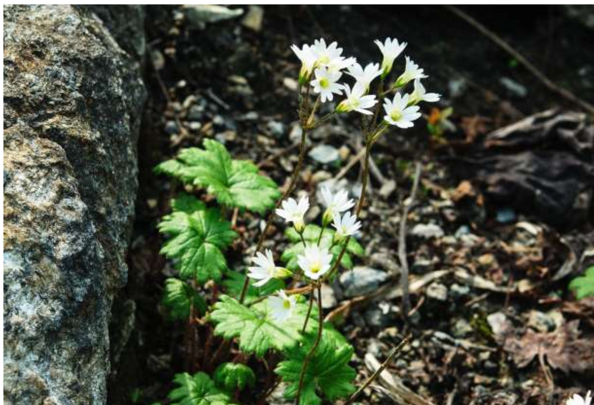
“Teshio-kozakura” Family: Primulaceae / サクラソウ科 サクラソウ属

日本固有の白い花のサクラソウ属で、草丈15-20cmの多年草。生育地が道北の蛇紋岩と石灰岩地帯に限定されており、絶滅危惧I類でないのが不思議な気がする。もっとも、生育地は限られているが、生えているところでは結構多くの株があるのでII類で納得すべきかな。カエデ形の葉は同じく超塩基性岩地帯に生えるヒダカイワザクラ(p.42)と似ているが、こちらの方は表面に短毛があり艶もない点で区別が付く。ヒダカイワザクラにも白花はあるが、花の形は本種とは大きく異なっており、前者が大きめの花を平開するのに対し、テシオコザクラの花は漏斗状に開いて花冠の計は15mmほど。しかし、同じ地質を好む両者は近縁関係にあるようで、人工的な栽培環境下で自然交配して生まれたハイブリッド株が、赤花テシオコザクラという名で売られている。◇2009.05.30 幌延町、北大天塩研究林