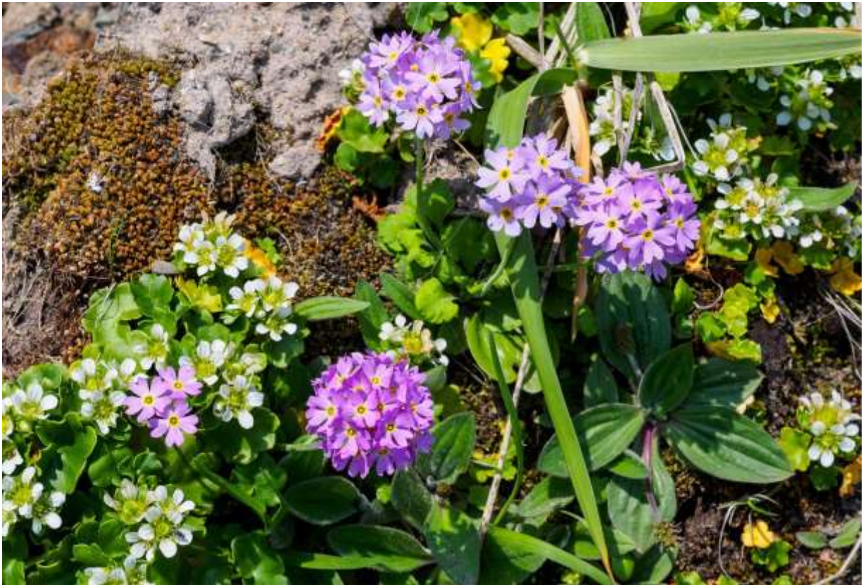
“Yukiwari-kozakura” Family: Primulaceae / サクラソウ科 サクラソウ属

東北地方以南に分布するユキワリソウには3つの変種があり、その全てが道内に自生する。変種ユキワリコザクラは道内の太平洋側に分布し、海岸～山地帯の湿った草地や岩礫地に生えて、草丈は7～15cm。根生葉は広卵形で基部は細まり、明瞭な葉柄となる。葉縁には不明瞭な鋸歯があり、裏側に巻き込むことが多い。直立する花茎の先に淡紅色の花を2～10個つけるが、花冠は5裂して径1.5cmほどにほぼ平開し、裂片の先は2裂する。変種レブンコザクラは花序が球形になるのが特徴だが、普通は散形花序のユキワリコザクラにも、写真の様に球形の花序をつけるものがある美しい。かつては大きな群落が多かった根室半島も、今では小規模群落が海岸の岩場に残るのみ。それでも、海中に直接落ち込む岩壁で咲き誇るこの花に、斜光線が差し込む風景は神々しい。◇2018.06.03 根室市