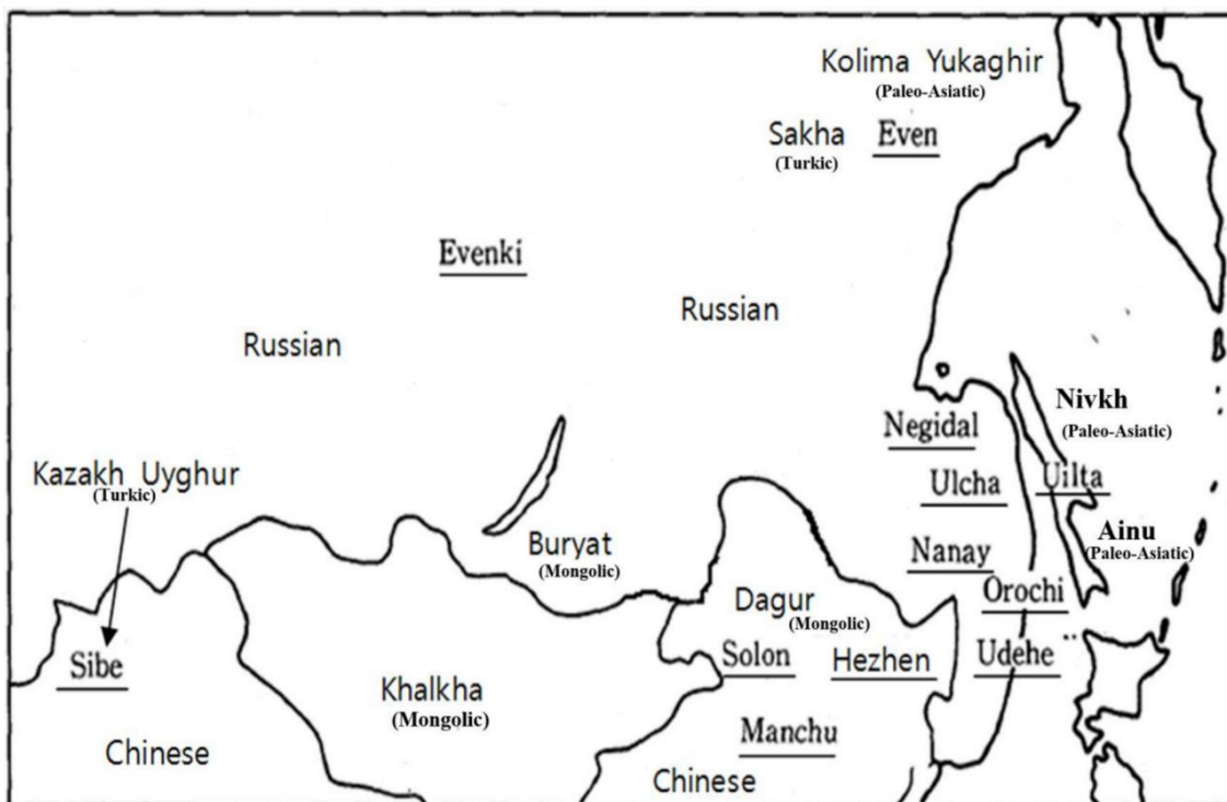
図 1. ツングース諸語（下線標示）と周辺言語の分布（Tsumagari 1997 に基づき、筆者改変）

ツングース諸語は、上記の図 1 で示すように、ロシア（東シベリア、アムール川流域、沿海州、サハリン）と中国（東北地方、新疆ウイグル自治区）にまたがって分布する同系の言語群を指す。このようにロシア領と中国領の広い範囲にかけて話されるツングース諸語は、ユカギール語、チュルク諸語、モンゴル諸語、ニヴフ語、アイヌ語、ロシア語、中国語等、系統関係が不明または異なる多くの言語と隣接していることから、言語接触の可能性が指摘されてきた。