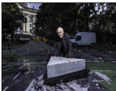
(図 6) 建設現場に立つ設計者カラヴァン