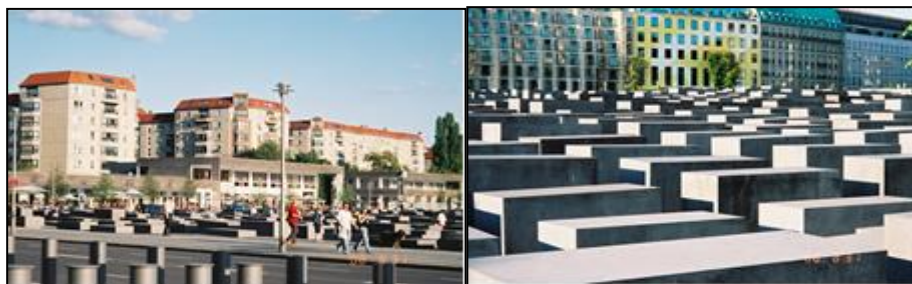
（図2）「殺害されたヨーロッパ・ユダヤ人に捧げる警鐘碑」

警鐘碑の造形について見ていくと、2度のコンペの末、1997年に採択されたのは、「建築家ピーター・アイゼンマンと彫刻家リチャード・セラの共同設計 527 」案であった 528 。香川（2012）によると、それは、「コンクリートの直方体を敷地前面に並べたもの」であり、完成した2,711本の石柱は、「少しずつ高さを変え、約1メートルの間隔をおいて規則的に並ぶが、よく見るとそれぞれわずかな角度で傾いている 529 。」案内書『Holocaust Memorial Berlin』（2008）によると、石柱群は中心部に進むほど視界が遮られる造形となっており、天候によりその表情を変える 530 。