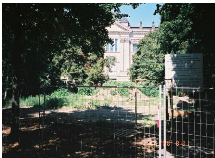
(図 5) 国会議事堂南側に設置した標識板