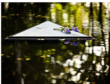
(図4) 御影石に置かれた一輪の花

出典：Denkmal für die im Nationalsozialismus ermordeten Sinti und Roma Europas “ARCHITEKT DANI KARAVAN”