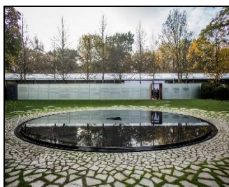
(図7) 完成した「殺害されたヨーロッパのスインティとロマに捧げる警鐘碑」