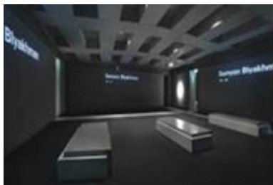
(図3) 情報センター内の「名前の部屋」