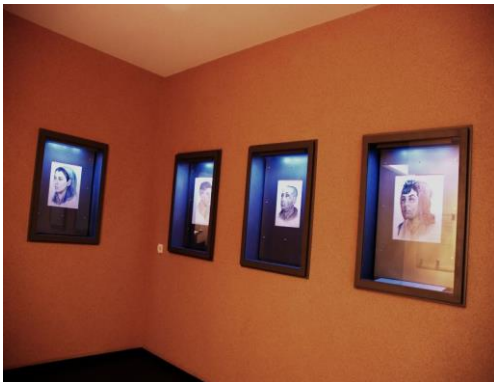
（図1）ディーナが描いた水彩画