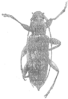
Fig. 1. \times \frac{2}{3}

nach hinten feiner, hinter der Mitte sehr fein und schwach punktiert, jeder Punkt trägt ein borstenartiges gelbgraues Haar, Spitze der Decken abgerundet. Unterseite des Körpers mit grauen Härchen dicht besetzt. Schenkel spindelförmig stark verdickt, Schienen nicht gekielt. Länge: 17 mm.