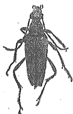
Fig. 4. Strangalia doi MATSUSH. (♀) × \frac{10}{7}

♀. Schwarz, Scheibe des Prothorax rot, Flügeldecken gelb. Kopf ziemlich grob und dicht punktiert, mit langen, abstehenden, schwarzen Haaren spärlich besetzt. Fühler schwarz, 2. und 3. Glied schmutziggelb gefärbt. Scheibe des Prothorax rot, aber am Vorder- und Hinterrand schwarz; grob, dicht punktiert, abstehend, gelb behaart, vor der Basis mit einer in der Mitte nicht unter-