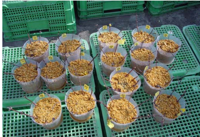
ポットに挿した穂