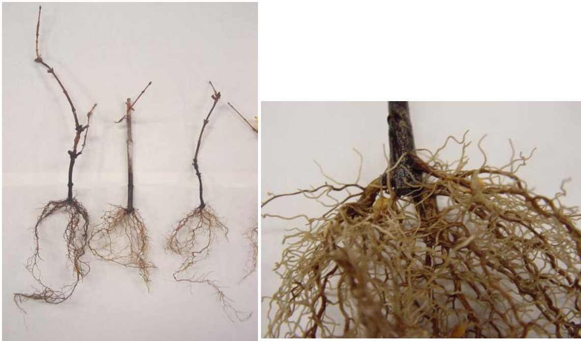
図7. 挿し木培養したハスカップの発根の様子