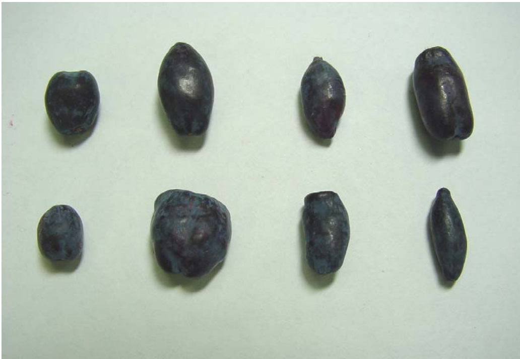
図 1. 系統間における果実の形態の差異