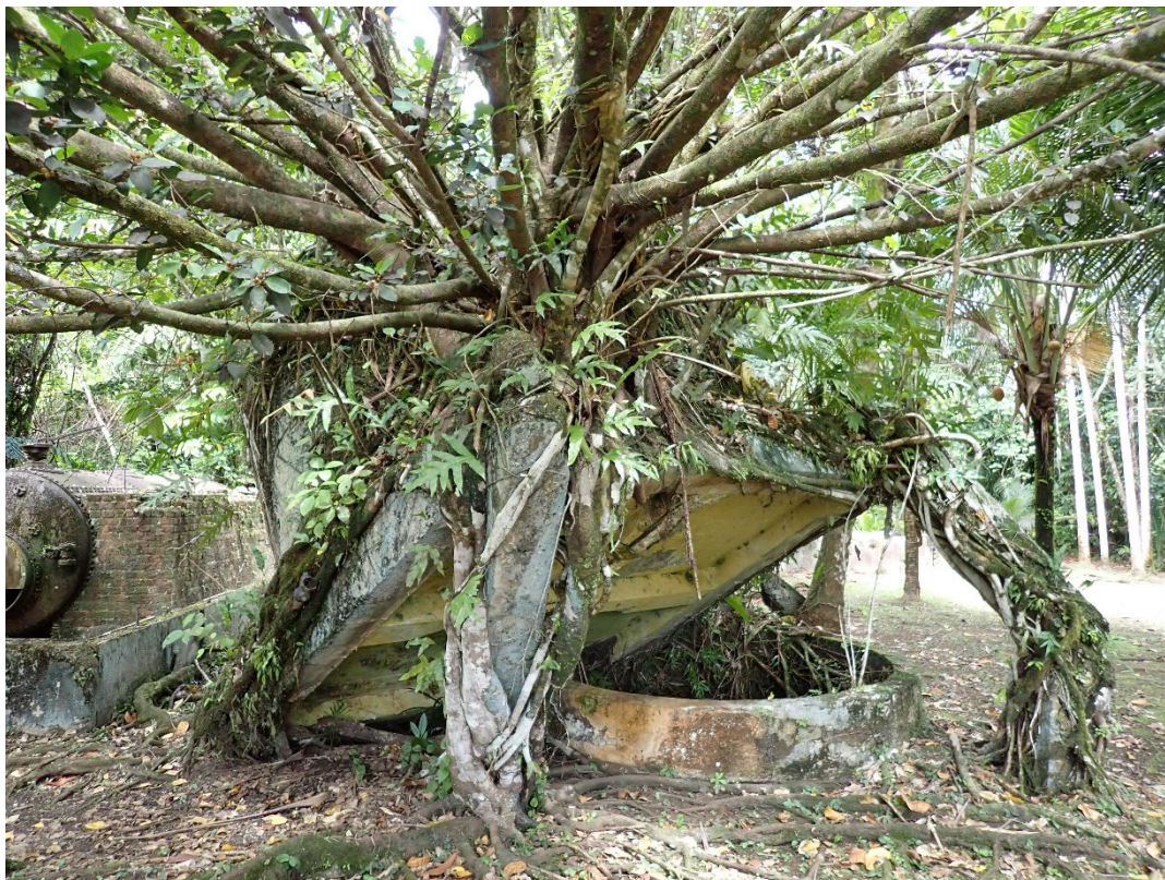
写真 10 ジャングルに飲み込まれつつある南拓鳳梨／朝日村農園施設群の遺構

撮影地点：北緯 7.525522°, 東経 134.548095° 付近。2026 年 3 月 28 日 10 時 46 分。