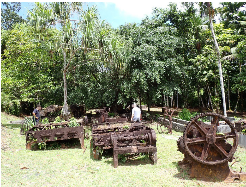
写真 6 南拓鳳梨／朝日村農園施設群の遺構を見学する旅行者

筆者が現地を訪れた際は、オーストラリアから来た3人組の旅行者が熱心に遺構を見学していた。 撮影地点：北緯 7.525472°，東経 134.548223°付近。2026年3月28日10時48分、筆者撮影。