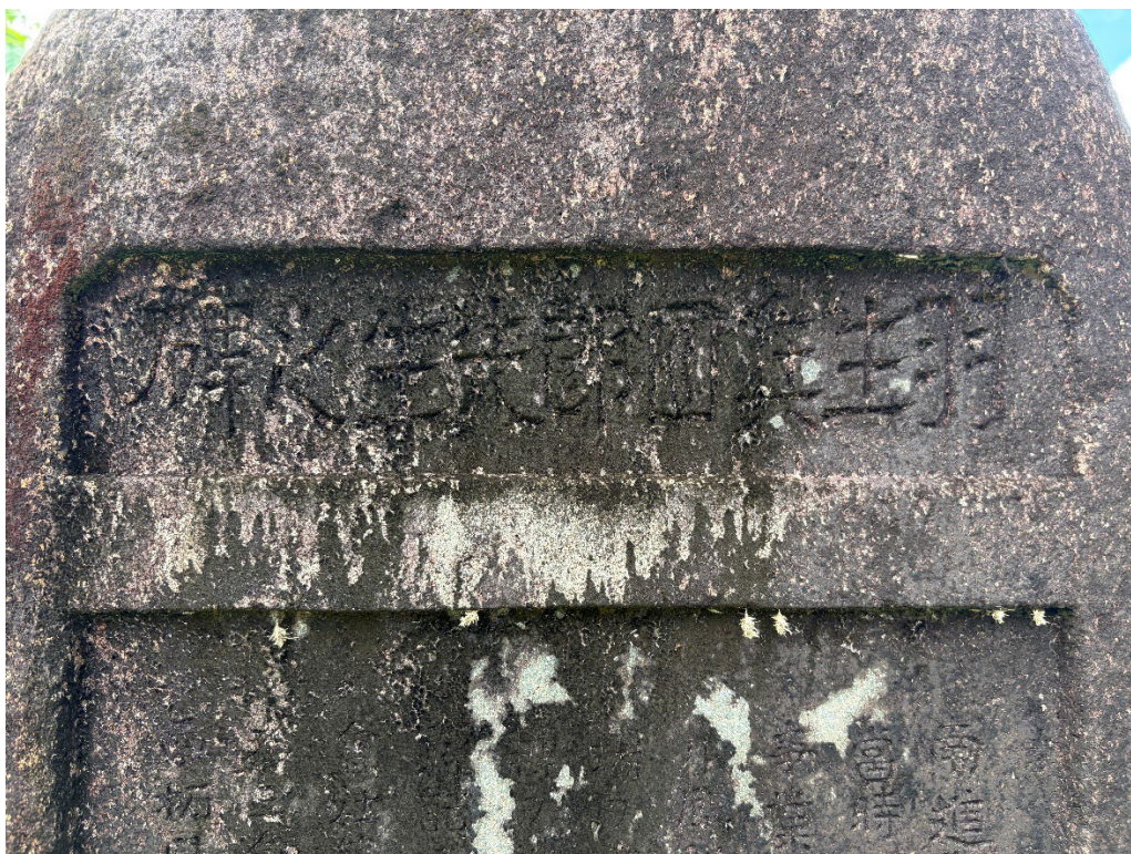
写真 15 「羽生兵四郎先生之碑」の題字

撮影地点：北緯 7.525361°，東経 134.547669°付近。2026 年 3 月 28 日 10 時 57 分、筆者撮影。