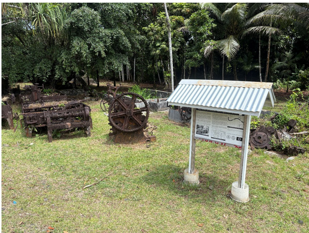
写真 5 南拓鳳梨／朝日村農園施設群の解説版 撮影地点：北緯 7.525397°，東経 134.548233°付近。2026 年 3 月 28 日 10 時 42 分