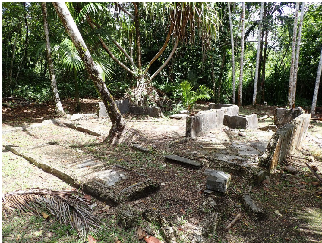
写真 11 ジャングルに飲み込まれつつある南拓鳳梨／朝日村農園施設群の遺構

撮影地点：北緯 7.525522°, 東経 134.548095° 付近。2026 年 3 月 28 日 10 時 46 分、筆者撮影。