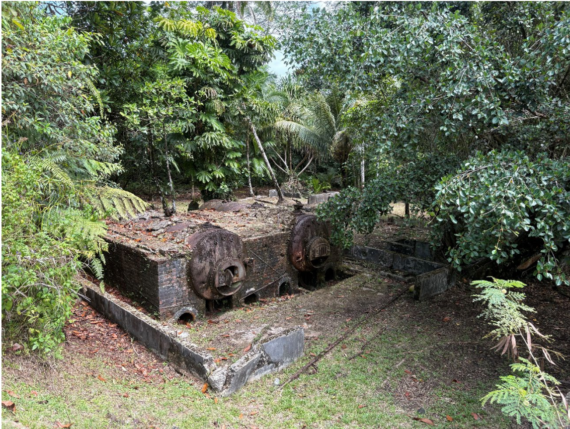
写真 1 ジャングルに残る日本時代の朝日村農園施設群の炉

この煉瓦と鉄からなる構造物について、現地解説看板は、“Nan Taku Hori or the Asahi Plantation complex” (南拓鳳梨／朝日村農園施設群) に関連する工業用炉 (kiln) として位置づけている。