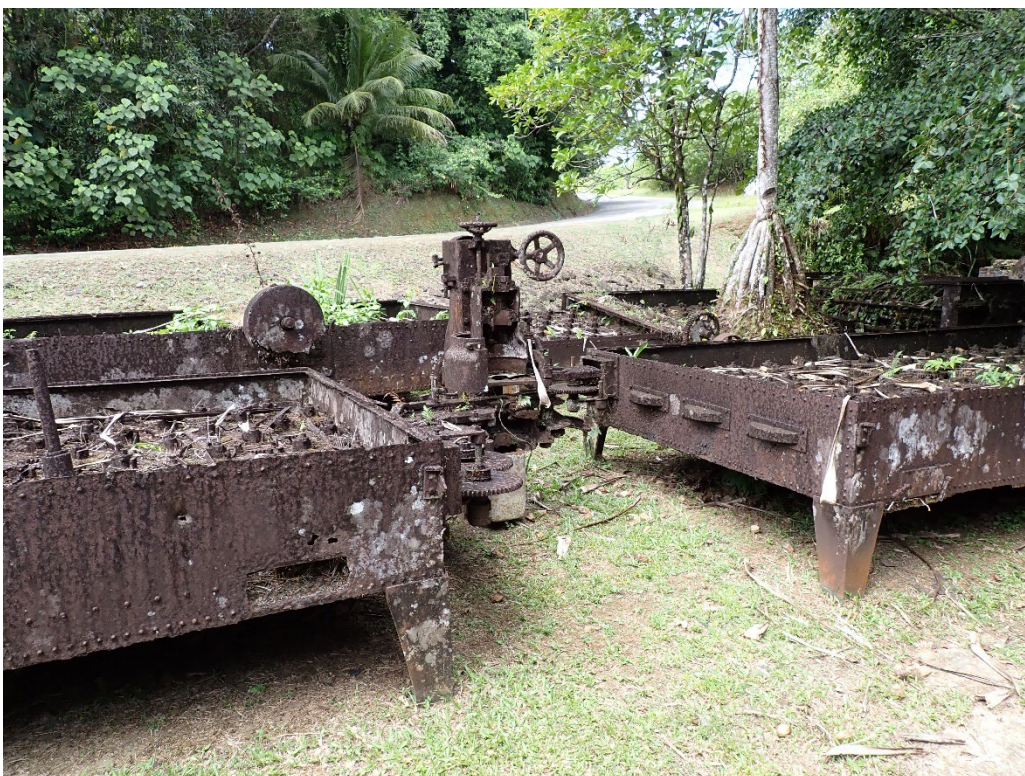
写真 7 南拓鳳梨／朝日村農園施設群の遺構

筆者が現地を訪れた際は、オーストラリアから来た3人組の旅行者が熱心に遺構を見学していた。 撮影地点：北緯 7.525472°，東経 134.548223°付近。2026年3月28日10時48分、筆者撮影。