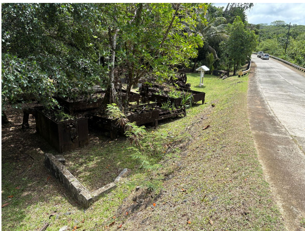
写真 4 ジャングルの縁に残る南拓鳳梨／朝日村農園施設群の遺構と解説版 撮影地点：北緯 7.525456°，東経 134.548003°付近。2026 年 3 月 28 日 10 時 41 分、筆者撮影。