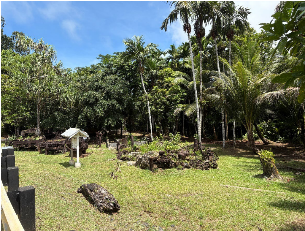
写真 2 ジャングルの中に点在する、さび付いた鉄と苔むした煉瓦、コンクリート基礎 撮影地点：北緯 7.525364°，東経 134.548325°付近（パラオ共和国バベルダオブ島アルモノグイ州）。2026 年 3 月 28 日 10 時 51 分、筆者撮影。