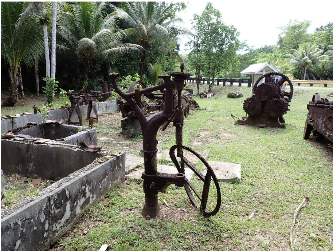
写真 9 南拓鳳梨／朝日村農園施設群の遺構

撮影地点：北緯 7.525523°，東経 134.548068°付近。2026 年 3 月 28 日 10 時 46 分、筆者撮影。