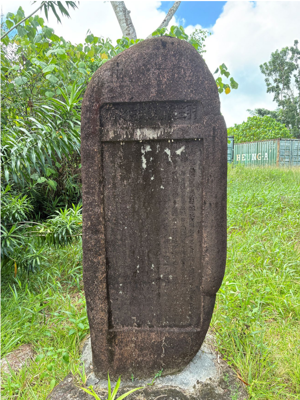
写真 16 「羽生兵四郎先生之碑」表面全体の様子

撮影地点：北緯 7.525230°，東経 134.547606°付近。2026 年 3 月 28 日 10 時 54 分、筆者撮影。