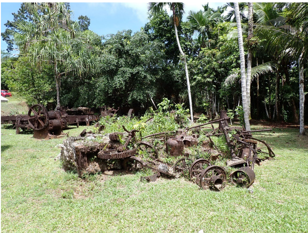
写真 3 ジャングルの中に点在する、さび付いた鉄と苔むした煉瓦、コンクリート基礎 撮影地点：北緯 7.525393°，東経 134.548325°付近。2026 年 3 月 28 日 10 時 43 分、筆者撮影。