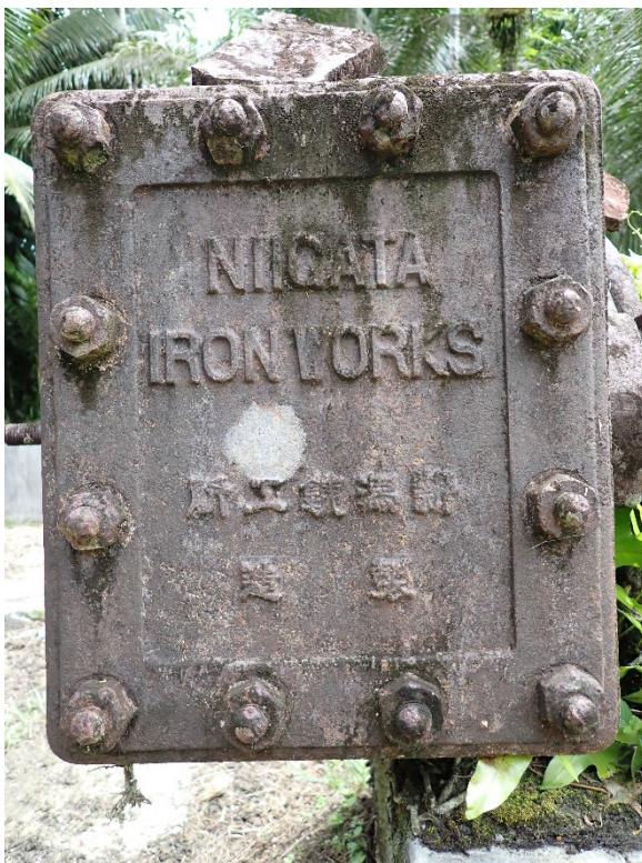
写真 13 南拓鳳梨／朝日村農園施設群の遺構に残る文字景観

撮影地点：北緯 7.525525°，東経 134.548048°付近。2026 年 3 月 28 日 10 時 46 分、筆者撮影。