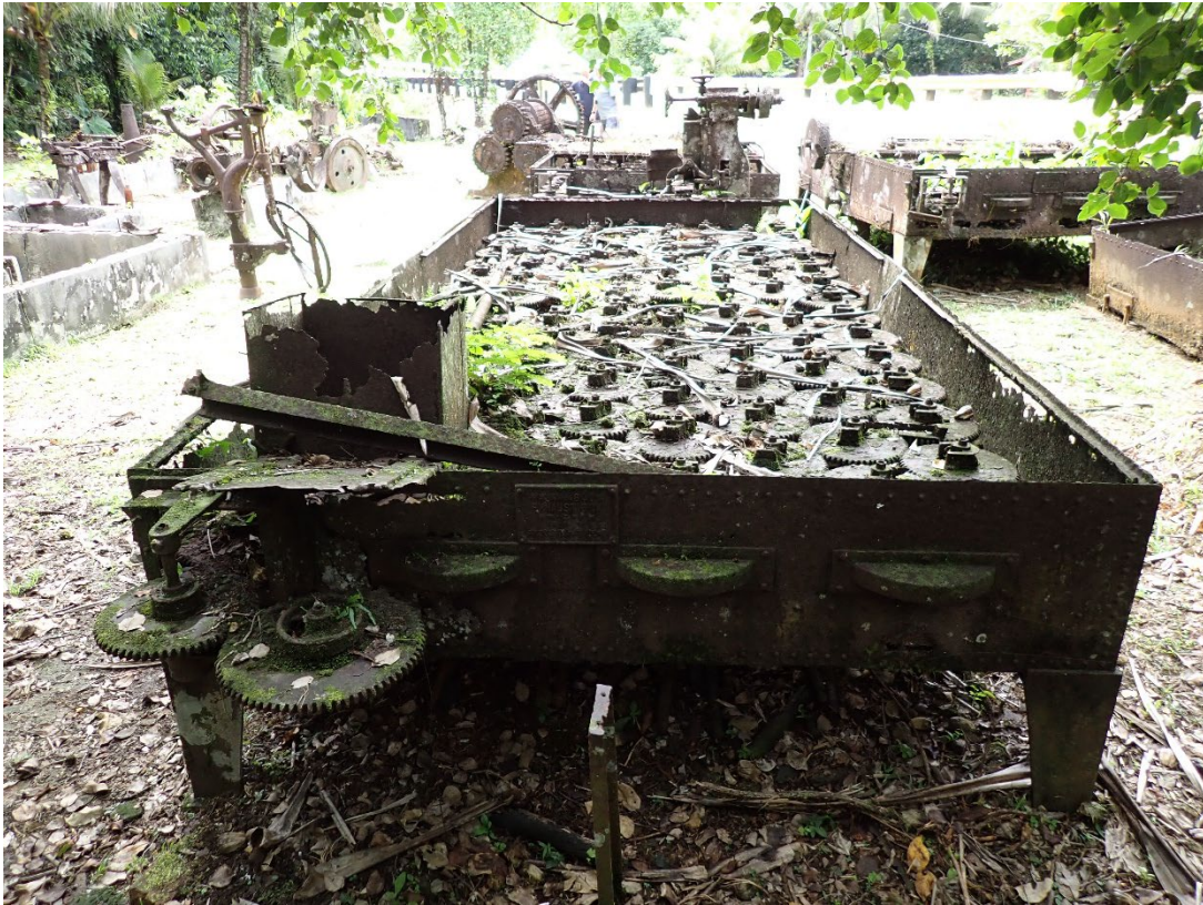
写真 8 南拓鳳梨／朝日村農園施設群の遺構

撮影地点：北緯 7.525523°，東経 134.548068°付近。2026 年 3 月 28 日 10 時 46 分。