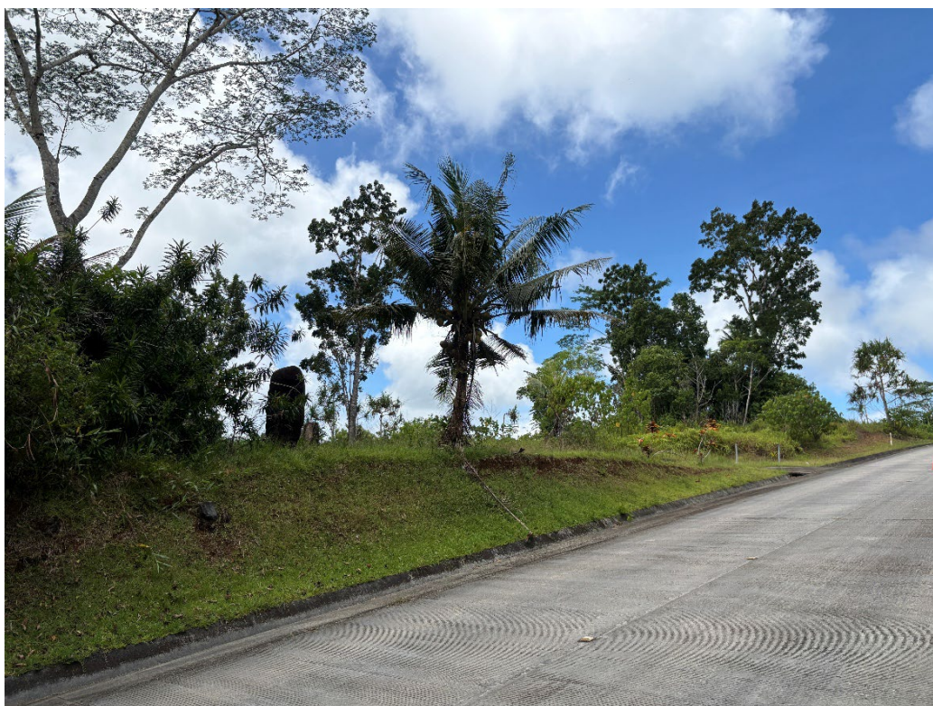
写真 14 「羽生兵四郎先生之碑」