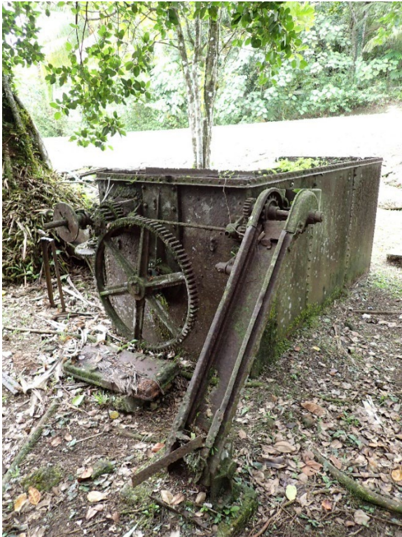
写真 12 南拓鳳梨／朝日村農園施設群の遺構

撮影地点：北緯 7.525525°，東経 134.548048°付近。2026 年 3 月 28 日 10 時 46 分。